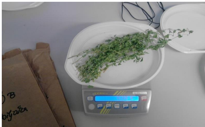
Slika 3. Određivanje ukupne mase stabljike i lista

zajedno i te uzorke odlagali u posebne papirnate vrećice kako bi dobili komponente prinosa.