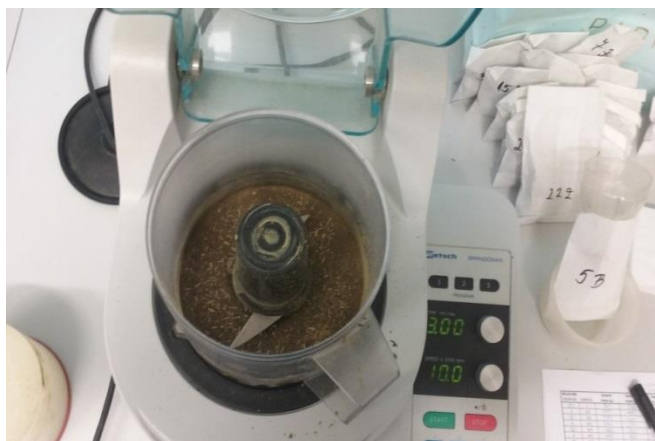
Slika 4. Usitnjavanje uzoraka lucerne u heavy metal free mlinu

Biljni materijal smo samljeli u „heavy metal free“ mlinu za daljnje analize teških metala (Slika 4.) Postupak usitnjavanja traje tri minute i ako nije dovoljno usitnjen vrijeme se usitnjavanja se produžuje. Uzorak mora biti dobro usitnjen gotovo praškast kako bi mogao dalje na obradu.