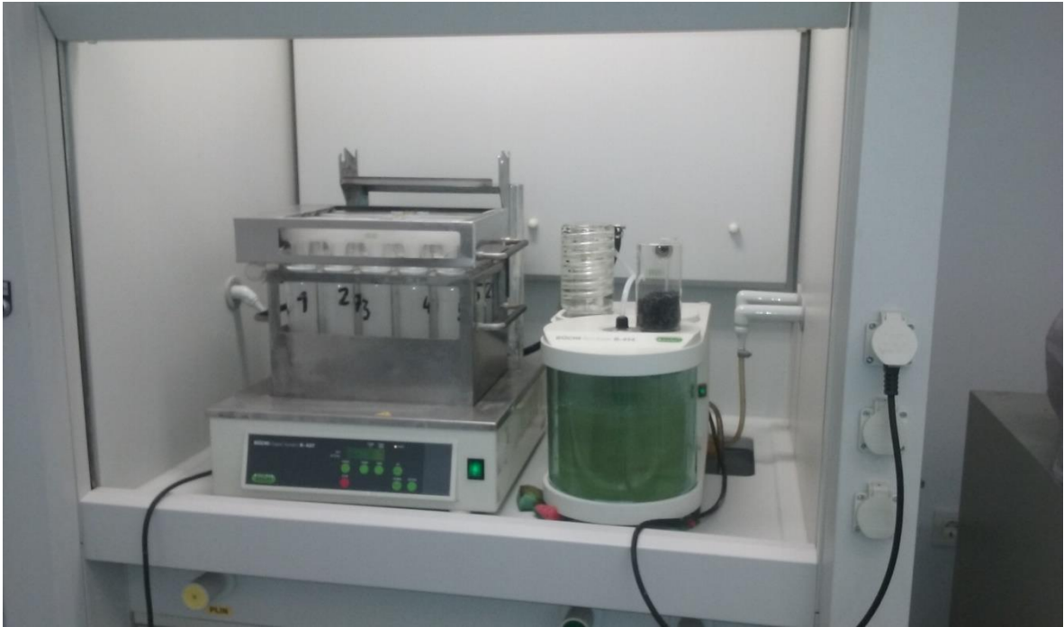
Slika 5. Razaranje uzoraka lucerne

te u svaku oprezno dodati 5ml vodikovog peroksida i zagrijavati. Temperaturu treba pratiti jer ne smije prijeći 400°C odvagati 0,5g ili 1,0g suhe biljne tvari prenijeti u kivetu za razaranje. Uzorku dodati 5ml smjese kiseline i sačekati da biljna tvar upije kiselinu. Kivete postaviti u blok za razaranje te u svaku oprezno dodati 5ml vodikovog peroksida i zagrijavati. Temperaturu treba pratiti jer ne smije prijeći 400 °C. Digestija traje 30minuta, odnosno dok sadržaj ne postane bistar bez organske tvari.