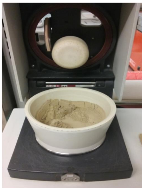
Slika 2. Uzorak tla iz heavy metal free mlina

Uzorak tla za analize teških metala u tlu morali smo samljjeti u heavy metal free mlinu (Slika 5.) kako uzorak ne bi kontaminirali. Ukupna koncentracija teških metala se određuje tako što su uzorci tla razoreni zlatotopkom ( 1/3\text{ HNO}_3 + 2/3\text{ HCl} ), propisanom metodom (ISO,1995B), prema kojoj je uzorak tla prenesen u teflonsku kivetu i preliiven s 12 ml svježe pripremljene zlatotopke. Nakon razaranja obavljena je filtracija u odmjerene tikvice, koje su potom nadopunjene destiliranom vodom do volumena 100 ml. Koncentracije teških metala mjerene su u ekstraktima tla direktno na induktivno spregnutoj plazmi optičkom emisijskom spektrokemijom (IPC-OES) i izražene u \text{mg kg}^{-1} tla.