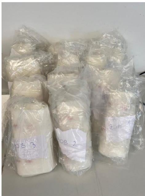
Slika 3. Sjemenke žitarica zamotane u filter papir i stavljene u PVC vrećice

Nakon postavljanja sjemenki, filter papir je zamotan te stavljen u PVC vrećicu, a u svaku vrećicu je stavljen papirić s oznakom žitarice i određenog ponavljanja (Slika 3.). Nakon toga klijanci su stavljeni u klima komoru na određenu temperaturu (Slika 4.).