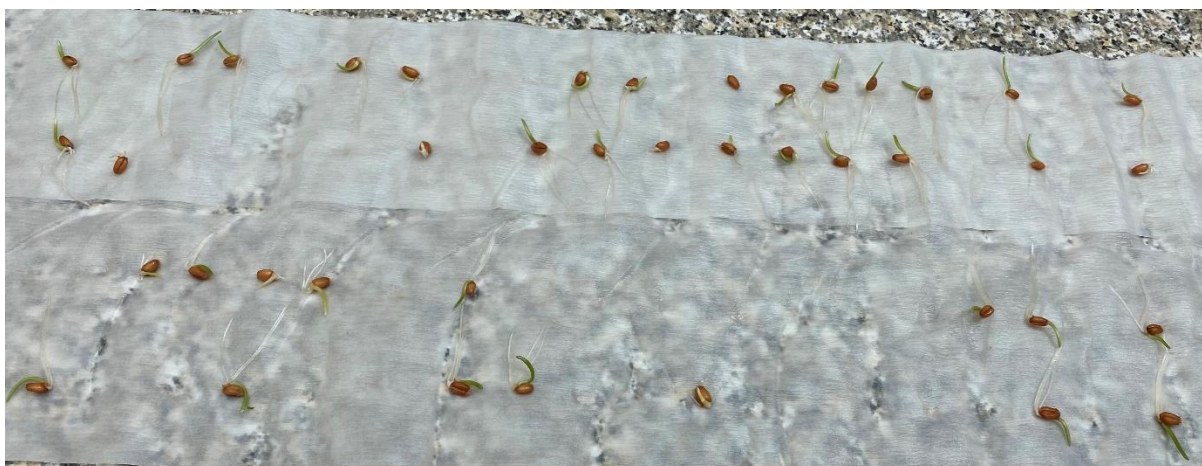
Slika 5. Mjerenje energije klijanja sjemena pšenice

Nakon 4 dana u prostorijama Fakulteta agrobiotehničkih znanosti Osijek izmjerena je energija klijanja za sve tretmane i ponavljanja (Slika 5.). Energija klijanja je određena vizualnim putem na način da se gledao razvoj korijena i klice svakog sjemena.