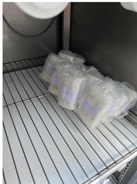
Slika 4. Klijanci pšenice, ječma, raži i zobi u klima komori

Nakon 4 dana u prostorijama Fakulteta agrobiotehničkih znanosti Osijek izmjerena je energija klijanja za sve tretmane i ponavljanja (Slika 5.). Energija klijanja je određena vizualnim putem na način da se gledao razvoj korijena i klice svakog sjemena.