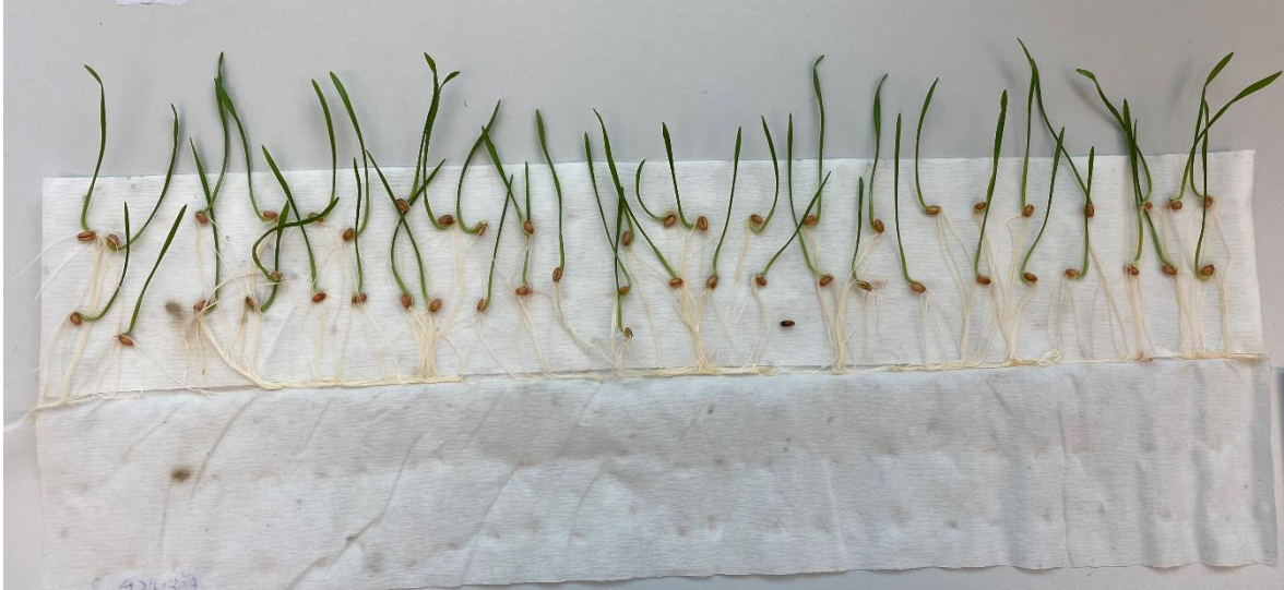
Slika 6. Mjerenje različitih morfoloških svojstava na klijanju pšenice pri temperaturi 10°C

Nakon 8 dana od početka postavljanja pokusa, u laboratoriju na fakultetu provedeno je mjerenje morfoloških svojstava biljke: broj korijena, dužina korijena (cm), dužina koleoptile (cm), dužina izdanka (cm), svježa masa (g), suha masa (g) i ukupno klijanje pšenice, ječma, raži i zobi za svako ponavljanje posebno (Slika 6. i Slika 7.).