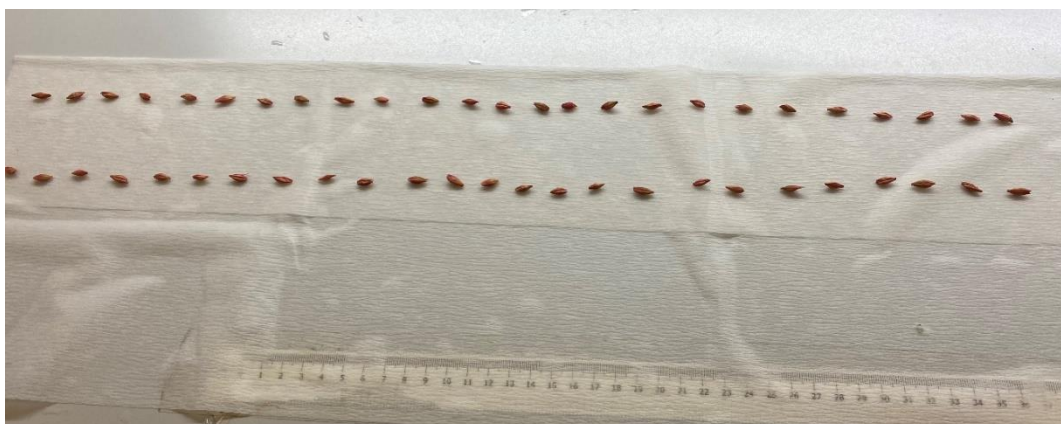
Slika 2. Sjemenke ječma na filter papiru

Pokus se provodio tako što se nakon vlaženja filter papira, 50 sjemenki svake žitarice (pšenice, ječma, raži i zobi) postavljalo na filter papir u 3 ponavljanja za svaku žitaricu i temperaturu posebno (Slika 2.).