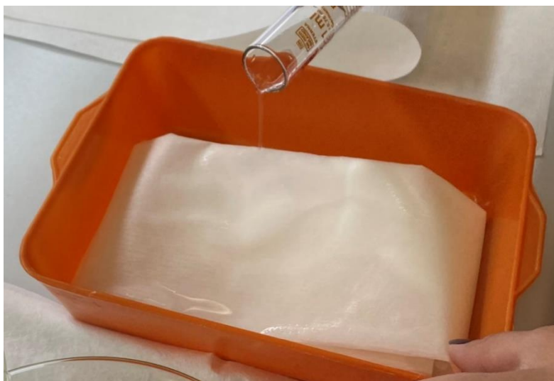
Slika 1. Vlaženje filter papira s destiliranom vodom

Pokus se provodio na Fakultetu agrobiotehničkih znanosti Osijek tijekom lipnja i srpnja 2022. godine u Laboratoriju za specijalno ratarstvo. U istraživanju se ispitalo klijanje sjemena pšenice, ječma, raži i zobi na temperaturama od 10°C i 20°C. Prvi korak u postavljanju pokusa bilo je vlaženje filter papira s 50 ml destilirane vode (Slika 1.).