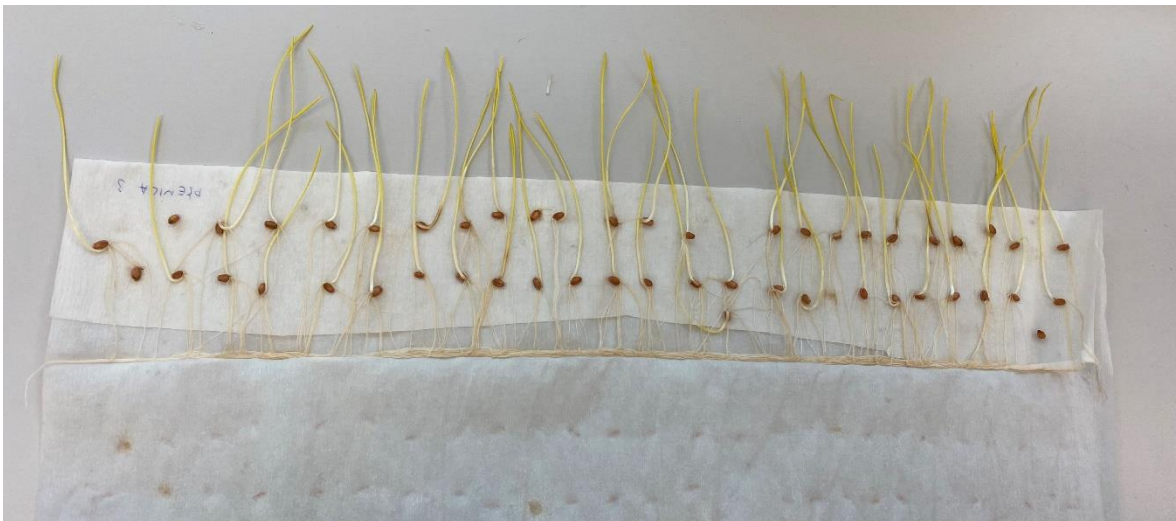
Slika 7. Mjerenje različitih morfoloških svojstava na klijanju pšenice pri temperaturi 20°C

Nakon morfoloških mjerenja uz pomoć precizne laboratorijske vage sa dva decimalna mjesta određena je svježa masa svih tretmana i ponavljanja posebno (Slika 8. i Slika 9.) nakon čega su ostavljeni na zraku da se osuše. Zrakosuhi uzorci su prije vaganja suhe mase dodatno osušeni u sušioniku na 105 °C u trajanju 3 sata (Slika 10.).