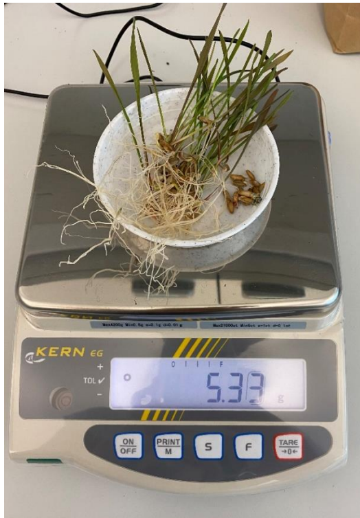
Slika 8. Mjerenje svježe mase raži pri temperaturi od 10°C