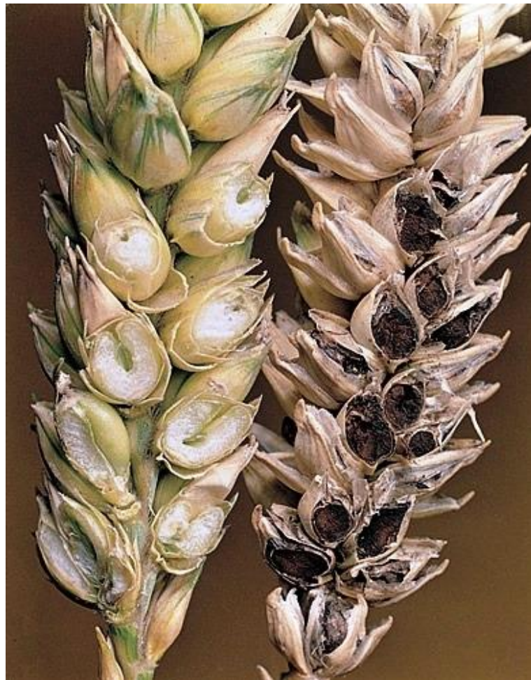
Slika 10. Simptomi zaraze Tilletia caries na klasu pšenice (izvor:

Tilletia laevis . Teliospore kod Tilletia tritici imaju ornamentiranu površinu i svjetlo žute do smeđe-crvene su boje, a za Tilletia laevis karakteristična je glatka površina teliospora i maslinasta boja. Naziv bolesti potječe od neugodnog mirisa po smrdljivoj ribi, koji potječe od spoja trimetilamina kojega sadrže teliospore. Obje gljive napadaju pšenicu, ječam, raž, tritikale, trave i travnate korove. Pojava bolesti ima negativan utjecaj na prinose žitarica. U Hrvatskoj su najveće štete zabilježene 2000. godine kada je bolest uništila 1 400 tona pšenice. Brašno koje se proizvelo od zaražene pšenice poprimilo je neugodan miris pokvarene ribe, a životinje koje su ga konzumirale kao posljedicu su imale razne zdravstvene poremećaje (Sever i Cvjetković 2012.). Prvi simptomi zaraze uočavaju se tek u fazi klasanja, promjene koje se javljaju ranije nisu specifične i teško ih je uočiti u usjevu. Zaraženi su svi klasovi jednog busa, rijetka je pojava da pojedina zrna izbjegnu zarazu.