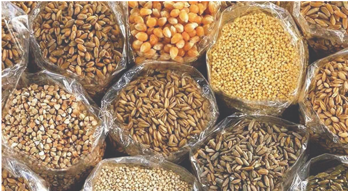
Slika 1. Sjeme žitarica