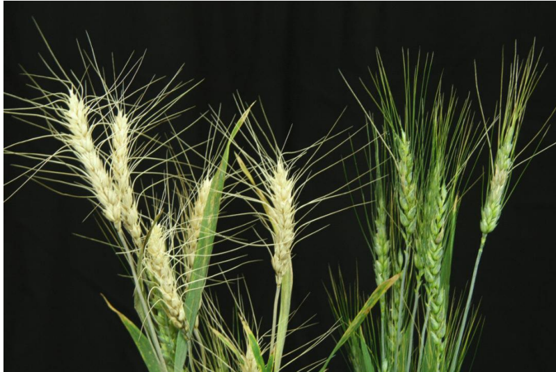
Slika 7. Simptomi zaraze Fusarium head blight na pšenici

Na polju se simptomi najbolje uočavaju u fazi mliječne zriobe, u vidu slamnato žute boje bolesnih dijelova klasa i narančastih sporodohija formiranih na bazi klasića. Sporodohije se sastoje od konidija i konidiofora. Navedeni simptomi za posljedicu imaju smanjen broj i masu zrna, dolazi do razgradnje granula škroba i uskladištenog proteina kao i staničnih stijenki (Ćosić i sur., 2013.).