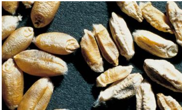
Slika 8. Simptomi zaraze Fusarium spp. na zrnju pšenice