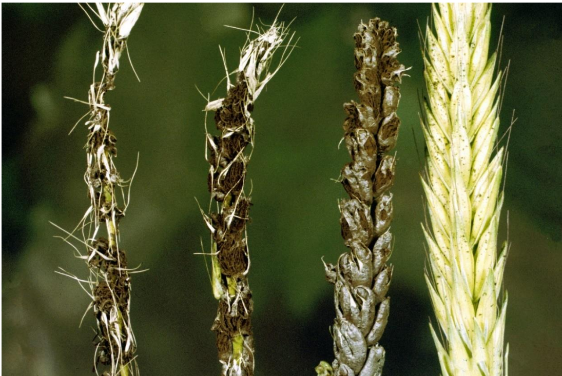
Slika 13. Simptomi zaraze Ustilago nuda na pšenici

Spore prašne snijeti šire se putem zaraženog sjemena, a unutar njega se nalazi micelij. Teliospore su okrugle i smeđe su boje i zarazu mogu izvršiti isključivo u vrijeme cvatnje ječma pa sve do mliječne zriobe. Sporama odgovara vlažno, oblačno i hladno vrijeme s temperaturama od 16-22 °C. Optimalni uvjeti za klijanje teliospora su relativna vlaga zraka 95 % i temperature 20-25 °C (Dean, 1969.). Aktivnost micelija koji se nalazi unutar sjemenke u obliku gema raste počekom klijanja. Unutar klice ili neposredno uz nju dolazi do intenzivnog dijeljenja stanica micelija. Zaražena sjemenka zadržava zdrav izgled sve do trenutka formiranja klasova ječma. Tijekom klasanja dolazi do transformacije i fragmentacije micelija uslijed čega nastaje velik broj teliospora. Posljedično svi dijelovi klasa osim klasnog vretena bivaju razoreni i pretvoreni u crnu praškastu masu. Zaražene biljke klasaju desetak dana ranije od zdravih što omogućava teliosporama sazrijevanje do faze cvatnje nezaraženih biljaka. U vrijeme cvatnje zdravih biljaka dolazi do zaraze.