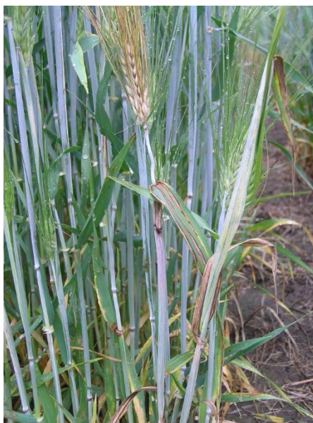
Slika 14. Simptomi zaraze Pyrenophora graminea

Razvoju bolesti pogoduje hladno vrijeme početkom vegetacijske sezone. Zaraza zrna ječma moguća je tijekom cijele vegetacije do mliječne zriobe. Prugavost lista ječma prenosi se isključivo zaraženim sjemenom te je stoga osnovna mjera zaštite sjetva zdravog, certificiranog sjemena.