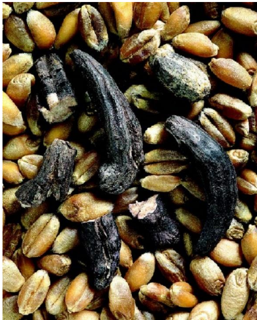
Slika 4. Simptomi zaraze Claviceps purpurea na sjemenu

Ergotizam nije više tako česta pojava kod ljudi iako se i dalje javljaju slučajevi neobjašnjivog trovanja, ali je zato od velike ekonomske važnosti u slučaju izazivanja bolesti kod životinja. Zaraženo zrno koje sadrži više od 0,3% sklerocija može uzrokovati ergotizam, te se kao takvo ne smije prodavati u svrhu prehrane ljudi. Kako bi se ispunili svi zakonski standardi potrebno je ukloniti sve sklerocije što je vrlo skupo i mukotrpno, te zbog toga mnoge siromašne zemlje i dalje imaju sklerocije u tragovima u hrani za životinje. Tragovi sklerocija su često otrovni za stoku i mogu dovesti do zatajenja reproduktivnih organa ili gangrene perifernih dijelova (Haarmann i sur., 2009.).