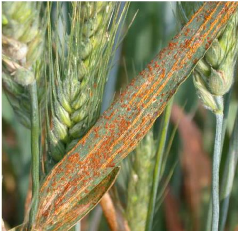
Slika 17. Simptomi zaraze Puccinia striiformis

nekog reda razbacani po listovima pšenice. Simptomi su prvo vidljivi na donjim listovima, a kasnije se prošire i na gornje. Krajem vegetacije uredosorusi se preobrazu u crne teliosoruse koji su trajno prekriveni epidermom. Žuta hrđa osim uredostadija koji je glavni ima još i teliostadij, dok ecidijski nije poznat. Uredospore su okrugle, limunasto žute boje. Teliospore klijaju u bazid s bazidiosporama, ali ne zaražavaju pšenicu pa im uloga nije poznata. Prema istraživanju Vallavieille-Pope i sur. (1995.) utvrđeno je da je za klijanje uredospora potrebna temperatura od 8 °C do 12 °C. Gljiva nepovoljne uvjete preživljava kao micelij i u tom obliku može podnijeti niske temperature zraka od - 10°C do - 15 °C. Prema Šubić i Pajić (2014.) infekcije su moguće nakon nicanja biljke i pojave prvih listova i sve dok su nadzemni dijelovi biljke zelene boje. U odgovarajućim uvjetima do pojave simptoma dolazi u tjednu nakon zaraze, a sedam dana kasnije razvijaju se uredospore.