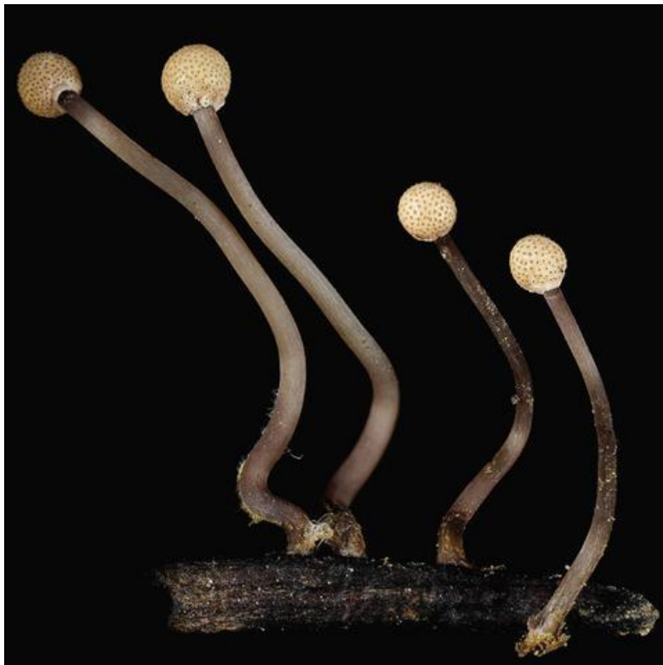
Slika 3. Strome

Ergot uzrokuju Claviceps purpurea , Claviceps sorghi , Claviceps africana i dr. vrste (Agrios, 2005.). Gljiva prezimljuje kao sklerocija na ili u zemlji ili pomiješana sa sjemenom. U proljeće za vrijeme vlažnijeg i hladnijeg vremena, u vrijeme cvatnje žitarica dolazi do klijanja sklerocija. Sklerocije formiraju od 1 do 60 stroma koje imaju drške duge 0,5 do 2,5 cm. Na vrhu svake strome (Slika 3.) nalazi se sferična glavica na čijem se obodu razvijaju brojni periteciji, a svaki od njih sadrži mnogo askusa. Svaki askus sadrži osam dugih, višestaničnih askospora. Kako bi izvršile zarazu askospore se do cvjetnih organa prenose pomoću vjetra ili kukaca, te na njima klijaju i jajnike zaraze izravno ili putem stigme. Kroz tjedan dana u jajniku dolazi do stvaranja sporodohija koje proizvode konidije. Konidije izlaze iz mladih cvjetova u obliku medne rose koja privlači kukce koji ju raznose do zdravih biljaka i vrše zarazu. Normalno i zdravo sjeme zamijenjeno je kompaktnom masom gljivičnog micelija, koja na kraju tvori karakteristične sklerocije. Sklerocije sazrijevaju otprilike u isto vrijeme kad i zdravo sjeme, te padaju na tlo i prezimljuju.