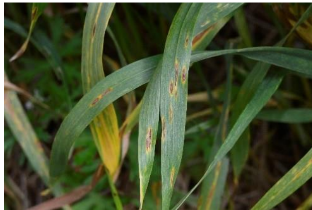
Slika 15. Simptomi zaraze Septoria nodorum na listovima

Simptomi karakteristični za Phaeosporia nodorum vidljivi su u jesen na koleoptili u vidu sitnih, ovalnih, smeđih pjega tamnijeg ruba. U proljeće se na listovima i rukavcima listova mogu uočiti simptomi u vidu sitnih pjegica oblika leće čija je sredina svjetlo smeđe, a rubovi tamno smeđe boje (Slika 15.). Dolazi do sušenja lišća od vrha pa prema rukavcu. Najveće štete uzrokuju simptomi koji se javljaju na klasu, odnosno na pljevicama klasa jer tada parazit prelazi na zrno koje je izvor zaraze. Na klasovima se prvo vide male smeđe pjege na gornjoj polovini vanjske pljevice (Slika 16.). Pjege se povećavaju i s vremenom može doći do spajanja istih. U unutrašnjosti pjega mogu se golim okom uočiti male crne točkice, piknidi, odnosno plodišta gljive sa sporama. Pojava piknida može izostati na lišću, ali se uvijek nalaze na nodijima, rukavcima listova i pljevicama. Zaražena zrna su deformirana i smežurana s prepoznatljivim smeđim pjegama.