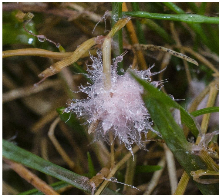
Slika 5. Simptom zaraze Microdochium nivale

U proljeće nakon otapanja snijega najlakše se uočavaju prvi simptomi zaraze. Mogu se uočiti oaze odumrlih biljaka polegnutih na površini tla i prekrivenih bijelo ružičastom prevlakom micelija koja nalikuju plijesni (Slika 5.). Prevlaka će nestati uslijed sunčanog i vjetrovitog vremena. Zaražene biljke u oazama su zakržljale, neiznikli klijanci uvijeni su poput vadičepa i mogu se uočiti znakovi truljenja u zoni korijena. Biljke koje prežive rani napad neoštećene, zaostaju u rastu i razvoju i ponekad može doći do truljenja korijena. U fazi busanja u rukavcima listova mogu se uočiti pjegice koje su u unutrašnjosti svjetlije boje sa tamnijim rubovima.