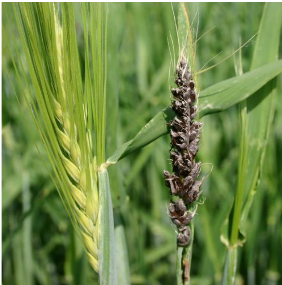
Slika 12. Simptomi zaraze Ustilago nuda na ječmu

Prašna snijet može se javiti na ječmu i pšenici. Bolest je opisana prije nove ere, pa se zbog toga ubraja u jednu od najstarijih bolesti pšenice. Uzročnik prašne snijeti ječma je Ustilago nuda .