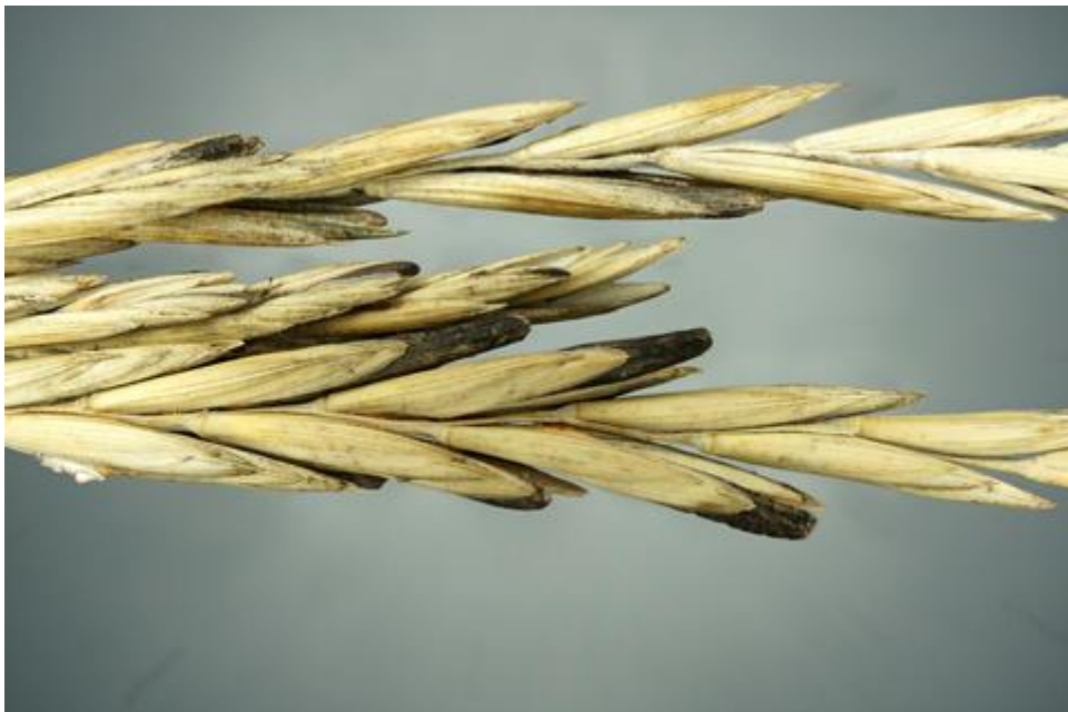
Slika 2. Simptomi zaraze Claviceps purpurea

Ergot se javlja širom svijeta u područjima gdje prevladavaju umjereni klimatski uvjeti. Najčešće napada raž i proso, rjeđe pšenicu i uzgojene i divlje trave, a rijetko ječam i zob. Ergot koji napada kukuruz javlja se samo u Meksiku. Bolest uzrokovana gljivicom Claviceps purpurea čini štetu na 5 do 10 % zrna na zaraženim glavama. Uzročnik bolesti uzrokuje razvoj sklerocija umjesto normalnih zrna što može dovesti do trovanja ljudi putem kruha ili životinja koje unesu sklerocije putem njihove hrane. Prvi simptomi javljaju se kao kremaste kapljice ljepljive tekućine koje se uočavaju na mladim cvjetovima zaraženih glava. Kapljice se ubrzo zamjenjuju tvrdom gljivičnom masom ljubičasto-crne boje promjera nekoliko mm i duljine od 0,2 do 5 cm. To su sklerocije ili ergoti gljive koji rastu umjesto jezgre i sastoje se od tvrde zbijene mase gljivičnog tkiva.