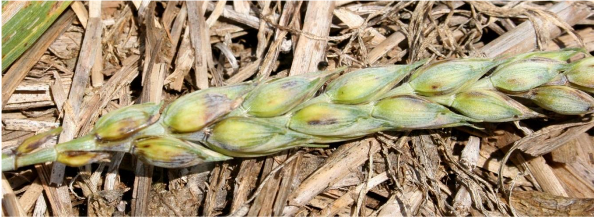
Slika 16. Simptomi zaraze Septoria nodorum na klasu