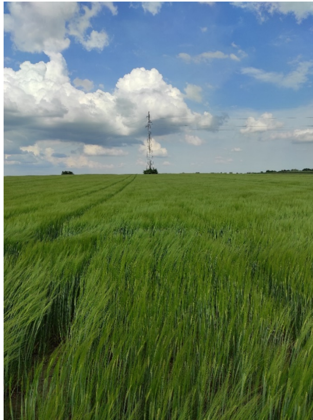
Slika 1. Ječam

Ječam je žitarica iz porodice trava (lat. Poaceae) i zauzima peto mjesto u svjetskoj proizvodnji žitarica (Gagro, 1997.).