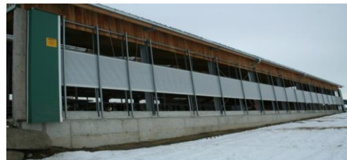
Slika 11. Zaštitne zavjese