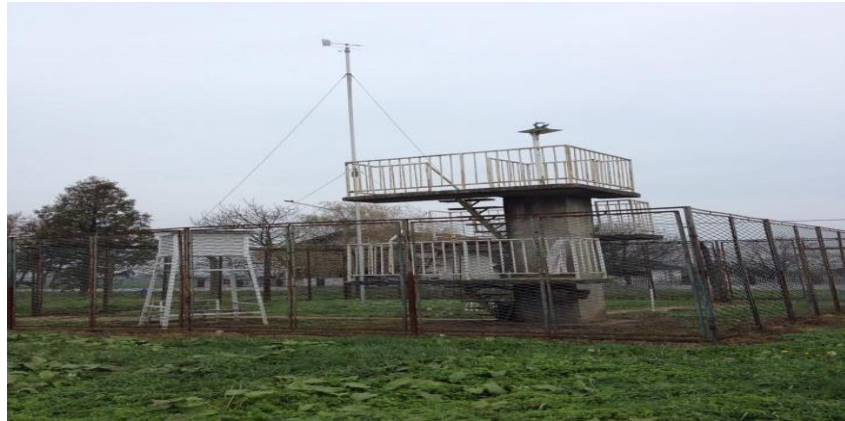
Slika 3. Meteorološka stanica Belje d. o. o. Grabovac

Kako se meteorološka stanica nalazi u istom naselju gdje će se izgraditi farma, uvijek će se moći znati točni podaci o vremenskim uvjetima, osobito onda kada će se obrađivat zemlja, kosit, skupljat sijeno ili slama.