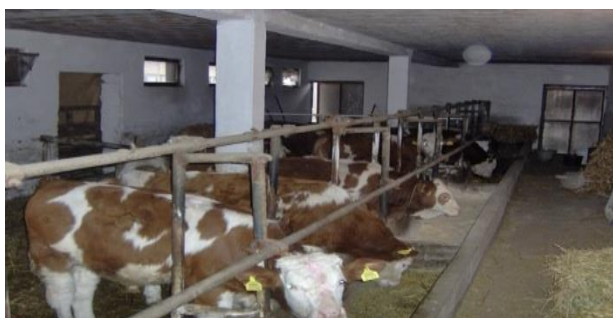
Slika 14. Tov junadi silažom

Tov junadi obavlja se vlastitom hranom, odnosno kukuruznom silažom i sijenom te kupovnim smjesama za junad.