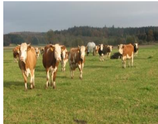
Slika 8. Ljetna ispaša

Na farmi se nalazi jedan vertikalni silos za brašnasti koncentrat i jedan horizontalni silos za peletiranu hranu te dva otvorena horizontalna silosa za silažu i sjenažu. Tu je i jedan šator za skladištenje slame kapaciteta 200 kockastih bala, te dehidrirana lucerna. Tijekom ljeta hranidba se većinom obavlja na ispaši.