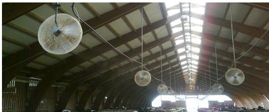
Slika 10. Ventilatori