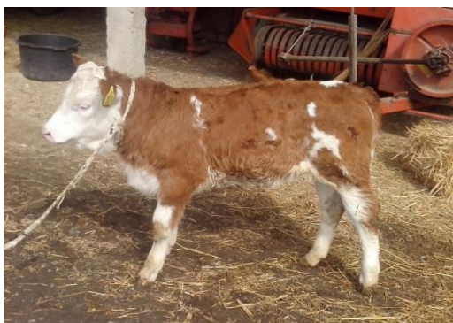
Slika 2. Simentalsko tele

Simentalac je osobito poznat po sposobnosti proizvodnje kvalitetnog mesa. Visoki udio čistog mesa u polovicama (62-67%) i mramoriranost mesa svrstavaju ga u red najboljih pasmina za meso na svijetu. Simentalac je uz neke europske mesne pasmine meliorator mesa širom svijeta.