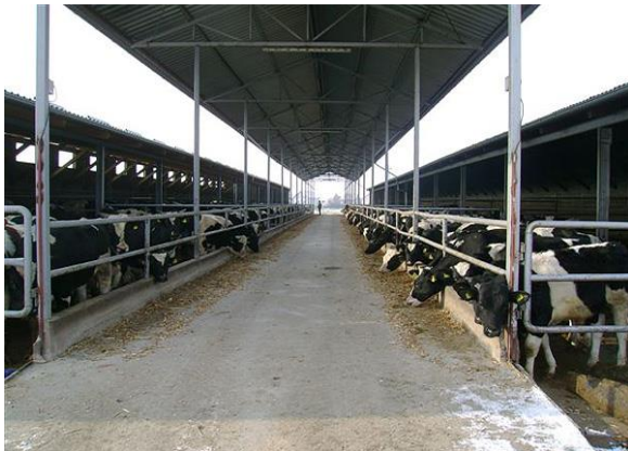
Slika 7. Obrok na hranidbenom stolu

Osnovni obrok se stavlja na hranidbeni stol a dodatni koncentrat u hranilice u količini od 4 kg. Ovisno o proizvodnji, pojedina grupa dobiva posebnu smjesu, pa se tako na farmi koriste 3 vrste peletirane smjese za doziranje u hranilicama (GKM-2 19% extra aroma, GKM-2 20,5% extra, GKM-2 20,5% standard), dok se na hranidbenom stolu hrani s GKM-2 20,5% extra.