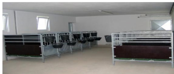
Slika 12. Ketreci za telad