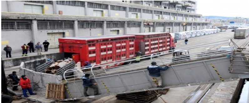
Slika 13. Kamion za transport stoke