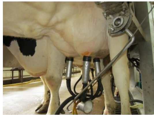
Slika 6. Mužnja krave