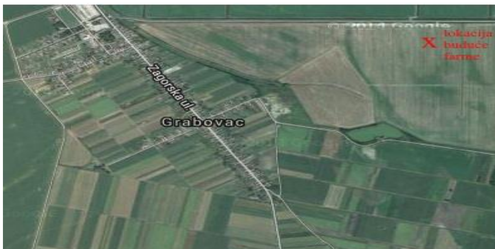
Slika 4. Satelitski prikaz mjesta Grabovac u kojem se nalazi farma Baranjka

Lokacija zahvata nalazi se u granicama obuhvata Prostornog plana uređenja Općine Čeminac - (Službeni glasnik Općine Čeminac broj: 2/05, 8/06 i 3/11) izvan granica građevinskog područja u zoni planske oznake P1 – osobito vrijedno obradivo tlo. Pri razmatranju odredbi važnih za realizaciju predmetnog zahvata uzete su u obzir i u dva navrata provedene izmjene i dopune te se tekst u nastavku ovog poglavlja odnosi na pročišćeni tekst Prostornog plana uređenja Općine Čeminac (Službeni glasnik Općine Čeminac broj: 2/05, 8/06 i 3/11).