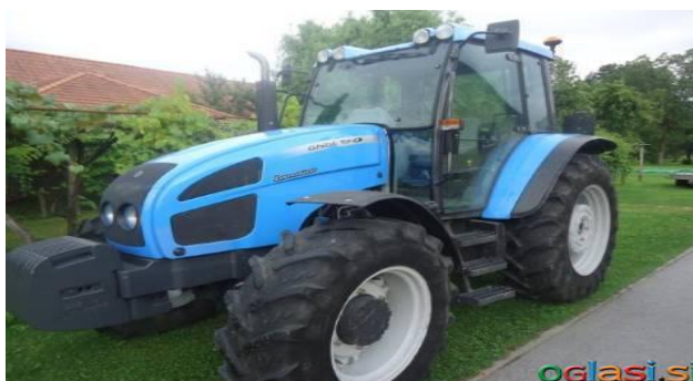
Slika 15. Landini 90 ks

Mikser prikolica - trioliet solomix 1-700, 7m 3 - dva otvora za pražnjenje lijevo i desno, digitalna vaga + prednji utovarivač za gnoj.