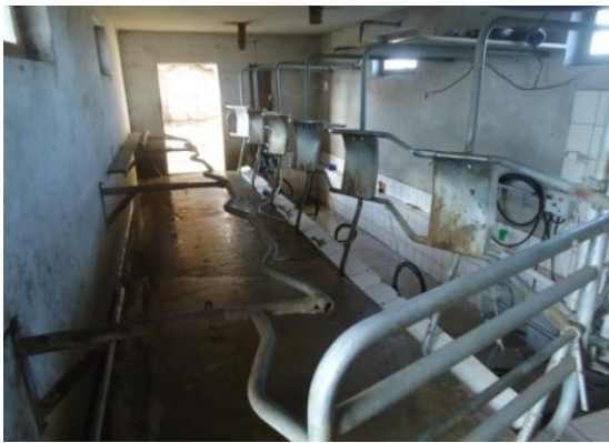
Slika 5. Izmuzište – tip riblja kost

Mužnja se obavlja uvijek u određeno vrijeme. Vrijeme mužnje je ujutro i navečer jer njihova vimena postaju puna. Krava ima potrebu za mužnjom te ju je potrebno obaviti brzo i stručno. Mužnja se obavlja muznim uređajem. Muzni uređaj izvlači mlijeko iz sise isto tako kao što to radi i tele. Stroj koristi pumpu za stvaranja podtlaka (vacuuma). Caput (2000.) navodi da pumpa mora osigurati i zrak u prostoru između sisne čaške i vanjske stijene čaške tako da se čaška pravilno steže i širi poput sisanja (izmjenjuju se podtlak i atmosferski tlak). Odabir sustava za mužnju direktno je povezan s brojem muznih krava i njihovim načinima uzgoja.