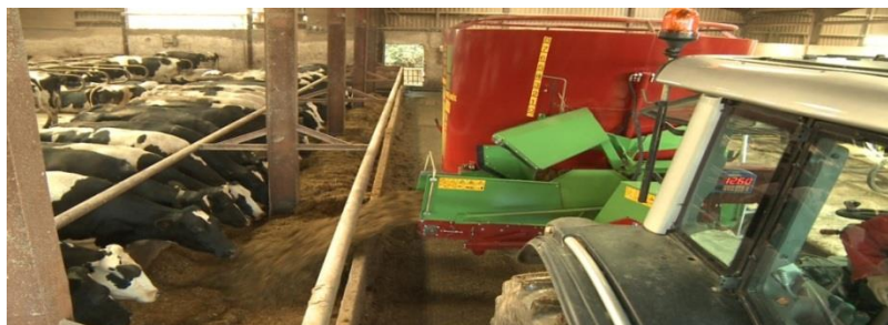
Slika 16. Obavljanje poslova na farmi – hranjenje krava pomoću mikser prikolice

Hranjenje pomoću mikser prikolice češće se obavlja za vrijeme zimskog razdoblja jer su krave po ljeti većinom na ispaši.