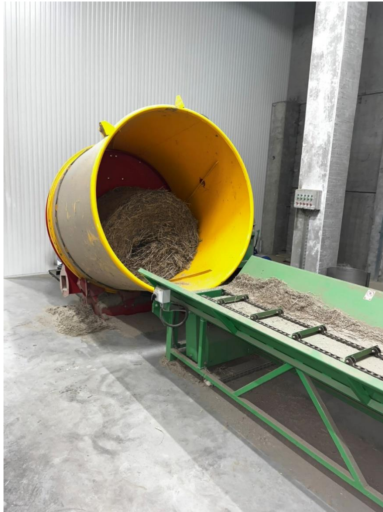
Slika 4. Uređaj za usitnjavanje sojine slame

Osušena slama u balama postavlja se u uređaj za usitnjavanje (sjekač), koji je prikazan na slici 4. Slama se usitnjava s tri noža do dužine od 5-6 cm. Noževi su tako raspoređeni da se dobiju kvalitetni i jednoliki oblici.