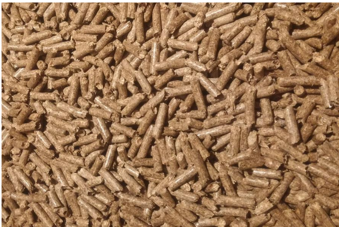
Slika 2. Agropelleti