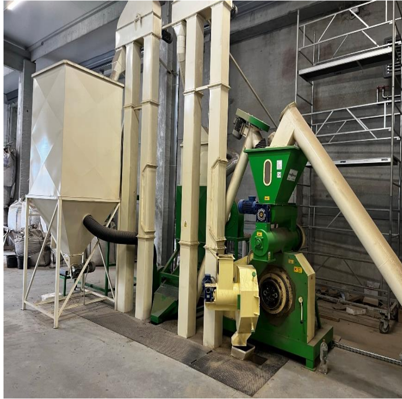
Slika 8. Preša i spremnik