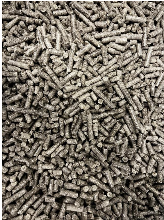
Slika 9. Peleti proizvedeni na OPG „Slađana Pandur“