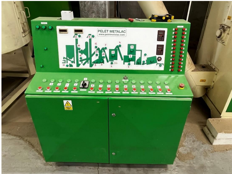
Slika 7. Kontrolna ploča proizvodne linije