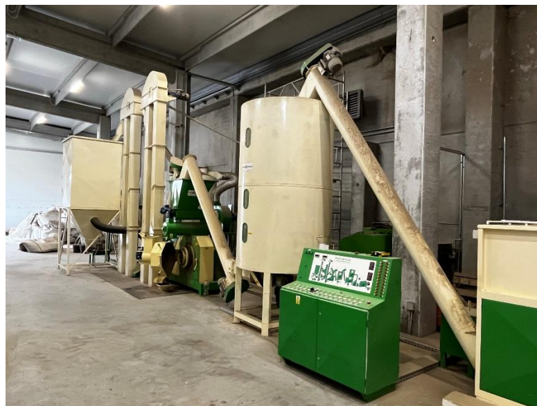
Slika 6. Kondicioner

Iz mlina uz pomoć pužnog transportera sojina slama i dodaci se transportiraju u kondicioner (Slika 6.) koji pored sebe ima upravljačku ploču (Slika 7.). Za uspješan proces proizvodnje agropeleta potrebno je nekoliko puta ponoviti postupak mljevenja kako bi se dobila dovoljna količina potrebnog materijala za proizvodnju agropeleta.