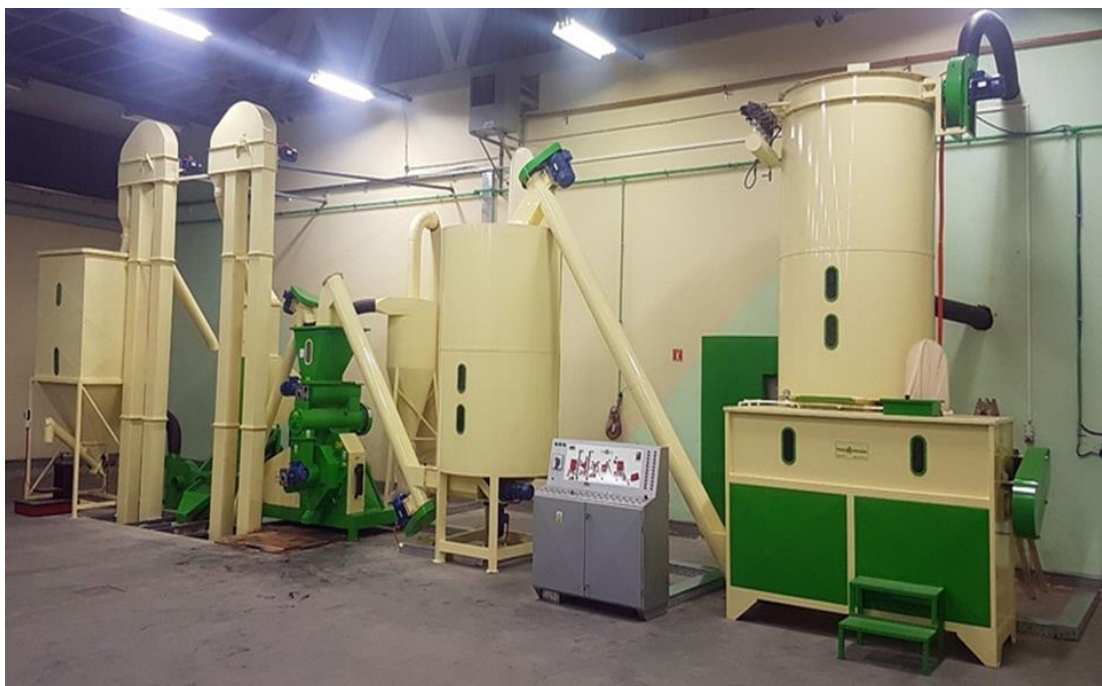
Slika 3. Proizvodni pogon za proizvodnju agropeleta