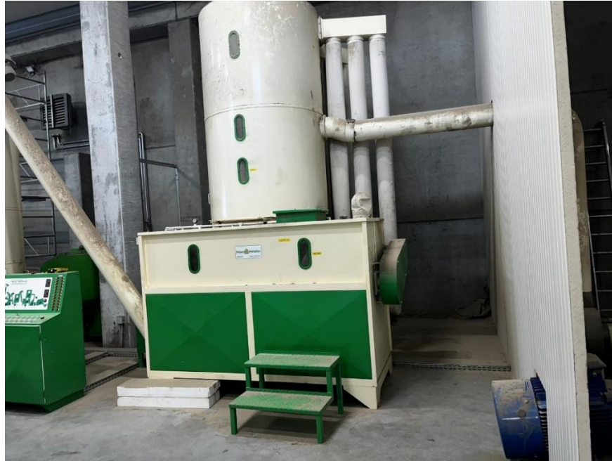
Slika 5. Mlin sa sitom