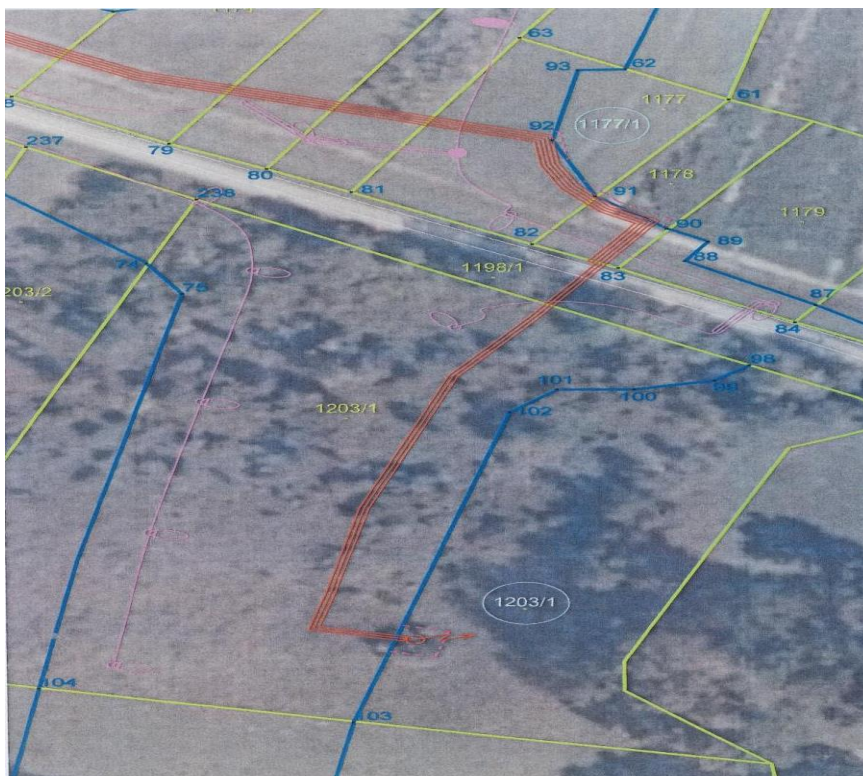
Slika 2 Trasa služnosti i linije izvlaštenja