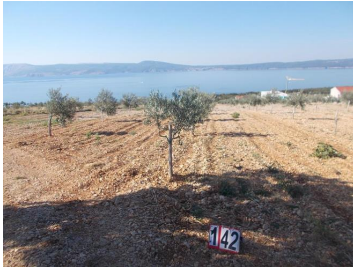
Slika 3 Mladi maslinik prije izvlaštenja

rodnost). Puna rodnost maslina je u dvanaestoj godini (Brzica, 1982.), a zatečene masline su starije sadnice u četvrtoj godini starosti na temelju podataka o sadnji iz ARKODA i očevida na licu mjesta (Slika 3).