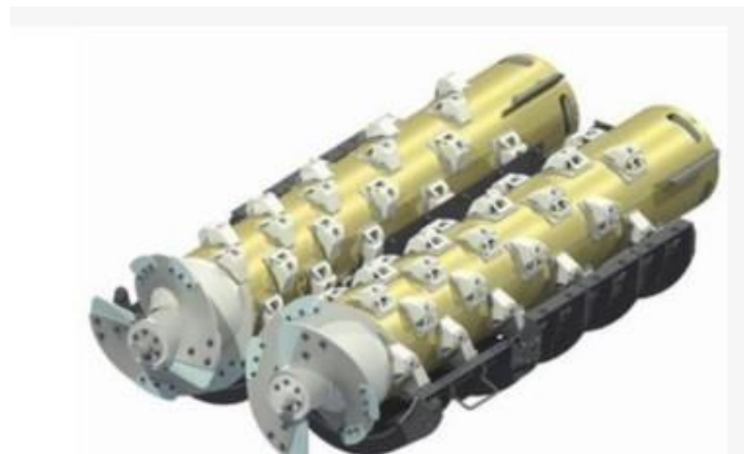
Slika 9. Sječkara sa rotoudaračima

(Izvor: https://sar.rostselmash.com/products/forage_harvesters/RSM_1401 )