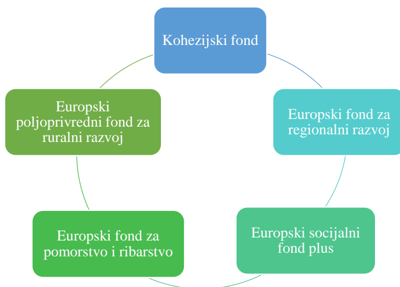
Slika 1. Fondovi Europske unije

Republika Hrvatska je nakon dobivanja statusa kandidata za članstvo Europskoj uniji dobila mogućnost korištenja tzv. instrumenti prepristupne pomoći IPA (eng. Instrument for Pre-Accession assistance) kako bi se izgradio sustav upravljanja i kontrole sredstvima fondova Europske unije. Hrvatska je postala punopravna članica Europske unije 1. srpnja 2013. godine te tada stječe obvezu sudjelovanja u zajedničkom proračunu svih država članica EU, ali joj je također omogućen pristup svim fondovima i mjerama. Posebno se ističu Kohezijski fond, Europski fond za regionalni razvoj, Europski socijalni fond plus, Europski poljoprivredni fond za ruralni razvoj i Europski fond za pomorstvo i ribarstvo.