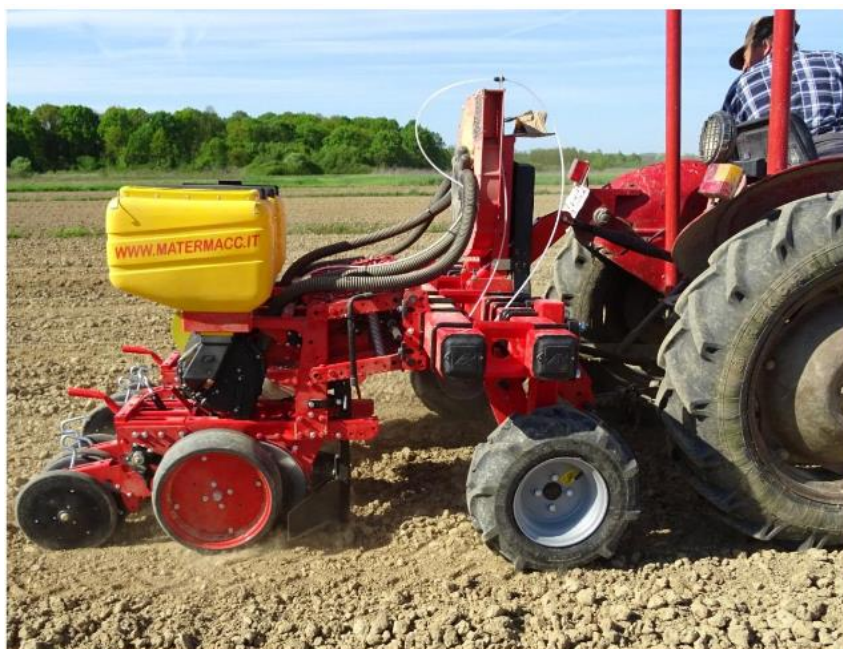
Slika 5. Sijačica MaterMacc Twin Row – 2