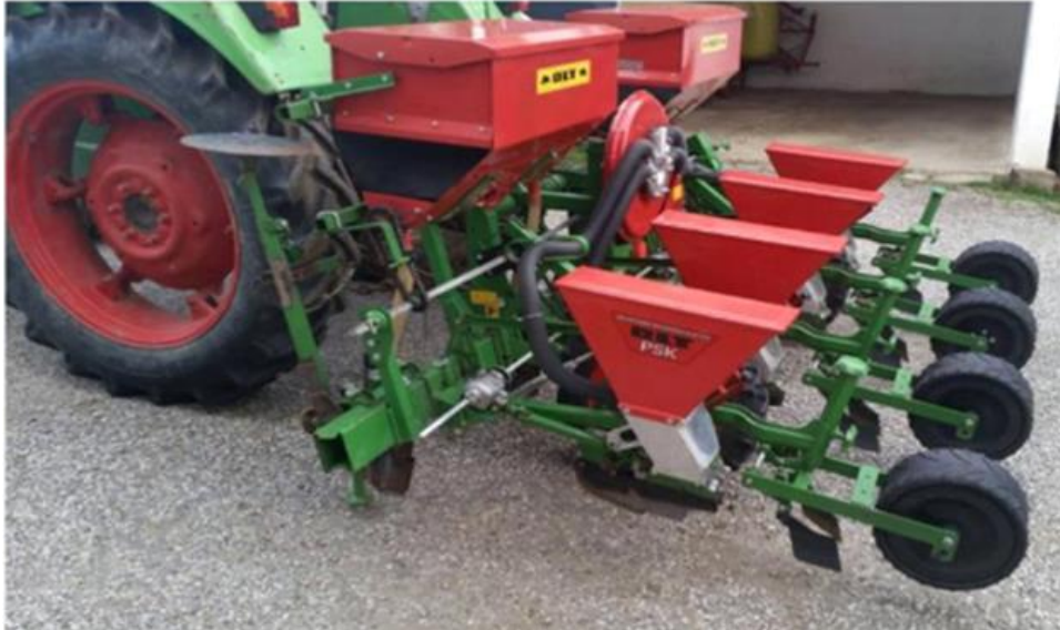
Slika 2. Pneumatska sijačica PSK4 OLT

1997.). OLT PSK pneumatska sijačica radi na principu podtlaka. Odlika takve sijačice je da nježno i pouzdano pojedinačno uzima sjemenke iz mase sjemena na osnovi razlike tlaka s jedne i druge strane sijače ploče.