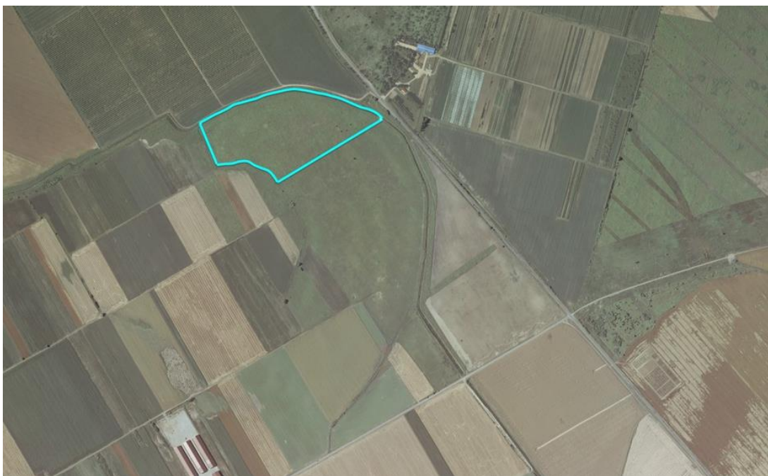
Slika 1. Pokušalište FAZOS-a

U radu su prikazani rezultati istraživanja razlika u sklopu i prinosa zrna kukuruza primjenom dva sustava sjetve: standardna sjetva i sjetva u trake, tj. u udvojene redove (engl. twin row). Za standardnu sjetvu korištena je PSK4 OLT sijačica, a za Twin row sjetvu sijačica MaterMacc Twin Row - 2 . Istraživanje je obavljeno na pokušalištu Fakulteta agrobiotehničkih znanosti Osijek, nedaleko od mjesta Tenja . Zasijana su dva hibrida – hibrid P9911 sjemenske kuće Pioneer te hibrid Kamparis sjemenske kuće KWS . Sjetva je obavljena 11. travnja 2019. godine, a berba 30. rujna.