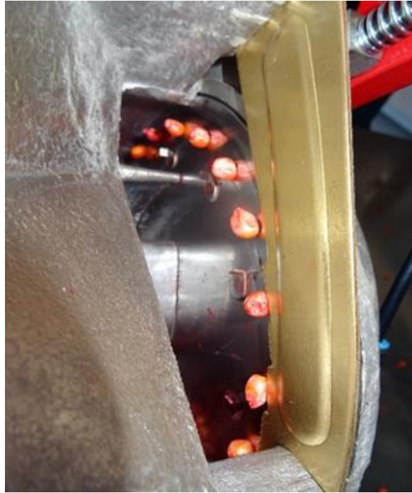
Slika 3. Odstranjivač viška sjemena