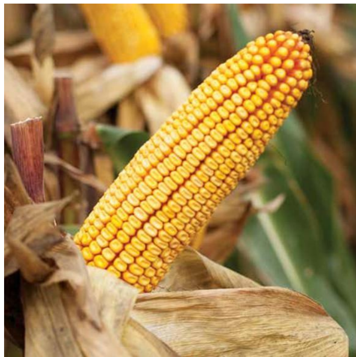
Slika 10. Klip kukuruza Kamparis