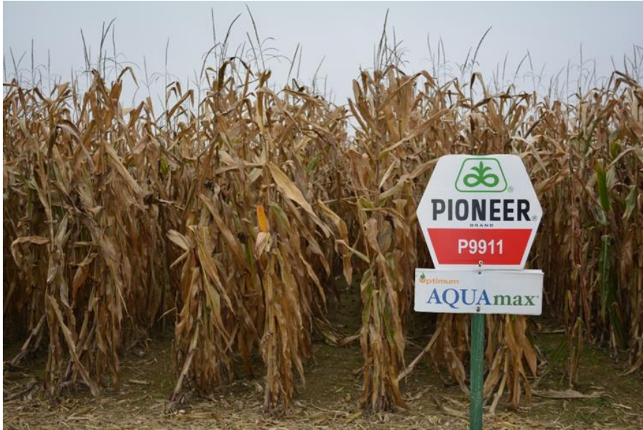
Slika 11. Hibrid P9911 prije berbe na pokušalištu Tenja

Nakon ručne berbe kukuruza, brojanja biljaka, vaganja i mjerenja vlage zrna dobili smo podatke koje smo rasporedili u sljedećim tablicama. Za hibrid P9911 (Slika 11.) utvrđeni sklop biljaka, ostvareni prinos zrna te vrijednosti vlage zrna mogu se vidjeti u tablicama 4., 5. i 6.