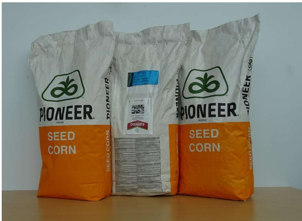
Slika 8. Hibrid Pioneer P9911