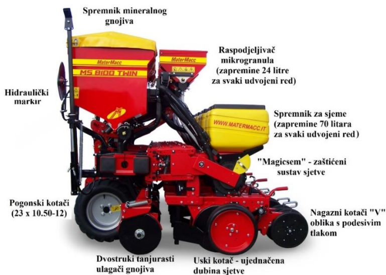
Slika 6. Glavni sustavi sijačice MaterMacc Twin Row-2

Sijačica MaterMacc Twin Row – 2 također je pneumatska sijačica, a konstruirana je iz povezanih pojedinačnih elemenata kao što su: uređaj za priključivanje s nosećom gredom, sjetvena sekcija i sjetveni uređaj, mjenjačka kutija i prijenosnici, radijalni ventilator, nagazni kotači, markeri te dodatna oprema. Navedene elemente možemo vidjeti na sljedećoj Slici 6.