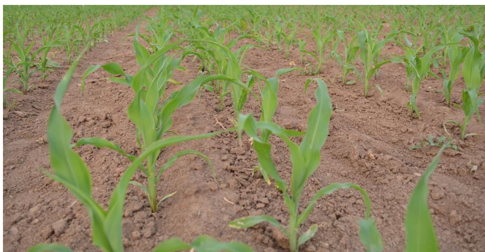
Slika 10. Izgled površine tla

Izvor: Banaj, Anamarija, Banaj, Đ., Tadić, V., Petrović, D., Stipešević, B. (2019.): Utjecaj sustava sjetve na prinos zrna kukuruza različitih fao grupa. Poljoprivreda, 25(2), 62-70