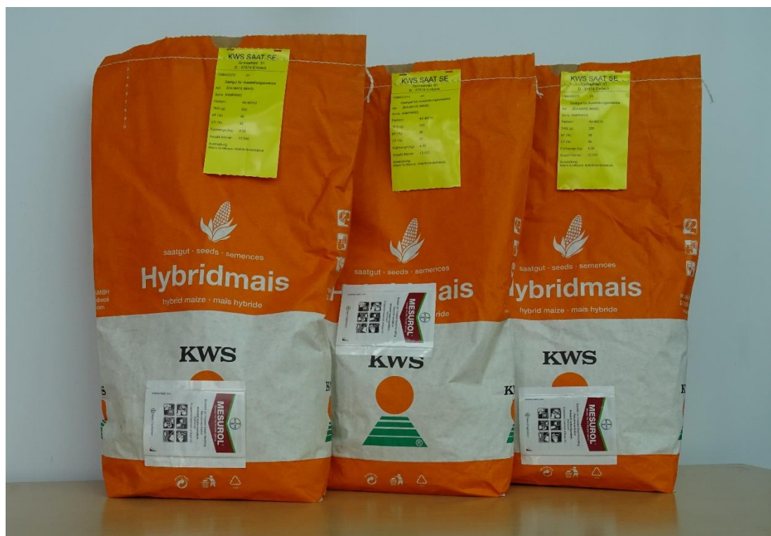
Slika 9. Hibrid KWS Kamparis