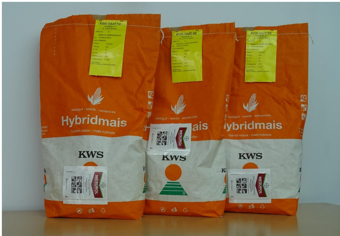
Slika 9. Hibrid KWS Kamparis