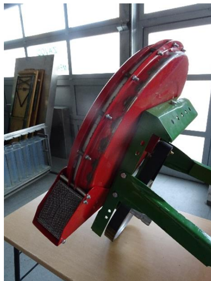
Slika 4. Ventilator PSK4 OLT sijačice

Sila isisavanja je potrebna kako bi držala sjemenke na otvoru, kako bi savladala trenje sjemenki u sjemenskoj masi, i kako bi savladala centrifugalne brzine koje ima sijaća ploča. Da bi se sjetva kukuruza uspješno obavila, ventilator (Slika 4.) bi trebao stvoriti podtlak od 5 do 10 kPa.