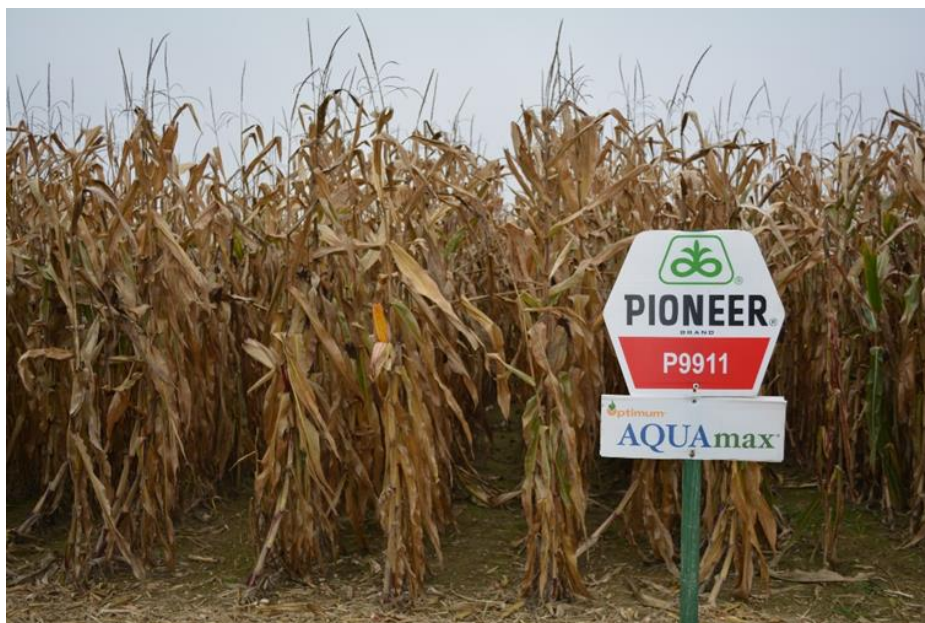
Slika 11. Hibrid P9911 prije berbe na pokušalištu Tenja

Nakon ručne berbe kukuruza, brojanja biljaka, vaganja i mjerenja vlage zrna dobili smo podatke koje smo rasporedili u sljedećim tablicama. Za hibrid P9911 (Slika 11.) utvrđeni sklop biljaka, ostvareni prinos zrna te vrijednosti vlage zrna mogu se vidjeti u tablicama 4., 5. i 6.