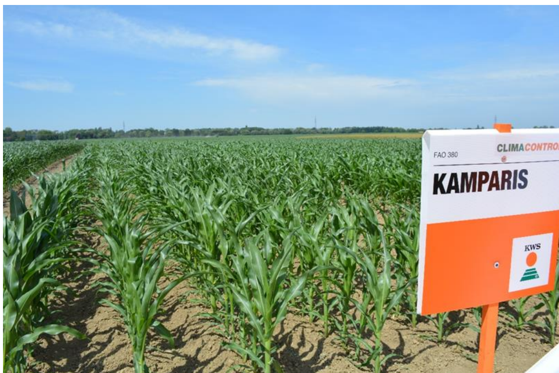
Slika 12. Hibrid Kamparis na pokušalištu Tenja