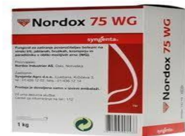
Slika 11. Fungicid Nordox 75 WG

Krajem drugog mjeseca potrebno je višnje zaštititi fungicidom kako bi se smanjile gljivične bolesti i infekcije. Točnije, na OPG-u Ciboci provedena je zaštita nasada sa sredstvom “Nordox 75 WG” (Slika 11.).