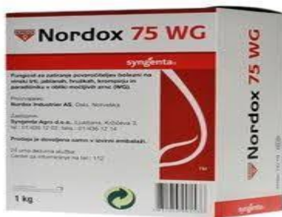
Slika 11. Fungicid Nordox 75 WG

Krajem drugog mjeseca potrebno je višnje zaštititi fungicidom kako bi se smanjile gljivične bolesti i infekcije. Točnije, na OPG-u Ciboci provedena je zaštita nasada sa sredstvom “Nordox 75 WG” (Slika 11.).