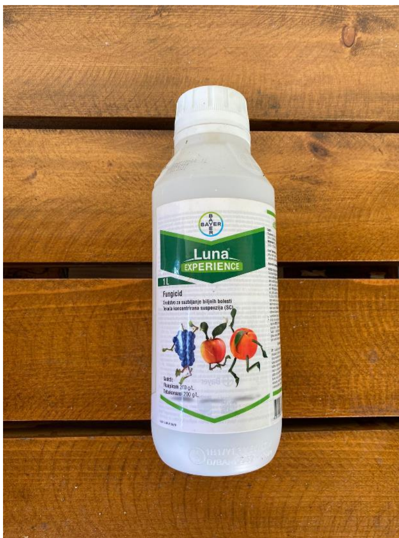
Slika 16. Luna experience, sredstvo za zaštitu bilja od monilije

Luna je novi kombinirani proizvod (fungicid) jedinstvenog načina djelovanja (Slika 16.). Suzbija biljne bolesti u voćarstvu, vinogradarstvu i drugim granama. Sastoji se od dvije aktivne tvari: fluopiram i tebukonazol. Visoko aktivno sredstvo koje sprječava nastajanje pepelnice, palež cvijeta kod višnje i brojne druge bolesti. Potrebno je primjeniti sredstvo u 0,2 l/ha po metro visine krošnje u 500 l vode. Za svaki metar visine krošnje, sredstvo se povećava za 0,2l. Datum provođenja zaštite ovim sredstvom je 31. svibnja te ponovljena zaštita 12.6. zbog intenzivnog porasta zaraze. Nakon primjenjena dva tretmana, bolest nije pokazivala znakove širenja.