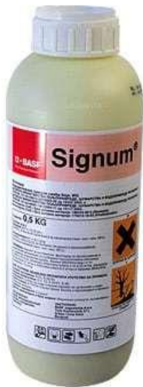
Slika 12. Signum, sredstvo za zaštitu od bolesti

Signum (Slika 12.) je sredstvo koje koristimo za suzbijanje bolesti. Koristimo ga kod koštičavog voća u koje spada i višnja. Vrlo česta i razorna bolest je monilija. Monilija zahvaća plod, cvijet i mlade izdanke iz biljke. Agresivno se širi i šteti biljci. Potrebno je preventivno zaštititi biljku kako bi se smanjio postotak zaraze monilijom. Prva zaštita nastupa sredinom ožujka (na OPG-u Ciboci 17.3.) te je tretman potrebno provesti više puta ako prvi put nije bilo značajnijih rezultata. Tako je druga zaštita istim sredstvom primjenjena 10. travnja. Način korištenja je kombinirati 0,75 l sredstva na 1 000 l vode.