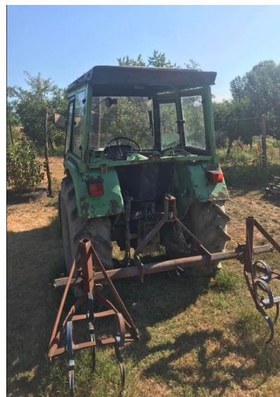
Slika 3. Traktor Torpedo 6006