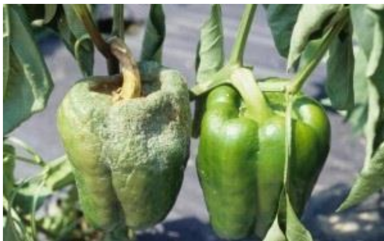
Slika 15. Plamenjača na plodu paprike

- Plamenjača je jedna od najznačajnijih i najopasnijih bolesti paprike (Slika 15.), ali i rajčice i krastavca. Uzročnik ( Phytophthora capsici ) je vrlo destruktivan i može smanjiti prinos od 40-100%. Do masovnih šteta dolazi ako se u gramu tla nađe više od 25 oospora ( https://www.agroklub.com ).