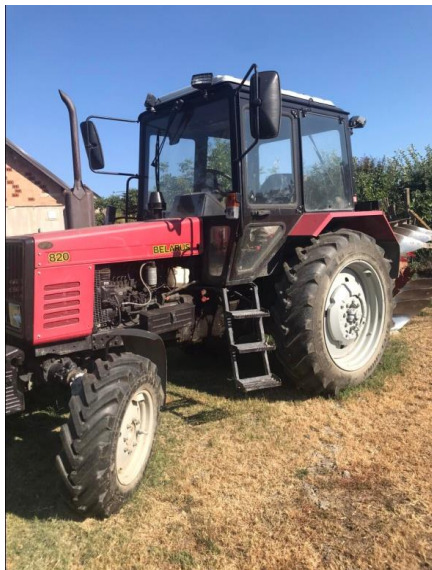
Slika 2. Traktor Belarus 820

Obiteljsko poljoprivredno gospodarstvo „Ištvan Jozef“ osnovano je 2007. godine u Lugu, općina Bilje, Osječko-baranjska županija (45° 39' 47" N, 18° 46' 23" E). Bavi se proizvodnjom slatke i ljute začinske paprike i proizvodnjom graha uglavnom zbog plodoreda. Površina uzgoja začinske paprike na OPG-u iznosi 2 hektara. Mehanizacija OPG-a se sastoji od traktora Belarus 820 i Torpedo 6006, prskalice za njegu i zaštitu bilja AGM, sadilice IMT i trobraznog pluga (Slike 2.-6.).