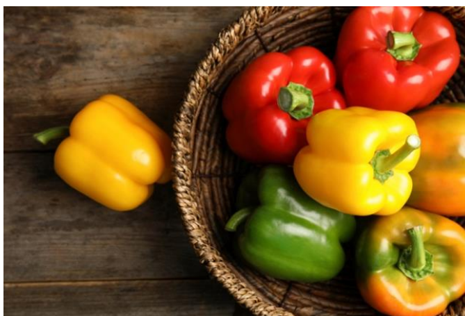
Slika 1. Plod paprike

Paprika ( Capsicum annuum L.) je jednogodišnja zeljasta biljka iz porodice pomoćnica ( Solanaceae ). Koriijen je plitak i slabije razvijen. Stabljike su uspravne, pri osnovi odrvenjele, u gornjem dijelu razgranate. Narastu do 60 cm visine. Listovi su naizmjenični, dugi do 15 cm, jajastog oblika, na vrhu ušiljeni, cjelovitog ruba. Cvjetovi su dvospolni, pravilni, smješteni nasuprotno na kratkim peteljicama. Plod je višesjemena nabrekla boba crvene, zelene, žute ili ljubičaste boje, glatke teksture (Slika 1.; www.adiva.hr ). Sadrži mnogobrojne plosnate, žućkaste sjemenke. Latinski naziv roda Capsicum potječe od grčke riječi „kapto“ (ujedam), zbog ljutog okusa kojeg uzrokuje kapsaicin ( https://www.plantea.com.hr/paprika ; Todorović i sur., 2003.).