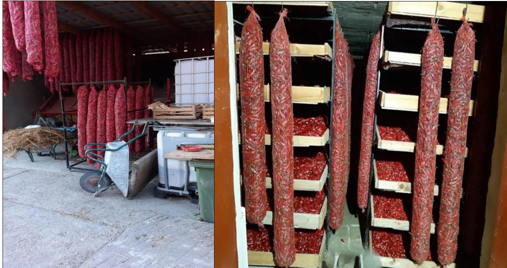
Slika 18. Začinska paprika na dozrijevanju

Prije sušare se skidaju peteljke s plodova, plodovi se usitnjavaju i melju. Na OPG-u „Ištvan Jozef“ sušenje se obavlja radijatorima na plin. Kapacitet sušare je 4000 kg svježe paprike. Na Slici 19. prikazana je unutrašnjost sušare na ovom gospodarstvu, a na Slici 20. osušena paprika.