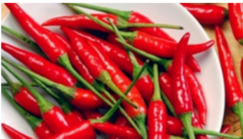
Slika 10. Začinska paprika