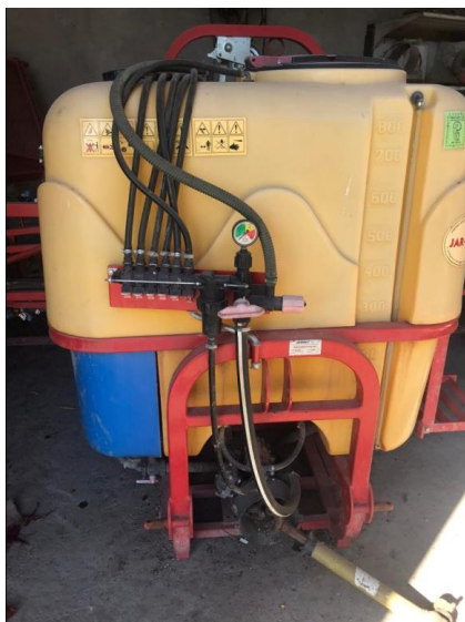
Slika 4. Prskalica AGM 200-2000L