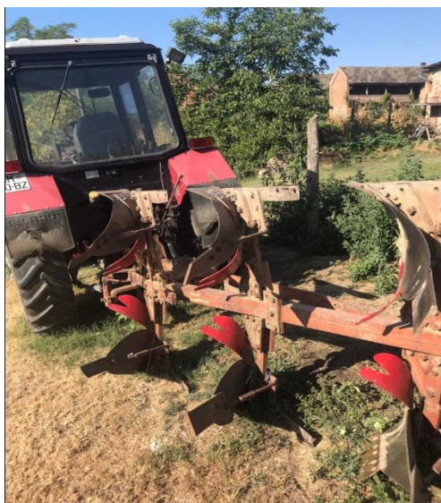
Slika 6. Trobrazni plug