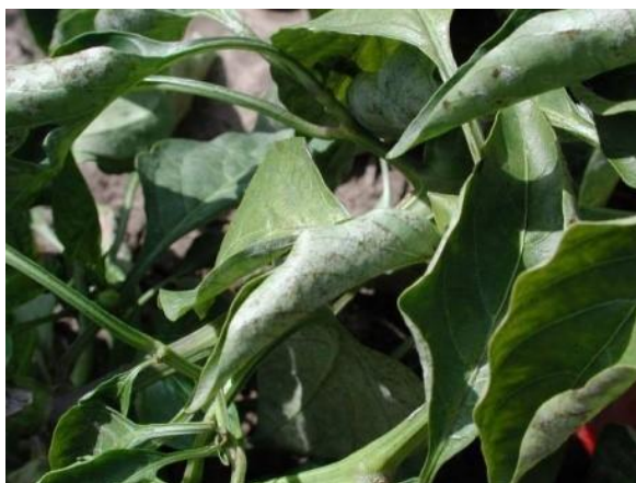
Slika 16. Pepelnica paprike

- Pepelnica je bolest koju uzrokuje gljivica Leveillula taurica , poznata po tome što ima više od 1000 domaćina uključujući vrste iz porodica Solanaceae , Compositae i Leguminosae (Khodaparast i sur., 2001.; Glawe, 2008.). Na naličju listova razvija se rijetka prljavo bjeličasta prevlaka (Slika 16.). Listovi se uvijaju prema licu lista, žute i otpadaju. Prvo otpadaju najstariji listovi te se otpadanje širi prema gore sve dok ne ostanu samo vršni listovi. Zbog gubitka lisne mase sve je slabija cvatnja, plodovi se slabije razvijaju te listovi izgledaju kao sprženi. Jači napad ove bolesti uzrokuje smanjenje prinosa (Maceljčki i sur., 2004.). Do zaraze dolazi ljeti kada su temperature iznad 32 °C i niska relativna vlaga zraka 40 do 50%. Može se javiti i u plasteničkoj proizvodnji i proizvodnji na otvorenom. Prezimljuje na uzgajanim biljkama u zaštićenom prostoru ili na korovskim vrstama (Parađiković, 2009.). Suzbija se preventivno primjenom sumpornih pripravaka.