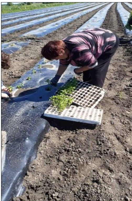
Slika 14. Presađivanje prijesadnica na OPG-u „Ištvan Jozef“