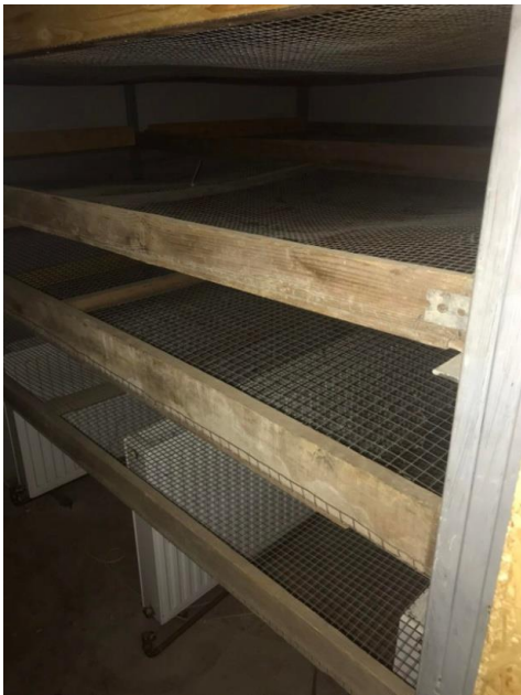
Slika 19. Sušara OPG-a