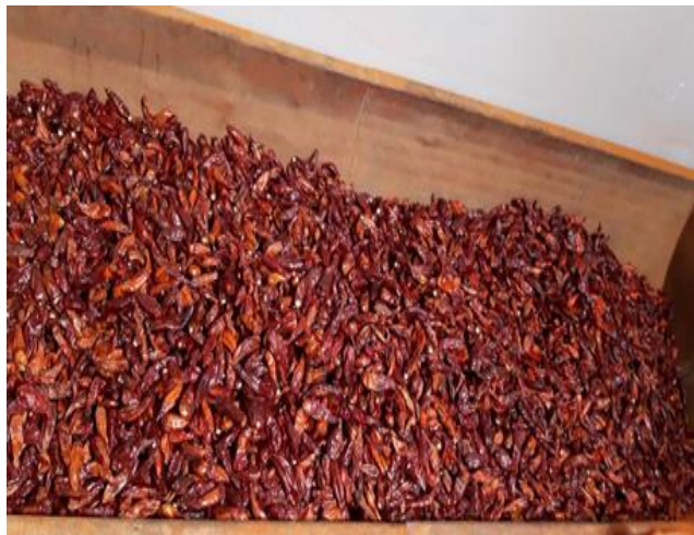
Slika 20. Osušena paprika