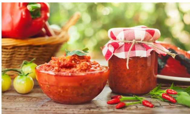
Slika 8. Ajvar

Paprika s velikim spljoštenim plodovima su „kapije“, posebno cijenjene na ovim prostorima za pečenje i spremanje zimmice, za preradu kiseljenjem i proizvodnju ajvara (Slika 9.). Iz tog razloga i vrlo tražene od strane prerađivačke industrije. Plodovi ovog tipa su spljošteno stožastog oblika sa zašiljenim vrhom, mase 60-120 g i debljine perikarpa 4-7 cm. Najčešće imaju dvije, a rjeđe tri, sjemene pregrade. Promjer plodova kreće se 4-7 cm, dužina 10-18 cm odnosno omjer širine i dužine je 1:2 do 2,5. Boja perikarpa u tehnološkoj zriobi je svijetlo ili tamnozeleno, a u fiziološkoj crvene do tamnocrvene nijanse. Ovaj se tip paprike uzgaja uglavnom na otvorenom, a najraširenije sorte su Kurtovska kapija , Stella i Slonovo uho , koja je prikazana na Slici 9. ( https://www.agroklub.com ).