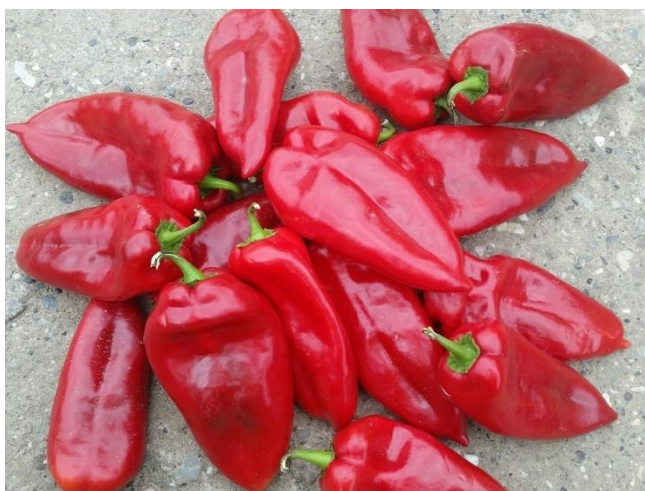
Slika 9. Slonovo uho