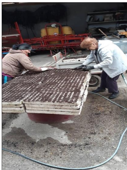
Slike 12. i 13. Sjetva u kontejnere na OPG-u „Ištvan Jozef“