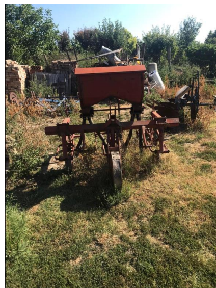
Slika 5. Sadilica IMT