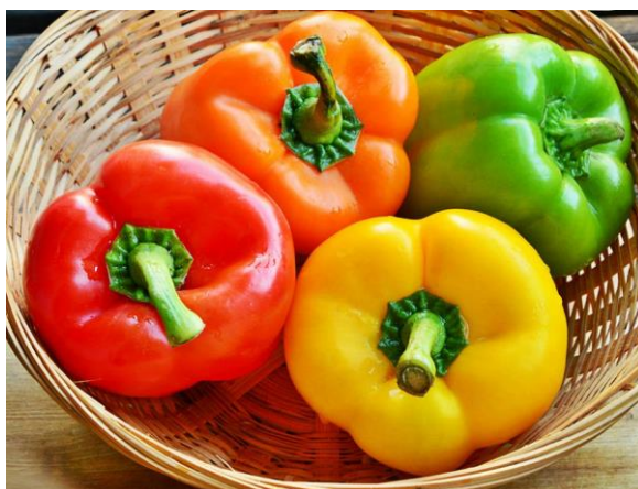
Slika 7. Paprika babura

U uzgoju su najraširenije krupnoplodne sorte u tipu „babura“ (Slika 7.), što potvrđuje i najveći broj registriranih sorti u ovom tipu kod nas i u svijetu. Osnovne karakteristike ploda ovog tipa su prizmatični oblik ploda koji završava sa tri ili četiri vrha, koliko najčešće ima i sjemenih pregrada. U ovaj tip ubrajamo i sorte sa stožastim plodovima koji završavaju s jednim vrhom koji može biti najčešće oštar ili pak zaobljen i najčešće ima tri sjemene pregrade. Meki dio ploda (perikarp) u tehnološkoj zrelosti je mliječnobijele, svijetložute, svijetlozelene ili tamnozeleno boje koja u fiziološkoj zrelosti može prijeći u svijetlocrvene, tamnocrvene, narančaste ili ljubičaste boje. S obzirom na to da naše tržište preferira svijetložute i žute boje paprike većina registriranih sorata ima takvu boju u tehnološkoj zrelosti. Plodovi ovih paprika su vrlo krupni s prosječnom masom 80-150 g i debljinom perikarpa 4-7 mm. Ovaj tip paprika ima široki sortiman ranih do kasnih sorti koje se mogu uzgajati u zaštićenom prostoru i na otvorenom. Nove selekcije uglavnom su hibridi od kojih su danas najrašireniji u proizvodnji Istra F1 , Blondy F1 i Bianca F1 svijetlozelenih i žutih boja plodova. Plodovi su uglavnom namijenjeni za potrošnju u svježem stanju iako se mogu i konzervirati kiseljenjem ( https://www.agroklub.com ).