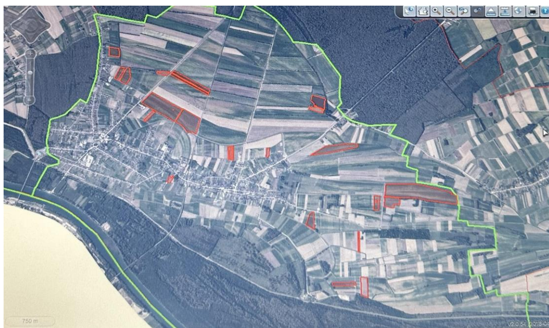
Slika 1. Pregled zemljišnih resursa istraživanog obrta

Sve proizvodne površine su u kategoriji oranice. Prosječna veličina oraničnih jedinica je 3.7096 ha, s prosječnom udaljenošću 2.88 km od ekonomskog dvorišta ( Tablica 2.).