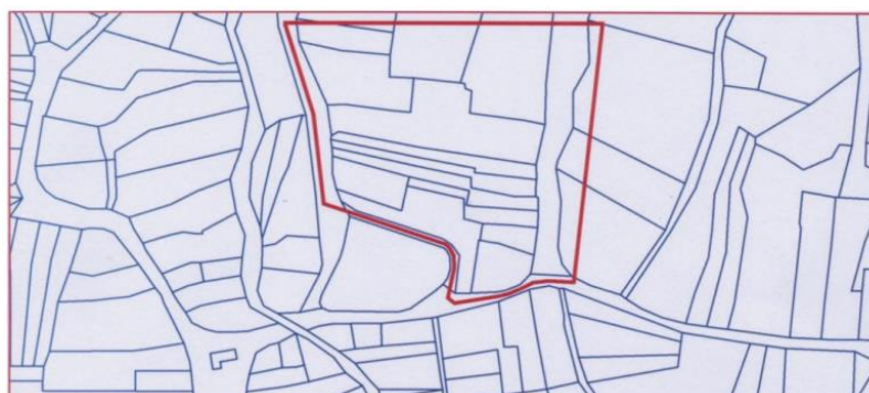
Slika 2 Primjer izgleda poljoprivrednog zemljišta nakon komasacije Izvor: „Značenje primjene komasacije u prošlosti i sadašnjosti uz vrednovanje nekoliko specifičnih lokacija u Požeško-slavonskoj županiji“: http://hrcak.srce.hr/97378 (08.06.2023.)