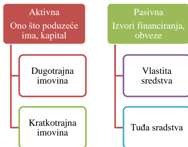
Slika 1. Struktura bilance

Bilanca se sastoji od aktivne i pasivne. Bilanca se temelji na načelu bilančne ravnoteže, što znači da imovina mora biti u ravnoteži sa izvorima iz kojih se pribavlja (obveze i kapital) Žager i sur., (2016).