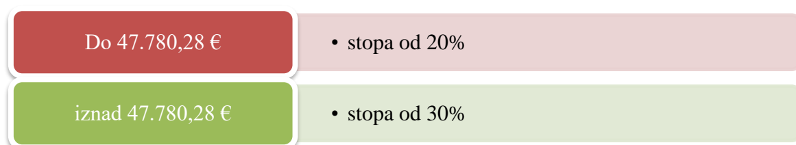
Slika 10. Stope poreza na dohodak

Godišnje porezne osnovice i stope poreza na dohodak po godišnjoj prijavi, a na temelju visine dohotka, podijeljene su u dva razreda kako je to prikazano na slijedećoj slici 9.