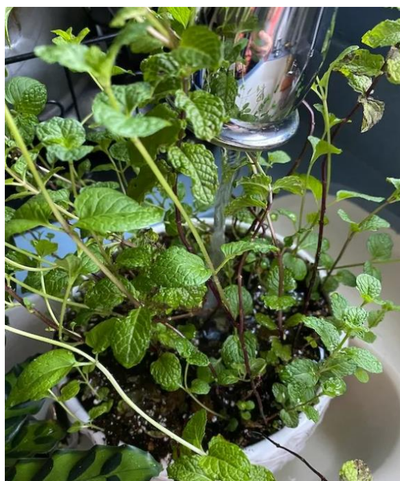
Slika 12. Navodnjavanje mente u kućnom uzgoju

Za razliku od drugih biljaka mentu je veoma lako uzgajati u zatvorenom prostoru, sve dok se biljci pruža dovoljna količina svjetlosti i vlage. Prilikom uzgoja mente u zaštićenim prostorima ključno je održavanje idealne temperature i razine vlažnosti. Optimalna temperatura za rast mente je (18-24 °C) tijekom dana, a noću malo hladnije. Količina vlage mora se strogo paziti jer zbog visoke razine vlage mogu se pojaviti bolesti koje uzrokuju gljivice. Razina vlage treba biti između 40 i 60 % ( https://agriculturalmagazine.com/ )