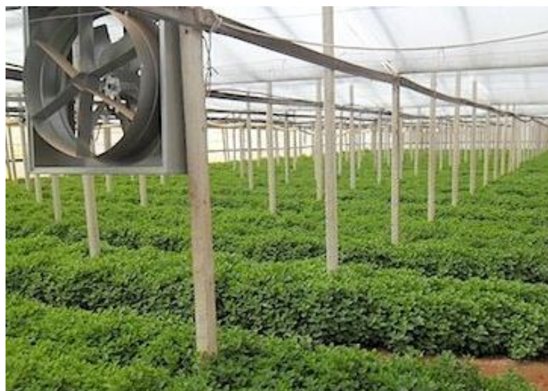
Slika 14. Uzgoj mente u zaštićenom prostoru

Bolesti mente na koje se mora paziti prilikom hidroponskog uzgoja su: hrđa, pepelnica, pjegavost lišća, rak stabljike i antraknoza. Većina bolesti može se u potpunosti spriječiti uklanjanjem mrtvog ili umirućeg lišća ( https://plantprovider.com/ ).