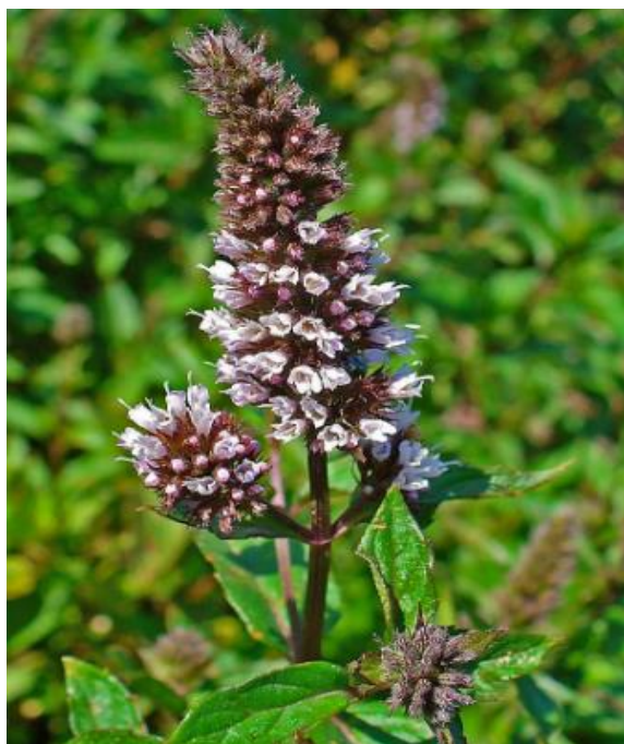
Slika 5. Cvijet mente

Na kraju grana nalazi se cvat s 6 do 7 svijetlo ljubičastih bijelih cvjetića (Slika 5.) koji formiraju klas. Cvjetovi jako brzo cvatu te opadaju pa se zbog toga rijetko nađu sjemenke u cvatu. Vjenčić je crvenkast, čaška žljezdasto istočkana. Vjenčić sadrži 4 prašnika, a 2 prašnika su najčešće nešto kraća od ostalih prašnika. Plod je kalavac koji je sastavljen iz četiri dijela, a sjemenke su većinom sterilne. Biljka cvijeta od lipnja do listopada te sporo niče, ali kasnije se ravnomjerno razvija (Kolar i sur., 2001.).