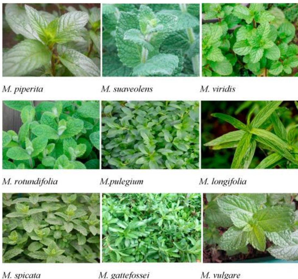
Slika 2. Različite vrste iz roda Mentha