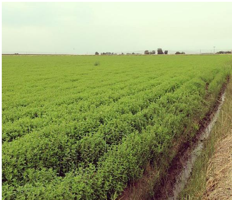
Slika 11. Polje mente

Kolak i sur. (2001.) navode da je oraničnu proizvodnju na našim prostorima moguće organizirati na način profitabilnosti po ha koja bi trebala biti veća od uzgoja standardnih kultura. Proizvodnja mente nosi visoke troškove, a razlog tome je velika potreba za ljudskom snagom od sadnje do destilacije. Zbog toga je nužno smanjiti troškove na način da se poveća stupanj mehanizacije.