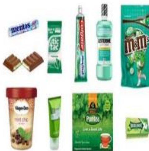
Slika 17. Ostali proizvodi od mente

Eterično ulje mente i mentol intenzivno se koriste kao arome u osvježivačima daha, pićima, antiseptičkim ustima sredstva za ispiranje, pasta za zube, žvakaće gume, deserti i slatkiši, slično kao mint (bomboni) i mint čokolada. Otprilike 45 % ulja od mente proizvedenog u SAD-u je koristi se za aromatiziranje žvakaćih guma s još 45 % koristi se za sredstva za čišćenje zuba s okusom (pasta za zube, tekućina za ispiranje usta itd.), preostalih 10 % koristi se za aromu u slasticama, farmaceutskoj industriji, industriji likera i aromaterapiji ( https://niftem.ac.in/ )