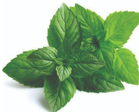
Slika 4. Listovi mente