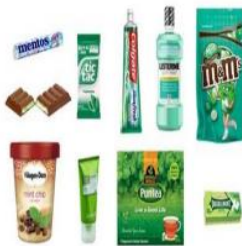
Slika 17. Ostali proizvodi od mente

Eterično ulje mente i mentol intenzivno se koriste kao arome u osvježivačima daha, pićima, antiseptičkim ustima sredstva za ispiranje, pasta za zube, žvakaće gume, deserti i slatkiši, slično kao mint (bomboni) i mint čokolada. Otprilike 45 % ulja od mente proizvedenog u SAD-u je koristi se za aromatiziranje žvakaćih guma s još 45 % koristi se za sredstva za čišćenje zuba s okusom (pasta za zube, tekućina za ispiranje usta itd.), preostalih 10 % koristi se za aromu u slasticama, farmaceutskoj industriji, industriji likera i aromaterapiji ( https://niftem.ac.in/ )