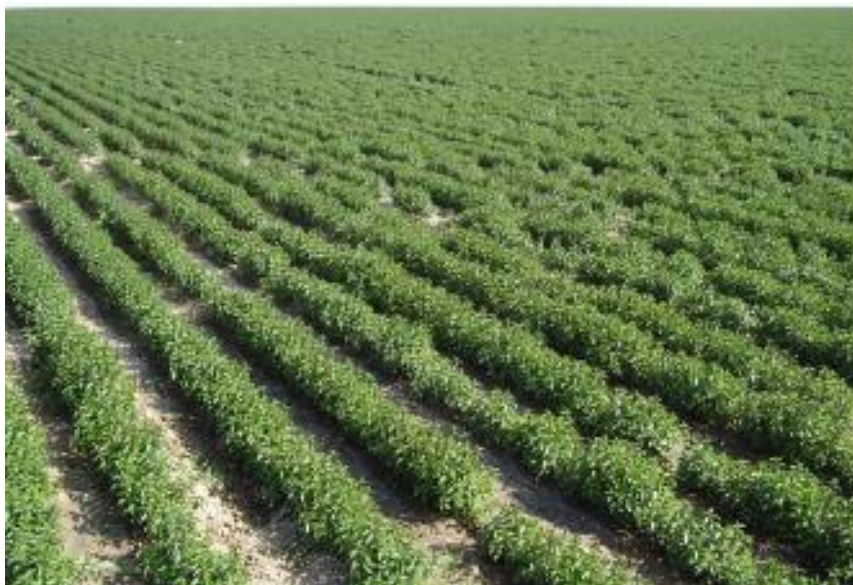
Slika 10. Vanjski način uzgoja

Menta se počinje brati kada dođe do otvaranja prvih cvjetova jer tada se u listovima nalazi najveća količina eteričnog ulja. Najveći sadržaj eteričnog ulja i biološke mase postiže se kada procvjeta 50 % biljaka. Biljka se kosi od početka do kraja cvatnje. Biljke koje su ocvale sadrže eterično ulje lošije kvalitete (Kolak i sur., 2001.).