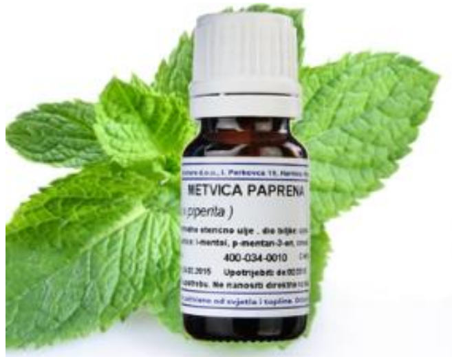
Slika 15. Eterično ulje mente