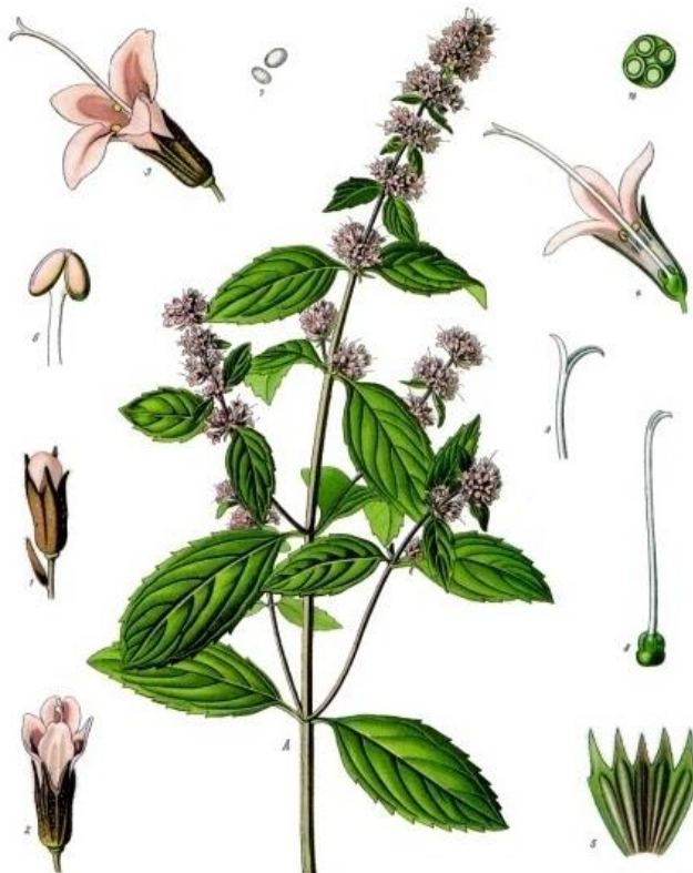
Slika 3. Dijelovi mente

Paprena menta je višegodišnja biljka koja posjeduje razgranatu stabljiku visine od 40 – 100 cm, zelene boje s razgranatim korijenom. Rizomi se razvijaju na dubini od oko 5 cm i po površini zemljišta (Kovač, 2015.).