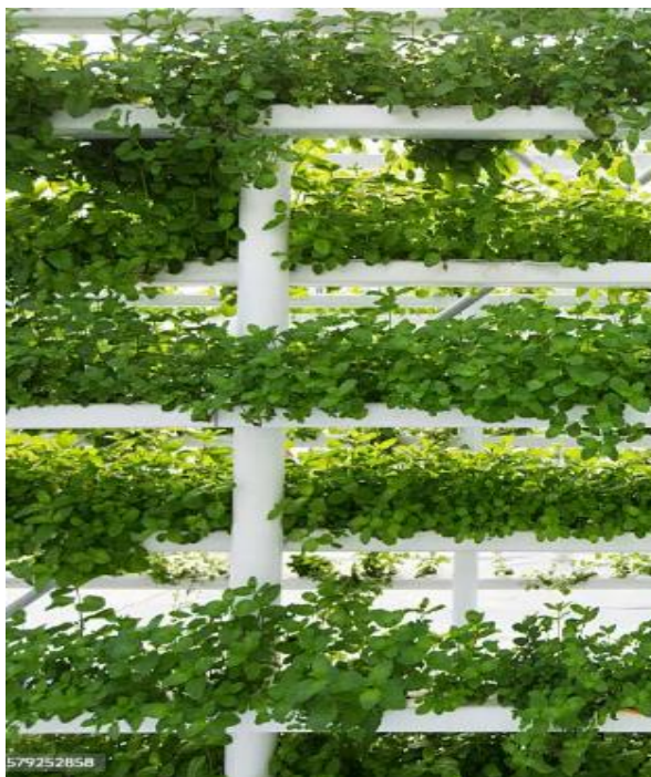
Slika 13. Hidroponski način uzgoja mente