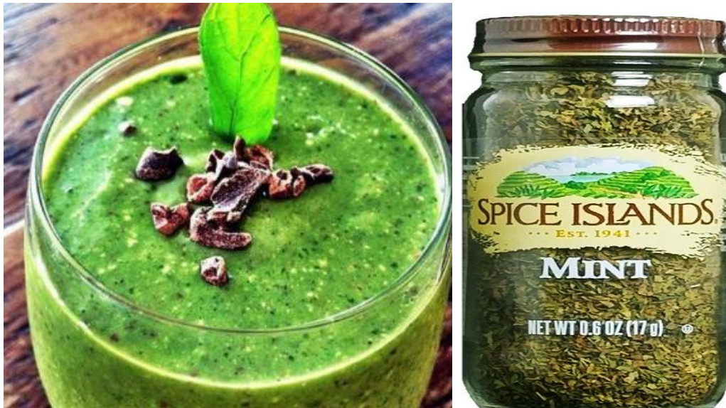
Slika 18. Napitak i začin od mente