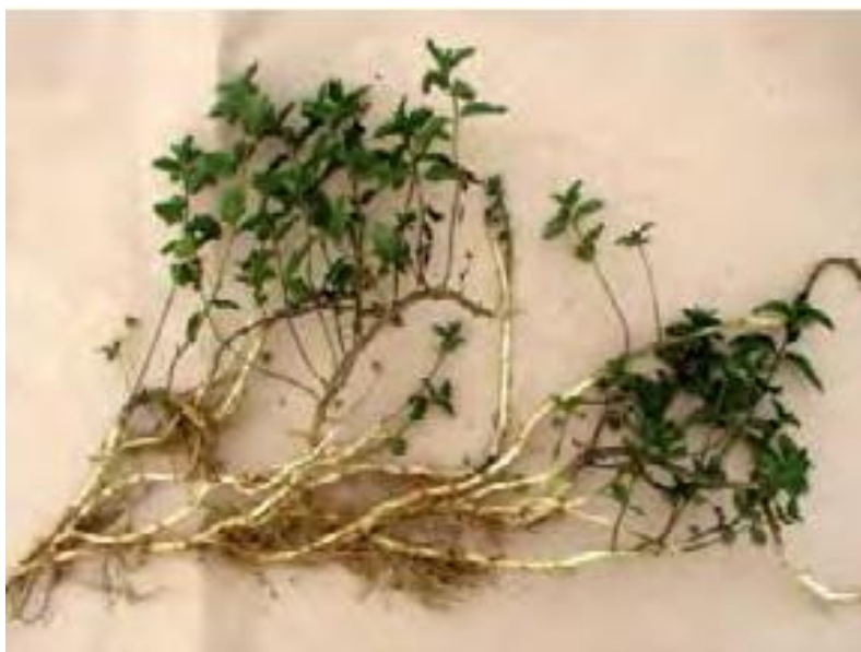
Slika 6. Biljka mente s nadzemnim dijelovima i rizomima

Uzgoj mente najbolji je u toplim i vlažnim područjima, a uzgoj se preferira na dubokim plodnim tlima koja su dobro pripremljena prije podizanja usjeva (Kolak i sur., 2001.) Najbolja tla za uzgoj mente su laka, aluvijalna, pjeskovita te bogata hranjivim tvarima. Za uzgoj mente najbolja su duboka rastresita ilovačka tla, a teška i sabijena nisu preporučena za uzgoj. Menti najbolje odgovaraju neutralna tla ili tla slabo kisele reakcije. Prema navodima Kovač (2015.) menta uspijeva gotovo na svim područjima te nema velikih zahtjeva prema toplini, ali zahtjeva veliku količinu svjetlosti. Menta u početku raste veoma sporo, a 15 do 20 dana nakon nicanja počinje intenzivan rast. Na našem području menta cvate tijekom srpnja, a drugi puta cvate tijekom rujna (Feher, 1997.). Ovisno o temperaturi vegetacija traje od 80 do 100 dana nakon nicanja. Menta ne voli sušu i nedostatak vlage, a ukoliko dođe do toga uzrokuje usporen rast, patuljasti rast i žutu boju prizemnih listova (Stepanović i sur., 2001.).