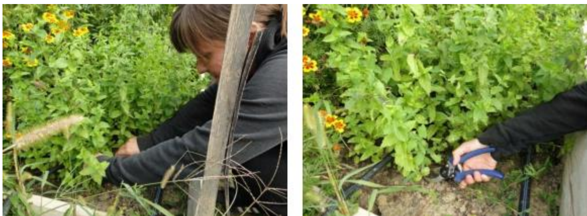
Slika 8. Berba mente