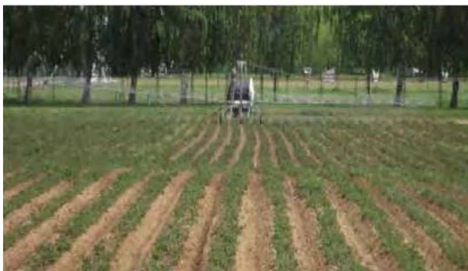
Slika 7. Navodnjavanje mente umjetnom kišom