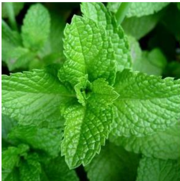
Slika 1. Biljka mente