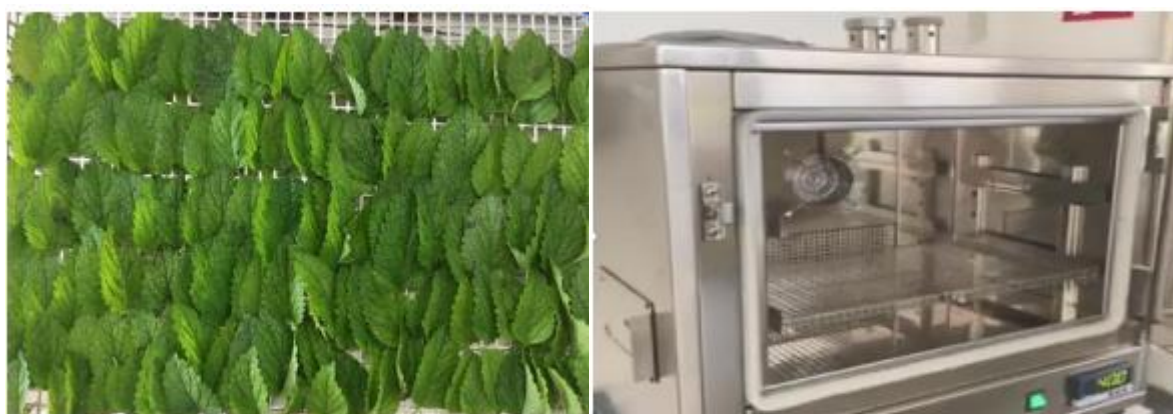
Slika 9. Prirodno sušenje i sušenje u laboratorijskim sušarama

Prema navodima Baričević (1996.) tehnologija sušenja mora biti prilagođena vrsti droge, jer se samo na taj način može osigurati željena kvaliteta proizvoda. Temperature sušenja kreću se od 35-65 °C. Cvijet i droge koje sadrže eterično ulje suše se na temperaturi 35-42 °C. Kuštrak (2005.) navodi da temperatura u termičkim sušarama ne smije biti iznad 60 °C jer se pri većim temperaturama smanjuje količina eteričnog ulja. Stepanović i sur. (2001.) navode da se od 5 kg mente prilikom sušenja dobiva 1 kg, također količina listova prilikom sušenja je 45 do 52 %.