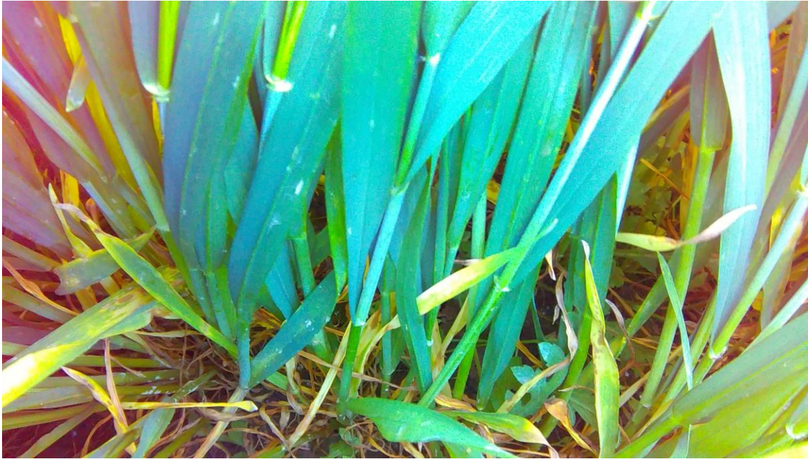
Slika 5. Simptomi B.graminis na listovima pšenice