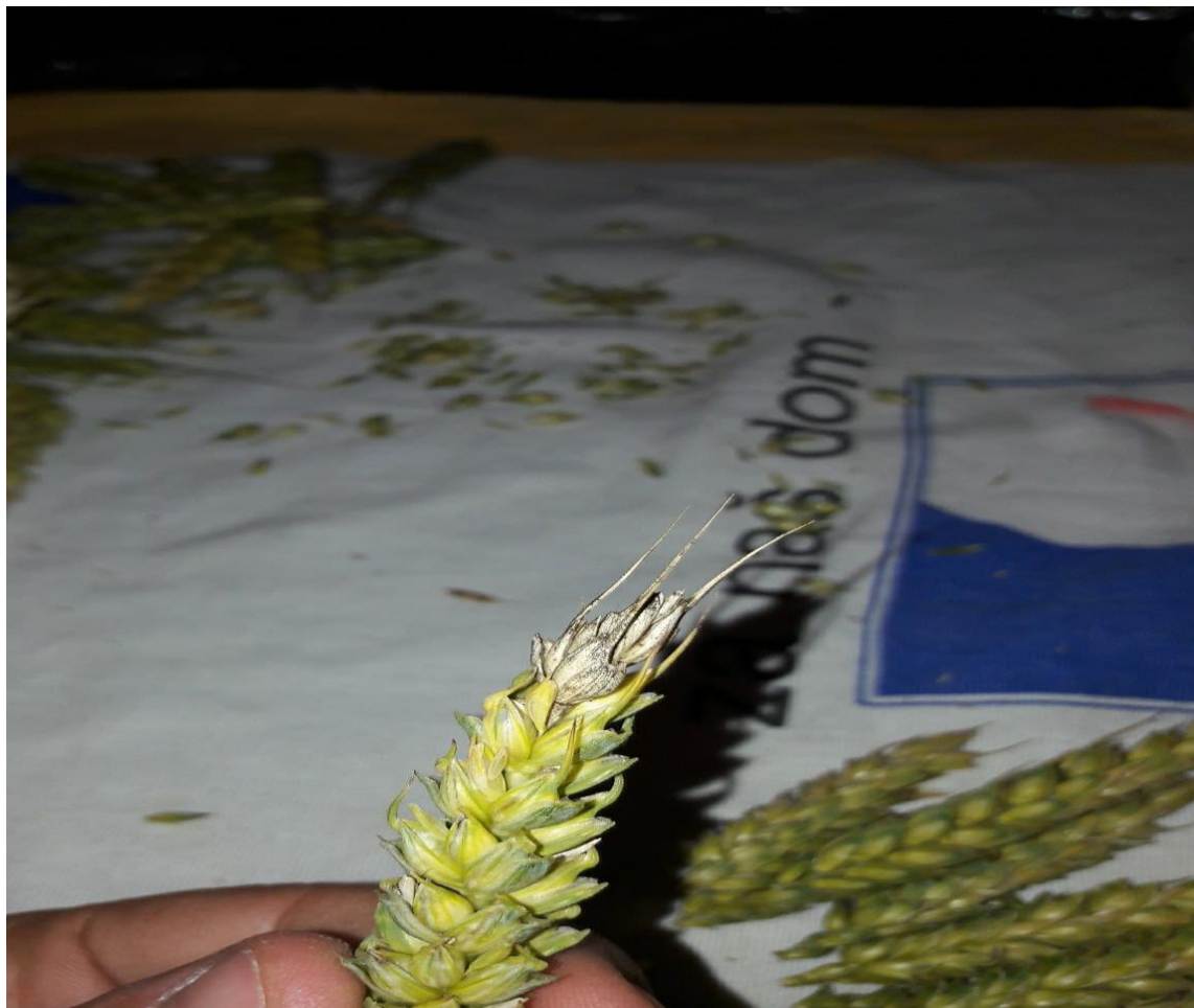
Slika 9. Palež klasa na pšenici

zraka na zaraženim klasićima formiraju se nakupine narančaste ili crvene boje, odnosno sporodohija koji se sastoje od konidiofora i konidija. Kasnije se na pojedinim klasićima i zrnima mogu razviti i samim time jasno uočiti plodišta, periteciji s askusima i askosporama.