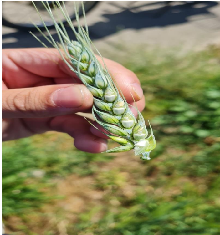
Slika 1. Formiranje zrna

Pšenica se u Hrvatskoj proizvodi na prosječno 150 000 do 170 000 ha (Brašnić, 2017.), a prosječan prinos je 4,7 t/ha, dok se ječam uzgaja na prosječno 50000 do 60000 ha sa prosječnim prinosom od 4 do 5.5 t/ha ( https://web.dzs.hr/ ).