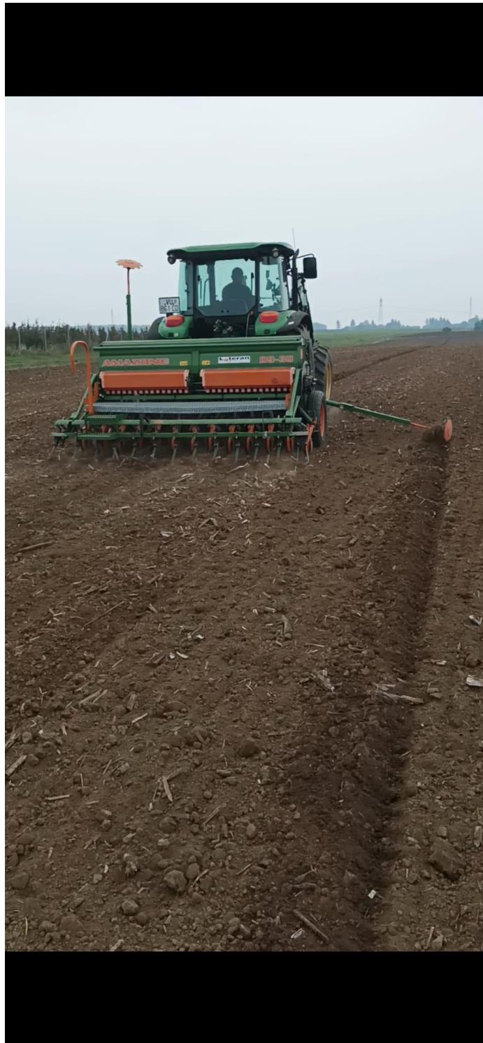
Slika 13. Sijačica Amazone