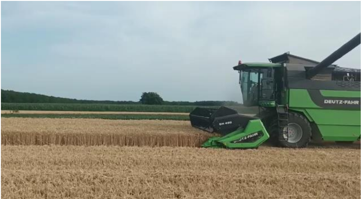
Slika 16. Žetva pšenice