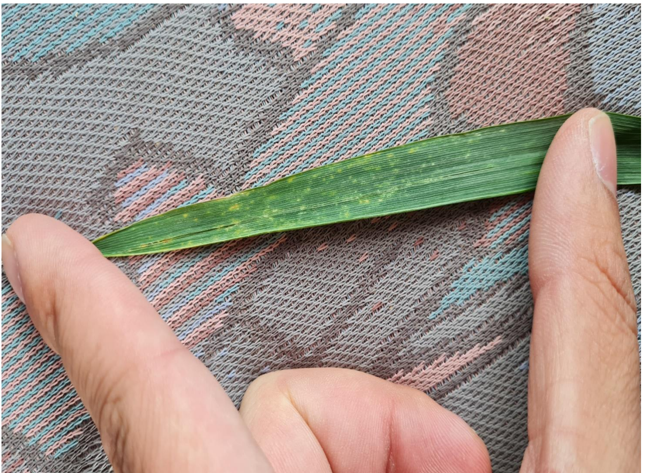
Slika 8. Simptomi žutosmeđe pjegavosti lišća

Pseudoteciji nastaju i dozrijevaju na slami tijekom jeseni i zime i uočavaju se u vidu crnih točkica. Askusi na gornjem dijelu su prošireni, a pri osnovi suženi (oblik toljage), imaju dvije opne i sadrže po osam askospora koje se oslobađaju u proljetnom dijelu uslijed kiša. Kada konidija ili askospora dospije na list klija u hifu koja inficira stanice epiderme direktno ili preko puči, te se zatim micelij širi intercelularno u mezofilnom staničju. Optimalne temperature za sazrijevanje pseudotecija su između 15 i 18 °C (Kader, 2010.). Optimalna temperatura je 20 °C uz vlaženje lišća, ali se bolest stalno razvija ako su temperature između 10 i 25 °C. Intenzitet bolesti naglo opada kada temperature prijeđu 27 °C.