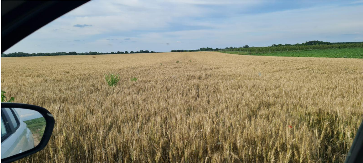
Slika 2. Razlika tretirane i ne tretirane pšenice