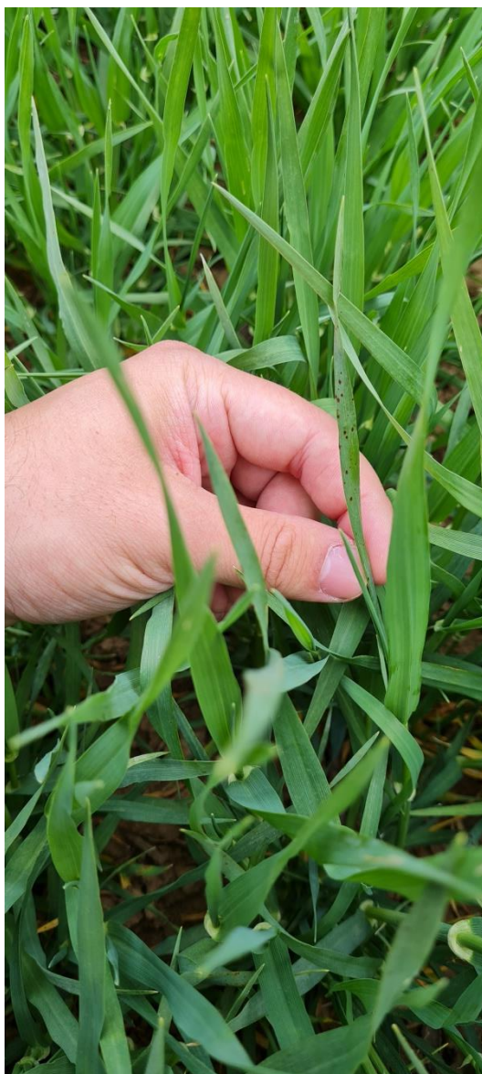
Slika 12. Simptomi P. teres

Uzročnik mrežaste pjegavosti ječma P. teres je heterotalična gljiva s višestaničnim i intercelularnim micelijem. Na ostacima ječma (u jesen) nakon kopulacije anteridija i askogona započinje stvaranje pseudotecija kruškolikog oblika koji se su smješteni subepidermalno kako bi lakše podnijeli niske temperature. Kako bi pseudotecij sazrio potrebna su mu oko 2 mjeseca s temperaturama između 10 i 15 °C (Jurković i sur., 2016.). Iz pseudotecija u rano proljeće se oslobađaju askospore (2-8) i vrše primarne infekcije, a ubrzo nakon njih zarazu započinju i konidije kojima se ostvaruju brojne sekundarne infekcije ukoliko to dozvoljavaju okolinski uvjeti. Unutar kratkog vremena obje vrste spora klijaju ako je vlaga visoka i traje barem 24 sata, a temperatura se kreće između 20 i 30 °C.