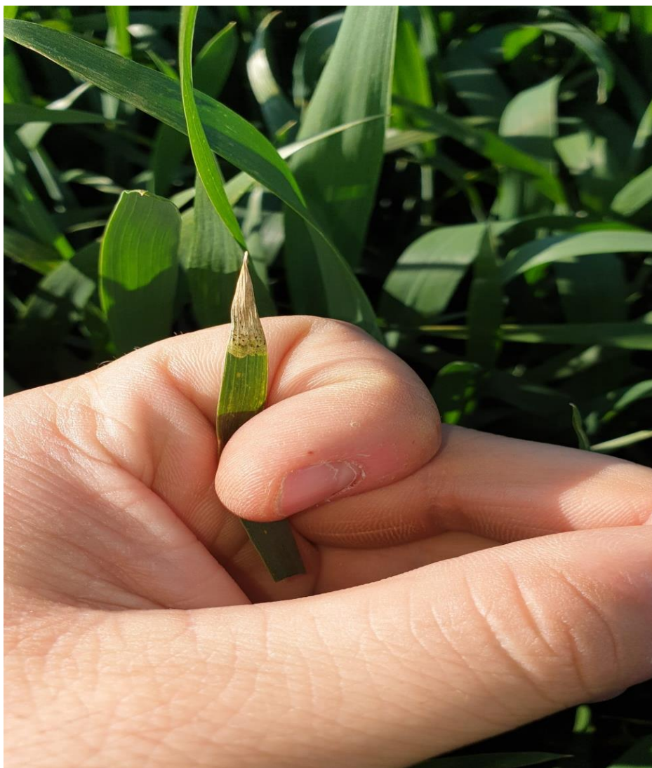
Slika 6. Pojava M.graminicola pri vrhu lista pšenice

Spolni stadij čine pseudoteciji s askusima i askosporama (Ćosić i sur., 2016.) koji se općenito smatraju manje važnim od nespolnog stadija, a u našim uvjetima pseudoteciji ne nastaju ili nisu utvrđeni. Nespolni ili anamorfn stadij su piknidi (slika 7.) s piknosporama/konidijama koji nastaju s obje strane lista i okruglastog su oblika, tamne boje. Veličina piknida varira ovisno o lokaciji, vremenu kada su formirani, biljnom organu te čak i starosti lišća. Optimalna temperatura klijanja je 20-25 °C, minimalna 2-3 °C, a maksimalna 33-37 °C. Ako su povoljni uvjeti piknidima je dovoljno pola sata ili više zadržavanja vlage na listu da puknu i izbace dvije vrste piknospora (mikro i makro) koje su sposobne izvršiti infekcije. U piknidima piknospore/konidije mogu ostati kljave više mjeseci (Eyal i sur. 1987.) i izvor su primarnih infekcija.