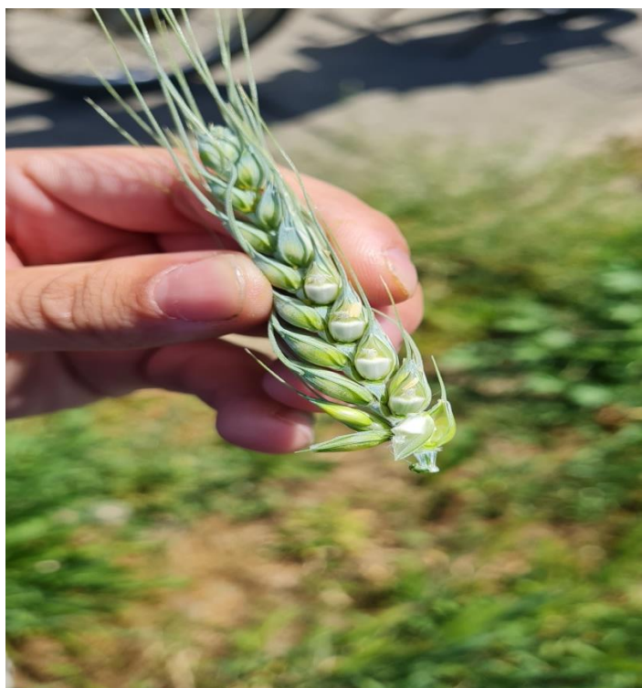
Slika 1. Formiranje zrna

Pšenica se u Hrvatskoj proizvodi na prosječno 150 000 do 170 000 ha (Brašnić, 2017.), a prosječan prinos je 4,7 t/ha, dok se ječam uzgaja na prosječno 50000 do 60000 ha sa prosječnim prinosom od 4 do 5.5 t/ha ( https://web.dzs.hr/ ).