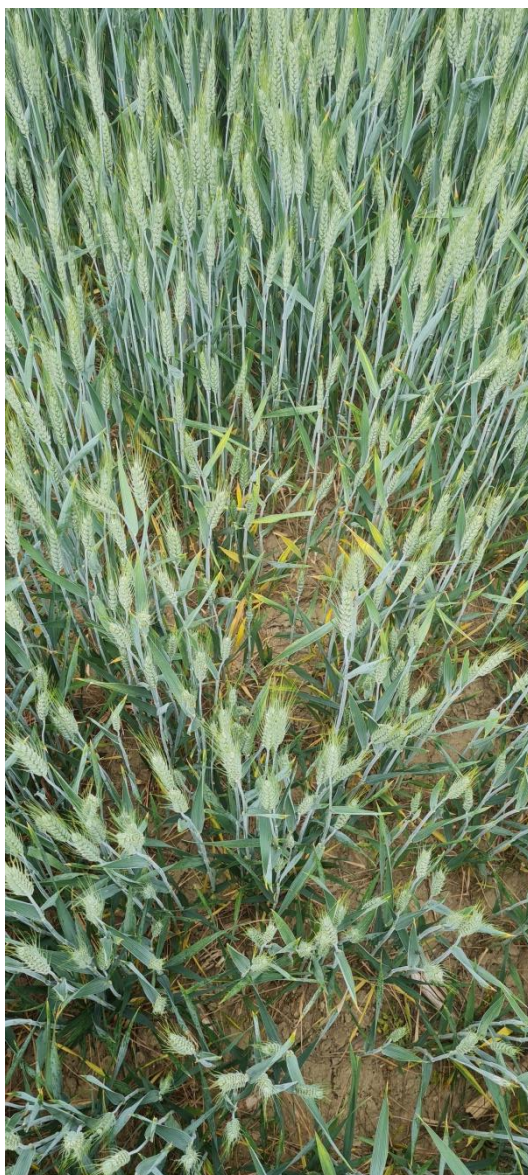
Slika 10. Simptomi virusa žute patuljavosti

BYDV se prenosi lisnim ušima na perzistentan način, ne mehanički. Pri prenošenju virusa neophodno je da se lisna uš hrani između 0,1 i 0,4 sata, a inkubacija odnosno vrijeme od usvajanja virusa pa do sposobnosti prenošenja virusa traje od 12 do 24 sata. Ovu vrstu virusa prenosi 20 vrsta lisnih uši, najznačajnije su ( Rhopalosiphum padi , R. maidis , Macrosiphum avenae , Schizaphis graminum ). Lisne uši (slika 11.) prezimljuju u odraslom obliku u žitima, a u proljeće su aktivne kao vektori. Infekcija može nastati tokom čitave vegetacije, najčešće u proljeće gdje prezimljuju vektori. Zarazu biljke pokazuju sistemično u periodu od 14 dana ako je temperatura 20 °C, a za 4 tjedna ako je temperatura 25 °C, dok