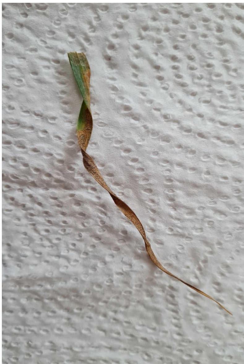
Slika 7. Piknidi na listu pšenice (izvor: Kalac B., 2022.)