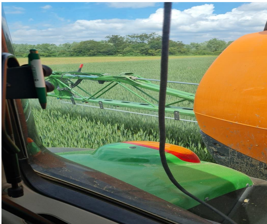
Slika 15. Prskalica Amazone