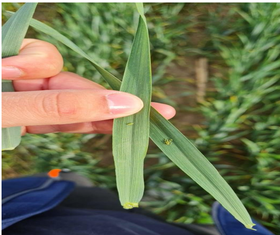
Slika 11. Lisne uši

iznad 30 °C nema pojave simptoma. Kao najbolje mjere suzbijanja preporučuju se: prilagodba sjetve sa najmanjom pojavom lisnih uši, tolerantniji kultivari, kontrola lisnih ušiju insekticidima (po potrebi i u jesen i u proljeće).