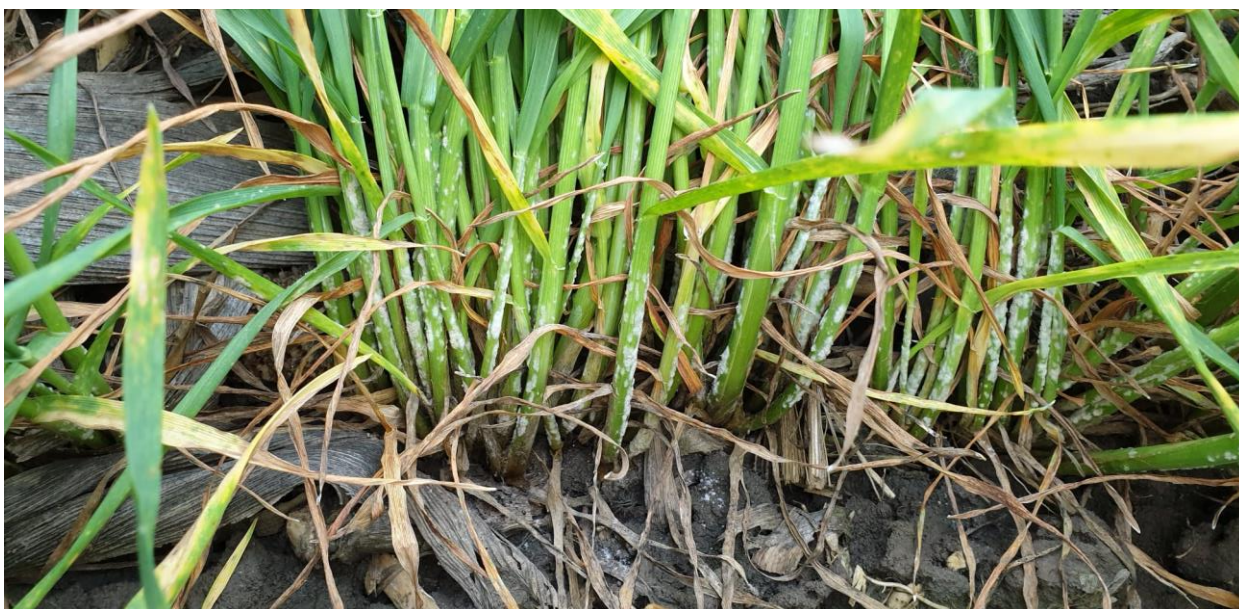
Slika 4. Pepelnica na pšenici

Blumeria graminis je uzročnik pepelnice (slika 4.) strnih žita koja se javlja svake godine, osobito na pšenici i ječmu koji imaju guste sklopove i kod obilne gnojidbe dušikom. Intenzitet pojave ove bolesti ovisi o tolerantnosti sorte, vremenu infekcije, agresivnosti patotipova i svakako provedenim kemijskim mjerama suzbijanja i agrotehnici. Rano zaražene biljke slabije busaju i imaju usporen rast vlati i manji broj klasova, te smanjen rast korijen do 50%. U nekim su godinama štete iznosile 30 do 42 % (Korić cit. Cvjetković 2003.) pa je primjena fungicida bila opravdana.