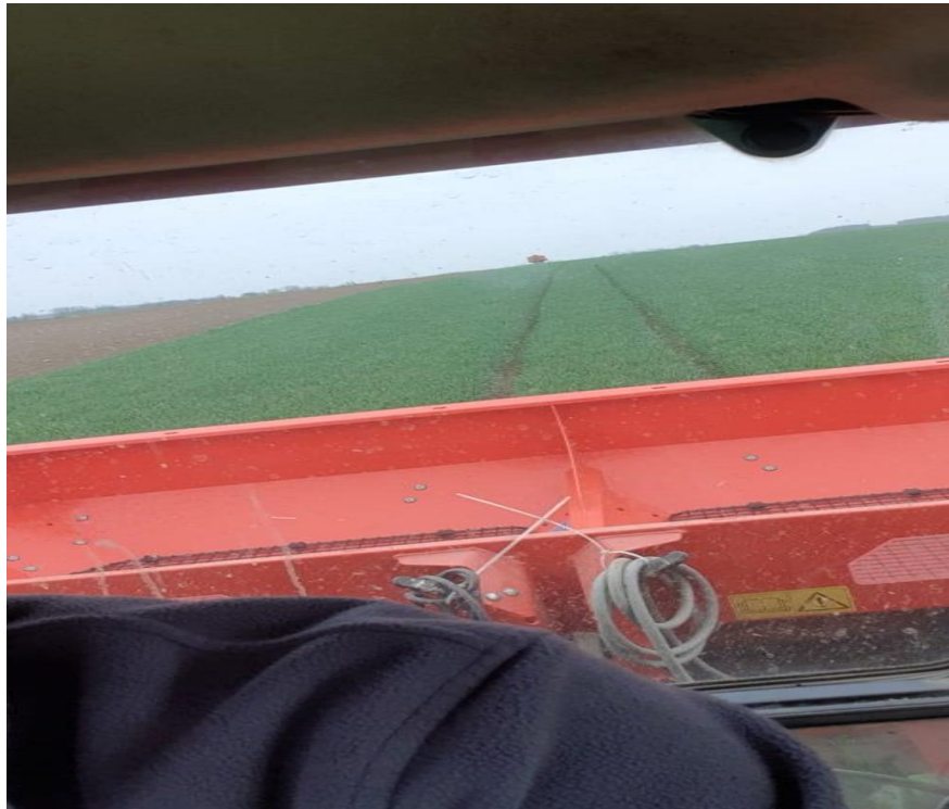
Slika 14. Rasipač Rauch