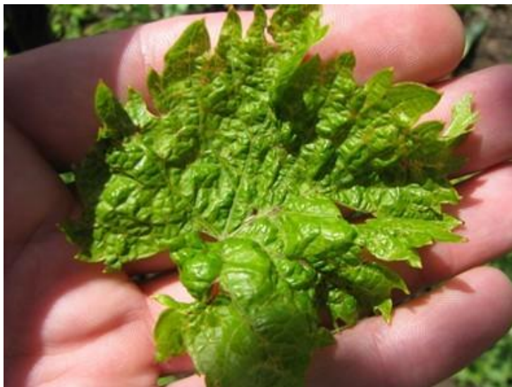
Slika 12. Simptomi akarinoze na listu