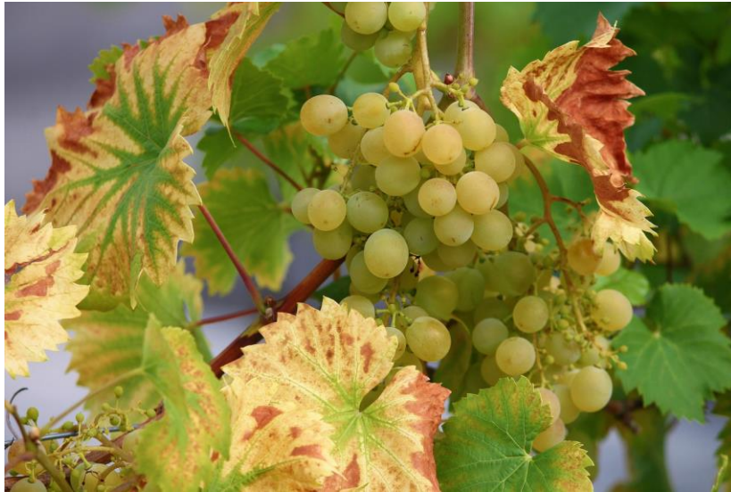
Slika 2. Simptomi plamenjače na lišću