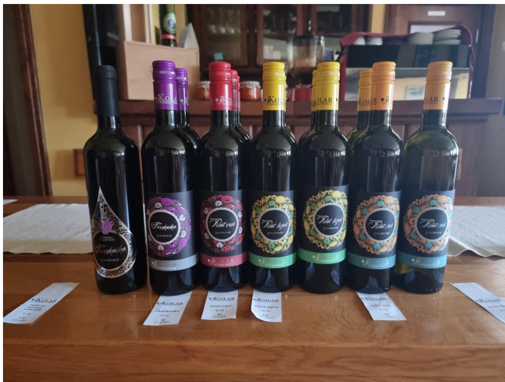
Slika 1. Kolekcija vina OPG-a Kolar