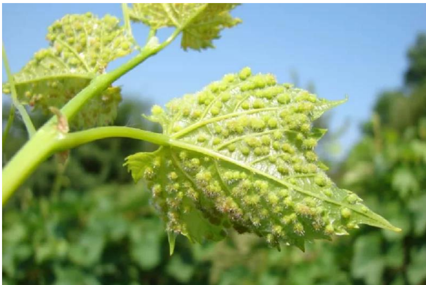
Slika 14. Simptomi filoksere na listu