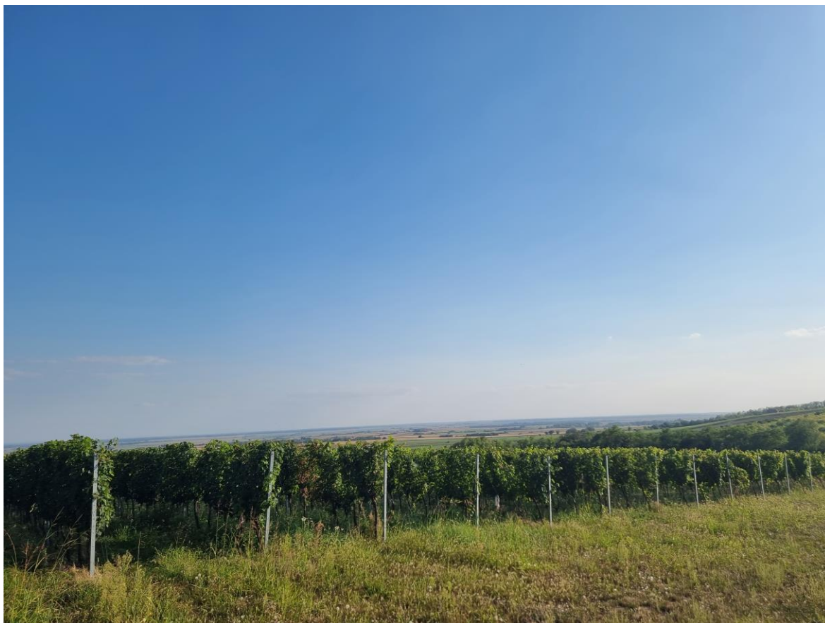
Slika 15. Vinograd OPG – a Kolar na Banskome brdu

Za izradu diplomskog rada, istraživanje je provedeno u vinogradu koji je u vlasništvu OPG Kolar, u Suzi, u trajanju od travnja do kolovoza 2022. godine. Tijekom vegetacije praćena je i bilježena pojava bolesti i štetnika u vinogradu te je provedena i zaštita protiv istih.