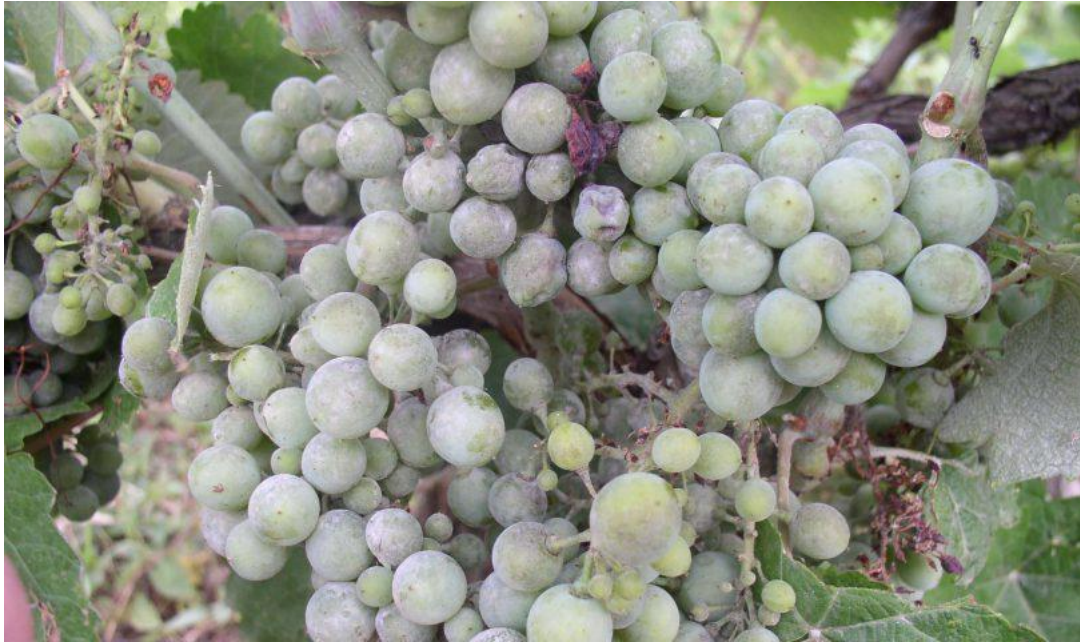
Slika 3. Simptomi pepelnice na grozdu