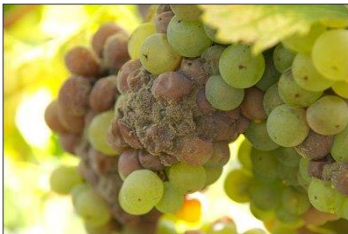
Slika 4. Simptomi sive plijesni na grozdu

bolest napreduje, dolazi do truljenja boba. Ovakva situacija može značajno smanjiti prinos i kvalitet grožđa (Cvjetković, 2010).