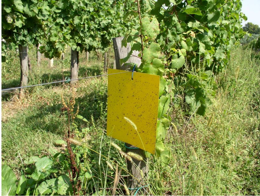
Slika 7. Žuta ljepljiva ploča za praćenje brojnosti američkog cvrčka