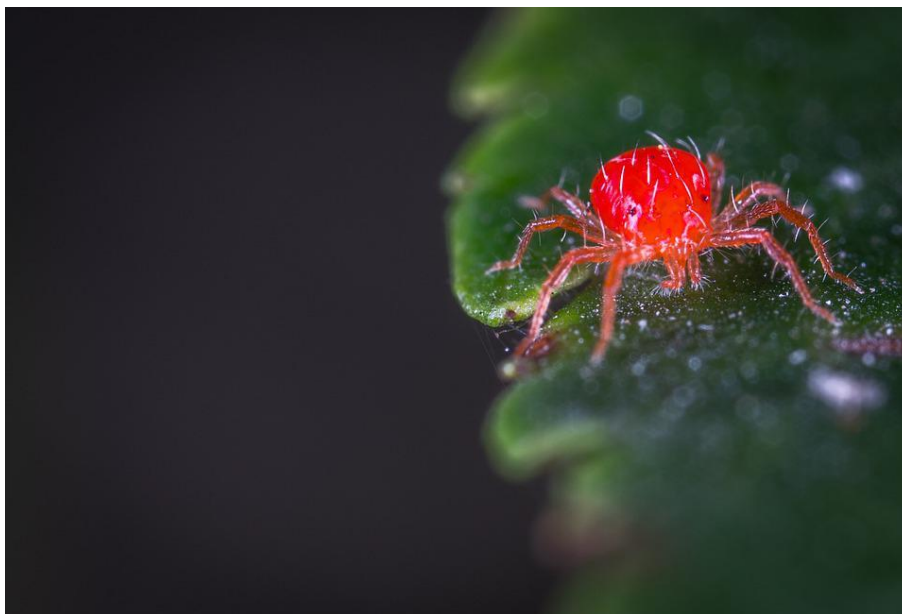
Slika 11. Crveni voćni pauk

boje, veličine oko 0,5 mm. Njegova prepoznatljiva boja i sitni detalji čine ga lako uočljivim na lišću voćaka (Slika 11.).