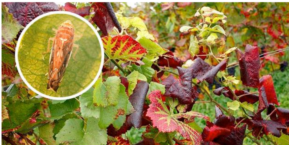
Slika 6. Simptomi i vektor zlatne žutice

uvijanje izdanka, neravnomjeran razvoj grozdova, te zastoj u sazrijevanju bobica. Zlatna žutica može značajno smanjiti prinos grožđa i oštetiti kvalitetu grožđa (Cvjetković, 2010).