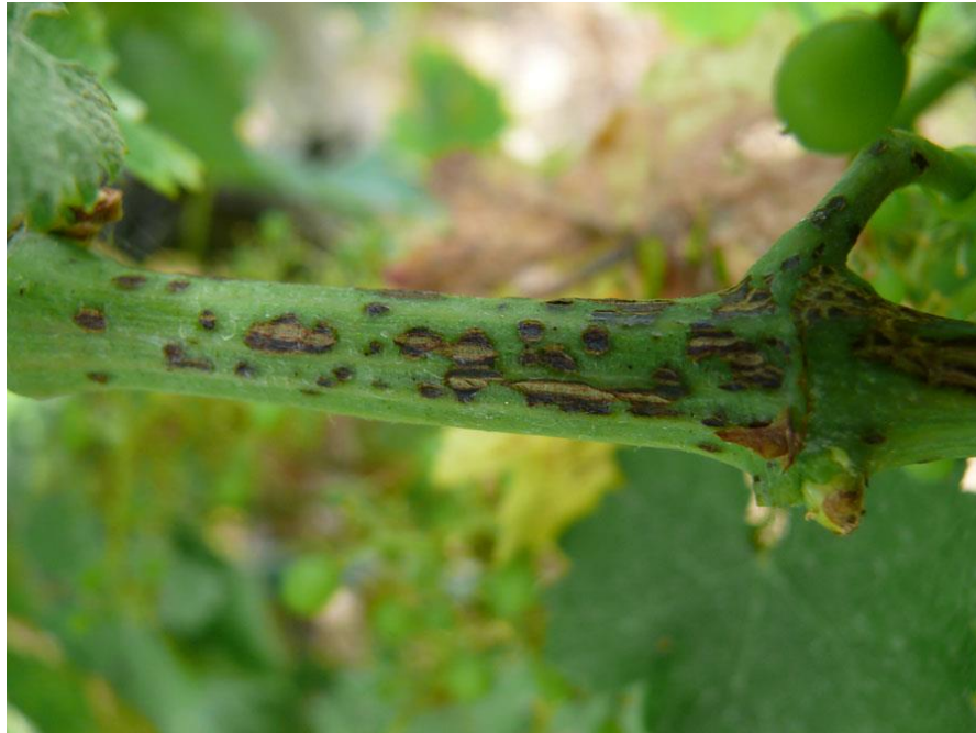
Slika 5. Simptomi crne pjegavosti rozgve

propadanja lišća i smanjenja fotosinteze. U kasnijim fazama infekcije, lišće se suši i opada. Na peteljka i grozdovima, pojavljuju se tamne pjege koje se mogu širiti prema bobicama (Slika 5.). Ova infekcija može uzrokovati opadanje grozdova i smanjenje prinosa. Bobice koje su zahvaćene mogu postati oštećene, suhe i krnje (Marić Ivandija i Ivandija, 2013).