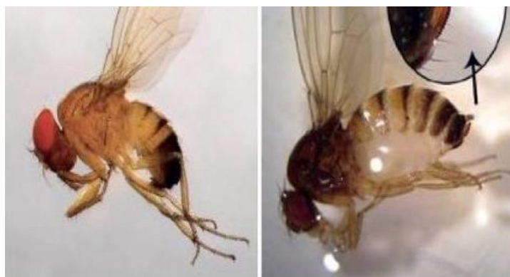
Slika 8. Mužjak (lijevo) i ženka (desno) octene mušice ploda

ovalnog oblika. U idealnim uvjetima može imati i do 15 generacija godišnje. Štetnik prezimljuje na zaštićenim mjestima kao imago, premda u povoljnim uvjetima može biti aktivan cijelu godinu.