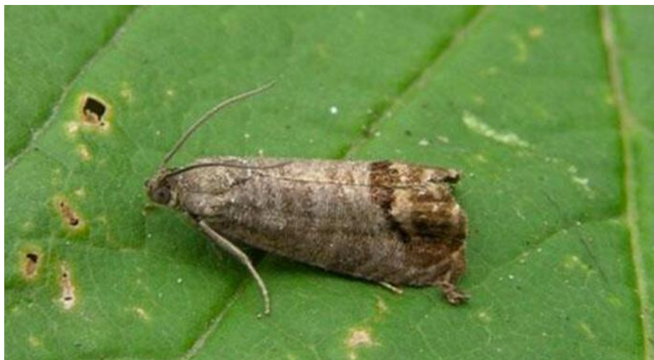
Slika 9. Pepeljasti grozdov moljac

Pepeljasti moljac (Slika 9.) je leptir svjetlosivog tijela koji se naglo javlja, godinu – dvije i naglo nestaje. Ima 3 – 4 generacije godišnje. Žuti moljac (Slika 10.) je žuto – crne boje, pravi slične ali puno manje štete od pepeljastog moljca i za razliku od njega, on ima 2 generacije godišnje. Oba moljca prezimljuju ispod kore čokota kao kukuljica u bijeloj čahurici. Gusjenice se uvlače u cvjetove te ih izjedaju, a poslije cvatnje zapredaju gnijezda. Prvi jasan znak prisustva štetnika je „paučina” u grozdovima i čitavi dijelovi grozda mogu biti uništeni te je potrebno čim se primijeti, izvršiti prskanje grozda s organofosfornim preparatima, a po potrebi i ponoviti tretiranje.