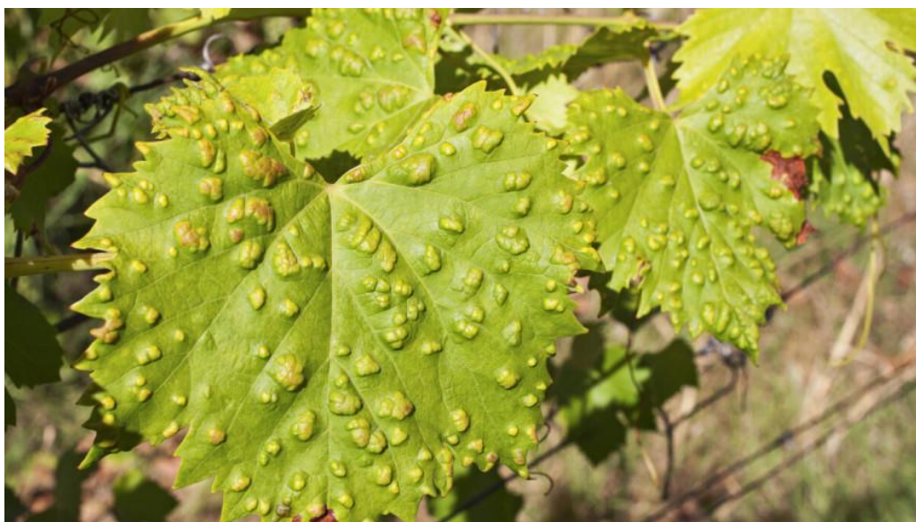
Slika 13. Simptomi erinoze na licu lista loze