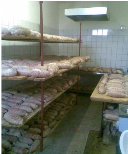
Slika 2. Prerada O.P.G. Mađarević

Obiteljsko gospodarstvo je započeo s prvim fazama testiranja tržišta kod prerade i prodaje suhomesnatih proizvoda, s ograničenim kapacitetima. Na Slici 2 se može vidjeti dio prerađevina i priprema svježeg mesa za suhomesnate proizvode.