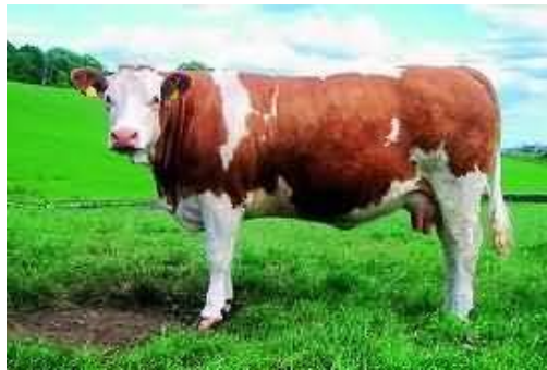
Slika 3. Simentalac govedo

Proizvodni vijek u intenzivnom iskorištavanju traje 5 do 7 godina, pa je simentalac relativno dugovječan odnosno ustrajan u proizvodnji. S obzirom na njegovu osrednju dnevnu proizvodnju od 16-20 l, potrebe za krepkom krmom su minimalne. Simentalac je osobito poznat po sposobnosti proizvodnje kvalitetnog mesa. ( Caput, 1996.).