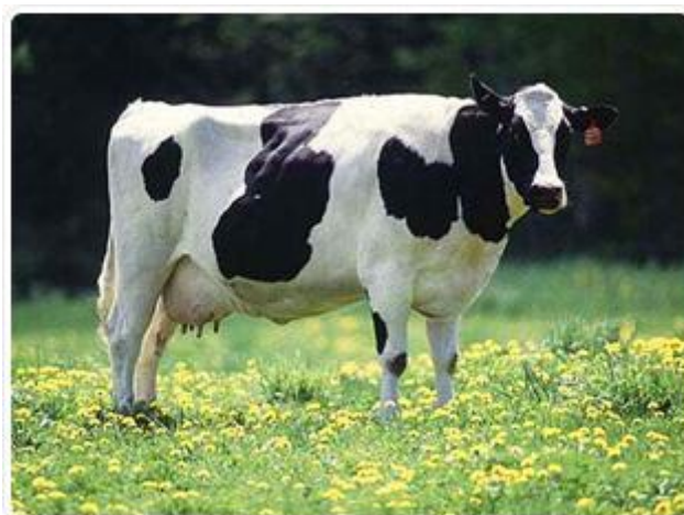
Slika 2. Holstein – friesien

Iz prikazanih pokazatelja proizvodnosti proizlazi da postojeći genetski potencijal mliječnih goveda u Hrvatskoj nije u potpunosti iskorišten. No osim što u daljnjem razvoju treba promišljati o poboljšanjima managementa kako bi se iskoristili postojeći potencijali, nužno je kod osmišljavanja novih proizvodni jedinica odrediti se prema optimalnoj genetskoj osnovi.