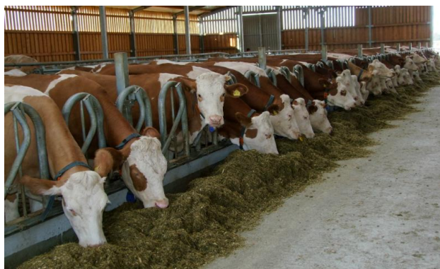
Slika 1: Hranidba muznih krava