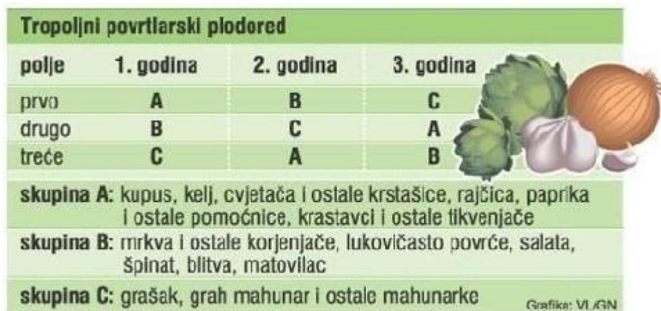
Slika 4. Povrtlarski plodored