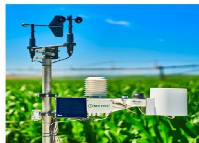
Slika 3. iMetos aparat za prognozu.

Velik napredak općenito za poljoprivredu, ali i za povrćarstvo postignut je drugom polovicom prošlog stoljeća kada su se uvela pomagala i aparati za prognozu. U Hrvatskoj se od aparata najčešće koriste iMetos (slika 3) i Pinova Meteo.