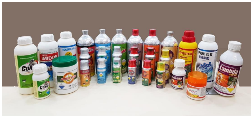
Slika 2. Kemijska sredstva za zaštitu