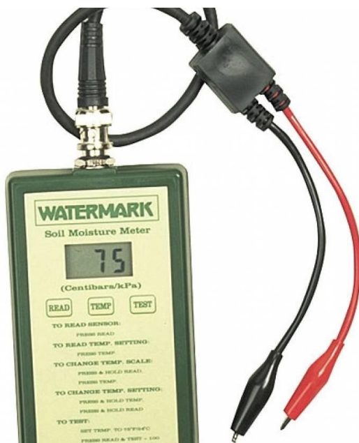
Slika 6. Digitalni uređaj za mjerenje vlage

Jedan od čimbenika koji utječu na razvoj bolesti je vlaga. Iz tog razloga je važno da sustavi prozračivanja budu kvalitetni, učinkoviti i da se vodi računa o njihovoj ispravnosti. Vlažnost tla i zraka se kontrolira posebnim aparatima (slika 6). Ako se ne vodi konstantna briga o razini vlage može doći do neželjene kondenzacije i kapanja vode po biljkama.