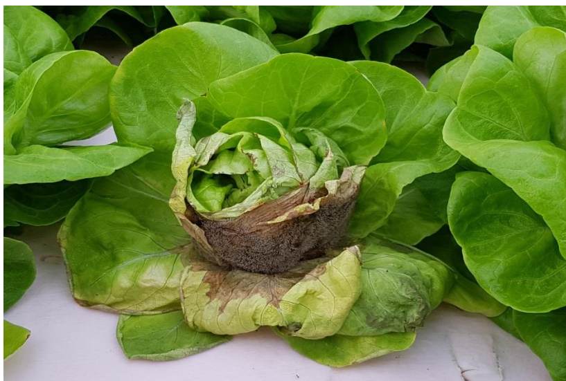
Slika 14. Simptomi sive plijesni na salati

Jedna od čestih bolesti koja se javlja na salati je siva plijesan čiji je uzročnik gljiva Botrytis cinerea . Ovaj uzročnik napada korijenov vrat, stabljiku i starije lišće. Simptomi zaraze ovom gljivom su pojava smeđih pjega na listovima (slika 14) i pojava karakteristične bujne sivkaste, paučinate prevlake konidiofora i konidija (slika 15). Za razvoj ovog patogena potrebna je visoka vlažnost zraka i niže temperature što je često u negrijanim zaštićenim prostorima. Glavni ograničavajući čimbenik za razvoj bolesti je relativna vlaga zraka budući da pri vlazi ispod 91 % nove zaraze ne nastaju. B. cinerea je brzo rastuća i vrlo agresivna gljiva koja u zaštićenim prostorima može prezimiti kao micelij u biljnim ostacima, a na otvorenom može prezimiti kao micelij u tlu i biljnim ostacima. Ako je bolest već uznapredovala salata će se početi sušiti i na kraju potpuno uvenuti i propasti.