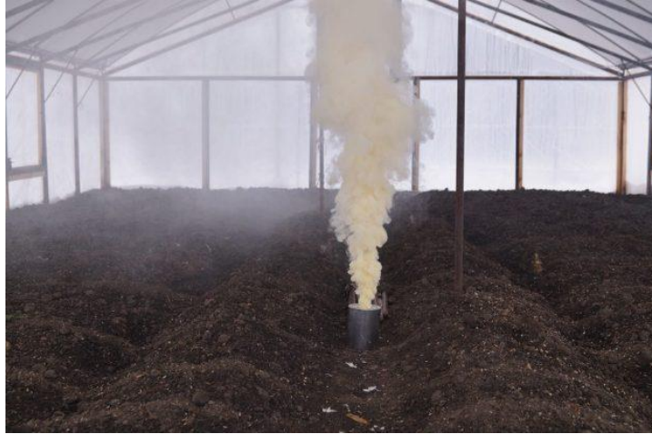
Slika 7. Termička dezinfekcija tla