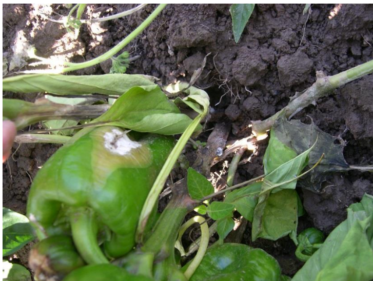
Slika 12. Bijela trulež na paprici

Jedan od čestih uzročnika bolesti kod paprike je gljivica Sclerotinia sclerotiorum koja uzrokuje bijelu trulež. Ova bolest se javlja na stabljici paprike i to najčešće u razini s tlom. Prepoznatljiva je po vodenastoj izduženoj pjegi na kojoj se za vlažnih uvjeta razvija bijeli gusti micelij. U tom miceliju se razvijaju crni sklerociji. Listovi koji se nalaze iznad napadnutog mjesta postepeno gube čvrstoću i na kraju se suše. Zaraza se može uočiti i na plodovima paprike (slika 12) koji postaju mekši i vodenastiji te za povoljnih uvjeta vlage i temperature vrlo brzo potpuno propadaju.