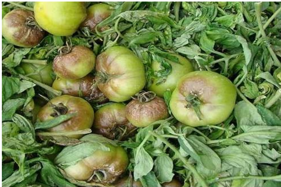
Slika 11. Plamenjača na plodovima rajčice