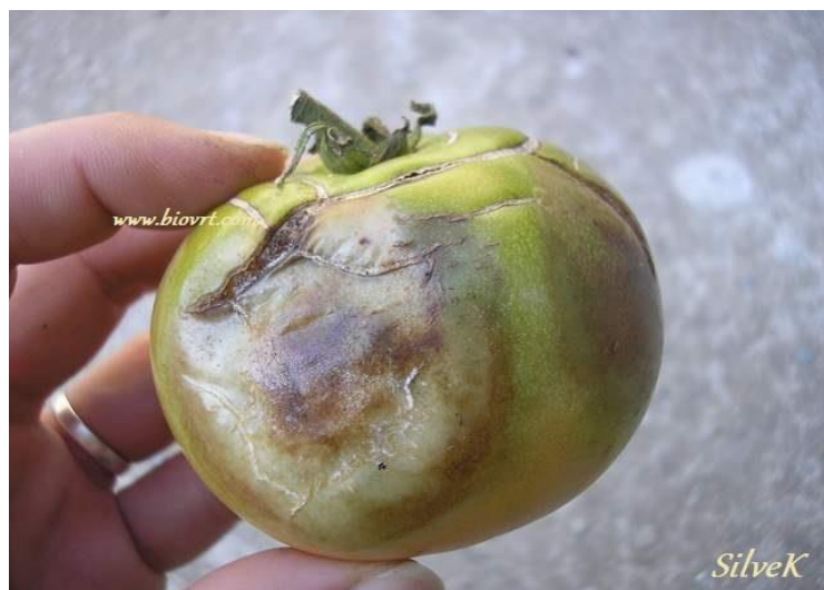
Slika 5. Odstranjeni zaraženi plod

U mehaničke mjere zaštite pripadaju sve mjere u kojima se primjenjuje mehanička sila, a to su zaoravanje biljnih ostataka, kultivacija, okopavanje, orezivanje, odstranjivanje zaraženih listova i plodova (slika 5). U slučaju većeg širenja bolesti zaražene biljke je potrebno potpuno ukloniti iz područja uzgoja. Takve biljne ostatke je preporučljivo zakopati u tlo na što je moguće veću dubinu i što dalje od proizvodne površine, odnosno na površinu koja se sigurno neće u narednih nekoliko godina koristiti za uzgoj poljoprivrednih kultura.