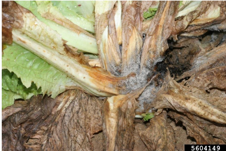
Slika 15. Siva plijesan na salati