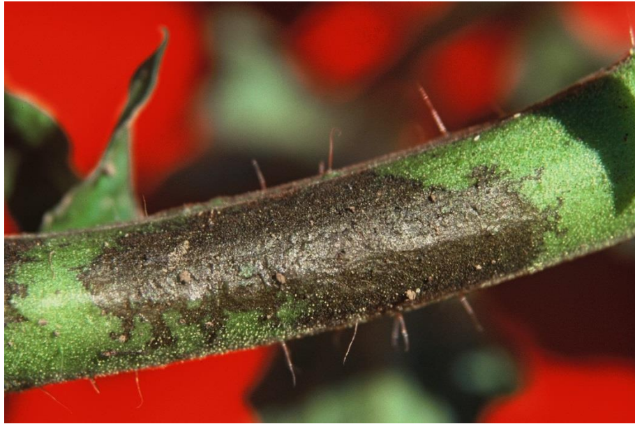
Slika 10. Plamenjača na stabljici rajčice