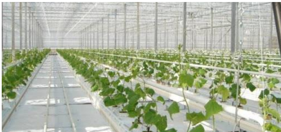
Slika 8. Hidroponski uzgoj krastavaca

Hidroponski uzgoj (slika 8) predstavlja uzgoj povrća u zaštićenim grijanim prostorima u hranjivoj otopini (sa ili bez supstrata). Ovim načinom moguć je kontrolirani uzgoj tijekom cijele godine. Za proizvodnju u hidroponima potrebna su velika ulaganja u automatiziranu opremu, posebna gnojiva i supstrati (npr. kamena vuda, vermikulit, perlit rižine ljuske, vlakna kokosa) koji moraju biti visoko kvalitetni. Ishrana biljaka vodotopivim gnojivima se provodi pomoću sustava za navodnjavanje kap po kap .