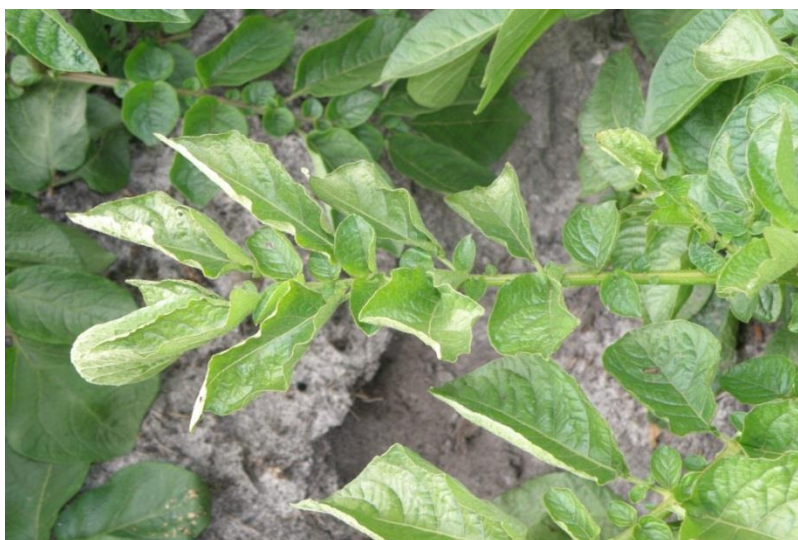
Slika 13. Uvijenost listova krumpira

Osim krumpira domaćini ovom virusu su i neke druge kultivirane i korovne vrste iz porodice Solanaceae no one nemaju značaj u epidemiologiji.