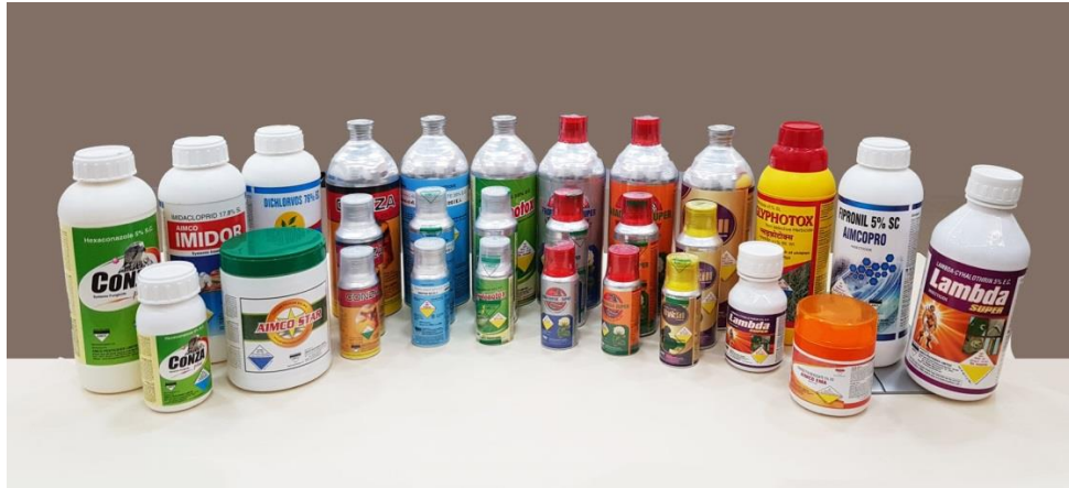
Slika 2. Kemijska sredstva za zaštitu