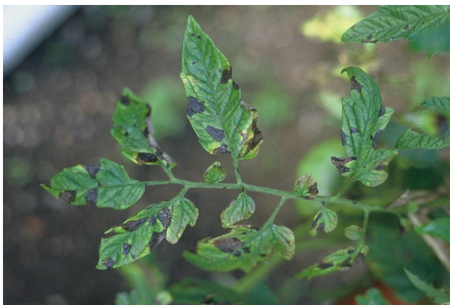
Slika 9. Plamenjača na listovima rajčice

Najčešća bolest kod uzgoja na otvorenom te u plastenicima u kojima se rajčica uzgaja u tlu je plamenjača čiji je uzročnik pseudogljivica Phytophthora infestans . Ona napada sve nadzemne organe kod rajčice, odnosno stabljiku, listove i plodove. Prvi simptomi su uočljivi na listovima. Na početku razvoja bolesti dolazi do nastanka nepravilnih svijetlo sivih do svijetlo smeđih pjega na rubovima i vrhovima listova. Te pjege prvo postaju vodenaste, a zatim potamne (slika 9) te se plojke listova počnu sušiti, a peteljke ostaju duže vrijeme zelene. Ukoliko je vlažnost zraka 60 do 90 % i temperatura 18 do 22 °C na donjoj strani listova može doći do pojave prljavo bijele prevlake sporonosnih organa. Na stabljici se pojavljuju tamne pjege koje su eliptičnog oblika (slika 10). Na još zelenim plodovima dolazi do pojave tamnijih, udubljenih pjega kožastog izgleda (slika 11).