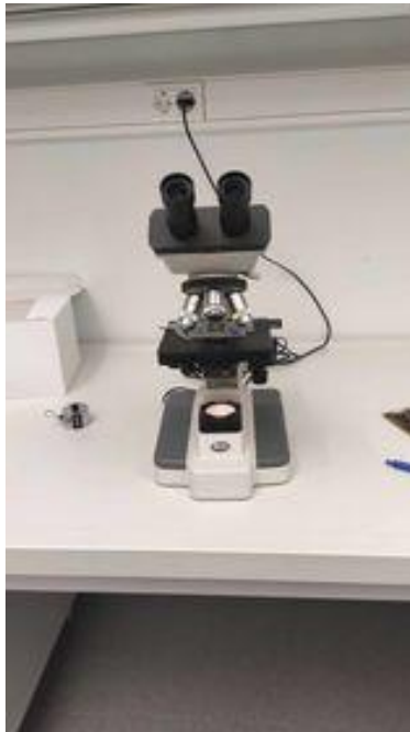
Slika 11. Mikroskop

Kada smo priredili uzorke na stakalca stavljamo ih pod mikroskop pod uvećanje od 400 puta.