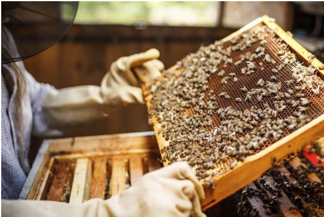
Slika 1. Košnica

Zdravu pčelinju zajednicu možemo prepoznati već po samoj aktivnosti ispred košnice, iako ćemo najprije primijetiti simptome neke bolesti kada pogledamo unutar košnice. Potrebno je obratiti pozornost na samu veličinu pčelinje zajednice, ima li zajednica maticu i u kakvome je stanju leglo u toj košnici. Još jedan način provjere je obratiti pozornost na neugodne mirise, pravilnost saća, količina meda, te ima li izmeta po košnici ili nečega što inače nismo zapažali.