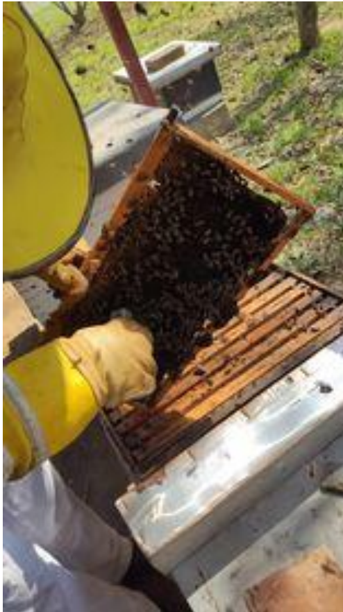
Slika 4. Prikupljanje uzoraka

U svrhu završnog rada provedeno je istraživanje na dva pčelinjaka te laboratorijska pretraga pčela na prisutnost spora nozemoze. Prikupljeno je 35 uzoraka to jest 10 falcon epruveta sa jednog pčelinjaka te 25 s drugog pčelinjaka (slika4.), a prikupljanje je obavljeno dva puta u svrhu praćenja razvoja bolesti.