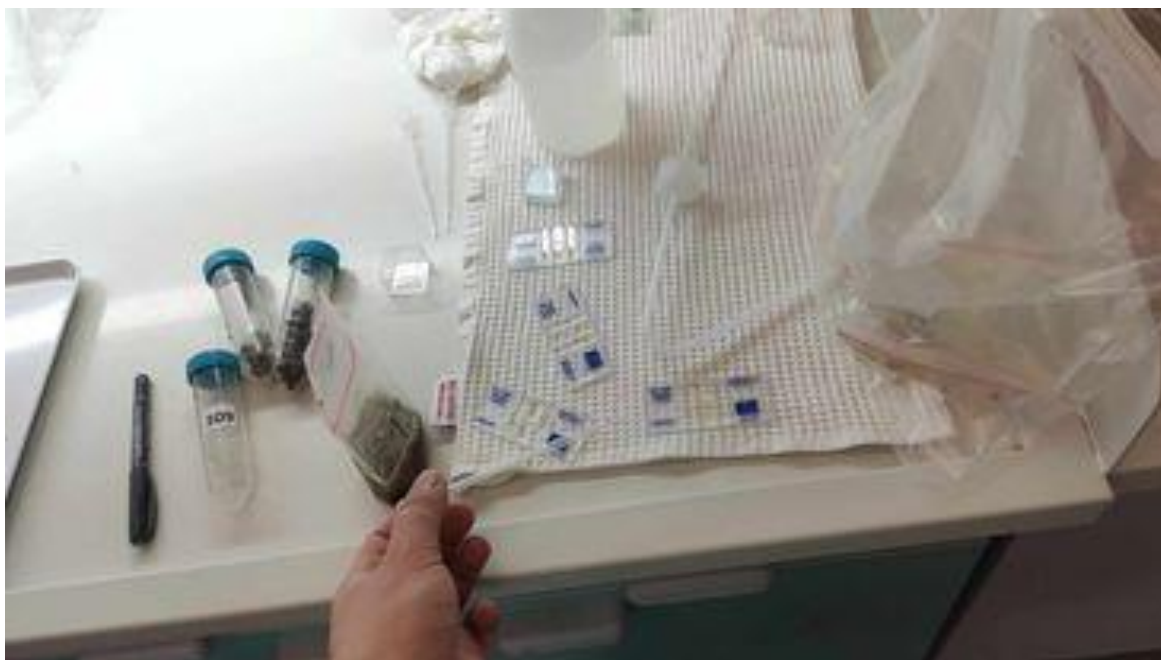
Slika 10. Stavljanje uzorka pipetom na hemocitometar

Kada je preparat na ovaj način pripremljen, pipetom pažljivo uzimamo kap preparata te stavljamo na hemocitometar te pokrivamo pokrovnim stakalcem.