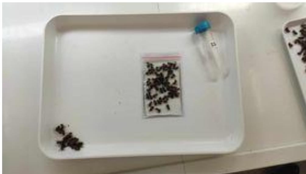
Slika 8. Prebrojane pčele u destiliranoj vodi

Nakon što smo prebrojali pčele te ih odvojili, dodajemo destiliranu vodu te ih meljemo sa tučkom kako bi došli do sadržaja crijeva.