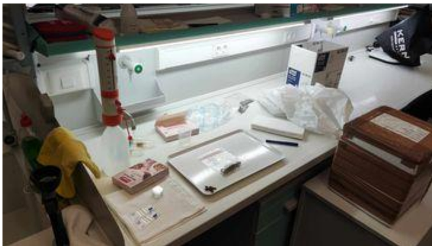
Slika 7. Oprema za rad