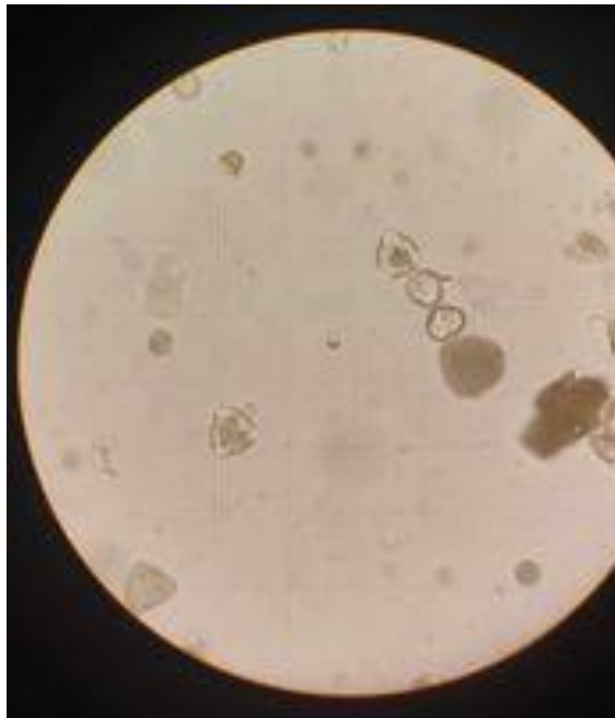
Slika 2. Spore Nozemoze pod mikroskopom

Bolest se javlja tako što ju pčela unese u sebe hranjenjem prilikom sakupljanja izvan košnice. Spore sazrijevaju u središnjem crijevu pčele te se aktiviraju i uništavaju epitel samoga crijeva. Pčele koje su zaražene nozemozom pokazuju čitav niz simptoma kao što su smanjivanje odlazaka iz košnice u svrhu prikupljanja, drhtanje krila i proljev. Nakon što nozemoza oslabi zajednicu ta pčelinja zajednica je izložena većem riziku od drugih nametnika kao što su Varroa zbog lošeg imuniteta, također šanse da zajednica preživi zimu te da nastavi s normalnom proizvodnjom su sve manje (Tlak Gajger, 2017.).