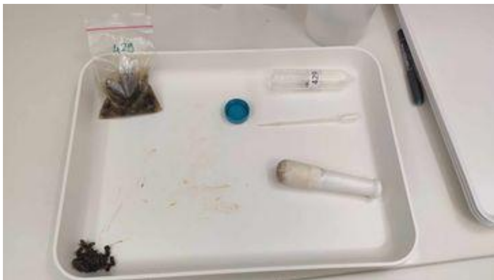
Slika 9. Pripremljeni preparat u vrećici