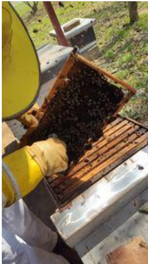
Slika 4. Prikupljanje uzoraka

U svrhu završnog rada provedeno je istraživanje na dva pčelinjaka te laboratorijska pretraga pčela na prisutnost spora nozemoze. Prikupljeno je 35 uzoraka to jest 10 falcon epruveta sa jednog pčelinjaka te 25 s drugog pčelinjaka (slika4.), a prikupljanje je obavljeno dva puta u svrhu praćenja razvoja bolesti.