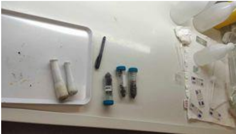
Slika 6. Falcon epruvete i sterilna podloga

Prvi korak u laboratoriju je bio prebrojati pčele kako bi u svakom uzorku koristili jednak broj. Iz pojedinačnih falcon epruveta istresamo mrtve pčele na sterilnu podlogu gdje brojimo te ih odvajamo za daljnji korak to jest gnječenje.