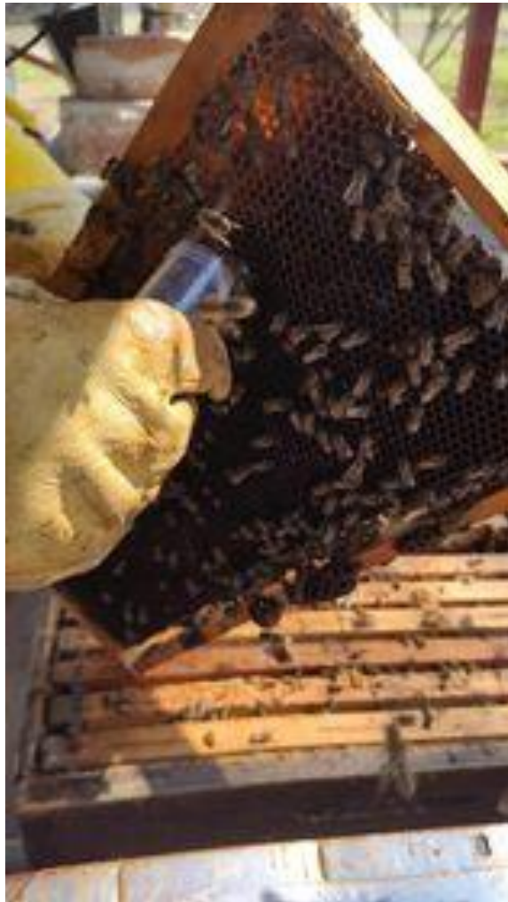
Slika 5. Prikupljanje uzoraka u falcon epruvete

Uzorke smo prikupili sa dva različita pčelinjaka, na jednom pčelinjaku uzeli smo 10 falcon epruveta uzoraka a na drugom 25. Za početak košnice smo lagano izdimili kako bi smirili pčelinje zajednice te u falcon epruvetu koja je označena brojem košnice laganim struganjem nakupili pčele. Uzorke smo razdvojili kako se ne bi pomiješali te ih stavili u zamrzivač kako bi uspavali i bezbolno ubili pčele koje ćemo poslije daljnje analizirati u laboratoriju.