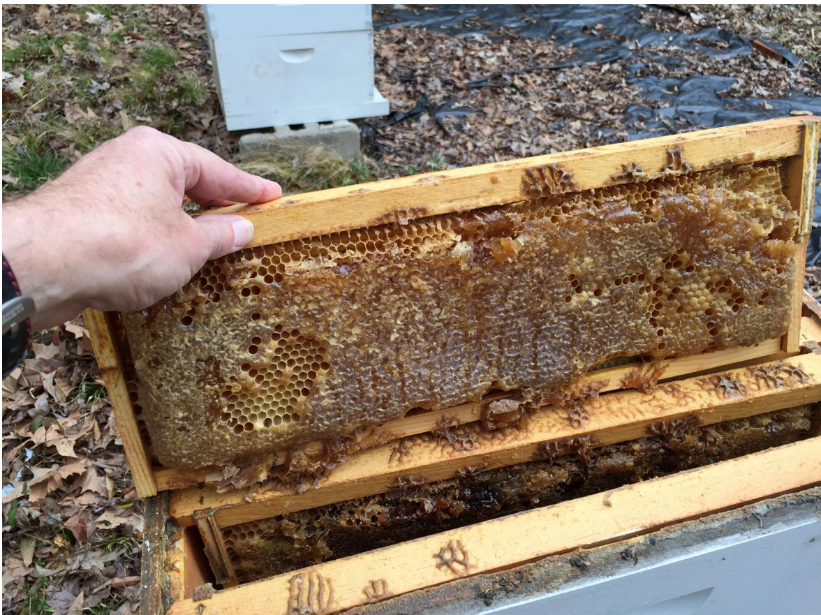
Slika 3. CCD

Posljednjih nekoliko godina veliki problem u pčelarstvu je nestajanje pčelinjih zajednica (CCD). Pojava nije uzrokovana novim uzročnikom već je pojava potvrđena u zajednicama gdje su pronađeni V. destructor , nozemoza, virusi i bakterije. Također neki od krivaca su loša pčelarska praksa, nepravilna hranidba te pesticidi. Za CCD je karakteristično brzo nestajanje pčela radilica, malo ili nimalo uginulih pčela u košnici, uginula zajednica ali ostavljeno leglo, mala zimska klupka u kojoj je matica i nepotrošene rezerve meda i peludi u košnici. Pretpostavlja se da su uzročnici varooza, pesticidi, novi način hranidbe, akumuliranje lijekova protiv varooze u vodi, manja bioraznolikost, globalno zagrijavanje, stres prilikom selidbe, nepravilno liječenje i loša pčelarska praksa (Matašin, 2012.).