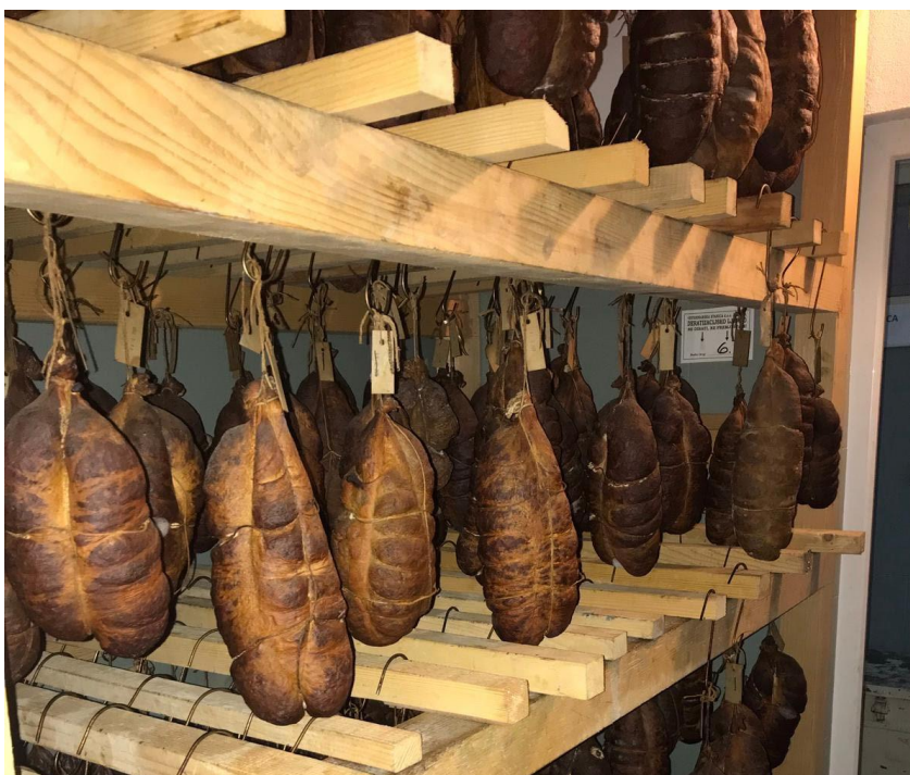
Slika 7. Kulen tijekom zrenja

Nakon dimljenja kulena u pušnici kulen se premješta u prostoriju za zrenje gdje se nalazi uređaj koji mjeri temperaturu i relativnu vlažnost zraka, temperatura u prostoriji tijekom zrenja treba biti 8-15°C, a relativna vlažnost zraka treba biti manja od 85%. Nakon što završi zrenje proizvod je spreman za tržište. Važno je naglasiti da tijekom proizvodnje kulena na površini proizvoda nastaju plijesni koje nisu plemenite te, ukoliko se ne čiste s proizvoda, uzrokuju umanjeње tehnološke kvalitete proizvoda u smislu njegova površinskog izgleda, mirisa te okusa, a mogu utjecati i na njegovu zdravstvenu ispravnost jer se truljenjem proizvoda razvijaju mikotoksini. Plijesni se nalaze u obliku spora u zrionici, a najčešće potiču s okolnih njiva. Njihovu pojačanom razmnožavanju pogoduju visoke temperature i vlažnost tijekom ovog dijela proizvodnog procesa, te je na njih potrebno osobiti paziti u prirodnim zrionicama koje su ovisne o prirodnom strujanju zraka. Plijesan se stoga uklanja u svim proizvodnim fazama s proizvoda pomoću drvenih četaka.