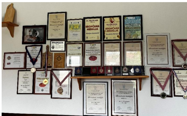
Slika 2. Diplome i medalje OPG-a Kundakčić

Obiteljsko poljoprivredno gospodarstvo Kundakčić nalazi se u Grabarju, a započelo je s proizvodnjom kulena 1991. godine. Prvi kulenovi plasirani su na tržište u području Opatije. Tada je gospodarstvo raspolagalo s oko 19 tovljenika. Pogon za preradu mesa je napravljen 2010. godine u Grabarju. Nakon gradnje pogona za preradu mesa OPG Kundakčić povećao je proizvodnju i na gospodarstvo se tovilo oko 100 svinja godišnje, na čijoj razini se i danas održalo. Osim tovljenika gospodarstvo raspolaže i s rasplodnim krmačama (ukupno 3) te 1 nerastom. Krmače se u rasplodu drže maksimalno 5 godina. Godišnje se na gospodarstvu nalazi oko 5-6 rasplodnih krmača. Krmače su pasmine Durok i Landras, dok je nerast pasmine Landras te se na gospodarstvu uzgajaju tovljenici njihovi križanci (LxL i LxD). Tovljenici se tove do završnih masa od 120 kg (T1 tovljenici) do maksimalno 250 kg. Po postignutoj završnoj masi tovljenici se otpremaju u obližnju klaonicu te se tamo trup primarno obrađuje. OPG Kundakčić primarno se opredijelio za proizvodnju kulena, no također se bavi i preradom mesa u kobasice, kulenove seke, slaninu te šunku. Proizvodi se plasiraju na tržište putem sajмова te prodajom na kućnom pragu.