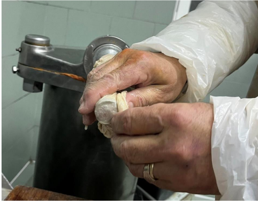
Slika 4. Navlačenje svinjskog crijeva