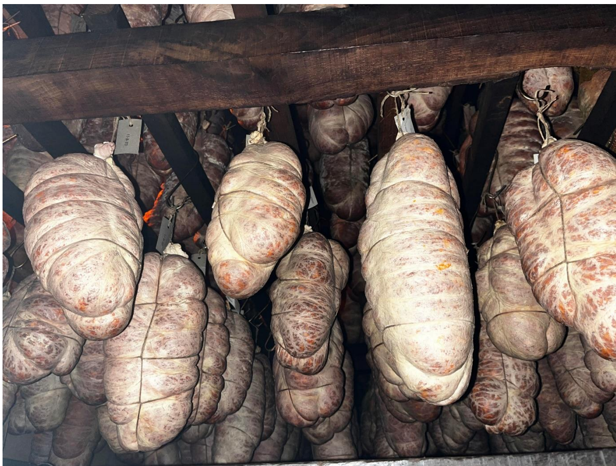
Slika 6. Dimljenje kulena u pušnici

Sušenje kulena u pušnici traje otprilike 3 mjeseca. Prilikom dimljenja kulena potrebno je sačuvati propusnost crijeva kako bi se vlaga što bolje uklonila iz unutrašnjosti kulena. Zbog toga se u prirodnim uvjetima provodi postupno dimljenje hladnim dimom. Zrak u pušnici zagrijava se na temperaturu od 10-15°C, a relativna vlažnost zraka treba biti 75-85%. Režim dimljenja ovisi o vremenskim prilikama. Dimljenje kulena na OPG-u Kundakčić odvija se u pušnici s prirodnim dimom za čiju proizvodnju se koriste grab i bukva.