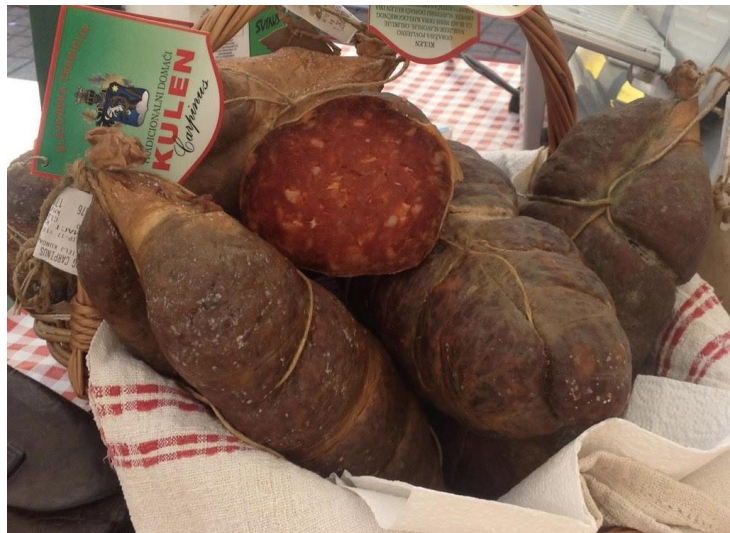
Slika 1. Kulen

Slavonski kulen je po definiciji trajna kobasica proizvedena od mješavine najkvalitetnijih dijelova svinjskog mesa, leđne slanine, začina i soli koja se nadjeva u slijepo crijevo (lat. caecum ) svinja. Nakon nadijevanja mješavine kobasica se najmanje 150 dana podvrgava procesima fermentacije, hladnog dimljenja, sušenja i zrenja (Kovačić i Karolyi, 2014.). Izvorni naziv "kulin" zadržao se u Slavoniji, no naziva se još i „kulen“ (Petričević i sur., 2010.). Do polovice 20. stoljeća u Hrvatskoj je svinjogojstvo bilo prilagođeno godišnjim dobima te rastu i dozrijevanju žitarica. U jesen se pripremala hrana za tovljenje, a zimi do proljeća se čuvalo usoljeno i osušeno mesa. U otvorenim ognjištima dim je služio za površinsku zaštitu mesa koje se smještalo iznad ognjišta zaštićeno od vatre, kukaca i životinja ( http://gospodarstvo-ferbezar.com/slavonski-kulen ). S napretkom tehnologije napredovala je i proizvodnja kulena te danas čak i na obiteljskim poljoprivrednim gospodarstvima nalazimo komore za dimljenje i dozrijevanje kulena, što omogućava njihovu proizvodnju i prodaju u svim dijelovima godine.