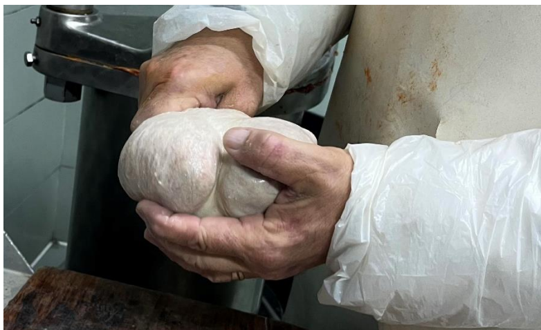
Slika 5. Punjenje crijeva smjesom za kulen