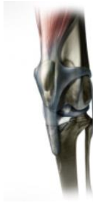
Slika 8. Prikaz skliznute čašice koljena.

Ponekad čašica koljena foksterijera može skliznuti s mjesta. Tada će se primijetiti da trči i odjednom podiže stražnju nogu i preskače ili poskakuje nekoliko koraka. Zatim izbacuje nogu ustranu kako bi čašica koljena iskočila na mjesto, i opet je dobro. Ako je problem blag i uključuje samo jednu nogu, foksterijeru možda neće biti potrebno mnogo liječenja osim lijekova za artritis. Kada su simptomi ozbiljni, može biti potrebna operacija da se čašica koljena ponovno poravna kako ne bi iskočila s mjesta.