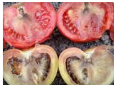
Slika 42 Presjek zaraženog ploda*

*Izvor slika s prethodne stranice: Tomato Disease Field Guide, 2017