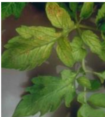
Slika 24 Mrljasta kloroza lista, Glasilo biljne zaštite 5/2016

Manjak molibdena uzrokuje međužilnu mrljastu klorozu listova, a ponekad je moguća djelomična kloroza žila. (slika 24) Takvi simptomi prvo nastaju na starom lišću, kasnije prelaze na mlađe. Rubovi lista se uvijaju prema gore. U krajnjem slučaju nastaje nekroza i smrt lista. Cvjetovi se slabije razvijaju.