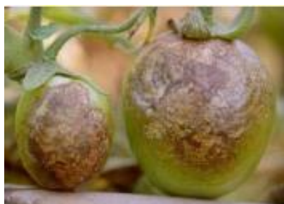
Slika 41 Nekroza ploda*