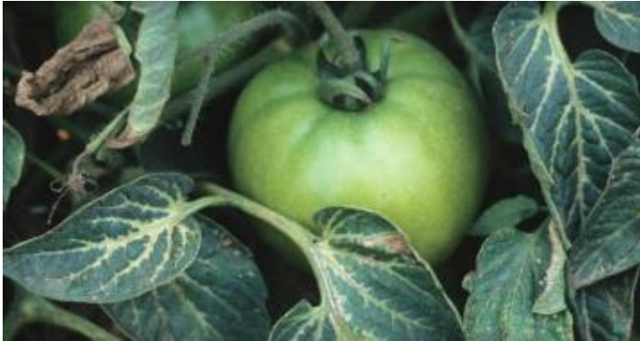
Slika 8 Kloroza provodnog tkiva lista, Tomato Disease Field Guide, 2017.

nepotrební trošak. Određeni pesticidi kojima se tretira tlo mogu zaostati u tlu dulje vrijeme, pa obratiti pažnju na to prilikom sadnje nove kulture na tom mjestu. Održavati strojeve za primjenu kemijskih sredstava čistima i funkcionalnima.