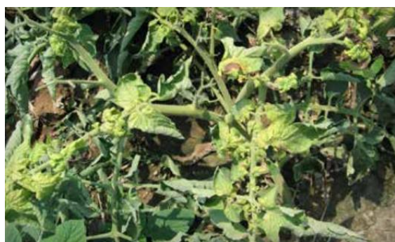
Slika 31 Simptomi na lišću, Tomato Disease Field Guide , 2017.

Virus mozaik krastavca (eng. Cucumber Mosaic Virus ili skraćeno CMV) je biljni patogen za kojeg se smatra da ima najveći broj potencijalnih domaćina među ostalim uzročnicima bolesti. Poznato je više od 1300 biljaka iz stotinjak porodica na kojima može parazitirati. Niti broj vektora mu nije malen jer ga prenosi sedamdesetak vrsta biljnih ušiju. Najčešće se javlja kod uzgoja rajčice na otvorenom. Simptomi na rajčici variraju ovisno o soju virusa i sorti rajčice, no uključuju mozaik i klorotične prstenove na listovima (slika 31 i 32), svjetliju boju lisnih žila, stanjenje listi, stagniran rast biljke i nitavost stabljike. Na plodovima su to klorotične mrlje, prstenovi, mozaik i prosvjetljenja (Vončina, 2016.).