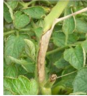
Slika 44 Lezije stabljike, Tomato Disease Field Guide , 2017.