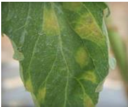
Slika 49 Klorotične pjege, Tomato Disease Field Guide, 2017.

sorte treba uzeti u obzir njenu otpornost na navedeni patogen, a ona se navodi kraticom „CF” koja potječe od starog imena gljve - Cladosporium fulvum . Također, postoji više tipova te gljive koji se međusobno fiziološki razlikuju, a određene sorte rajčice su otporne samo na neke od tih tipova. Biljne ostatke treba uništiti ili duboko zaorati. Nužan je plodored. U Hrvatskoj postoji samo jedan fungicid za suzbijanje baršunaste plijesni rajčice koji ima dozvolu za korištenje, međutim mogu se koristiti i određeni fungicidi za neka druga oboljenja za istu svrhu.