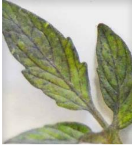
Slika 12 Ljubičasta kloroza na licu lista, Tomato Disease Field Guide, 2017.