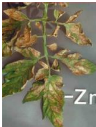
Slika 22 Nekroza lista, Glasilo biljne zaštite 5/2016

Kod nedostatka cinka na mlađem lišću se pojavljuju točkaste kloroze (žućenje) koje kasnije prelaze u pjegaste. U ozbiljnijim slučajevima klorotični dijelovi nekrotiziraju (slika 22). Žile lista nikada ne mijenjaju boju. Moguća su i uvrnuća peteljki lista. Višak cinka dovodi do brzog ugibanja biljke.