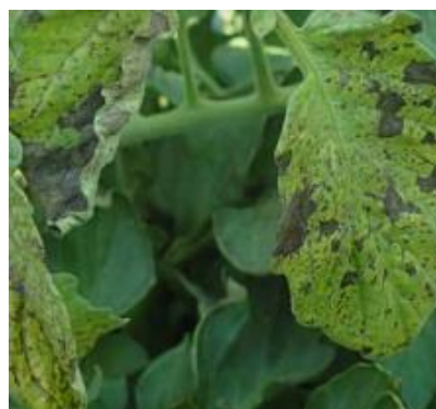
Slika 30 Nekroze na listu, Tomato Disease Field Guide , 2017.