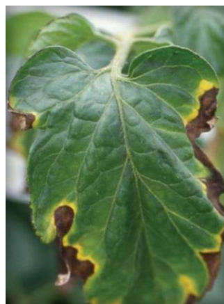
Slika 36 Rubna nekroza lista, Tomato Disease Field Guide, 2017.