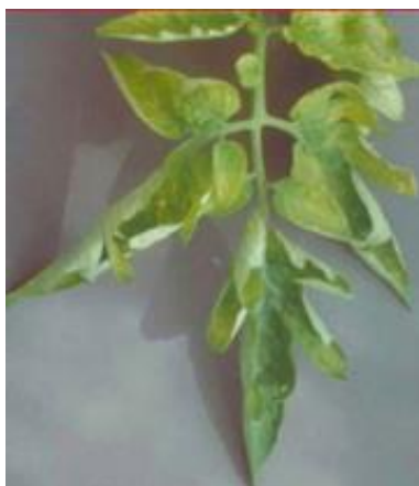
Slika 25 Simptomi na listu, Glasilo biljne zaštite 5/2016

Nedostatak bora ima brojne posljedice za rajčicu. Stari listovi su zahvaćeni žuto-narančastom klorozom i postaju plutasti zajedno s peteljkom, a žile kod jačeg nedostatka dobivaju ljubičastu boju (slika 25). Plodovi su deformirani, abnormalne veličine i pored čaške se stvaraju plutaste tvorevine (slika 26). Višak bora uzrokuje žućenje vršnih dijelova lišća i nekrozu koja se širi od rubova prema središtu.