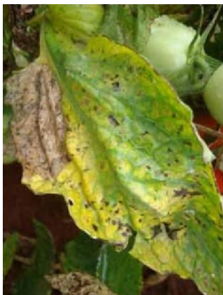
Slika 33 Pjegavost lista, Glasnik zaštite bilja 3/2019

Bakterijsku pjegavost rajčice uzrokuje bakterija Pseudomonas syringae pv. tomato . Širi se zaraženim sjemenom (Ivić, 2019.). Na površini biljaka i biljnim ostacima može opstati pola godine. Razvija se u uvjetima visoke vlage i na temperaturama 18-24 °C što odgovara temperaturi na kojoj se razvija rajčica. Simptomi na listu (slika 33) su crne pjege okružene klorotičnim prstenovima koje se kasnije spajaju. Cijeli list može nekrotizirati. Na plodovima se stvaraju okrugle lezije čiji je promjer nekoliko milimetara (slika 34). Moguće je da lezije popucaju.