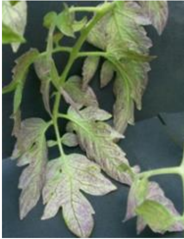
Slika 11 Ljubičasta kloroza, naličja lišća, Glasilo biljne zaštite, 5/2016