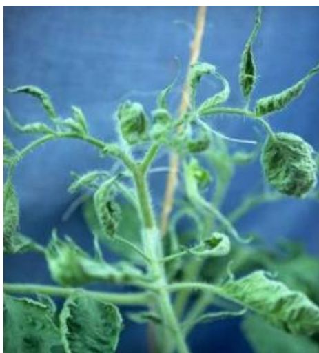
Slika 6 Deformacija i uvijanje lišća, izvor: Tomato Disease Field Guide , 2017.

Kemijske ozljede su uglavnom uzrokovane nepravilnom uporabom pesticida (slika 6, 7 i 8). To može biti pogrešna doza, formulacija, način primjene ili pak pogrešno vrijeme primjene. Pojava kod koje sredstvo za zaštitu bilja izazove simptome se naziva fitotoksičnost. Pesticidi mogu biti kontaktni i sistemski. Kontaktne pesticide ne prodiru u biljku već ostaju na njenoj površini gdje je tretirana. Ukoliko dođe do fitotoksičnosti na površini biljke se pojavljuju klorotične i nekrotične točke, u težim slučajevima deformacija zahvaćenoga tkiva. Sistemski pesticide prodiru u biljku i u slučaju fitotoksičnosti mogu izazvati veću štetu. Simptomi su prestanak rasta, žučenje i nekrozu sredine lista ili lisnih žila, u čijem slučaju se može proširiti na provodna tkiva ostatka biljke. Štete na plodovima su abnormalne dimenzije i oblici te unutrašnje ili vanjske deformacije.