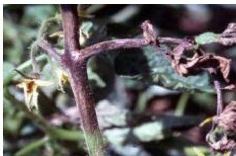
Slika 39 Nekrotične lezije stabljike*

nespolno razmnožavanje koristi sporangije. Konidije P. infestans su žućkaste boje i limunastog oblika te u povoljnim uvjetima (>15 °C, vlaga S>91%) kliju direktno u micelij. U slučaju nepovoljnih uvjeta (<15°C) i ukoliko je prisutna voda u kapljičnom obliku sporangije ovog patogena vrše preobrazbu u zoosporangij u kojem se stvaraju zoospore. Zoospore posjeduju flagele pomoću kojih se kreću po okolišu u potrazi za domaćinom. Spolni oblik razmnožavanja je u Hrvatskoj jako rijedak, a vrši se pomoću spolnih spora zvanih oospore. Oospore imaju klijavost oko 4 godine. Simptomi plamenjače rajčice se pojavljuju na listovima, stabljici i plodovima. Na listovima su to sive do smeđe pjege koje prelaze u lezije. Na stabljici se javljaju sive, a kasnije nekrotične lezije. Kada je jako vlažan zrak na površini lista se pojavljuje sporulacija. Peteljke listova se savijaju i list poprima deformirani izgled. Na plodovima se stvaraju tamno zeleno- smeđe ulegnute mrlje, hrapave površine i masna izgleda. Zadnji simptom je potpuno sušenje i umiranje listova i stabljike čime biljka poprima spaljeni izgled. Razvoju plamenjače odgovara hladno i jako vlažno vrijeme, iako će se razvijati i na toplijim temperaturama. Prezimljuje u gomoljima krumpira u obliku micelija ili oospora u ostacima zaraženih biljaka ili u tlu.