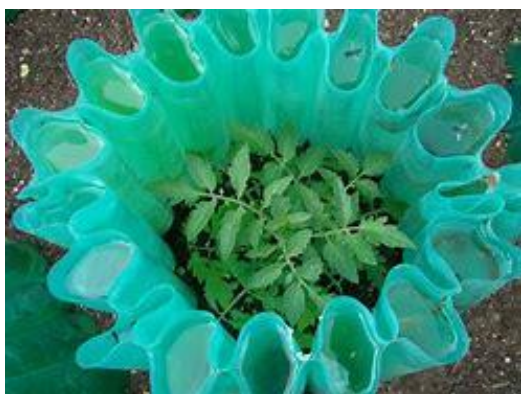
Slika 5 Wall of water

Prevenција i liječenje: paziti na dnevne i noćne temperature u zaštićenim prostorima. Ukoliko se uzgaja na otvorenom tempirati sadnju nakon zimskih mrazeva ili zaštititi biljku od mraza, a po velikim vrućinama zasjeniti ih. Dobra metoda za zaštitu biljke od naglih promjena temperature je Wall-of-Water kojom se koristi sustav plastičnih cijevi napunjenih vodom (slika 5). One preko dana apsorbiraju višak topline, a preko noći ju ispuštaju čime su dnevne i noćne temperature ujednačene. Na taj način se biljka može zaštititi od smrzavanja i do -8°C. U vodu iz cijevi je potrebno dodati izbjeljivač u omjeru 1/500 kako bi se spriječila pojava algi unutar cijevi. Još jedan način na koji se čuva toplina tla je malčiranje.