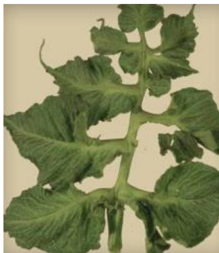
Slika 7 Bore i izobličenje lista, Izvor: Tomato Disease Field Guide , 2017.

Kontrola štete: Koristiti pesticide isključivo po uputstvima proizvođača. Izbjegavati primjenu na iznad prosječno velikim temperaturama jer one povećavaju vjerojatnost fitotoksičnosti. Paziti i na ostale klimatske uvjete, posebno na vjetar i kišu. Vjetar može zanositi pesticide na mjesta na koja to ne želimo, a kiša može isprati pesticide i izazvati