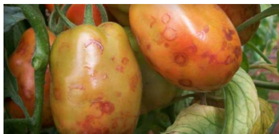
Slika 28 Prstenaste mrlje na plodovima, Tomato Disease Field Guide , 2017.