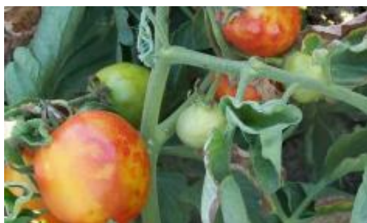
Slika 29 Diskoloracija ploda, Tomato Disease Field Guide , 2017.