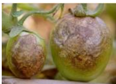
Slika 41 Nekroza ploda*