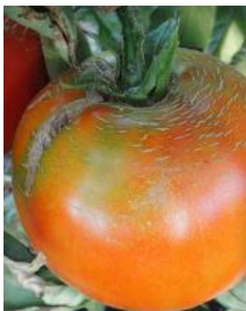
Slika 2 Pucanje ploda*