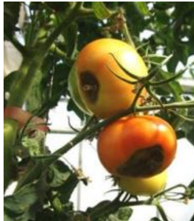
Slika 15 Vršna trulež ploda, Glasilo biljne zaštite 5/2016

Kod manjka kalcija se lišće deformira i u međužilnom dijelu nastaje kloroza. Rubovi starih listova smeđe. Kod duljeg nedostatka kalcija cijeli list odumire, a razvoj cvjetnih pupova izostaje. Na plodovima se javlja vršna trulež i propadaju (slika 15). Višak kalcija ne izaziva probleme.