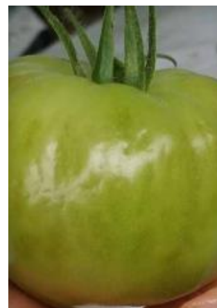
Slika 4 Ozeblina*