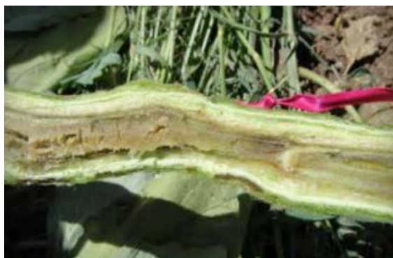
Slika 35 Unutarnja nekroza stabljike, Tomato Disease Field Guide, 2017.

tkivu ksilemu čime remeti normalan protok vode i hraniva (slika 35). Kao posljedica toga biljne stanice gube turgor, međužilno tkivo poprima žutu, a kasnije bijelo-sivu boju, listovi se suše, cijela biljka klone i na kraju uvene (slika 36). Na ranama su moguće žute izlučevine (slika 37). Unutar plodova oko peteljke se pojavljuju smeđe trule zone, a na površini 3-6mm velike sive pjege (slika 38). Parazitira isključivo na rajčici i smatra se najštetnijom bolesti rajčice u zaštićenim prostorima. Posebno je česta u hidroponima zbog velike vlage zraka(80%) koja pogoduje razvoju bolesti. Na i u biljnim ostacima može opstati do 5 godina. Prenosi se zaraženim sjemenom, vodom i nečistim alatom (Križanac i Plavec, 2016.). Najpovoljnije temperature za razvoj bakterije su 25-28°C, zato se zaražena biljka može privremeno oporaviti tokom hladnog dijela dana.