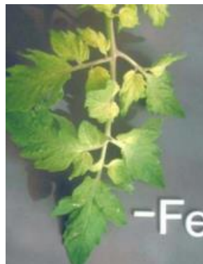
Slika 19 Početna kloroza lišća, Glasilo biljne zaštite 5/2016