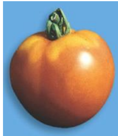
Slika 14 Žućenje ploda, Glasilo biljne zaštite 5/2016