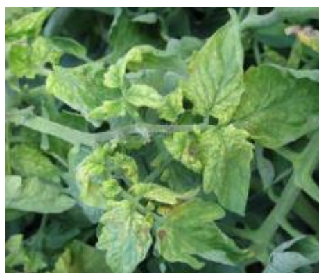
Slika 32 Mozaične mrlje, Tomato Disease Field Guide , 2017.