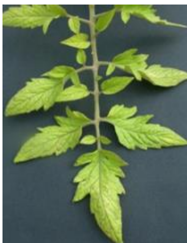
Slika 9 Kloroza lišća, izvori: Glasilo biljne zaštite, 5/2016

Manjak dušika uzrokuje blijedenje biljke (slika 9 i 10). Simptomi se prvo javljaju na starom lišću, a kasnije zahvaćaju mlađe. Lišće mijenja boju do svjetlozelene, a u težim slučajevima žute. Na peteljka i žilama se mogu pojaviti crvene nijanse. Kloroza je jednolična i reverzibilna. U ekstremnim slučajevima listovi postaju bijeli i dobivaju ljubičaste pjege, a nakon toga nekrotiziraju. Nekroza je ireverzibilna. Cijela biljka slabije raste, plodovi su mali i epiderma im je tanka. Višak dušika uzrokuje pretjerani rast biljke, stanjenje epiderme i tamnozelenu boju na biljci. Cijela biljka gubi čvrstoću i otpornost na ostale bolesti. Kontrola: Prije sadnje u tlo dodati organskog gnojiva koje dulje vremena otpušta dušik, najbolje stajnjak. Mineralna dušična gnojiva se lako ispiru iz tla pa je njih preporučljivo dodavati naknadno po potrebi, i to folijarnom gnojidbom.