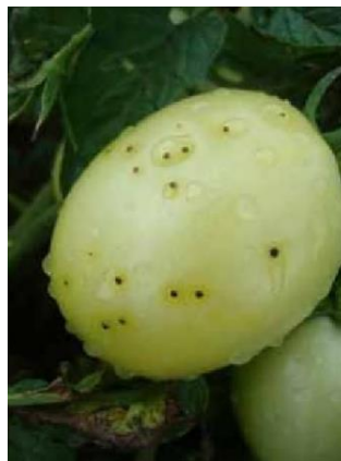
Slika 34 Lezije ploda, Glasnik zaštite bilja 3/2019