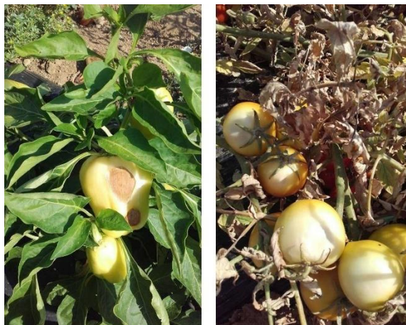
Slika 1 Ožegotine na rajčici i paprici

Sve biljke su autotrofi, što znači da usvajaju mineralne tvari i pretvaraju ih u organske. To čine pomoću fotosinteze za koju je potrebna svjetlost. Različite biljke imaju različite potrebe za količinom svjetla, a rajčicama je potrebno 8-10 sati izloženosti svjetlu. Manjak svjetlosti uzrokuje etiolaciju, to jest izduženi rast biljke. Kao posljedica toga stabljika klone i cijela biljka je manje otporna na bolesti. Također dolazi do propadanja