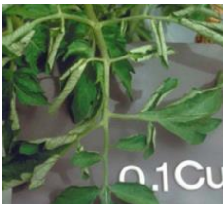
Slika 23 Uvijanje listova, Glasilo biljne zaštite 5/2016

Nedostatak bakra je jako rijedak u uzgajalištima gdje se koriste kemijska sredstva za zaštitu bilja (SZB). Razlog tomu je što velik broj pesticida u svom sastavu sadrži bakar. Ako se to ipak dogodi, prvi simptomi budu na mladim listovima. Oni gube turgor, peteljke im se savijaju prema dolje, a liske uvijaju prema gore (slika 23). Kloroza je blaga, a kod težih slučajeva se javlja nekroza. Moguća je pojava sivkastoga sjaja na najmlađem lišću. Višak bakra otežava rast biljke i izaziva klorozu i nekrozu.