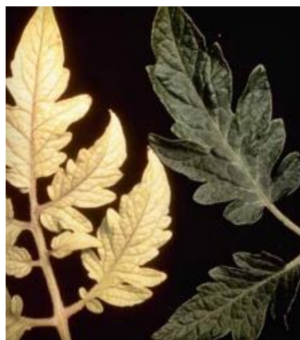
Slika 10 Kloroza i nekroza lista, izvori: Tomato Disease Field Guide, 2017.