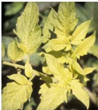
Slika 18 Jaka kloroza lišća, Tomato Disease Field Guide, 2017.

Prvi simptomi nedostatka su na mladom lišću. Uzrok tomu je slaba pokretljivost tog elementa. Intravenozna kloroza lišća, a glavne žile najčešće ostaju zelene (slika 18 i 19). Kasnije kloroza prelazi u bijelu boju i do tog trenutka je reverzibilna. Ako takvo stanje potraje pojavljuju se nekroze na peteljkama i bazama liski. Višak željeza uzrokuje smanjen rast biljke. Kontrola: folijarnom ishranom nadomjestiti manjak željeza.