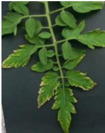
Slika 13 Kloroza ruba lista

Manjak kalija se najprije očituje na rubovima staroga lišća kao kloroza (u ovom slučaju žućenje) (slika 13) koja se kasnije širi međužilnim prostorom prema bazi lista. Kloroza urokovana nedostatkom kalija je ireverzibilna. Moguća je nekroza rubova lista, a sam list kod jačeg nedostatka postaje naboran i uvijen. Plodovi se razvijaju nejednako, djelomično ostaju zeleni, a djelomično žute (slika 14). Višak kalija otežava usvajanje željeza, mangana, cinka i magnezija.