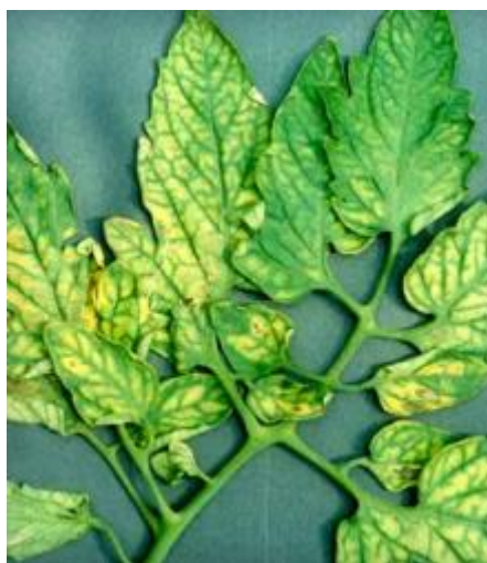
Slika 16 Žućenje međužilnog prostora, Tomato Disease Field Guide, 2017.

Kod manjka magnezija međužilni prostor lista postaje žut (slika 16), ponekad narančast, a rubovi lista i žile ostaju zeleni. Simptomi su najprije na starom lišću, kasnije na mlađem. Rjeđe se javlja nekroza. Višak magnezija ne uzrokuje probleme.