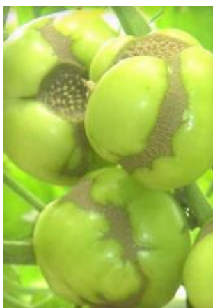
Slika 3 Ožiljci na mladom plodu*