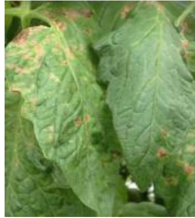
Slika 21 Višak mangana, Tomato Disease Field Guide , 2017.