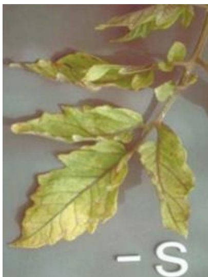
Slika 17 Simptom manjka sumpora, Glasilo biljne zaštite 5/2016

Kod manjka sumpora listovi postaju žutozeleni, a žile i peteljke postaju ljubičaste (slika 17). Ljubičasta boja se uglavnom javlja na naličju lista. Peteljke također sporije rastu pa lišće djeluje zbijeno. Kloroza je zapravo slična onoj kod nedostatka dušika, samo je ujednačenija po cijeloj biljci. U težim slučajevima na peteljci dolazi do pojava lezija i nekrotičkih pjega, a listovi su uspravni, uvijeni i krhki.