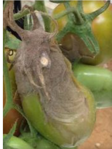
Slika 46 Sporulacija ploda, Tomato Disease Field Guide , 2017.