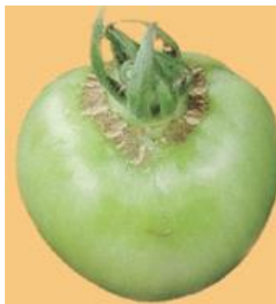
Slika 26 Simptomi na plodu, Glasilo biljne zaštite 5/2016