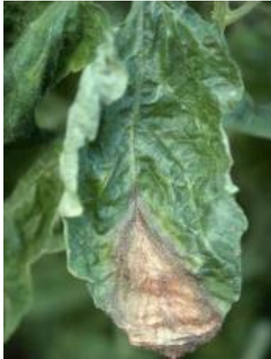
Slika 45 Nekroza sa sporulacijom, Tomato Disease Field Guide , 2017.