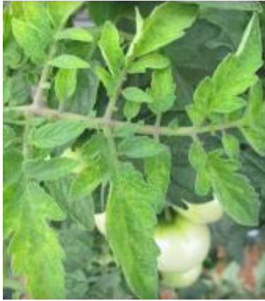
Slika 20 Manjak mangana, Tomato Disease Field Guide , 2017.

Manjak mangana izaziva međužilnu klorozu na mladom lišću i nekrotične pjege (slika 20 i 21). Na površini lista se ponekad javlja ljubičasti sjaj. Višak mangana uzrokuje fitotoksičnost čiji se simptomi najprije javljaju na starom lišću u obliku crno smeđih lezija.