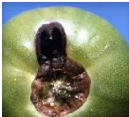
Slika 48 Tamne lezije ploda, Tomato Disease Field Guide , 2017.