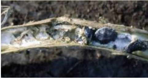
Slika 43 Micelij i sklerocije u stabljici, Tomato Disease Field Guide , 2017.