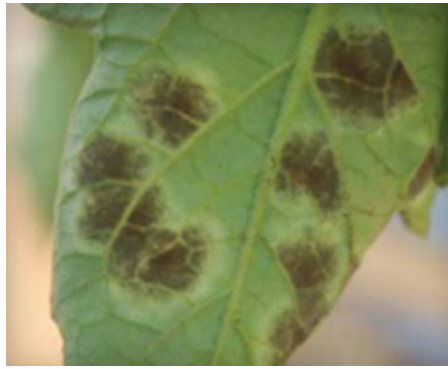
Slika 50 Sporulacija na naličju, Tomato Disease Field Guide, 2017.