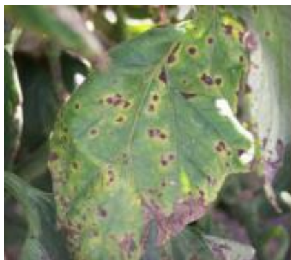
Slika 47 Simptomi na listu, Tomato Disease Field Guide , 2017.

suzbijanje korova. Od fungicida se uglavnom koriste oni za suzbijanje plamenjače. Postoji model prognoze pojave koncentrične pjegavosti rajčice zvan FAST koji utvrđuje najpovoljnije vrijeme za razvoj bolesti.