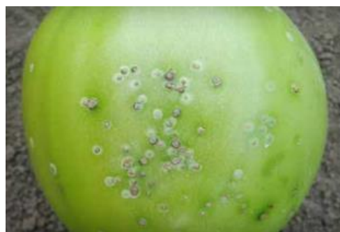
Slika 38 Sive pjege na plodu, Tomato Disease Field Guide, 2017.