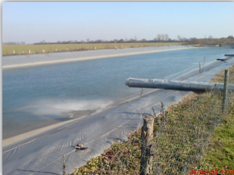
Slika 17. – Umjetna akumulacija vode – laguna u plastenicima Magadenovac