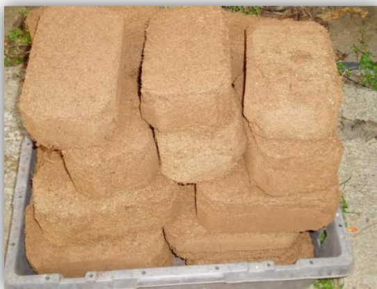
Slika 13. – Prešana kokosova vlakna

Kokosov supstrat dobro upija vodu te ju lako i brzo drenira, a njegov pH iznosi 5,2 – 6,8. Prema tome, čista kokosova vlakna bi bila idealna podloga za uzgoj gerbera (Slika 13.). Njima nije potrebno dodavati aditive niti ih miješati s drugim primjesama.