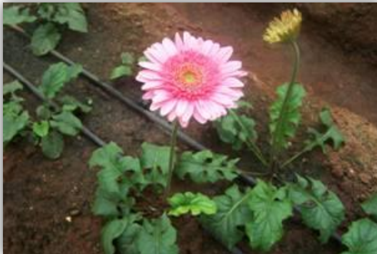
Slika 18. – navodnjavanje gerbera sustavom kap po kap

jednom u 2 – 3 dana s 3,75 litara po biljci (Slika 18.). Temperatura vode za navodnjavanje treba iznositi 20°C do 25°C te povoljnih kemijskih karakteristika koje dozvoljavaju njenu uporabu (Mađar i Šoštarić, 2009.).