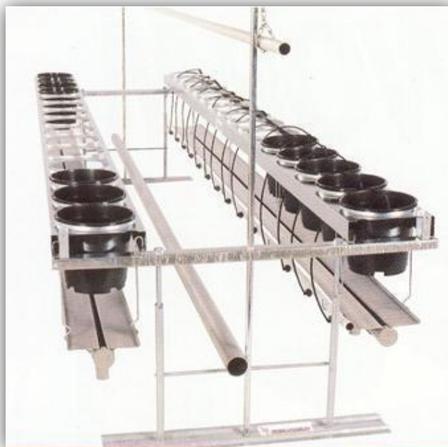
Slika 22. – Gredice s lončanicama.

U lončanicama se nalazi inertni supstrat (mješavina kokosa, rižine ljuske ili 20 – 30% perlita, a kao drenaža služi ekspanzirana glina. Hranjive otopine se računalno doziraju ovisno o intenzitetu sunčeve radijacije.