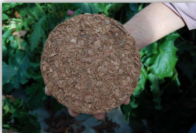
Slika 14. – Kokosova vlakna za uzgoj gerbera

Kokosove ljuske služe kao organska zamjena za kamenu vunu i perlit kod kojih se javlja problem zbrinjavanja nakon uporabe. Ima visok kapacitet vezanja vode. Organske komponente u njegovom sastavu stimuliraju rast korijenja i pružaju otpornost na biljne bolesti (Slika 14. i 15.). Usjevi se mogu uzgajati i do pet godina. U smjesi se može miješati 60% kokosovih vlakana s 40% perlita. Važna je kvaliteta te vodo-zračni odnos. Kokosova vlakna u kojima se uzgajaju biljke sadrže oko 70% vode i 25% zraka (De Kwakel, B.V., 2004.).