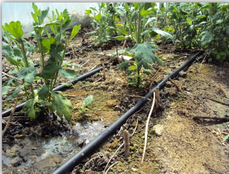
Slika 5. – Polietilenske cijevi (Autor: K. Ćorić)