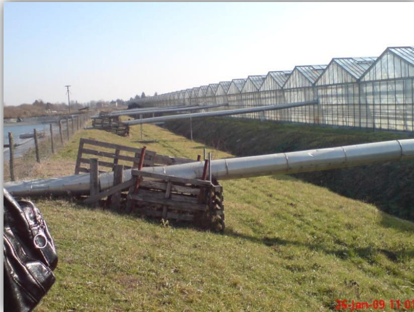
Slika 16. – Cijevi kroz koje prolazi kišnica do rezervoara u plastenicima Magadenovac