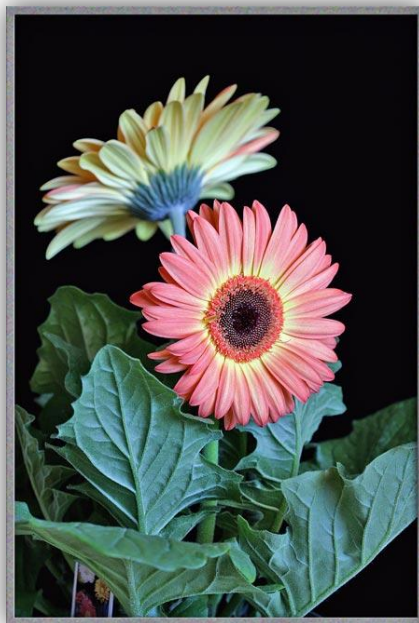
Slika 2. – Cvijet gerbera

Za uspješan uzgoj gerbera potrebno je osigurati dosta svjetlosti ali bez izravnih sunčevih zraka. Biljke se najbolje razvijaju i rastu na dobro osunčanom pjeskovitom tlu. Zalijevanje se obavlja dva puta tjedno u jutarnjim satima kako bi se lišće moglo osušiti tijekom dana i samim time smanjiti rizik pojave truljenja i gljivičnih oboljenja. Prihranjuje se jednom u dva tjedna ili jednom tjedno, pogotovo ljeti kada je doba cvatnje, dok tijekom zime treba izostaviti gnojenje i smanjiti zalijevanje.