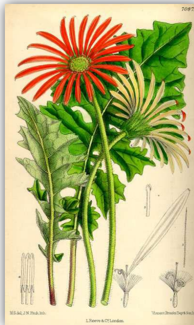
Slika 1. – Prva ilustracija gerbera u boji u botaničkom časopisu Plate 7087, 1889.

Različiti načini uzgoja podrazumijevaju i različite metode navodnjavanja. Tako postoje određeni sustavi navodnjavanja u voćarstvu, vinogradarstvu, povrtlarstvu i cvjećarstvu. U ovom radu osvrnut ćemo se na metode navodnjavanja u cvjećarstvu, preciznije – u uzgoju Gerbere ( Gerbera jamesonii ) (Slika 1.).