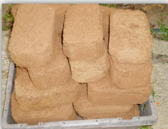
Slika 13. – Prešana kokosova vlakna

Kokosov supstrat dobro upija vodu te ju lako i brzo drenira, a njegov pH iznosi 5,2 – 6,8. Prema tome, čista kokosova vlakna bi bila idealna podloga za uzgoj gerbera (Slika 13.). Njima nije potrebno dodavati aditive niti ih miješati s drugim primjesama.