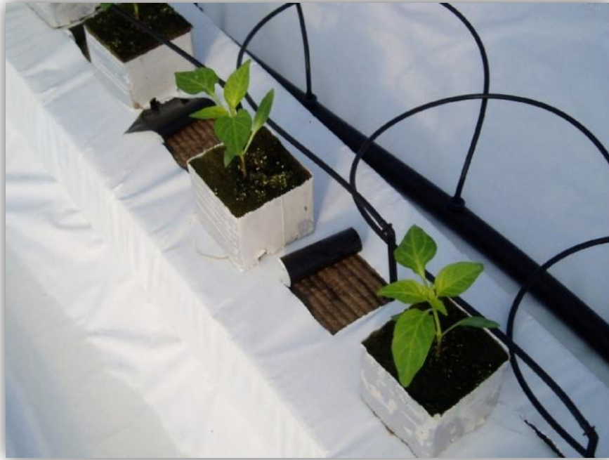
Slika 9. – Kocke kamene vune

Kamena vuna za proizvodnju sadnog materijala dolazi u obliku kocke (Slika 9.). Postojana je i može se koristiti za 1 - 6 kultura.