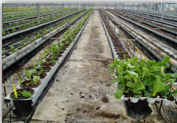
Slika 20. – Sadnja gerbera u Magadenovcu