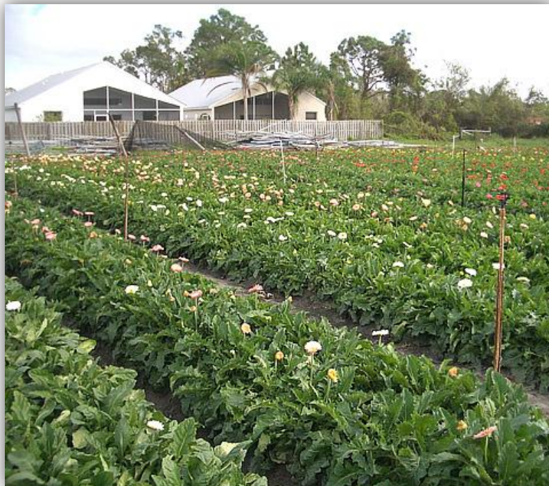
Slika 7. – Uzgoj gerbera na otvorenom (Izvor: http://www.plantmanagementnetwork.org/pub/php/review/2005/methylbromide/ http://a3acrefarm.com/ )