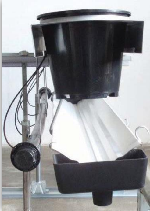
Slika 21. – Lončanica, ubodni kapljači i žlijeb.

Prije instalacije sustava, tlo se mora poravnati. Postavlja se oluk (žlijeb) u kojemu se nakuplja drenažna voda (Slika 21.) te na taj način tlo ispod gredica ostaje suho i smanjena je mogućnost zaraze Botrytisom (Roskam, 2012.).