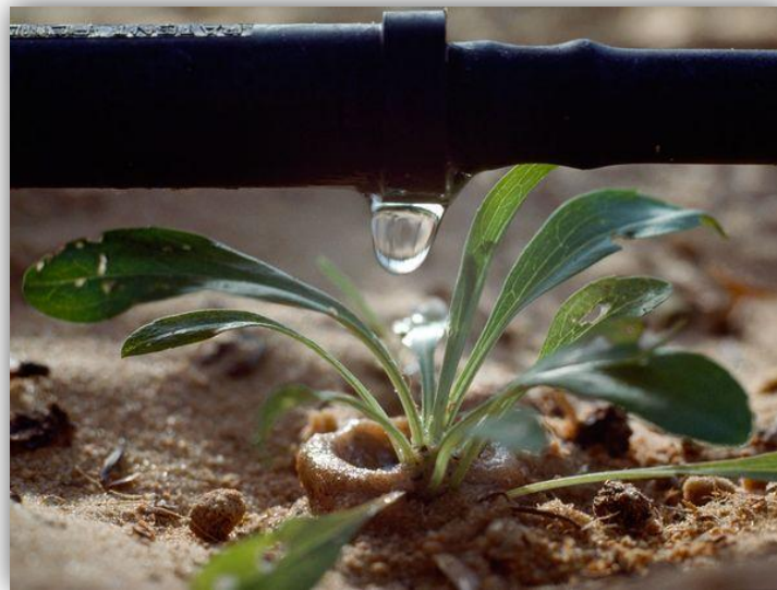
Slika 4. – Navodnjavanje kap po kap

Metoda lokaliziranog navodnjavanja koja se najčešće primjenjuje je navodnjavanje kapanjem ("kap po kap"). Ovi sustavi potpuno su automatizirani i programirani te tijekom svoga rada gotovo da ne zahtijevaju prisustvo čovjeka, a našli su široku primjenu u zemljama gdje nema dovoljno vode za navodnjavanje i gdje je ona dragocjenost, a bez nje nema sigurne poljoprivredne proizvodnje (Izrael, jug Italije, Francuska, SAD). Voda se dovodi cijevima do svake biljke i vlaži vrlo mali dio zemljišta, što smanjuje gubitke vode te se zato naziva još i "lokalizirano" navodnjavanje (Slika 4.).