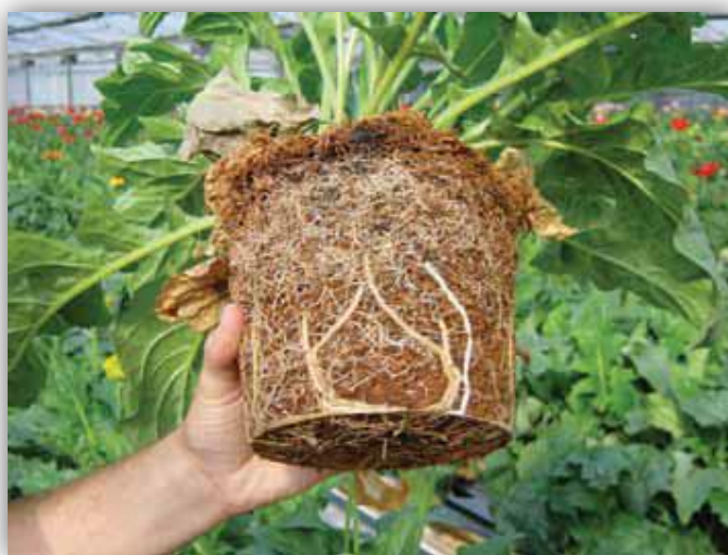
Slika 15. – Formirani korijen gerbera u kokosovom supstratu