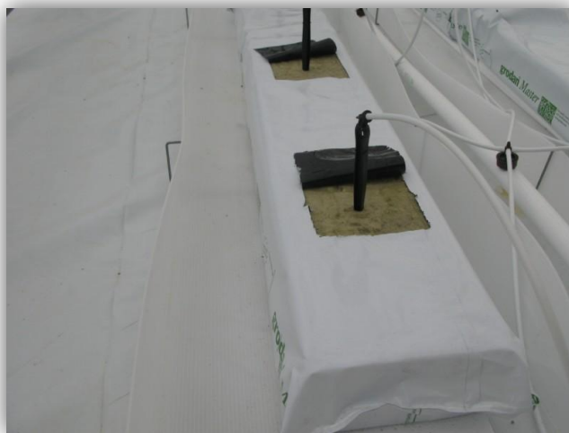
Slika 10. – Ubodni kapljači