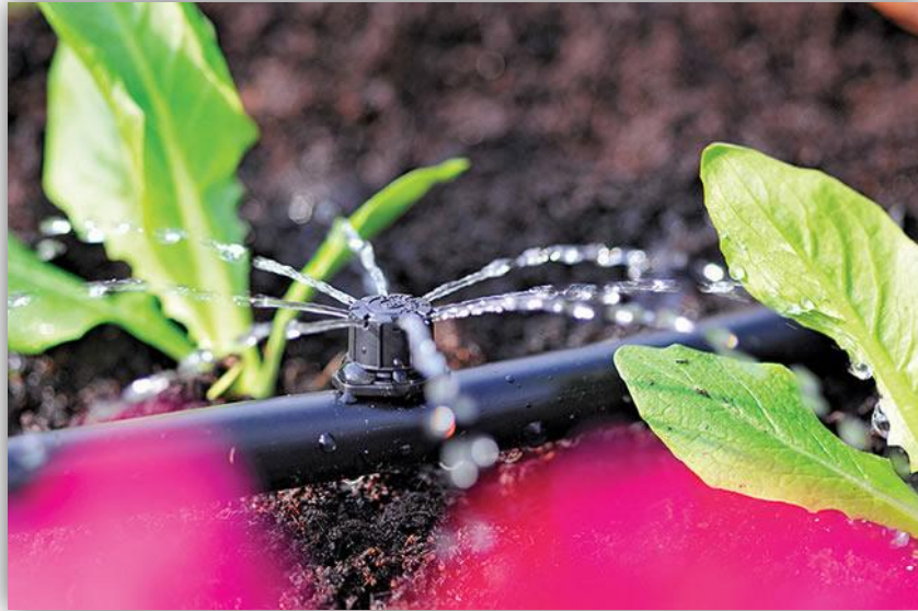
Slika 6. – Jedna od mnogo vrsta kapljača (minirasprskivač)

ovisno o gustoći sklopa. Kod povrća, cvijeća i voćnih sadnica oni su mnogo gušće postavljeni, a u trajnim nasadima voća rjeđe. Mogu se ugrađivati kao sastavni dio lateralne cijevi – onda su to "linijski" kapljači ili sa strane cijevi takozvani "bočni" kapljači.