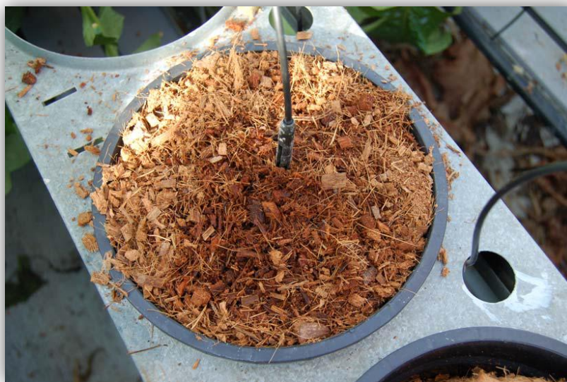
Slika 23. – Sustav navodnjavanja gerbera kap po kap – ubodni kapljači

Koristi se sustav navodnjavanja kap po kap – ubodni kapljači (Slika 23.) kako bi svaka biljka dobila istu količinu vode. Cijevi sustava nalaze se na tlu između redova. S navodnjavanjem se započinje dan ili dva prije sadnje biljaka, kako bi supstrat bio pogodan za razvijanje mlade biljke (Roskam, 2012.). Sustavi kap po kap služe i za dodavanje vode i hraniva te za ispiranje tla ukoliko je u tlu visoka koncentracija soli, tj. visoka EC vrijednost.