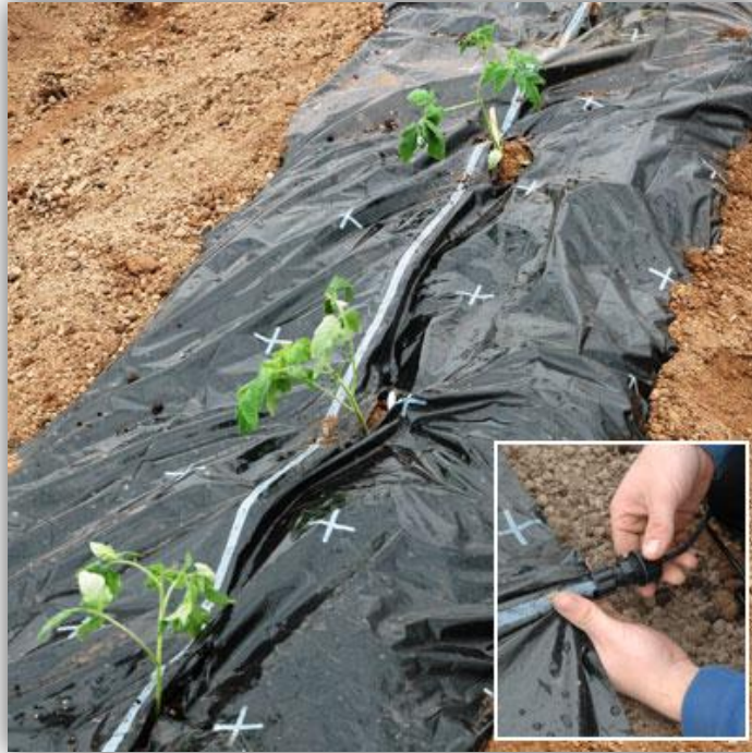
Slika 3. – Sustav kap po kap postavljen ispod malč folije