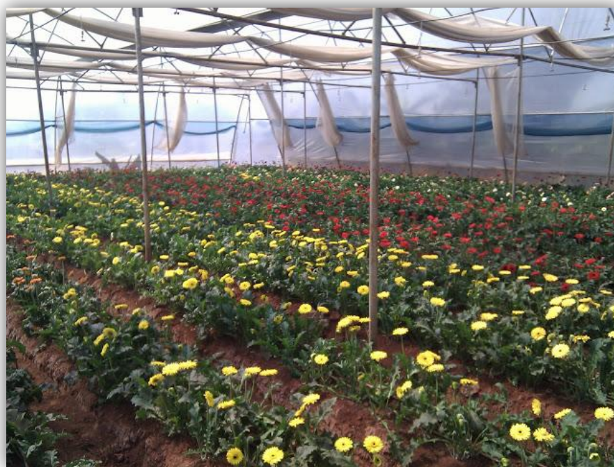
Slika 8. – Uzgoj gerbera u tlu

Prije početka uzgoja gerbera obavezna je dezinfekcija tla kako bi se smanjila mogućnost zaraze patogenima poput Phytophthora , Fusariuma i Pythiuma . Gredice se tretiraju s 2% formaldehidom (100ml formalina u 5 litara vode/m 2 prostora) ili metil bromidom (70g/m 2 ), a zatim prekrivaju plastičnom folijom za minimalno razdoblje od 2 do 3 dana. Treba ih naknadno zalijevati kako bi se temeljito isprale kemikalije (rezidue pesticida) iz tla prije sadnje (Nadu, T., 2013.).