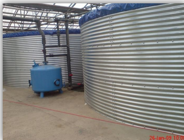
Slika 12. – Tankovi s dušičnom kiselinom u plastenicima Magadenovac

U plastenicima su tankovi zapremnine od 15 000 litara (Slika 12.) s dušičnom kiselinom koja smanjuje pH. Na crpki koja usisava vodu iz lagune u tank, postoji pješčani filter koji uklanja razne mehaničke nečistoće iz vode. 15 litara hranjive otopine puni se 24h.