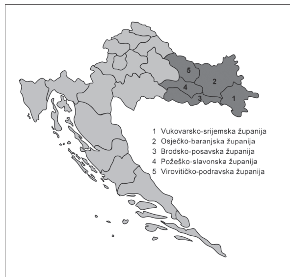
Slika 1. Područje pet slavonskih županija

Dostupni statistički podaci o broju peradi prema županijama odnose se na popis od 1. lipnja 2003. godine (Tablica 1.), a prema njima prikazan je broj peradi po stanovniku i površini u pojedinim županijama.