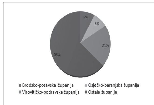
Grafikon 1. Relativni udjeli (%) kokoši Hrvaticе po županijama Republike Hrvatske tijekom 2012. godine

Brojnost pasmine Hrvatica na području tri slavonske županije u odnosu na područje Republike Hrvatske prikazana je na Slici 2.