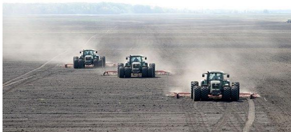
Slika 5. Sjetvospremač – Kongsklide germimotor (završna priprema)