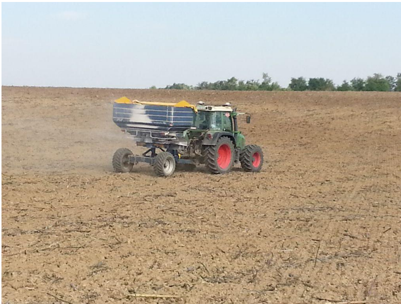
Slika 8. Rasipač gnojiva Bogballe, radi pomoću GPS sustava

dušičnih gnojiva u predstjetvenoj pripremi koristi UREA (N 46%), koja pospješuje razgradnju biljnih ostataka od pretkulture, te aktivaciju organskog dušika iz tla. Od kompleksnih gnojiva kojim se fosfor dodaje u tlo, koristi se MAP (12 N-52 P205-0 K2O). MAP se uvijek primjenjuje predstjetveno tj. prije oranja. Kalijeva sol je gnojivo koje se koristi da bi se tlo opskrbilo s dovoljnim količinama kalija (kalijev klorid sadrži 60%K 2 O). Najvažnije je napomenuti da se vrše uzorkovanja svake table, te se prema analizi uzorka tla na Poljoprivrednom Fakultetu prave preporuke za gnojidbu za svaku tablu. Na osnovu analize uzorka rade se karte za raspodjelu gnojiva po tabli, gdje se nakon toga preciznim rasipačima s pomoću GPS-a vrši precizno razbacivanje gnojiva po tabli ( Jurišić. M, 2004. ). Ova dva gnojiva (MAP i Kalijeva sol) se isključivo primjenjuju uz pomoć izrađenih karata preporuke, tj. onoliko koliko je potrebno tlu.