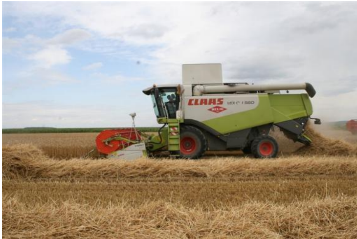
Slika 10. Kombajn CLASS LEXION 560

http://www.agroklub.com/upload/slike/beljeimg_6992%C5%BEetva_2011.jpg