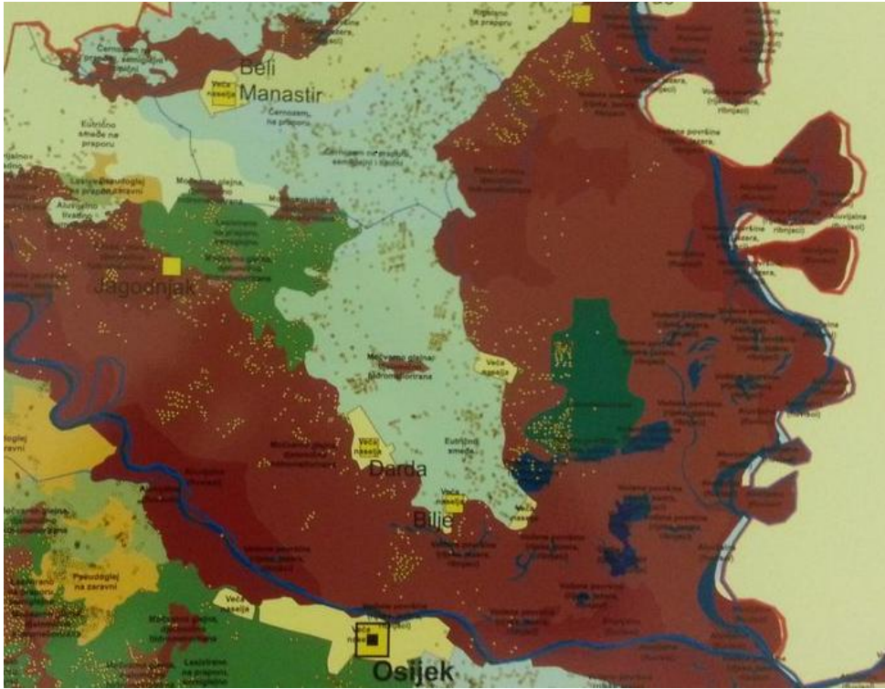
Slika 12. Tipovi tla na PJ Brestovac-Karanac