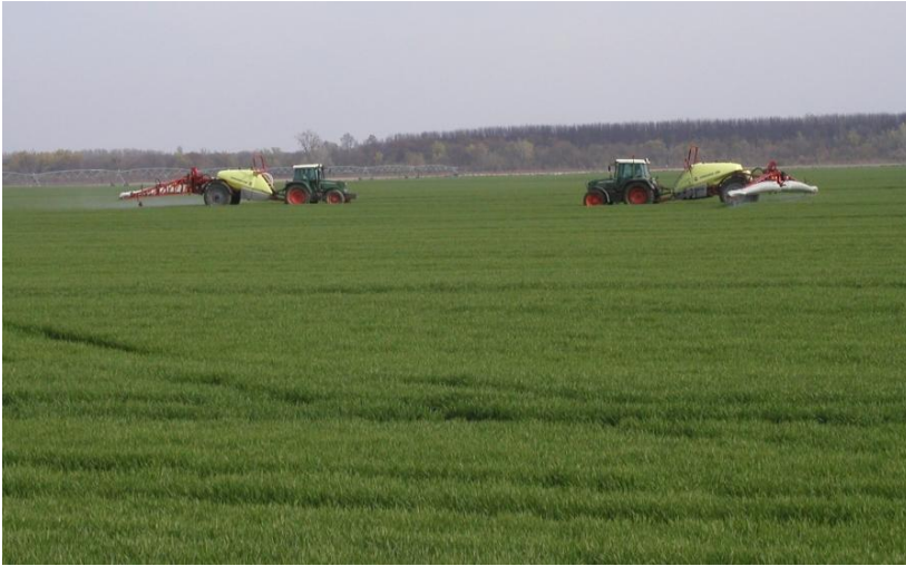
Slika 7. Zaštita pšenice, prskalice Hardi-Commander ( http://www.findri.hr/old/images/Vijest_Belje_CMTF_2_3_b.jpg )