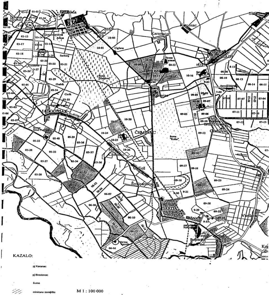
Slika 13. Raspored tabli zasijanih pšenicom (obojano crno) u proizvodnoj godini 2012-2013.