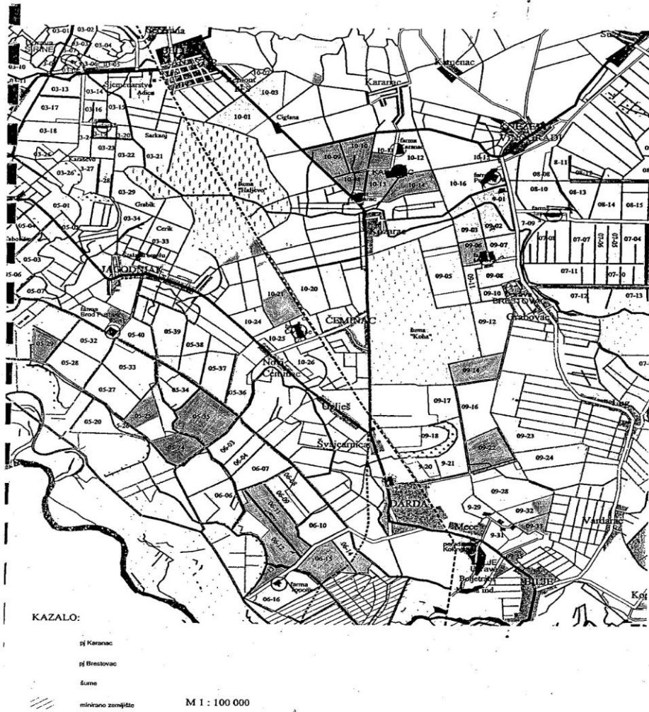
Slika 13. Raspored tabli zasijanih pšenicom (obojano crno) u proizvodnoj godini 2012-2013.