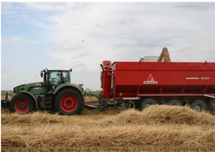
Slika 11. Annaburger- samopretovarna prikolica kapaciteta 25 tona

http://www.agroklub.com/upload/slike/beljeimg_6992%C5%BEetva_2011.jpg