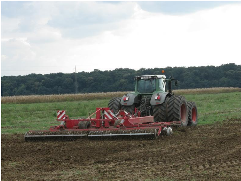
Slika 4. Teška tanjurača TERRA X (tanjuranje brazde)

http://i376.photobucket.com/albums/oo209/Thor_OS/Belje%20tour/IMG_2853Medium.jpg