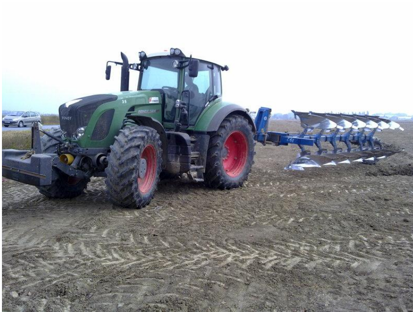
Slika 3. Traktor FENDT i plug LEMKEN (polunošeni) ( http://img230.imageshack.us/img230/8595/07092010119.jpg )