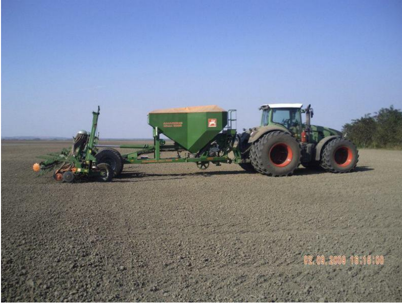
Slika 6. Sjetva pšenice sijačica Amazone-Citan radni zahvat 8m

http://img217.imageshack.us/img217/4049/32034321623494183200111.jpg