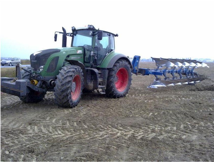
Slika 3. Traktor FENDT i plug LEMKEN (polunošeni)