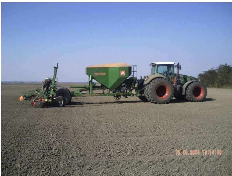
Slika 6. Sjetva pšenice sijačica Amazone-Citan radni zahvat 8m

http://img217.imageshack.us/img217/4049/32034321623494183200111.jpg