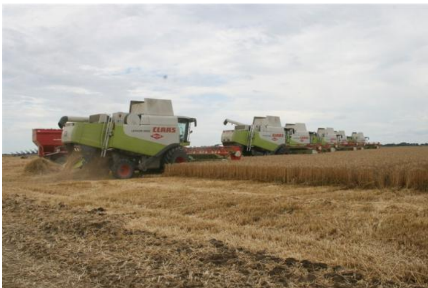
Slika 9. Žetva Brestovac-Karanac 2013.g.

Žetva pšenice može biti jednofazna, dvofazna i višefazna. Jednofazna žetva izvodi se kombajnama. Jednofazna žetva počinje još u voštanoj zrelosti s vlagom zrna 35-30% i organizira se tako da se završi za 5-8 dana. Dvofazna žetva sastoji se od kosidbe pšenice na 20-30 cm visine. Dvofazna žetva ima niz prednosti nad jednofaznom kosidbom, jer omogućuje pravovremenu žetvu i ostvarivanje većeg prinosa. Gubici nastaju od osipanja zrna, odsijecanja ili neodsijecanja klasova, neizvršavanja zrna u slamu i pljevu te od prosipanja zrna u elevatoru. Ukoliko se pazi na visinu reza i reguliranje podizača poleglim stabljika, zatim na reguliranje bubnja i podbubnja, ventilatora i brzine kretanja kombajna (naročito na dužinu trajanja žetve, koji za jednu sortu ne smije biti veći od 5-8 dana), navedeni gubici mogu se svesti na najmanju mjeru (Zimmer. R, Banaj. Đ, Brkić. D, Košutić. S, 1997.). Da zbog velikih površina pod pšenicom ne dođe do kašnjenja sa žetvom, Belje u svom programu poljoprivredne mehanizacije ima i vrhunske kombajne marke Claas-Lexion. Kapacitet ovoga kombajna je 2 hektara u jednom satu, uz pratnju samopretovarne prikolice Annaburger kapaciteta 25 tona.