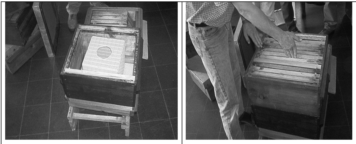
Slika 1. Smještaj paketnoga roja u LR košnicu

Smještaj paketnoga roja u košnicu obavili smo u sumrak. Košnicu (LR) smo pripremili tako da smo na podnicu stavili nastavak bez okvira i u njega otvoren transportni kavez s pčelama, iz kojega smo prethodno izvadili kavez s maticom. Drugi nastavak s praznim saćem i saćem s medom stavili smo iznad transportne kutije. Između okvira stavimo kavez s maticom, na kojem smo otvorili prolaz pčelama do pogače u kavezu (Slika 1.). Tijekom prošle noći pčele su izišle iz transportne kutije i zauzele okvire oko matice u gornjem nastavku te smo sljedećega dana uzeli praznu transportnu kutiju i nastavak bez okvira.