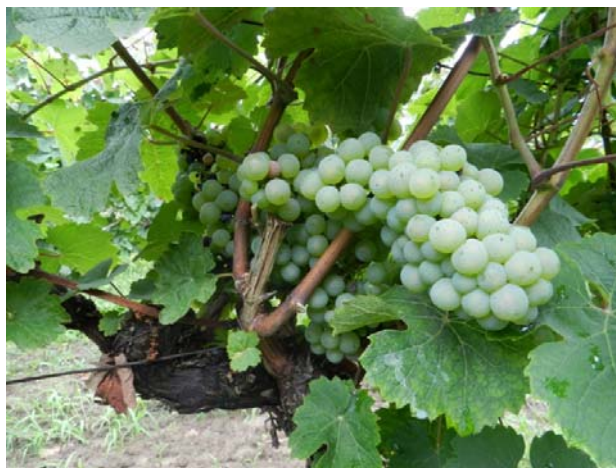
Slika 3. Vinska sorta Graševina.