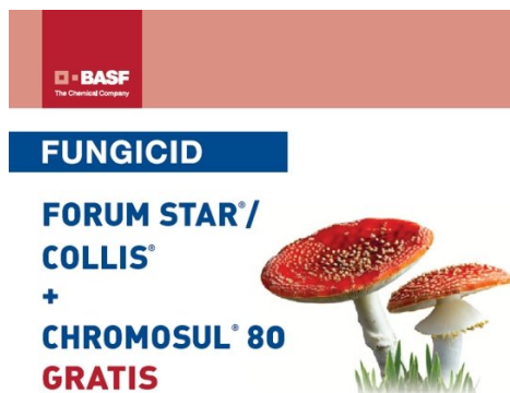
Slika 6. Kombinacija fungicida po preporuci tvrtke Chromos agro