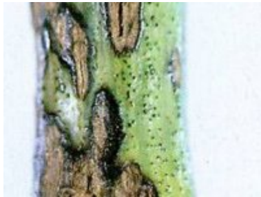
Slika 8. Simptomi crne pjegavosti na čokotu

Tijekom ljetnih mjeseci napadnuti listovi i peteljke posmeđe i osuše se. U jesen, a posebno u zimskim mjesecima, bolesni jednogodišnji izboji poprime sivu do bjelkastu boju i prevučeni su sitnim crnim točkicama takozvanim piknidama (slika 8).