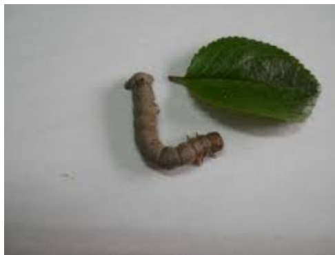
Slika 14. Gusjenica grba korak