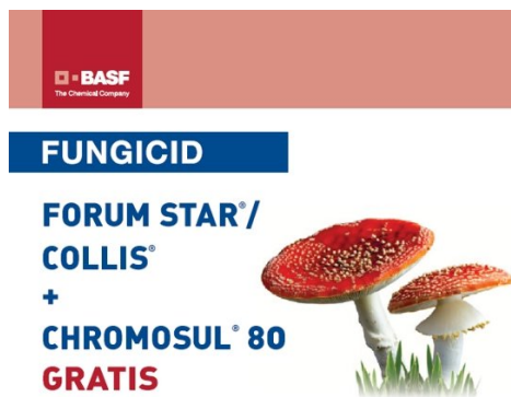
Slika 6. Kombinacija fungicida po preporuci tvrtke Chromos agro