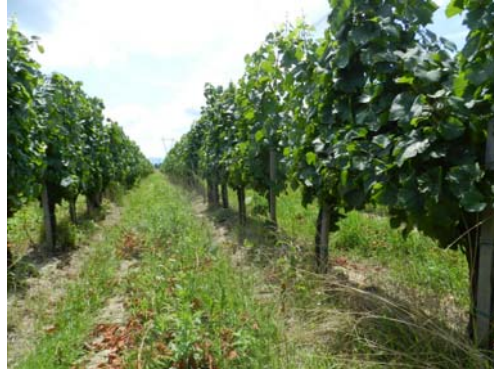
Slika 1. Vinograd OPG-a Romi Suk-Barić.