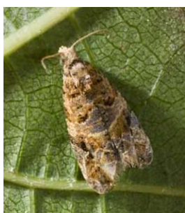
Slika 16. Imago sivog/pepeljastog grozdovog moljca