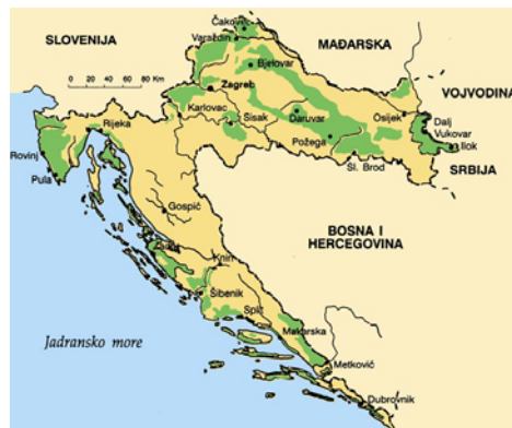
Slika 2. Vinorodna područja Hrvatske.

U Hrvatskoj postoji oko 130 autohtonih sorti vinove loze.