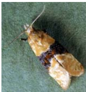
Slika 15. Imago žutog grozdovog moljca