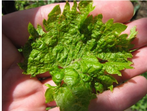
Slika 11. Simptomi akarinoze na licu lista loze