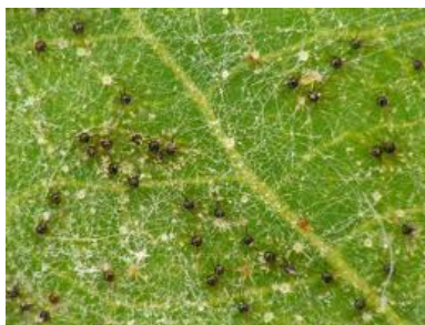
Slika 5. Kuglice kleistotecija na listu loze.