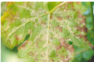
Slika 7. Simptomi plamenjače na naličju lista.

Plamenjača napada sve zelene organe vinove loze, najčešće list i bobu. Prvi znaci bolesti javljaju se na donjim listovima, rijede na viticama, cvatovima i mladim bobama. Na mladim listovima nastaju žute mrlje koje se postepeno povećavaju (slika 7.).