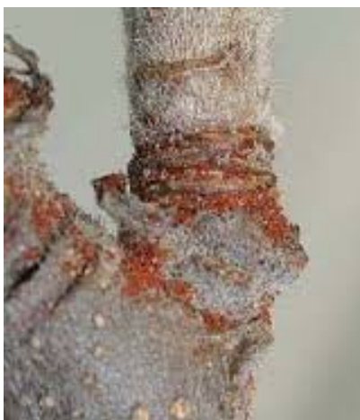
Slika 13. Napad crvenog pauka na čokotu vinove loze