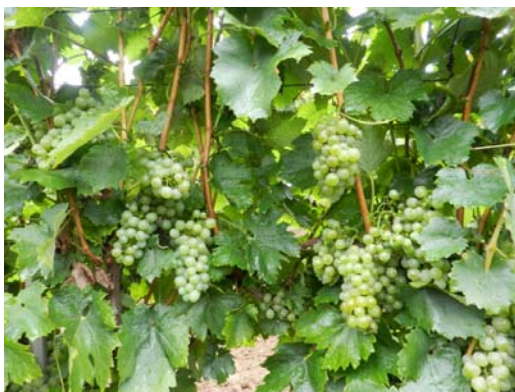
Slika 18. Vinograd u zriobi.

Istraživanje je provedeno od travnja do studenog 2014. godine, u vinogradu u vlasništvu OPG Romi Suk–Barić u Orahovici (slika 18).