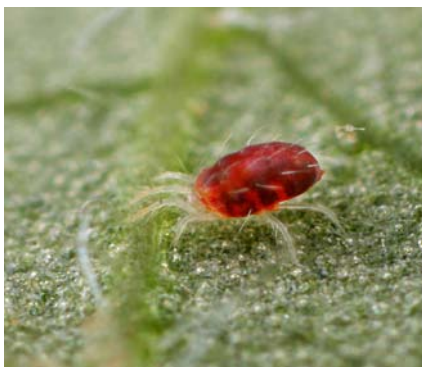
Slika 12. Odrasli oblik crvenog voćnog pauka.

insekticidi u nekim fazama povoljno djeluju na biljku pa samim tim u nekoj fazi stimulirajuće i na sam razvoj crvenog pauka (Ciglar, 1998.).