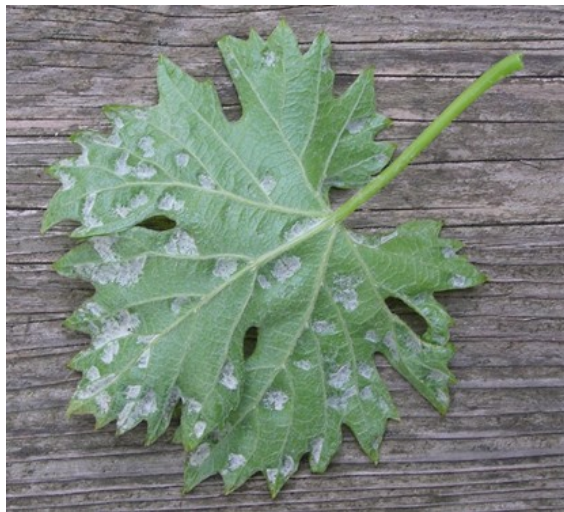
Slika 10. Simptomi erinoze na naličju lista loze

Ova grinja pričinjava štete u vidu nabreklih (šiški) na licu te vunaste prevlake na naličju lista (slika 10.). Pri jačoj zarazi prevlaka se formira i na grozdićima. U uvjetima jako visoke ili jako niske vlažnosti zraka grinje oštećuju lozu na još dva načina: oštećenjem zametka unutar pupa i jakim uvijanjem lista bez stvaranja vunaste prevlake na naličju.