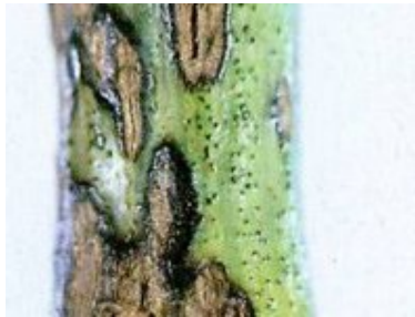
Slika 8. Simptomi crne pjegavosti na čokotu

Tijekom ljetnih mjeseci napadnuti listovi i peteljke posmeđe i osuše se. U jesen, a posebno u zimskim mjesecima, bolesni jednogodišnji izboji poprime sivu do bjelkastu boju i prevučeni su sitnim crnim točkicama takozvanim piknidama (slika 8).