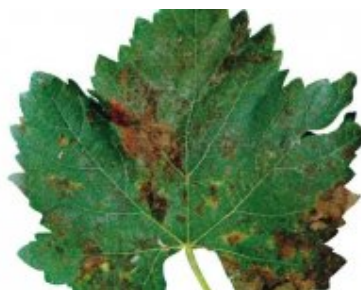
Slika 9. Simptomi crne pjegavosti na listu.