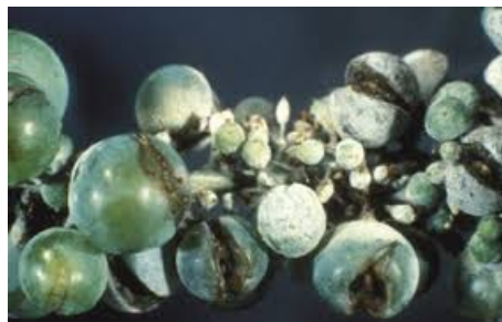
Slika 4. Napad pepelnice na bobi.

Stvara sivo-pepeljastu prevlaku i na licu i naličju. Zaraženi listovi otvrdnu, uvijaju se i postepeno gube zelenu boju. Na prevlaci lišća nalazi se velik broj spora (konidija) raspoređenih u nizove. Vjetrom ili kišom prenose se spore s listova na bobice gdje kliju i zaraze površinu odnosno pokožicu bobice (slika 4.).