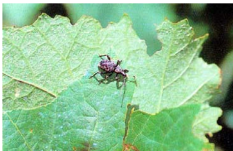
Slika 17. Imago vinove pipe na listu loze

Veći broj pipa (slika 17.) koje se hrane vinovom lozom dobile su naziv - vinove pipe i ubrajaju se u kratkorilaše (debeljokljuna vinova pipa, lucernina pipa, crna vinova pipa, prugasta vinova pipa, lozina pipa itd.).