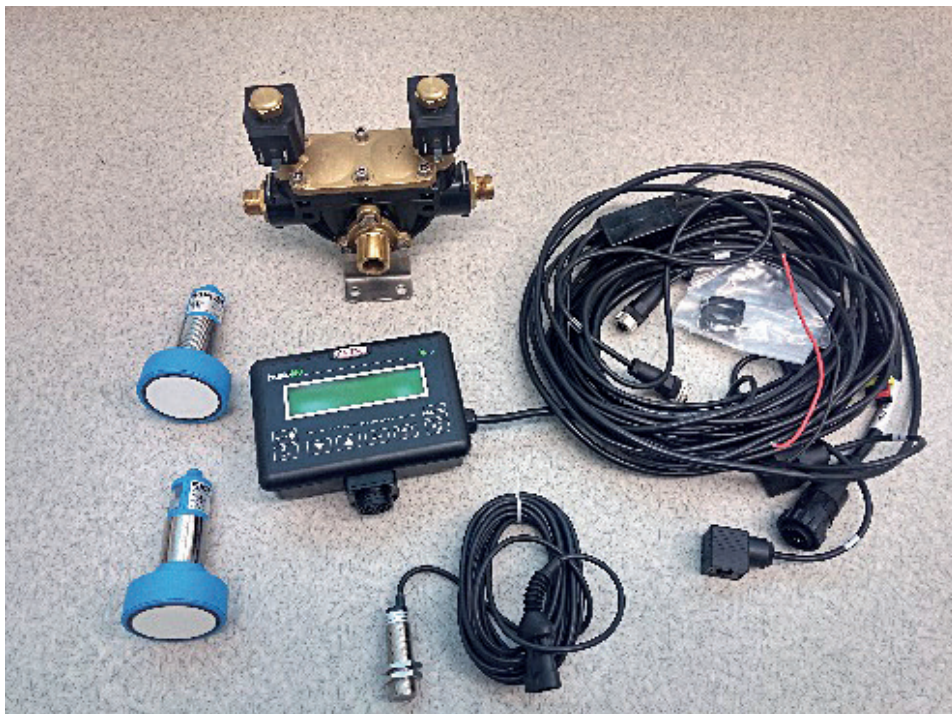
Slika 1. Sustav senzora tvrtke Sick Figure 1 Sick company sensor system