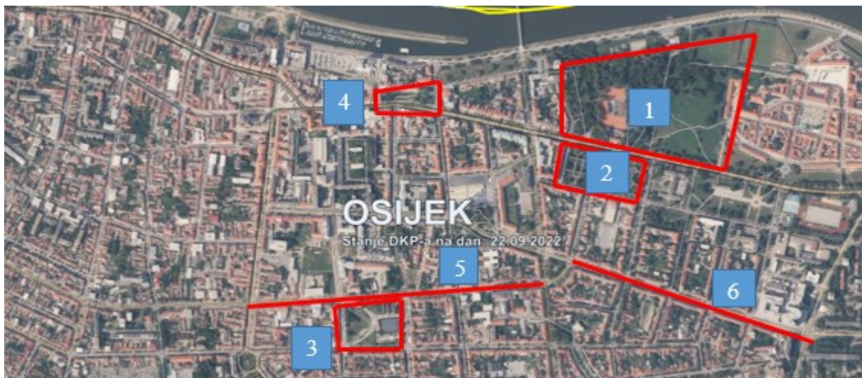
Slika 1. Lokacije istraživanog područja u centru grada Osijeka

Istraživanje je provedeno i u 5. Gundulićevoj ulici koja se proteže smjerom istok zapad i koja je dijelom obnovljena 2019. godine zbog rekonstrukcije vodovodne mreže, kao i njezinoj poveznici - 6. Vukovarskoj ulici gdje je zabilježena spontana pojavnost korovnih biljnih vrsta u dijelu travnih partera i sloja nogostupa i kuća. Na slici 1. prikazane su spomenute lokacije i označene su pripadajućim brojevima.