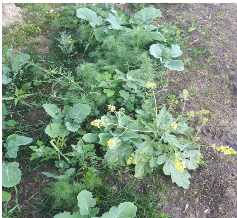
Slika 4. Nedavno zasijan travnjak u Gundulićevoj ulici u Osijeku (Foto: Turalija, (2019).

Uz rubove kuća i nogostupa spontano se javljaju još i: kovrčava kiselica ( Rumex crispus ), puzajuća pjeskarica ( Arenaria serpyllifolia L.), invanzivna vrsta vinobojka ( Phytolacca americana L.), a na prije dva mjeseca usijanoj površini u Gundulićevoj ulici, više je izraslo korova nego biljaka iz porodice trava (slika 4) te prevladavaju biljne vrste: crna gorušica ( Brassica nigra L.), bijela loboda ( Chenopodium album L.), pjegasti dvornik ( Polygonum persicaria L.) i bezmirisna kamilica ( Tripleurospermum inodorum (L.) Sch.Bip.). Od prije navedenih biljnih vrsta (prema European and Mediterranean Plant Protection Organization –EPPO, 2022.) u invazivne spadaju: Amaranthus retroflexus , Erigeron annuus , Conyza canadensis , Veronica persica i Phytolacca americana .