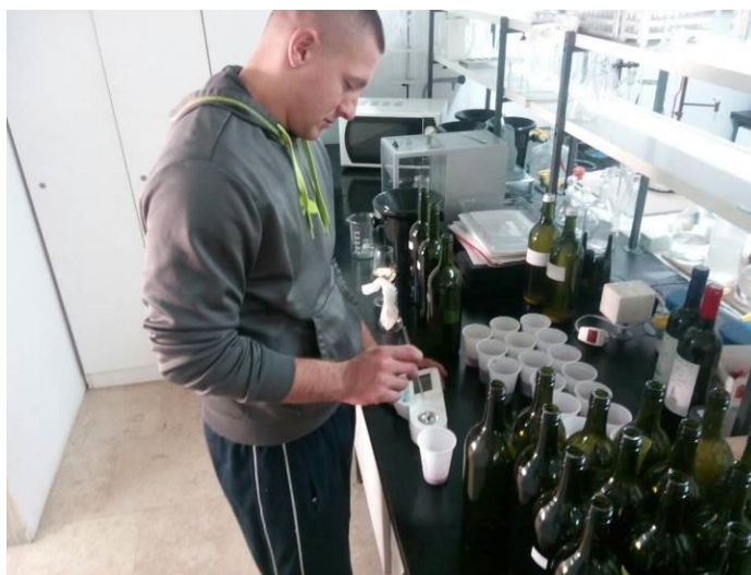
Slika 3. Mjerenje šećera digitalnim refraktometrom

Za količinu šećera u moštu korišten je digitalni refraktometar, vrijednost pH mošta izmjerena je pH metrom, a ukupna kiselost mošta neutralizacijom 0,1 M otopinom NaOH uz indikator Bromtimol plavo (EEC, 1990.).