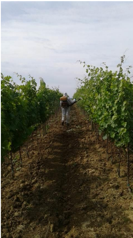
Slika 2. Primjena zaštitnih sredstava leđnim atomizerom