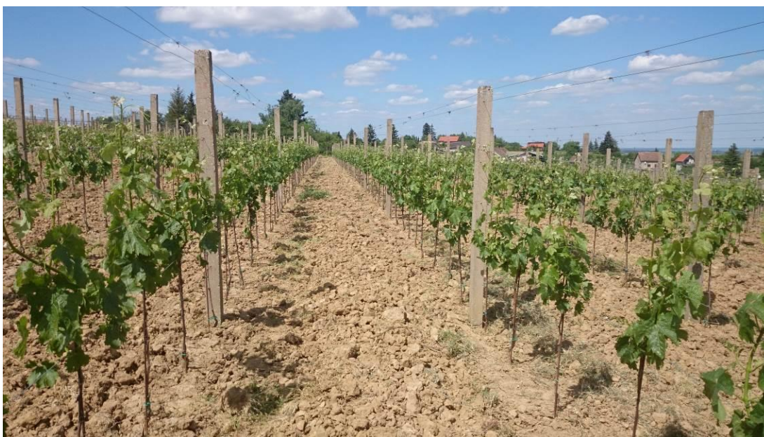
Slika 6. Pokušalište Mandićevac – vinograd pred početak cvatnje

Tlo na kojem je posađen vinograd u kojem je provedeno istraživanje nalazi se na prijelazu iz lesiviranog tipičnog tla u lesivirano pseudoglejno tlo i pripada klasi eluvijalno-iluvijalnih tala koju karakterizira građa profila s A-E-B-C horizontima. Budući da je ovo tlo rigolano prije zasnivanja vinograda, došlo je do mješanja humusno akumulativnog, eluvijalnog i dijela iluvijalnog horizonta te je nastao jedan antropogeni horizont P dubine do 50 cm. Ispod antropogenog horizonta nalazi se iluvijalni argiluvični horizont debljine 50 cm. U antropogenom horizontu tlo je praškasto ilovaste teksture sa sadržajem čestica gline od 22,9 %, a podoranični horizont je praškasto glinaste teksture s nešto većim sadržajem gline od 29,38 %. To je malo porozno tlo u antropogenom horizontu, osrednjeg kapaciteta tla za vodu, malog kapaciteta tla za zrak i osrednje zbijenosti. Iluvijalni horizont je također male poroznosti, osrednjeg kapaciteta za vodu, malog kapaciteta za zrak ali jako zbijeno. Kemijska svojstva ovog tla ukazuju na kiselu reakciju u svim horizontima