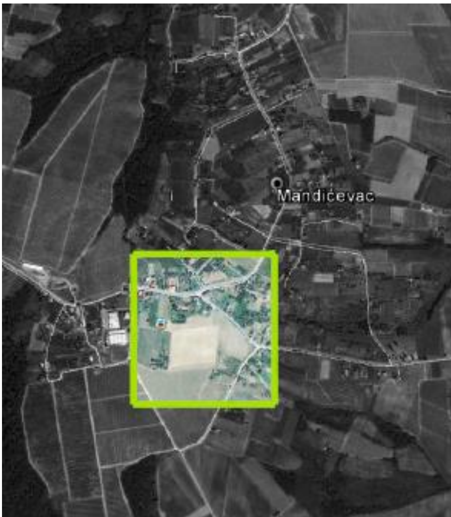
Slika 5. Satelitska snimka pokušališta

Vinograd u kojem je provedeno istraživanje smješten je u Mandićevcu, vinogorje Đakovo, vinogradarska podregija Slavonija, vinogradarska regija Istočna kontinentalna Hrvatska. Nadmorska visina lokaliteta je 208 m, vinograd se nalazi u blizini vinarije Đakovačka vina d.d. s istočne strane; površine 1,42 ha, južne ekspozicije s generalnim padom W→ E od 9,8 %, a posađen je 30. travnja 2013. godine. Međuredni razmak u vinogradu iznosi 2,2 m, a unutar reda 0,9 m, što daje sklop od 5050 biljaka/ha. Na navedenoj površini ukupno je posađeno 1040 trsova kultivara Cabernet sauvignon.