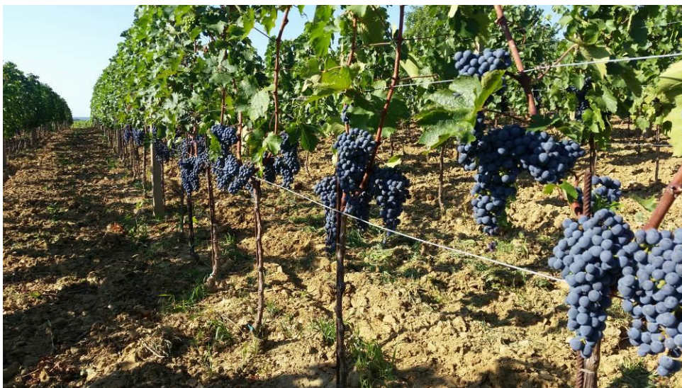
Slika 9. Tretman – skup ampelotehničkih mjera zaštite

Primijenjeni tretmani nisu statistički značajno mijenjali sadržaj šećera u moštu. Najveći prosječni sadržaj šećera izmjeren je u moštu kod tretmana sa standardnom zaštitom tijekom vegetacije (93,5 0 Oe), dok je kod primjene skupa agrotehničkih mjera i Trichoderme harzianum izmjereni prosječni sadržaj šećera u moštu bio tek neznatno niži (92 i 91,5 0 Oe). Najniži sadržaj šećera u moštu izmjeren je kod tretmana s primjenom kalcijevog klorida (84 0 Oe).