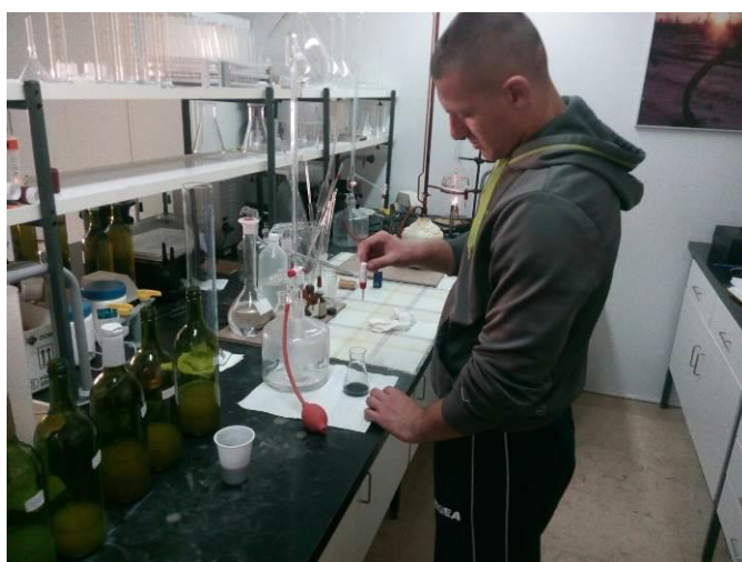
Slika 4. Određivanje sadržaja ukupnih kiselina u moštu