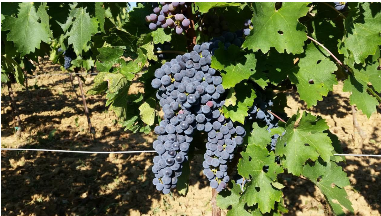
Slika 8. Cabernet sauvignon

Cabernet sauvignon tipična sorta malih grozdova visoke kakvoće koja daje visokokvalitetna vina. Vino je intenzivne rubin-crvene boje s prijelazom na ljubičastu, puno, ekstraktno s dosta alkohola, aromatično s karakterističnim travnatim okusom i skladno sadržajem ukupnih kiselina, specifičnoga sortnog mirisa i okusa.