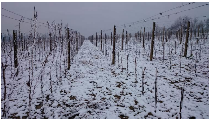
Slika 7. Pokušalište Mandićevac

Vrlo visoke temperature tijekom vegetacije mogu izazvati razna oštećenja u vidu opekline na vegetativnim i generativnim organima loze. Rast i razvoj se normalno odvijaju do 38° C, a na temperaturi preko 40° C, javljaju se oštećenja tkiva i usporava se proces fotosinteze. Štetan utjecaj visokih temperatura očituje se i u povećanju evotranspiracije, dolazi do pojave venuća i suše vinove loze što se loše održava na visinu prinosa.