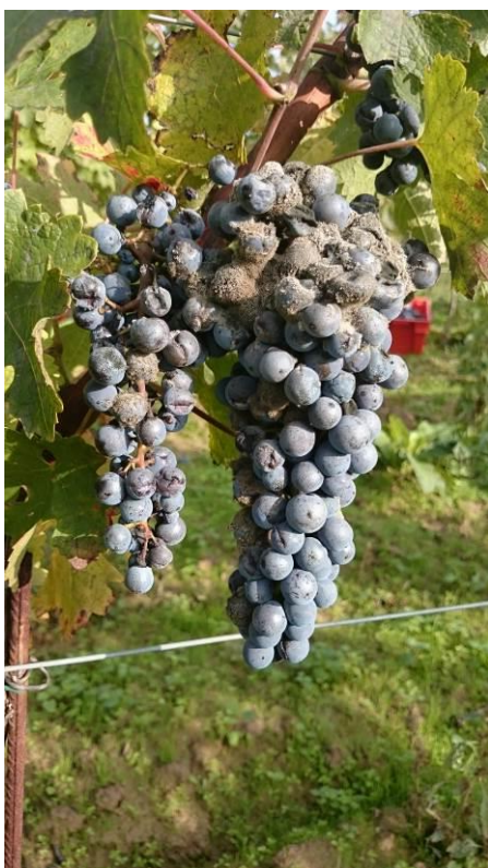
Slika 1. Cabernet sauvignon – grozd zaražen s Botrytis cinerea

Botrytis cinerea je kozmopolitna vrsta, uzročnik sive plijesni i utvrđena je na više od 235 biljnih vrsta. Smanjuje urod (u kontinentalnom dijelu i do 60%) i kakvoću grožđa utječući na proces vinifikacije. Prosječni troškovi primjene fungicida za zaštitu od sive plijesni (botriticidi) (za sve domaćine i zemlje) iznose 540 milijuna eura, što je oko 10% vrijednosti svih fungicida na svjetskom tržištu, a samo zaštita od B. cinerea na vinovoj lozi iznosi 50% ukupne vrijednosti potrošenih botriticida. Današnja suvremena proizvodnja uključuje uzgoj osjetljivih kultivara na uzročnika sive plijesni što značajno otežava uspješnu zaštitu. Prema načelima integrirane zaštite bilja kulturalne mjere pripadaju u zelene mjere i imaju prednost u odnosu na kemijske mjere kontrole patogena i trebaju biti promovirane u praksi. Za sada na našem području nije istraživani utjecaj ampelotehničkih zahvata kao što je uklanjanje lisne mase i zaperaka na pojavu ove bolesti. U programu zaštite bilja gdje se uvažavaju načela dobre prakse i što je više moguće ekološki pristup uz smanjenu uporabu kemijskih fungicida svakako treba uključiti ampelotehničke zahvate i primjenu biofungicida.