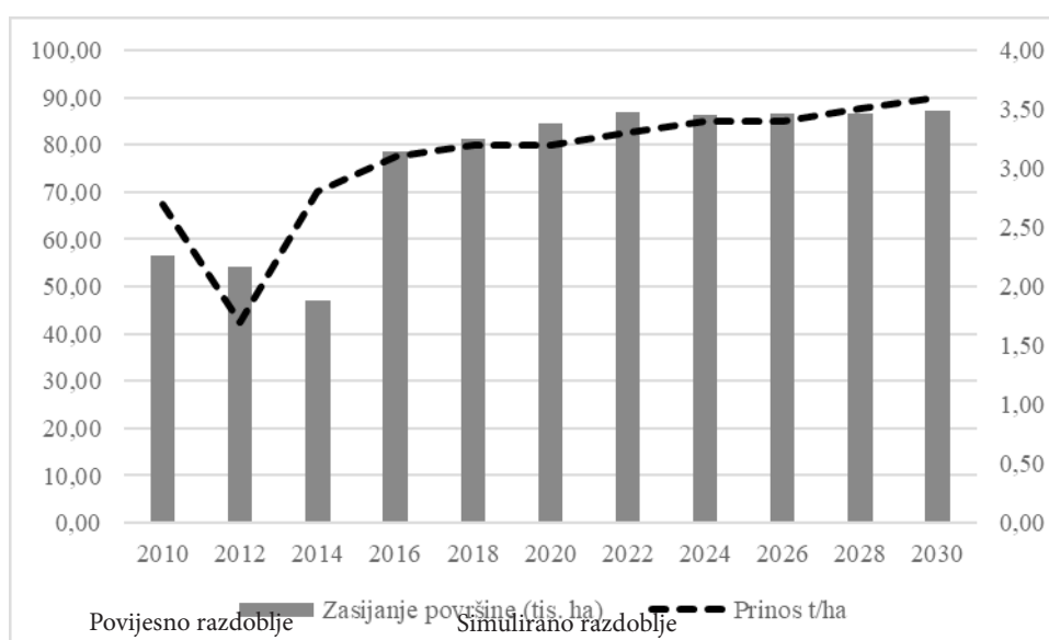
Grafikon 1: Pregled zasijanih površina i prinosa soje do 2030. godine

Rezultati modela ukazuju na pozitivna kretanja tržišta soje u Hrvatskoj do 2030. godine. Očekuje se kako će se površine zasijane sojom i dalje povećavati, no povećanje površina neće biti tako izraženo kao nakon ulaska Hrvatske u EU. Do kraja simuliranog razdoblja projiciran je rast površina zasijanim sojom od 2,52% (grafikon 1.). Prinos soje nastaviti će trend rasta, te se očekuje kako će 2030. godine iznositi otprilike 3,6 t/ha.