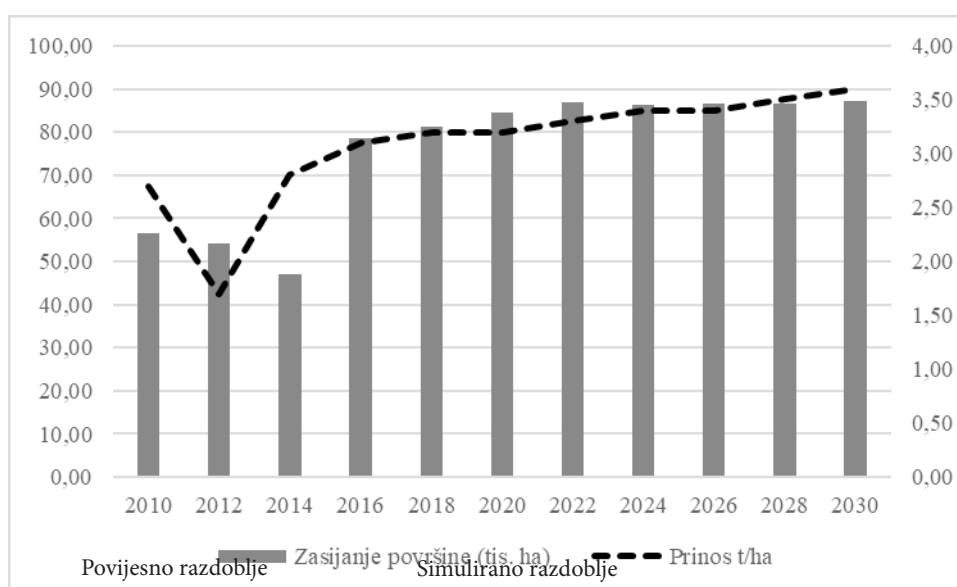
Grafikon 1: Pregled zasijanih površina i prinosa soje do 2030. godine

Rezultati modela ukazuju na pozitivna kretanja tržišta soje u Hrvatskoj do 2030. godine. Očekuje se kako će se površine zasijane sojom i dalje povećavati, no povećanje površina neće biti tako izraženo kao nakon ulaska Hrvatske u EU. Do kraja simuliranog razdoblja projiciran je rast površina zasijanim sojom od 2,52% (grafikon 1.). Prinos soje nastaviti će trend rasta, te se očekuje kako će 2030. godine iznositi otprilike 3,6 t/ha.