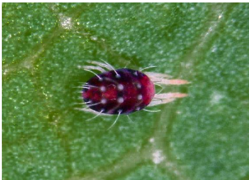
Slika 9. Crveni voćni pauk ( Panonychus ulmi )