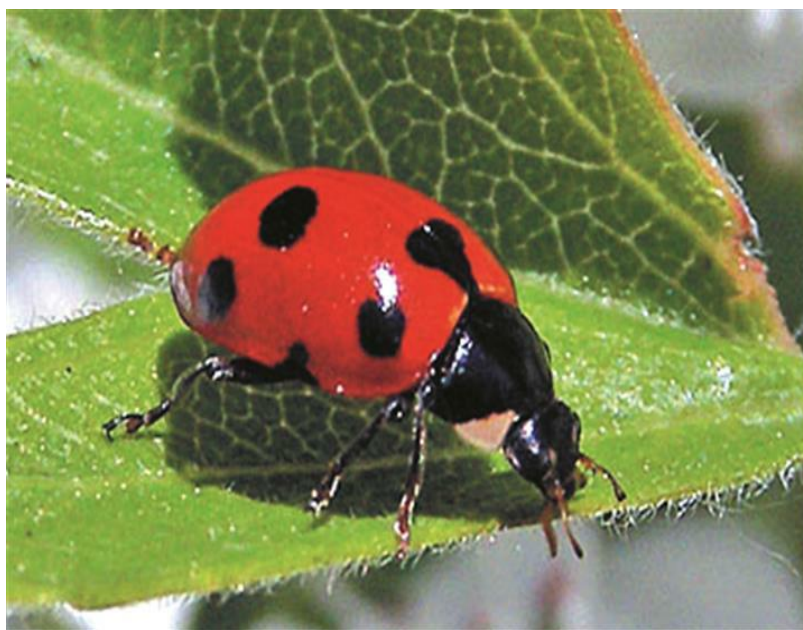
Slika 16. Božja ovčica – bubamara

koje se hrane štitastim ušima. Božje ovčice se zbog sposobnosti hranjenja grinjama, biljnim i štitastim ušima, koriste se za biološko suzbijanje štetnih kukaca u poljoprivredi, jer prisutnošću božjih ovčica uvelike se smanjuje primjena insekticida. Rodolia cardinalis je bila prva božja ovčica koja se koristila za biološko suzbijanje štetnika. U SAD-u se 1889. godine koristila za suzbijanje štitaste uši narančina crvca ( Icerya purchasi ). Da bi došlo do samanjenja populacije biljnih uši omjer brojnosti predator - žrtva trebao bi biti 1:20 ( http://www.magicus.info/ ).