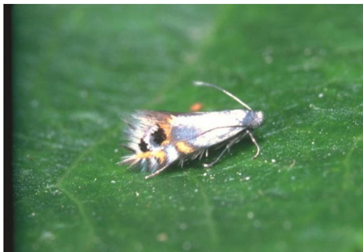
Slika 11. Moljac kružnih mina ( Leucoptera malifoliella )

U odnosu na ostale lisne minere, moljac kružnih mina je gospodarski najvažniji i najštetniji moljac. Osim roda Malus (jabuke i kruške) on napada i rod Prunus (višnja, trešnja, šljiva, breskva, marelica), Crataegus (glog) ( http://www.medjmurje.hr/ ).