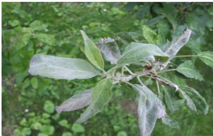
Slika 3. Pepelnica jabuke ( Podosphaera leucotricha )