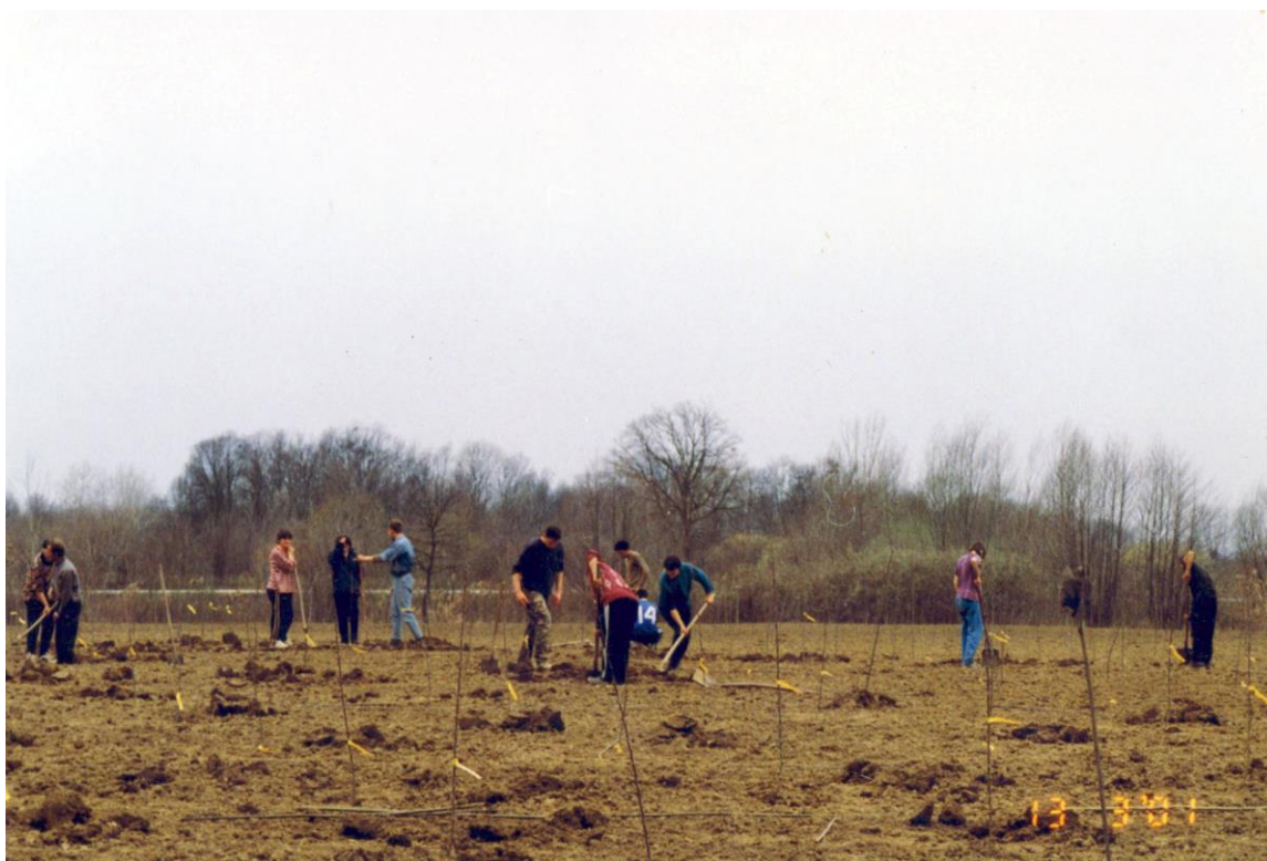
Slika 1. Sadnja voćnjaka 2001. godine

Godišnji prinos voćnjaka je oko 30 tona, od toga je jabuke I. klase oko 25 tona, a jabuke II. klase 7 - 8 tona.