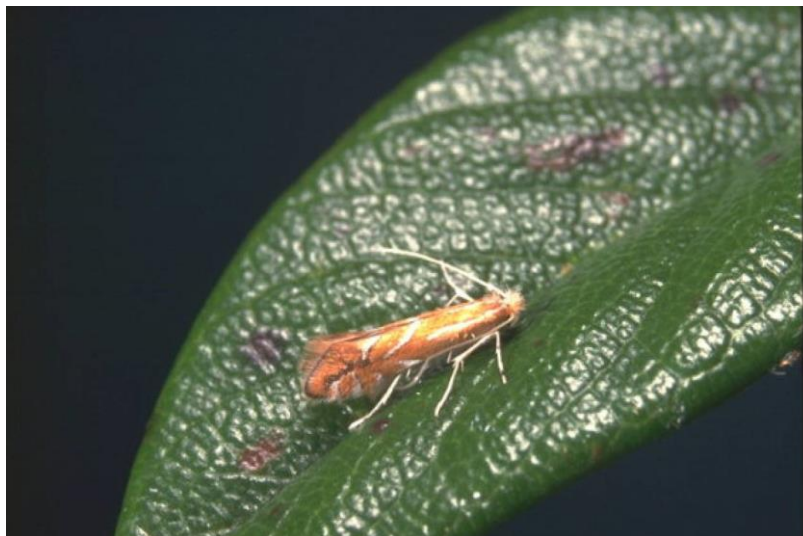
Slika 12. Moljac točkastih mina ( Phyllonorycter pomifoliella )

bijelim ili žućkastim crtama (Slika 12.). Raspon krila im je 8 do 9 mm. Gusjenica je žuto-smeđe boje sa svijetlim točkama ( http://pinova.hr/ ).