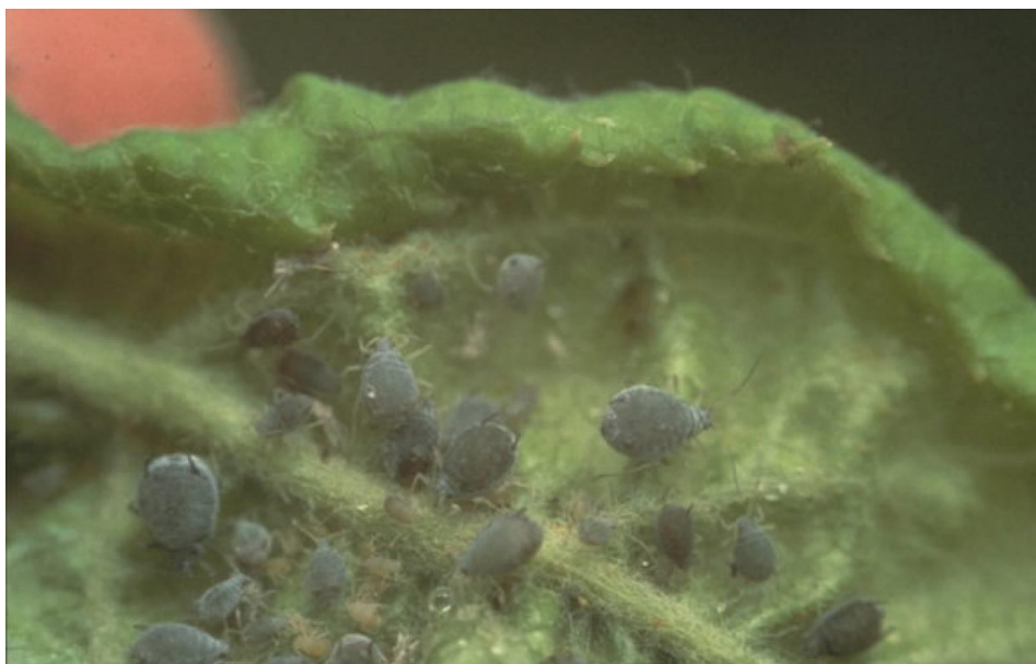
Slika 7. Pepeljasta uš ( Dysaphis plantaginea )

Jabučna pepeljasta uš raširena je u cijeloj Europi. Kod nas zauzima mjesto najštetnije vrste lisnih ušiju. Ima više domaćina jer je heterocijska vrsta. Štetna je samo za jabuku, jer joj je ona primarni domaćin, a biljke iz roda Plantago sekundarni su joj domaćini. Napada lišće, izboje i cvjetove. Na lišću u proljeće stvara velike kolonije. Na listu uš napada naličje lista, koje se kovrča oko srednje žile, požuti i osuši se (Slika 7.). Zbog napada izboji zaostaju u rastu, a sisanjem cvjetova uš uzrokuju deformacije plodova. Plodovi su kvrgavi, kržljavi i otpadaju. Dodatne štete na biljnim organima uzrokuju gljive čađavice, zbog medne rose. Pepeljasta uš daje 6 do 9 generacija godišnje, prekrivena je brašnenom voštanom prevlakom pa se još naziva brašnena uš. Kolonije su na jabuci prisutne u travnju, krilate ženke se javljaju u svibnju, i nakon migracija od rujna do studenog odrasli oblici se vraćaju i odlažu jaja. Prezimi kao zimsko jaje u bazi pupova ili ispod kore jabuke.