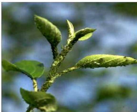
Slika 6. Zelena uš na jabuci ( Aphis pomi )

Vrlo je raširen štetnik u svijetu i kod nas, a osim jabuke nalazi se i na kruški, dunji, mušmulu, oskoruši. Monoecijska je vrsta jer ne migrira na ljetnog domaćina. Ova uš je žutozelene boje, duga do 2 mm, ima oko 17 generacija, one se sele na vrhove izboja i isključivo sišu vršno lišće koje ne mijenja boju, ali se deformira i kovrča (Slika 6.). Napadaju i ne odrvenjele vršne izboje koji se iskrivljuju i zaostaju u rastu. Zbog lučenja medne rose ušiju, napadnute organe prekrivaju gljive čađavice. U vrijeme bubrenja pupova javljaju se prve uši osnivačice, a u lipnju se javljaju krilate generacije koje šire zarazu na nezaražena stabla. Prezimljuje kao zimsko jaje na jabuci, na jednogodišnjim izbojima.