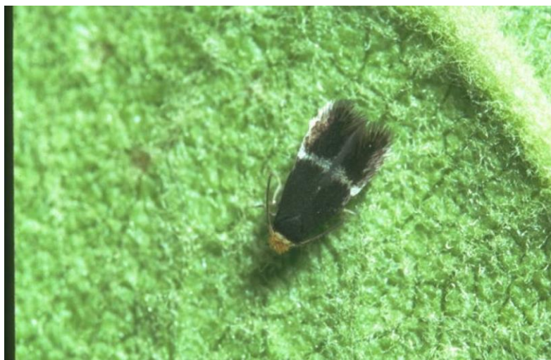
Slika 14. Patuljasti moljac miner ( Stigmella malella )

Patuljasti moljac miner štetnik koji je vrlo čest kod nas i može uzrokovati velike štete na jabuci. Ima tri generacije godišnje, prezimi u tlu kao kukuljica. Krila odraslih leptira su crna sa srebrnom crtom, promjer im je do 4 mm (Slika 14.). Leptiri počinju s letom od ožujka, a završavaju početkom rujna. Patuljasti moljac miner odlaže jaja na naličje list, iz kojih nataju vrlo sitne gusjenice. Gusjenice se buše u list i prave kratke vijugave mine, nakon čega napuštaju list i kukulje se u tlu. Štete na jabuci u većini slučajeva budu male, osim kod masovnih zaraza. Tada dolazi do sušenja lišća jer gusjenice putuju kroz list i sprečavaju fotosintezu. To suho lišće prijevremeno opada i na taj način dolazi do narušavanja fiziološkog balansa i ugrožavanja berbe ( http://pinova.hr/ ).