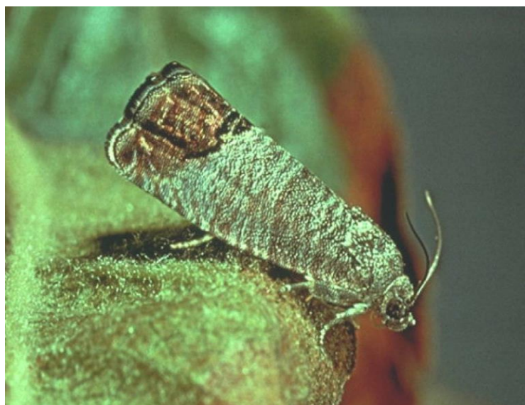
Slika 15. Jabučni savijač ( Cydia pomonella )

proces razvijanja koji traje 20 do 30 dana. Nakon razvoja u plodu, odrasla gusjenica ga napušta i pronalazi pukotine za kukuljenje na deblu i granama. Desetak dana nakon kukuljenja izlijeće leptir. Leptir s letom počinje u srpnju, a završava polovicom kolovoza, nakon čega odlaze jaja na plodove u koje se ubušuje gusjenice. Gusjenice u početku plod oštećuju samo površinski, a kasnije se dublje buše, sve do jezgre gdje kroz rupicu na plodu izbacuje izmet. Gusjenice u vrijeme zriobe napuštaju plod i odlaze na koru, pukotine na stablu i druga mjesta gdje prezimljuju. Kod jabučnog savijača prisutna je protandrija, mužjaci se javljaju prije ženki ( http://pinova.hr/ ).