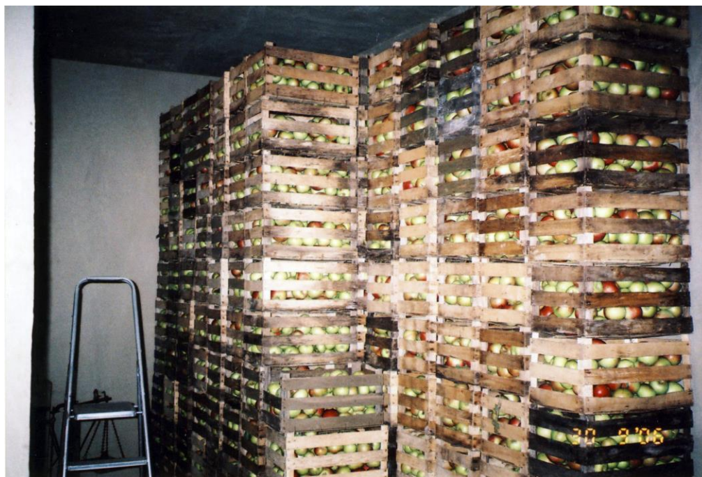
Slika 18. Hladnjača za skladištenje

Uz agrotehničke mjere, zaštita se provodila prskanjem fungicidima i to protiv pepelnice jabuke ( Podosphaera leucotricha ), krastavosti jabuke ( Venturia inaequalis ), smeđe truleži ploda jabuke ( Monilia fructigena ), te insekticidima i to protiv lisnih uši ( Aphididae ), jabučnog savijača ( Cydia pomonella ), lisnih minera, Crvenog voćnog pauka ( Panonychus ulmi ) i kalifornijske štitaste uši ( Aspidiotus perniciosus ). Prskanje se vršilo s nošenom traktorskom prskalicom marke Atomizer, zapremnine 440 litara. Za potpunu zaštitu tj. prskanje cijelog voćnjaka potrebne su 4 prskalice, što iznosi oko 1.500 litara/ha.