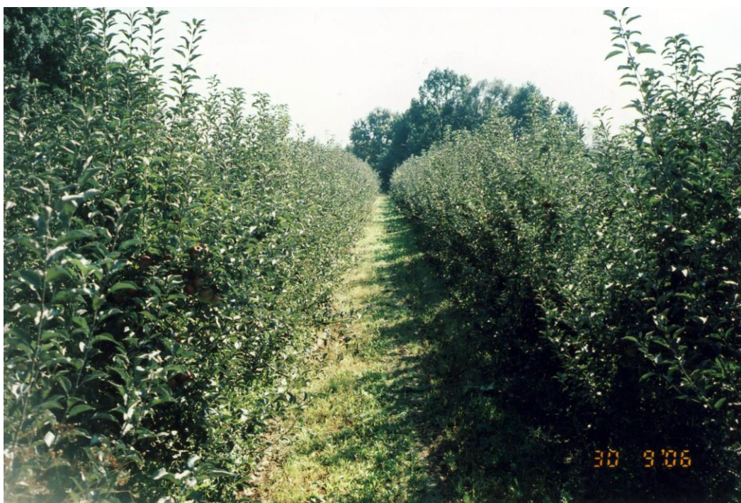
Slika 17. Voćnjak u kojem je provedeno istraživanje

Praćenje pojave bolesti i štetnika jabuke provedeno je od veljače do lipnja 2014. godine, u voćnjaku na OPG „Ergotić“, u Velikoj Kopanici (Slika 17). Voćnjak je podignut 2001. godine na podlozi MM-106. U njemu je posađeno 1.100 sadnica jabuka s razmakom sadnje 3,5 m puta 2,5 m, na površini od 1,1 ha. Uzgojni oblik stabala je vretenasti grm. Stabla su posađena u 30 redova, a svaki red sadrži između 30 i 35 stabala. Od sorata u voćnjaku se nalazi Jonagold, Zlatni delišes, Idared, Gloster i Mutsu, a najzastupljenija je Idared sorta (oko 70%), zatim Zlatni delišes (15%), i ostale sorte čine (15%).