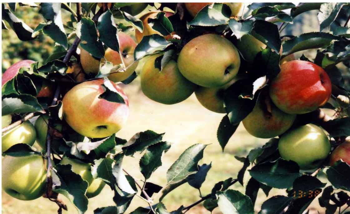
Slika 2. Jabuka

Bolesti i štetnici u voćarstvu i vinogradarstvu uzrokuju štete velikih razmjera. U Hrvatskoj ti gubitci za jabuke iznose 22% (Cvjetković, 2010.). Primjenom raznih mehaničkih, fizikalnih, bioloških, kemijskih, administrativnih i tehničkih mjera proizvodnje, te stručnim podizanjem nasada i uzgojem rezistentnih sorti, štete se mogu znatno umanjiti.