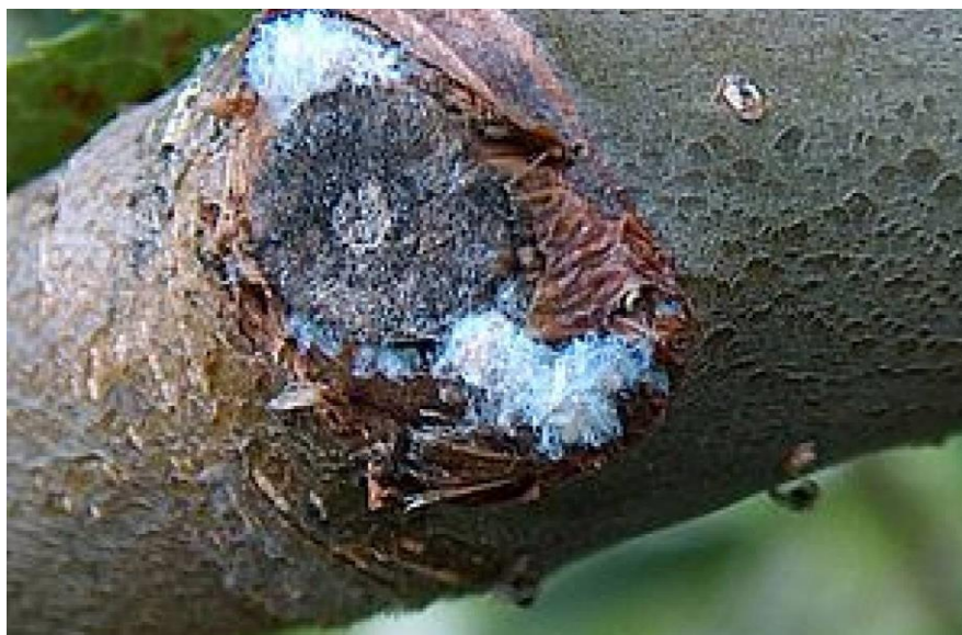
Slika 8. Krvava uš ( Eriosoma lanigerum )