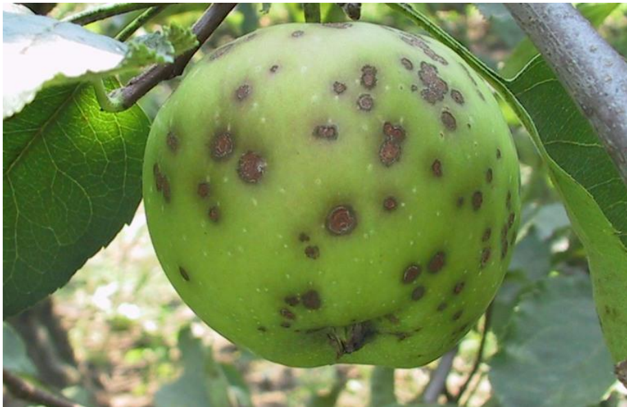
Slika 4. Krastavost jabuke – fuzikladij ( Venturia inaequalis )

Posljedica smanjene asimilacije i povećane transpiracije je opadanje plodova, venuće i sušenje listova. Bolest jako utječe na uzgoj kvalitetnih jabuka, stoga je cijeli program zaštite prilagođen suzbijanju fuzikladija (Kovačević i sur., 1960.).