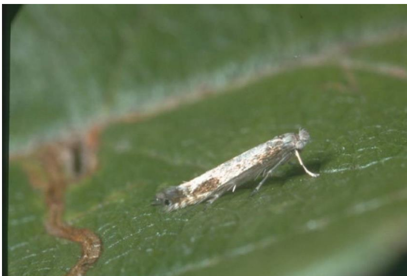
Slika 13. Moljac vijugavih mina ( Lyonetia clerkella )