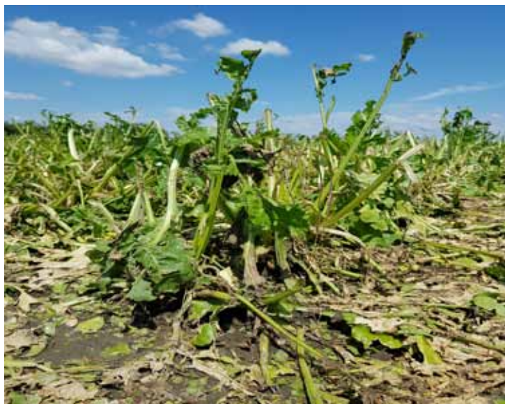
Slika 3. Oštećena šećerna repa nakon tuče u srpnju 2019. godine (original)

U Republici Hrvatskoj je prema podacima Državnog zavoda za statistiku (2020.) prinos šećerne repe 2016. godine je na razini države bio visok, 75,5 t/ha, a na OPG „Lidija Hanžek“ je postignuto čak 80,8 t/ha. Najmanji prinos u analiziranom razdoblju OPG „Lidija Hanžek“ je imao 2019. godine (65,2 t/ha), dok je u Republici Hrvatskoj prosječan prinos iznosio 61,2 t/ha (Državni zavod za statistiku Republike Hrvatske, 2020.). Sadržaj šećera u korijenu je bio najmanji u 2019. godini, ne toliko zbog visokih temperatura i suše nego zbog tuče koja se pojavila 7. srpnja 2019. godine te nanijela štetu na usjevu 70%. Nakon toga je uslijedila retrovegetacija, a usjevu je dodan biostimulator (Bioplex), međutim repa se nije uspjela oporaviti (Slika 3.).