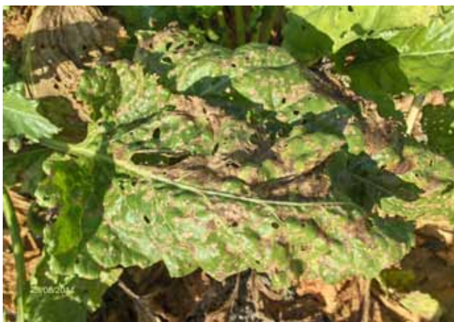
Slika 1. List šećerne repe zaražen gljivom Cercospora beticola Sacc. (original)

Veliki broj pjega na listu dovodi do propadanja, odnosno sušenja i nekroze listova (Slika 1.). Stoga, intenzivniji napad cercospore može dovesti do većeg gubitka listova, koje repa u povoljnim uvjetima nastoji obnoviti i formira novo lišće, odnosno dolazi do retrovegetacije. Novi listovi se razvijaju koristeći uskladišteni šećer iz korijena, dozrijevanje repe je usporeno, glava korijena je izdužena (Slika 2.), a korijen sadrži puno melasotvornog dušika. Ona repa koja je retrovegetirala ima nisku digestiju i smanjen prinos.