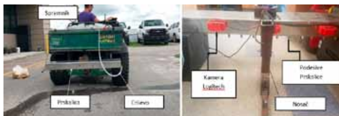
Slika 10. Pametna prskalica montirana na terensko vozilo (Partel i sur., 2019)

Jedan od suvremenih primjera zaštite bilja od korova je upotreba Smart Sprayer-a odnosno sustava koji se zasniva na strojnom učenju (machine learning). Smart Sprayer sadrži mlaznice, crpku, RTK GPS (točnost oko 2 cm), tri video kamere (Webcam Logitech c920), pametni kontroler (Arduino mega) za upravljanje svim sensorima i aktuatorima (npr. crpka), računsku jedinicu (NVIDIA Jetson TX2 GPU) za obradu slike i detekciju korova (Slika 10.). Kako bi se postigla precizna aplikacija i kreirala aplikacijska karta (karta korova) razvijen je program korištenjem C programskog jezika. Softver radi u stvarnom vremenu i može obraditi do 28 sličica u sekundi u svim koracima zajedno: akvizicija slike, detekcija objekata i komunikacija. Za preciznu mrežnu detekciju upotrebljava se YOLOv3 (Slika 11.)