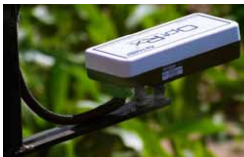
Slika 4. Bazna stanica Picture 4. Base station