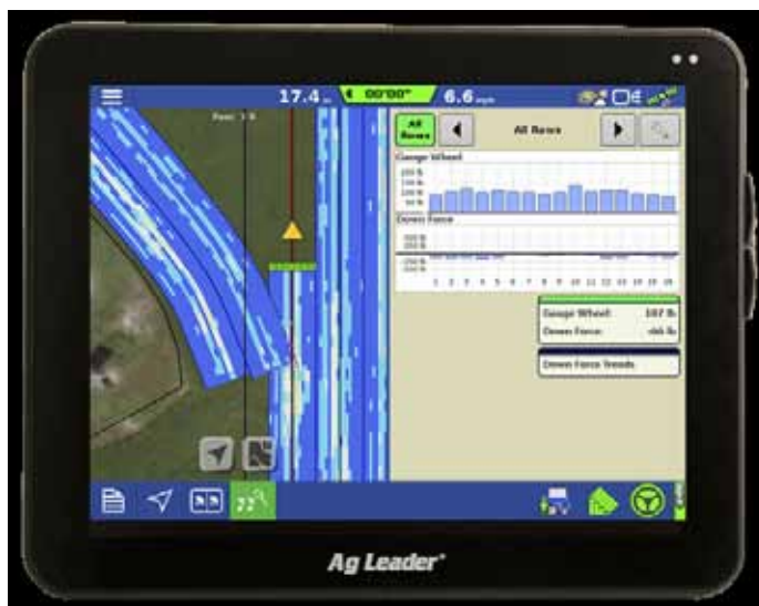
Slika 1. AgLeader zaslon Picture 1. AgLeader display