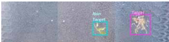
Slika 11. Pametno otkrivanje korova za apliciranje i biljke (Partel i sur., 2019)