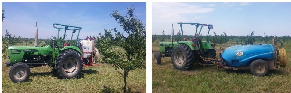
Slika 1 Raspršivači Agromehnika AGP 200 ENU i Tifone Vento 1500 Figure 1 Agromehnaika AGP 200 ENU and Tifone Vento orchard sprayers

Vučeni raspršivač Tifone Vento 1500 (Slika1.) opremljen je spremnikom tekućine obujma 1500 litara. Mlaznice Lechler TR 8002C i ITR 8002C postavljene su polukružno na obodu usmjerivača po šest mlaznica sa svake strane. Ventilator se sastoji od 8 lopatica, a promjer ventilatora iznosi 810 mm. Brzinu zračne struje moguće je podešavati promjenom radnog položaja lopatica ventilatora. Na raspršivač je instalirana klipno-membranska crpka proizvođača Tifone kapaciteta 105 \text{ l min}^{-1} (model crpke 110 VD s dvije membrane) a najveći dopušteni radni tlak je 50 bar. Oba raspršivača agregatirani su traktorom Torpedo 6006K snage motora 42 kW.