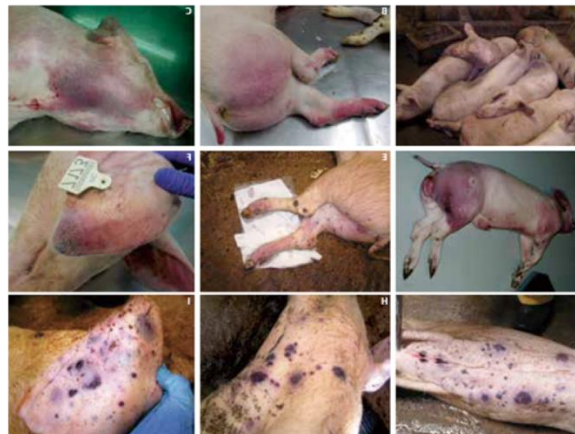
Slika 1. Svinje oboljele od afričke svinjske kuge