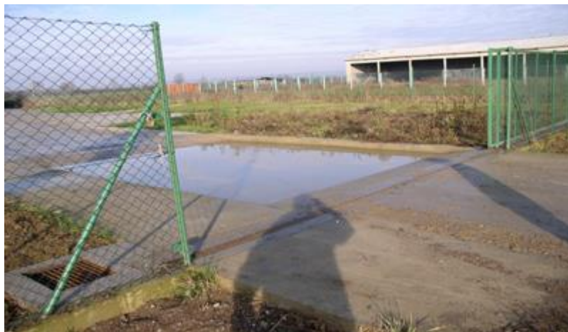
Slika 4. Ulaz u farmu sa propisanim pravilima ulaska i dezinfekcijskim barijerama za vozila

uvjetnih grla koje se nalaze na farmi (Antunović i sur., 2012.). Prema istome pravilniku propisano je da svi putevi koji vode prema farmi trebaju biti izbetonirani ili asfaltirani kako bih pristup objektu bio olakšan vozilima. Ulaz u farmu mora biti strogo kontroliran, dopušten samo zaposlenim osobama, dostavi hrane, lijekova, vode, plina, materijala ili drugim kategorijama subjekata, uz prethodnu najavu voditelja farme. Osobe koje ulaze u farmu ne smiju posjedovati svinje, živjeti u domaćinstvu gdje ima svinja, niti odlaziti u lov, a 48 sati prije ulaska u farmu ne smiju biti u kontaktu sa svinjama, niti smiju boraviti na područjima ugroženim i zaraženim od svinjske kuge (Antunović i sur., 2012.). Prema članku 9. Pravilnika o minimalnim uvjetima kojima moraju udovoljiti farme i uvjetima za zaštitu životinja na farmama (NN 136/2005), krug farme mora biti ograđen prikladnom ogradom koja sprječava nekontroliran ulaz ljudi i/ili životinja. Shodno tome, na samom ulazu u farmu mora postojati dezinfekcijska barijera za vozila (6,0 x 3,0 x 0,25 m), za obuću (1,0 x 0,5 x 0,05 m) i dezinficijens za ruke.