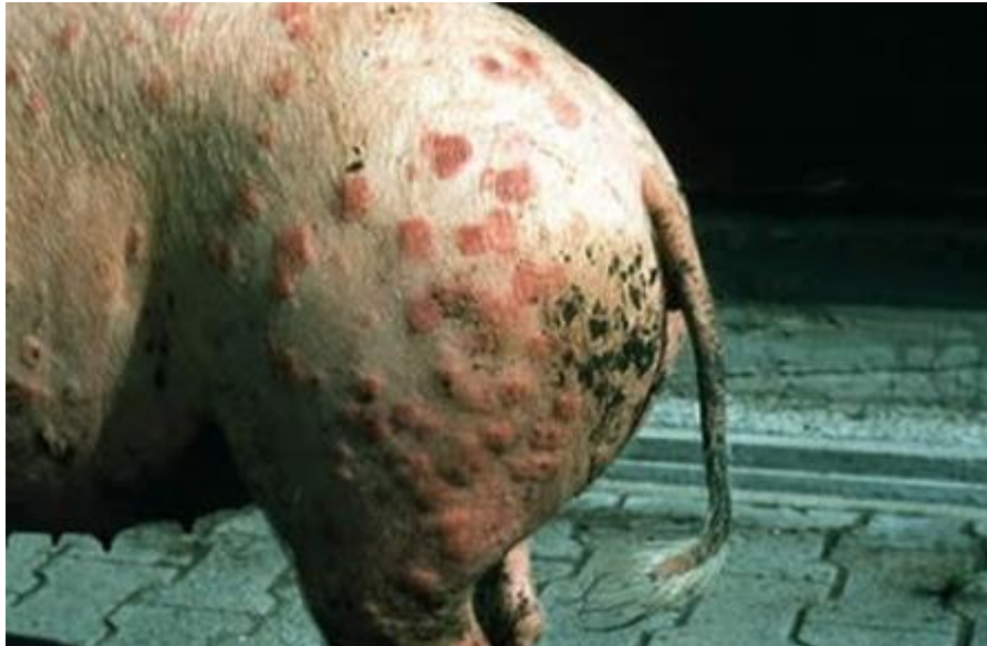
Slika 2. “Dijamantna koža” bolesti Vrbanca

karakteristične kožne lezije, poput urtikarije (dijamantna koža). Uobičajeni kronični znakovi su artritis, limfadenitis i endocarditis (Opriessnig i sur., 2019.).