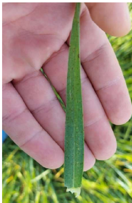
Slika 16 Ramularijska pjegavost

Visoka relativna vlaga zraka i izmjena toplog i hladnog vremena snažno je utjecala na razvoj ječma koji je iznimno stagnirao u rastu te je bio iscrpljen i ranjiv. Samim time razvoj i pojava bolesti bila je u jakom intenzitetu. Prva zaštita obavljena na usjevu bila je kurativna jer je već došlo do pojave bolesti. Uočena je i ramularijska pjegavost lista ječma (slika 17) kojoj je uzročnik patogen Ramularia collo-cygni . Prvo se pojavila u obliku malih točkica koje su se kasnije širile paralelno s nervaturom lista.