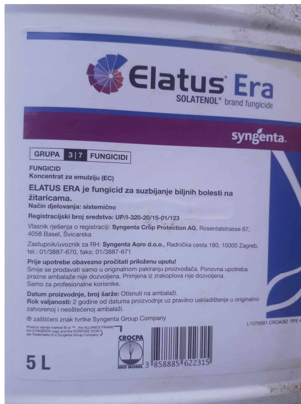
Slika 10 Elatus era