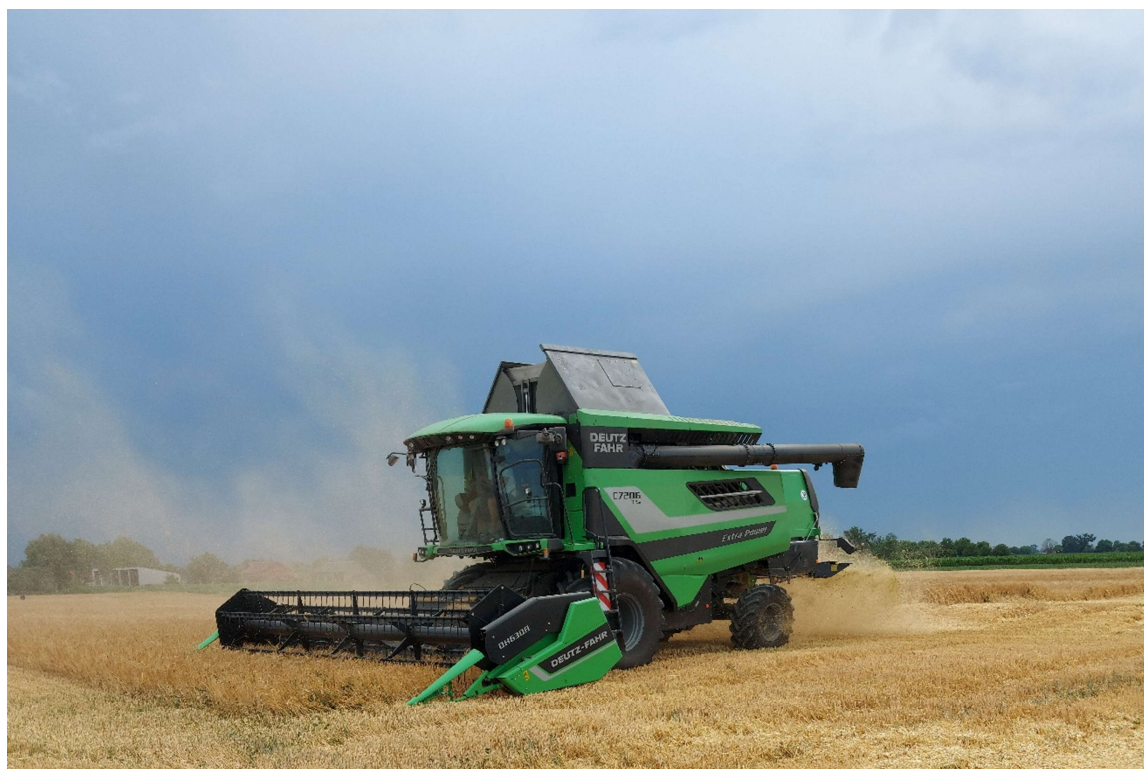
Slika 13 Žetva