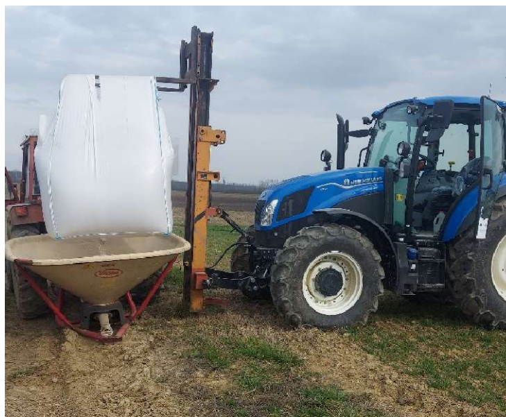
Slika 8 Prihrana