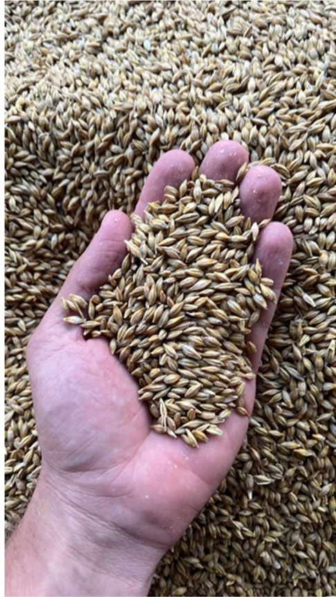
Slika 1. Ječam

Svi uzgajani ječmovi (slika 1) mogu biti višeredni ili dvoredni. Dvoredni su ječmovi specifični po simetričnom rasporedu zrna u klasovima, a kod višerednih ječmova raspored zrna simetričan je i asimetričan u odnosu 40:60 % (Kovačević, V. 2005.).