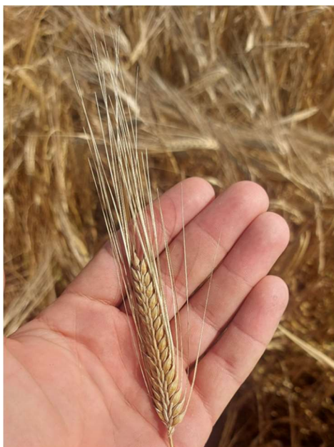
Slika 12 Klas ječma