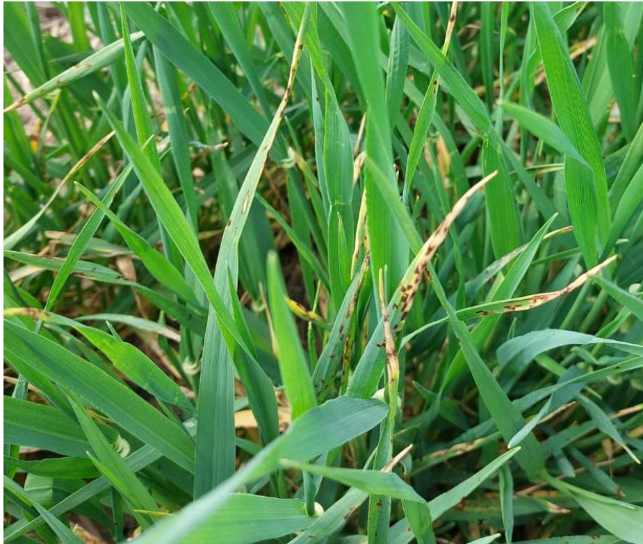
Slika 3. Mrežasta pjegavost lista ječma ( Pyrenophora teres )

Biološke su mjere primjena biokontrolnih agensa poput bakterija roda Bacillus ili gljiva Trichoderma koje pokazuju potencijal u kontroli mrežaste pjegavosti. Istraživanja sugeriraju da biološki agensi mogu pomoći u smanjenju pojave bolesti.