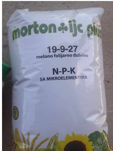
Slika 9 Mortonije