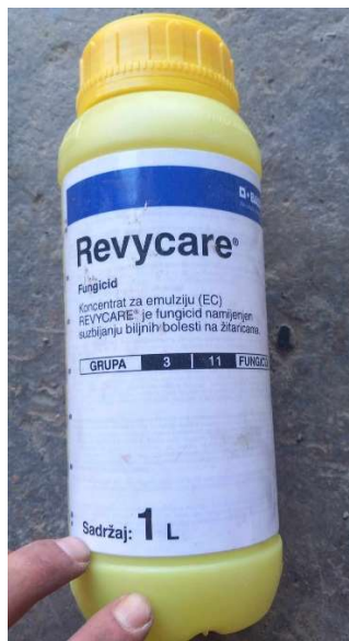
Slika 11 Fungicid Revycare

Druga prihrana obavljena je 30. ožujka 2023. također KAN-om u dozi od 80 kg/ha, dok je druga folijarna prihrana obavljena 12. travnja 2023. gnojivom Mortonijc u količini od 5 kg/ha. Mortonijc folijarno je gnojivo koje sadrži tri osnovna elementa ishrane N, P i K u omjeru 19:9:27 te razne mikroelemente potrebne za normalan rast i razvoj biljke (slika 10). Jako je širok spektar djelovanja ovog gnojiva, a vrijeme primjene ovisi o kulturi koju uzgajamo. Iznimno dobro djeluje na razvoj habitusa i korijenovog sustava te povećava kvalitetu i prinos oko 10 %.