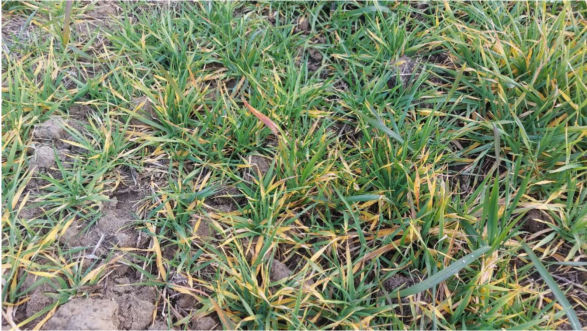
Slika 14 Kloroza na ječmu