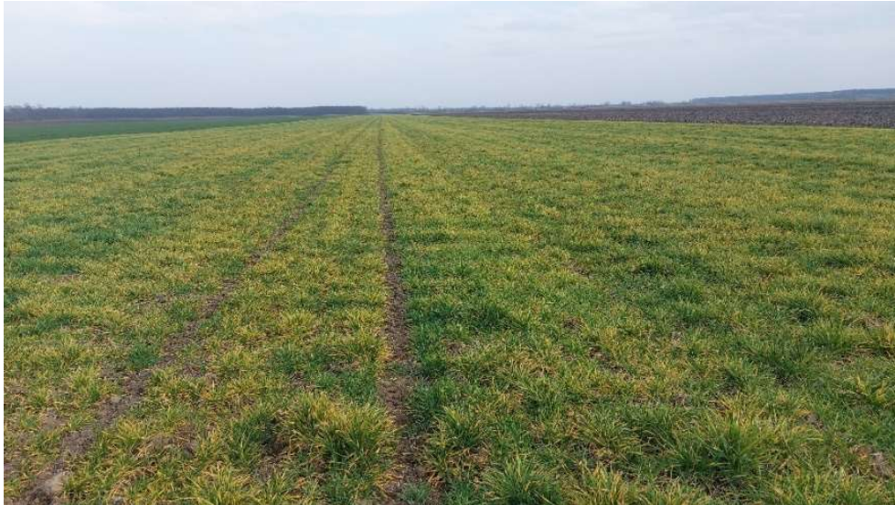
Slika 6 Pokusno polje ječma