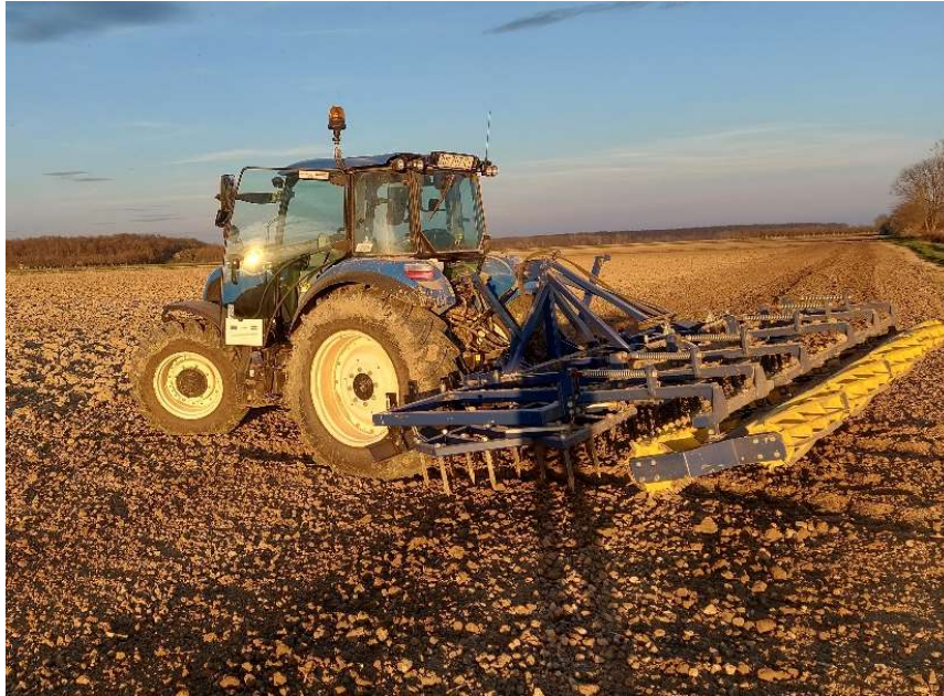
Slika 7 Predsjetvena priprema

Zbog izrazito toplog vremena i mogućnosti ulaska na parcelu prva je prihrana (slika 9) obavljena 24. veljače 2023. i to KAN-om 27 % u količini od 175 kg/ha. KAN 27 % je kruto gnojivo koje sadrži nitratni oblik dušika što je iznimno važno jer je odmah dostupan mladim biljkama za rast i razvoj. S druge strane amonijski se oblik postupno oslobađa omogućavajući dulje razdoblje dostupnosti tijekom rasta biljaka. Naime dušik mladim biljkama omogućuje ubrzani rast zelenih nadzemnih dijelova, povećava aktivnost fotosinteze u listovima, a samim time povećava se i prinos kultura. U tlu djeluje neutralno te je posebno pogodan za prihranu na kiselim tlima.