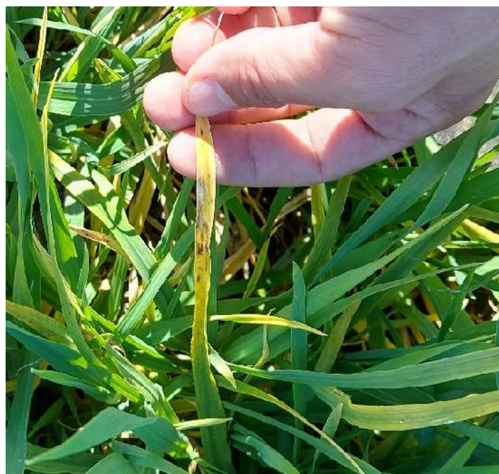
Slika 5 Pepelnica ječma ( Blumeria graminis )

Agrotehničke su mjere zaštite sjetva otpornih sorti, uništavanje korova, samoniklih žita i trava.