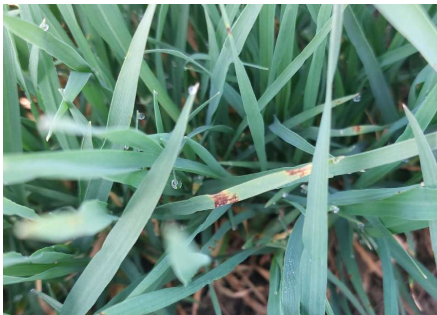
Slika 4. Ramularijska pjegavost lista ječma ( Ramularia collo-cygni )