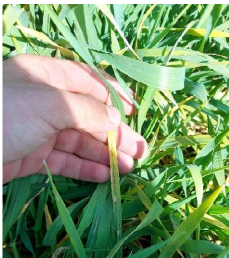
Slika 2. Siva pjegavost ( Rhynchosporium secalis )

Gljiva Rhynchosporium secalis prezimljuje na ostacima zaraženih biljaka te se može prenijeti zaraženim sjemenom i samoniklim ječmom. Optimalni su uvjeti za razvoj sive pjegavosti temperatura između 12 i 24 °C, uz prisutnost kiše, rose i visoke relativne vlažnosti zraka iznad 90 %.