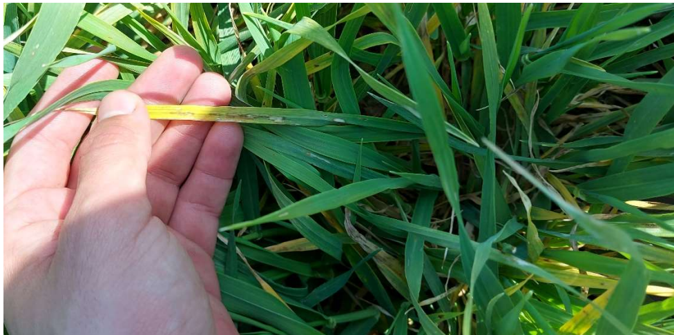
Slika 15 Siva pjegavost ( Rhynchosporium secalis )

Prva pojava pepelnice ( Blumeria graminis ) i sive pjegavosti ( Rhynchosporium secalis ) (slika 16) zabilježena je u veljači, a zbog optimalnih uvjeta brzo se proširila. Najveći intenzitet pojave i razvoja simptoma bio je krajem ožujka kada smo, da bismo spriječili štetu, započeli sa zaštitom.