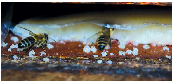
Slika 9: Prihrana pčela pogačom

košnici stvaraju uvjeti da matica intenzivnije polaže jaja. Šećerni sirup za prihranu pčela pripremamo u odnosu šećer: voda = 1:1. Za pripremu sirupa koristimo isključivo čist konzumni šećer.