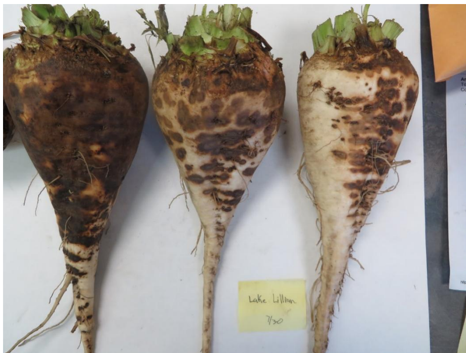
Slika 16. Trulež korijena šećerne repe uzrokovana gljivom R. solani .

Na slici 17. vidljiva je trulež korijena šećerne repe uzrokovana patogenom gljivom Rhizoctonia solani .