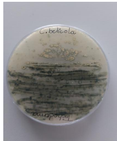
Slika 8. Trichoderma spp. i C. beticola (zadnja strana petrijevke)