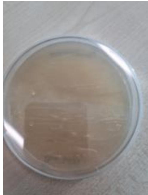
Slika 24. Endomikorizne gljive i B. thuringiensis (zadnja strana petrijevke)