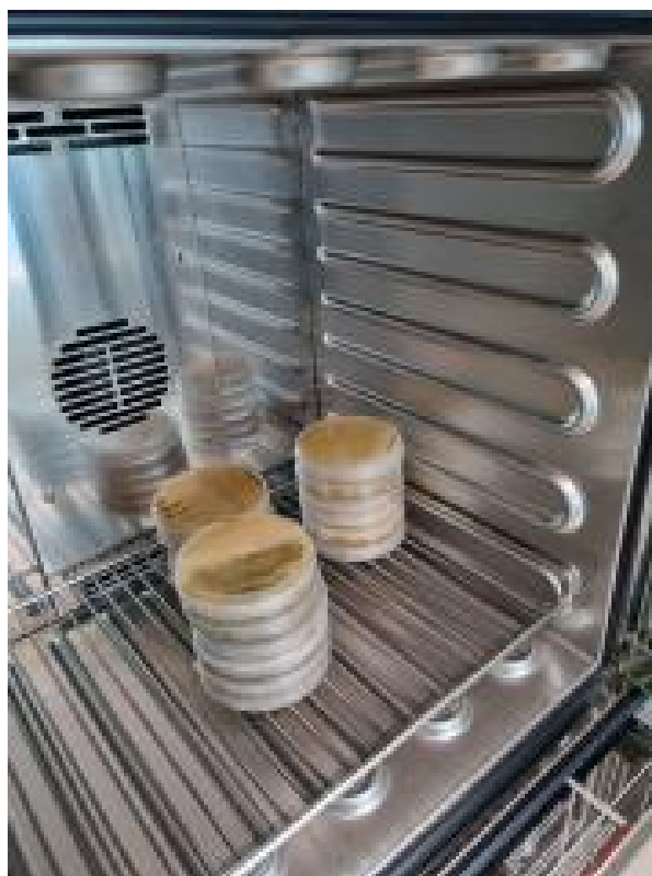
Slika 3. Petrijeve zdjelice u termostatu

Nakon 48 sati inkubacije, provjerili smo porast kultura. Od tada smo provjeravali svakih 24 sata, s obzirom da je porast mikroorganizama različit, posebno zato što se radi o različitim vrstama. Temperatura je prilagođena, koliko se moglo, optimalnom dijapazanu za svaku kulturu. Različite vrste bakterija i gljiva treba različito vrijeme inkubacije i različita im je brzina rasta. Tako ih se većina razvila za 3 – 5 dana. Izuzetak su gljiva Beauveria bassiana kojoj je trebalo 6 – 8 dana, te Cercospora beticola kojoj je trebalo gotovo tri tjedna da počne razvijati koloniju. Kako bi se taj antagonizam između primjenjenih mikroorganizama dobro uočio i kako bi razlika između antagonističkih i konkurentskih odnosa bila vidljivija, fotografirali smo kulture pred kraj njihove treće faze razvoja, faza mirovanja, kada su morfološki i fiziološki zrele ali su pred ulazak faze opadanja (4. faza).