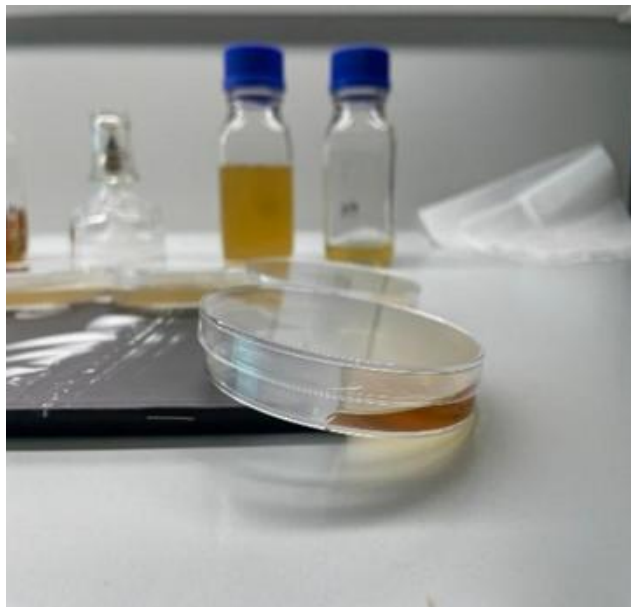
Slika 1. Izlijevanje selektivne hranjive podloge na polovicu Petrijeve zdjelice

Za svaki mikroorganizam koristili smo za njih selektivne hranjive podloge.