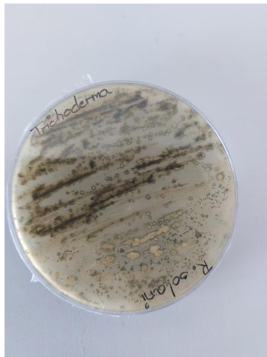
Slika 15. Trichoderma spp. i R. solani (zadnja strana petrijevke)