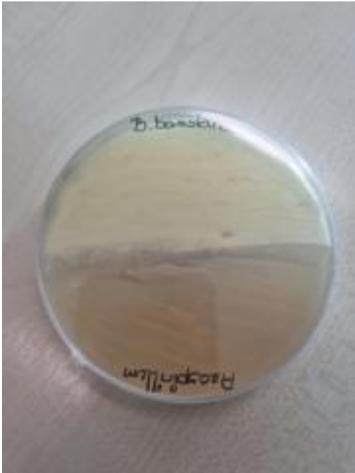
Slika 19. A. brasilense i B. bassiana (prednja strana petrijevke)

Azospirillum brasilense → Beauveria bassiana