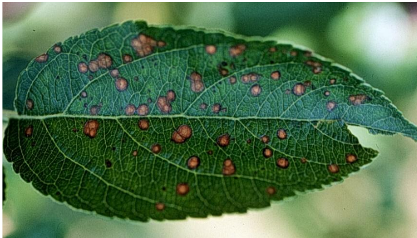
Slika 12. Simptomi napada patogene gljive A. alternata na lišće jabuke.