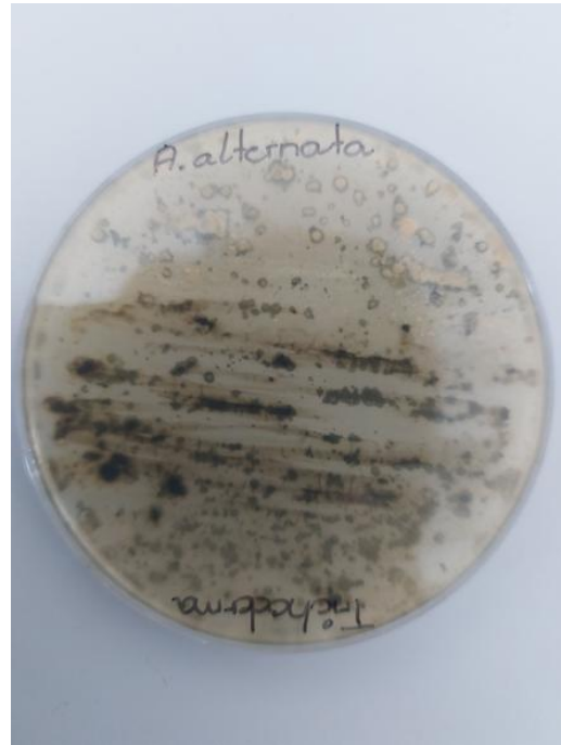
Slika 11. Trichoderma spp. i A. alternata (zadnja strana petrijevke)