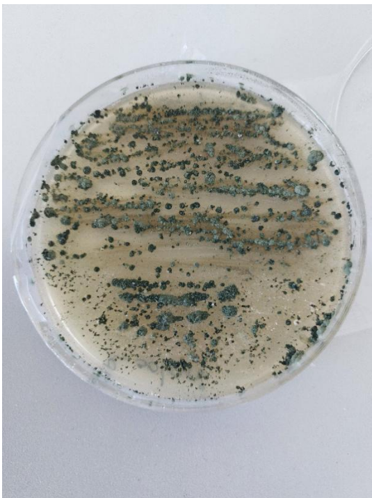
Slika 14. Trichoderma spp. i R. solani (prednja strana petrijevke)