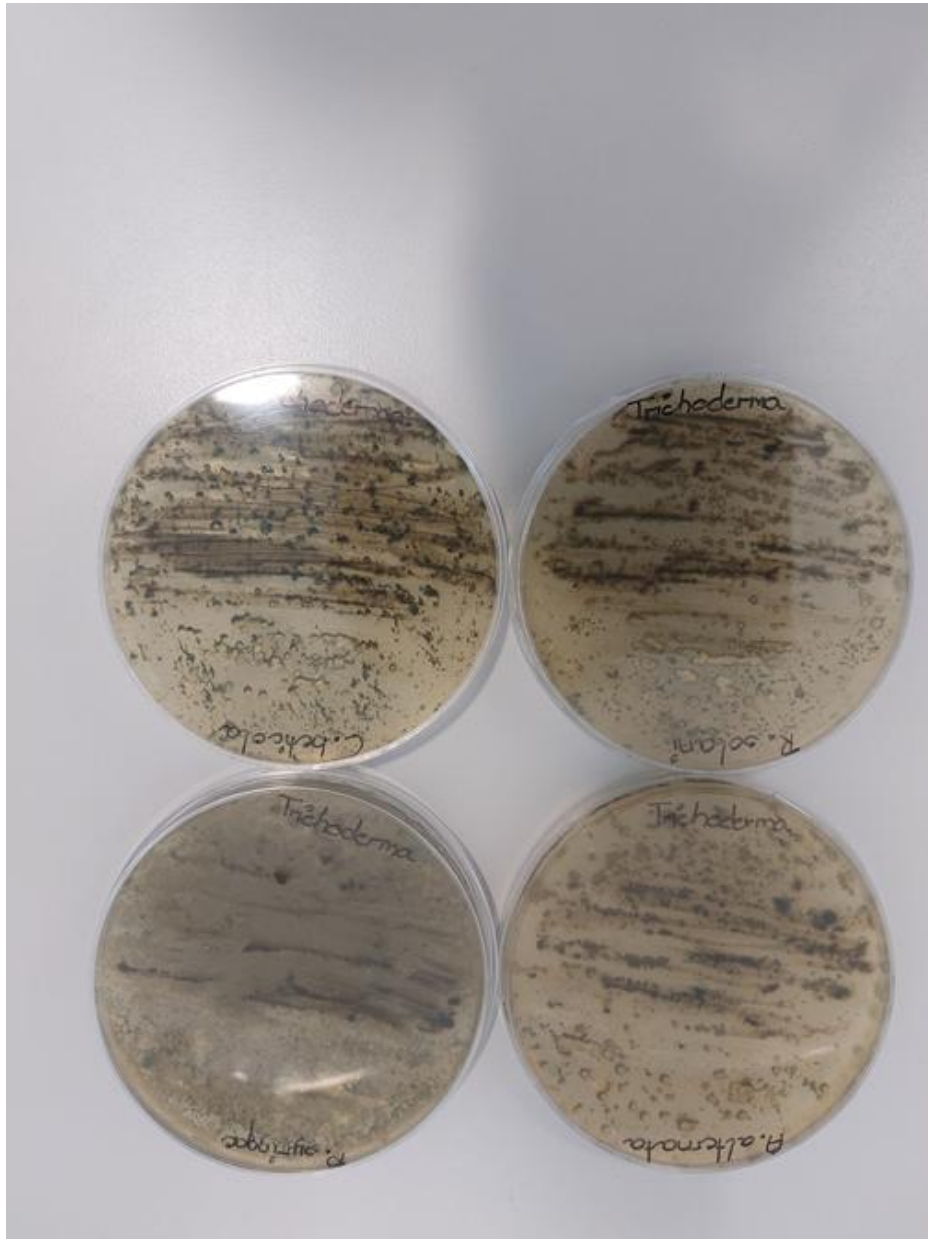
Slika 18. Antagonističko djelovanje benefitne gljive Trichoderma spp. prema patogenim mikroorganizmima (zadnja strana petrijevke)