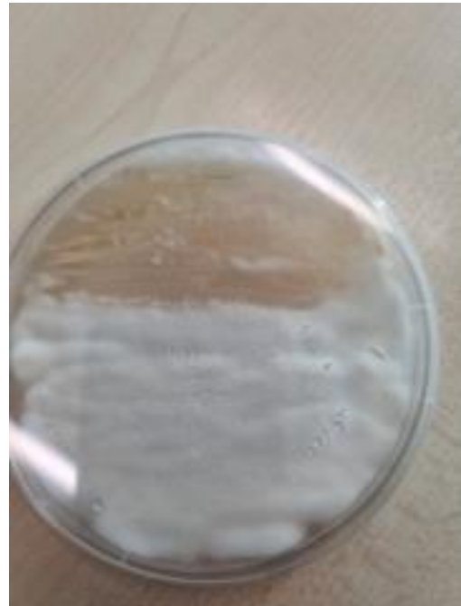
Slika 20. A. brasilense i B. bassiana (zadnja strana petrijevke)