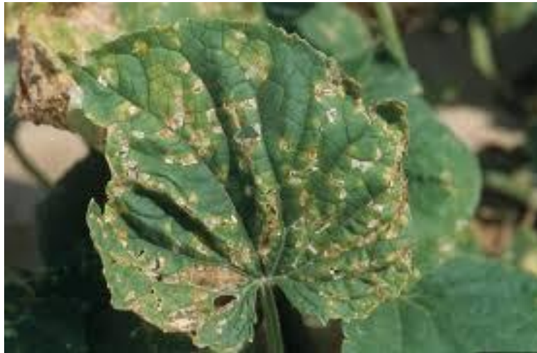
Slika 6. Simptomi infekcije patogene bakterije P. syringae na listu krastavca.