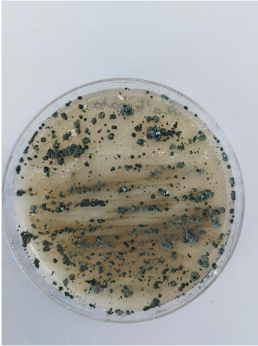
Slika 10. Trichoderma spp. i A. alternata (prednja strana petrijevke)