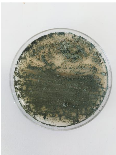
Slika 4. Trichoderma spp. i P. syringae (prednja strana petrijevke)