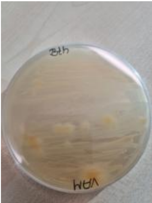
Slika 23. Endomikorizne gljive i B. thuringiensis (prednja strana petrijevke)