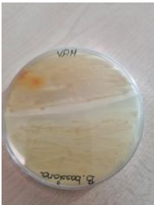
Slika 21. Endomikor. gljive i B. bassiana