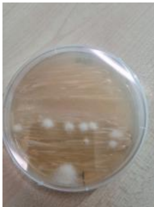
Slika 22. Endomikor. gljive i B. bassiana