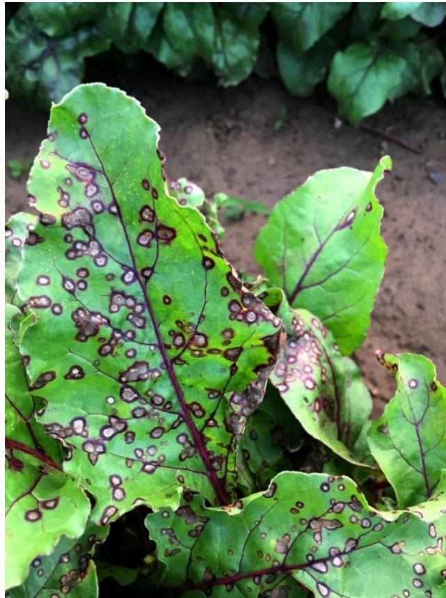
Slika 9. Simptomi infekcije patogene gljive C. beticola na lišću šećerne repe.