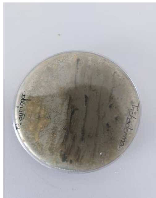
Slika 5. Trichoderma spp. i P. syringae (zadnja strana petrijevke)