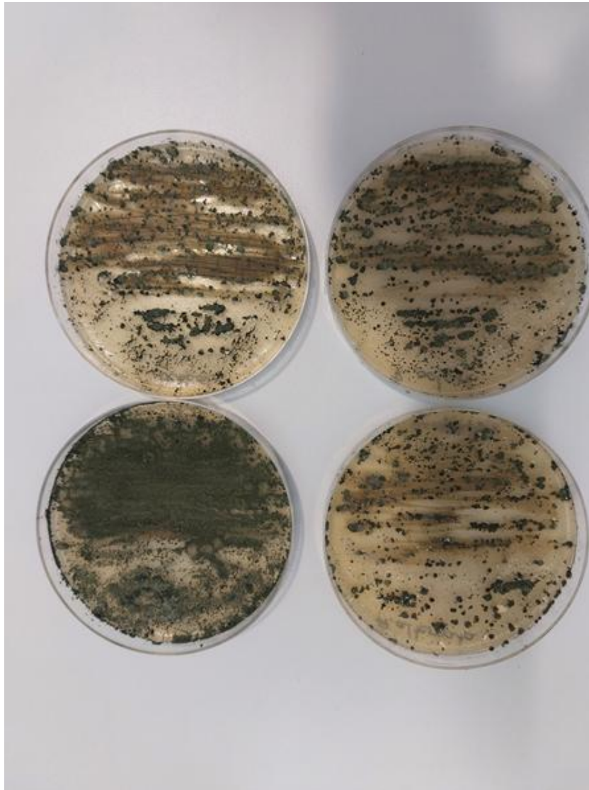
Slika 17. Antagonističko djelovanje benefitne gljive Trichoderma spp. prema patogenim mikroorganizmima (prednja strana petrijevke)

Na slikama 17. i 18. može se vidjeti intenzitet djelovanja gljive Trichoderma spp. na navedenu bakteriju i gljive. Trichoderma spp. najviše se razvila u petrijevki gdje je istovremeno zasijana bakterija Pseudomonas syringae , dok je slabiji razvoj u petrijevka gdje su zasijane gljive, iako je antagonizam neupitan.