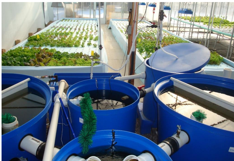
Slika 2. Primjer akvaponskog sustava

Akvaponski proizvodni sustavi uzgajaju vodene organizme, posebno one vrste koje zahtijevaju stalnu opskrbu hranom kao što su ribe, vodozemci, rakovi i drugi beskralješnjaci. Hranjive tvari dobivene iz izlučevina ovih organizama koriste se za potporu rastu biljaka. Pod pojmom biljke podrazumijeva s proizvodnja algi, uzgoj biljaka bez tla, vrtlarske biljke te pojedini usjevi. Kao rezultat povijesnog razvoja akvaponike, a prema definiciji koju je predložio Rakocyj (2012.), akvaponika obuhvaća uzgoj vodenih organizama koji uključuje proizvodnju biljaka bez tla. Ovo se odnosi na hidroponsku proizvodnju biljaka korištenjem otpadnih voda ili hranjivih tvari koje potječu iz uzgoja vodenih organizama. Prema definiciji akvaponike, većina (oko 50 %) hranjivih tvari za održavanje optimalnog rasta biljaka mora potjecati iz otpada koji potječe od hranjenja vodenih organizama. Posljedično, akvaponika u užem smislu ograničena je na hidroponski princip bez upotrebe tla ili supstrata kao što su pijesak ili šljunak. Najnoviji integrirani sustavi akvakulture kombiniraju proizvodnju ribe s algama, bilo makroalgama unutar zasebnih spremnika ili mikroalgama unutar foto-bioreaktora. U oba slučaja proizvodni proces je bez ikakvih supstrata sličnih tlu i time spada pod koncept akvaponike. Na temelju namjene i funkcije poznatih akvaponskih sustava, moguće je razlikovati četiri glavne kategorije, otvorene ribnjake, domaće, demonstracijske i komercijalne akvaponske sustave (Palm i sur., 2018.).