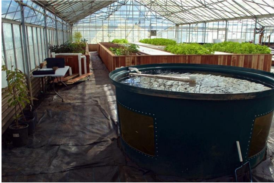
Slika 12. Akvaponski uzgoj u stakleniku