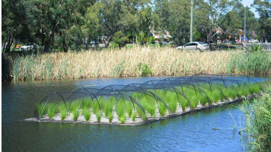
Slika 3. Primjer otvorene akvaponike