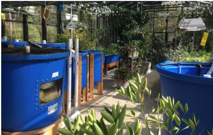
Slika 13. Ekološki i ekonomski održivi razvoj

Akvakultura označava više aktivnosti u smislu primjene biologije, genetike, ekonomije, tehnologije i ostalih potrebnih znanja. To je skup aktivnosti za uređenje i kontrolu vodene sredine u svrhu proizvodnje životinja i biljaka korisnih čovjeku. Intenzivan razvoj akvakulturne industrije je popraćen porastom utjecaja na okoliš. Recirkulacijska akvakultura je tehnologija za proizvodnju riba ili drugih akvatičnih organizama ponovnim korištenjem vode. Recirkulacijska tehnologija je bazirana na uporabi mehaničkih, električnih i bioloških komponenti filtracije koje omogućuju pročišćavanje i obradu uzgojne vode te njeno kontinuirano i ponovno korištenje. Recirkulacijski sustavi su dizajnirani za uzgoj velikih količina ribe u relativno malom volumenu vode tretirajući je navedenim procesima filtracije. Uz očuvanje energije i smanjenje površine kopna potrebne za uzgoj, prednost je u smislu smanjenja potrošnje vode, napredne mogućnosti gospodarenja otpadom i recikliranja hranjivih tvari, bolje higijene i upravljanja bolestima te biološke kontrole onečišćenja. Prednosti ovakvih sustava su mnogobrojne: od zaštite okoliša zbog recikliranja vode, preko organske ishrane biljaka i uklanjanja otpadnih tvari iz vode, pa do smanjenja potreba za zemljištem za proizvodnju povrtnih kultura i na kraju do redukcije patogena u akvakulturnoj proizvodnji (Roštan Cahunek, 2017.).