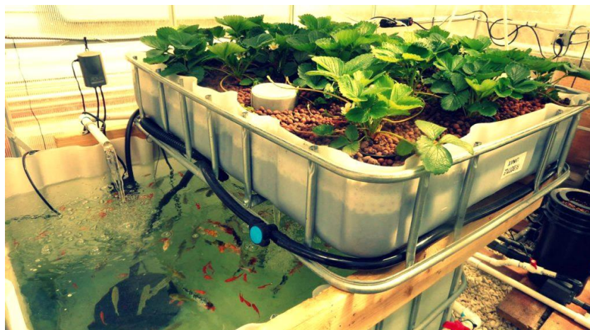
Slika 4. Jednostavni sustav kućne akvaponike