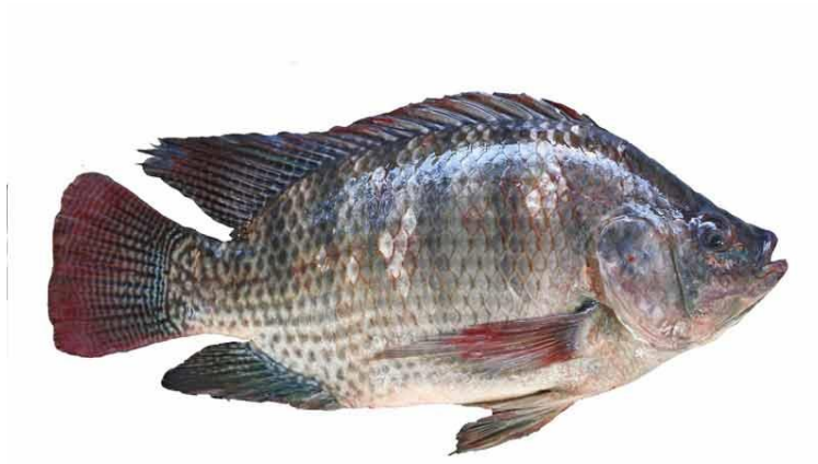
Slika 9. Tilapia ( Oreochromis niloticus )

(Izvor: https://www.morskeproduktty.cz/en/produkt/tilapie )