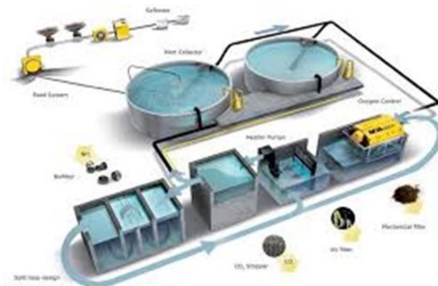
Slika 14. Shematski prikaz reciklacijskog akvakulturnog sustava

do tri tjedna. Tekućina iz bioreaktora se raspršuje po umjetnoj močvari. Umjetnu močvaru predstavlja bazen, u kojem su raspoređeni jednoliko slojevi krupnijeg šljunka po dnu, zatim sloj sitnijeg šljunka i sloj pijeska na površini. Na površini ostaje mehanički materijal dok se tekućina filtrira kroz slojeve pijeska i šljunka. Čvrsti materijal s površine sakuplja se svakih nekoliko mjeseci i koristi kao organsko gnojivo. Profiltrirana bistra tekućina bogata otopljenim nutrijentima i mineralima sakuplja se na dnu bazena i pumpa u staklenika za akvaponijsku proizvodnju povrća i vodenog bilja. Biljke koristeći nutrijente i minerale pročišćavaju vodu, koja se može sterilizirati i ponovo koristiti u uzgojnim bazenima ili kao otpadna voda zadovoljavajuće kvalitete ispustiti se u prirodne recipijente (Gavrilović i Dujaković, 2019.).