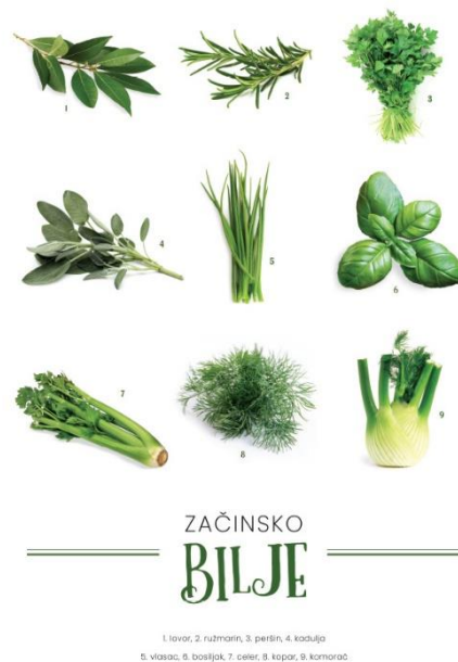
Slika 7. Vrste začinskog bilja koje se uzgaja u akvaponskom sustavu

Mnoge vrste povrća mogu se uzgajati u akvaponskim sustavima. Međutim, cilj je uzgajati povrće koje će ostvariti najveću razinu prihoda po jedinici površine u jedinici vremena. Prema ovom kriteriju, kulinarsko (začinsko) bilje je najbolji izbor. Takvo bilje raste vrlo brzo i imaju visoke tržišne cijene. Prihod od začinskog bilja kao što su: bosiljak, korijander, vlasac, peršin, povrtni tušanj i metvica puno je veći od prihoda od plodnih kultura kao što su: rajčice, krastavci, patlidžan.