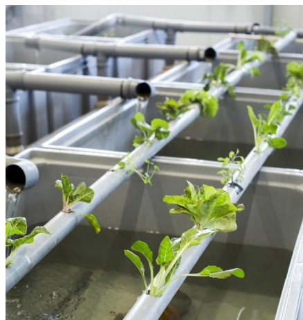
Slika 5. Primjer akvaponskog sustava