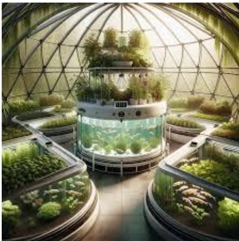
Slika 15. Vizija budućnosti akvaponskog ugoja