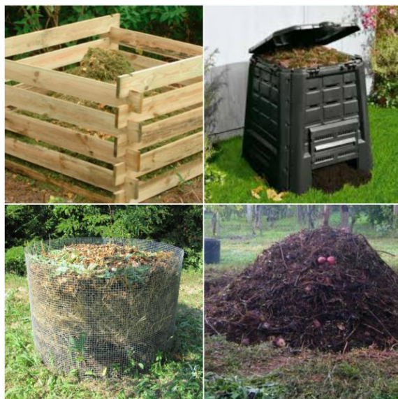
Slika 16. Komposter

Za većinu hrvatskih proizvođača ribe zbrinjavanje uginule ribe i ostalog ribljeg otpada predstavlja problem. Dostupni načini obrade su silaža, proizvodnja ribljeg brašna i ulja, bakterijska digestija i kompostiranje. Kompostiranje je efikasna metoda za ekološki čisto i ekonomično rješavanje krutog otpada a ribljih farmi i pogona peradi. Otpad se pomiješa s određenim postotkom biljnog materijala i povremeno miješa. Pri povišenoj temperaturi koja se stvara bakterijskom razgradnjom otpada i biljnog materijala stvara se mješavina organskih materijala i mikroorganizama koja predstavlja prirodno gnojivo za organsku proizvodnju biljaka. Proces je ekološki čist i značajno smanjuje onečišćenje tla i vode. Također, uništava patogene organizme i ličinke muha. Kompostiranje je živi proces jer 1 cm 3 materije sadrži bilijune živih mikroorganizama koji zauzimaju 50 % ukupnog kompostnog volumena. Sa ekonomske i ekološke strane gledišta dobiveni kompost se značajno razlikuje od umjetnik gnojiva. Umjetna gnojiva se proizvode kemijskim procesom od inertnih materijala kojima se biljke direktno hrane pa je taj proces štetan za tlo. Kompos donosi kompleksnu prirodnu biosinteziranu kombinaciju nugtrijenata i mikroorganizama koji djeluju simbiotički s biljkama. Kompostiranje je učinkovita i ekološka metoda čiji je konačni produkt mješavina organskih materijala i mikroorganizama, tj. prirodno organsko gnojivo.