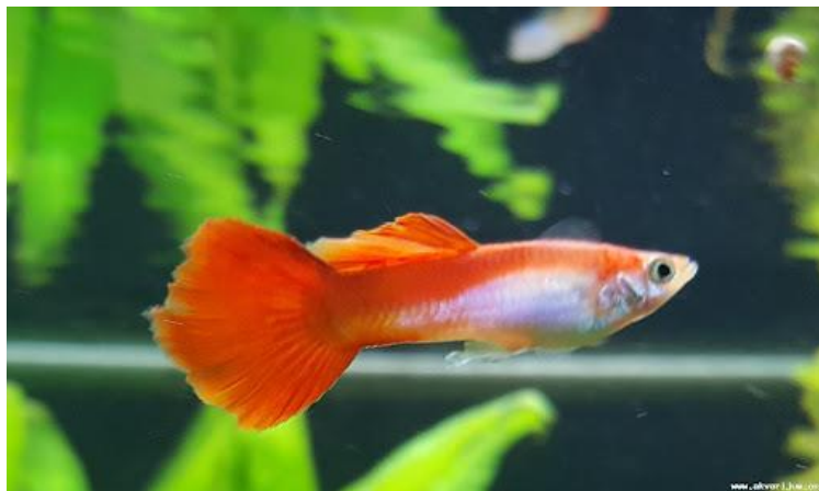
Slika 10. Gupi ( Poecilia reticulata )