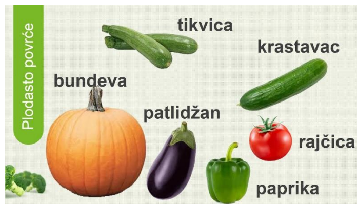
Slika 8. Vrste povrća koje se uzgaja u akvaponskom sustavu