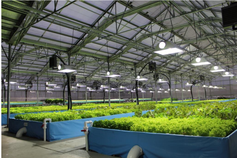
Slika 6. Primjer polukomercijalnog akvaponskog sustava

podstava i upotrebom najveće gustoće naseljenosti riba ili drugih vodenih životinja. Akvaponika velikih razmjera proizvodi uglavnom za neizravna tržišta poput trgovina mješovitim robom, restorana, institucija i veletrgovaca (Rakocy, 2012.).