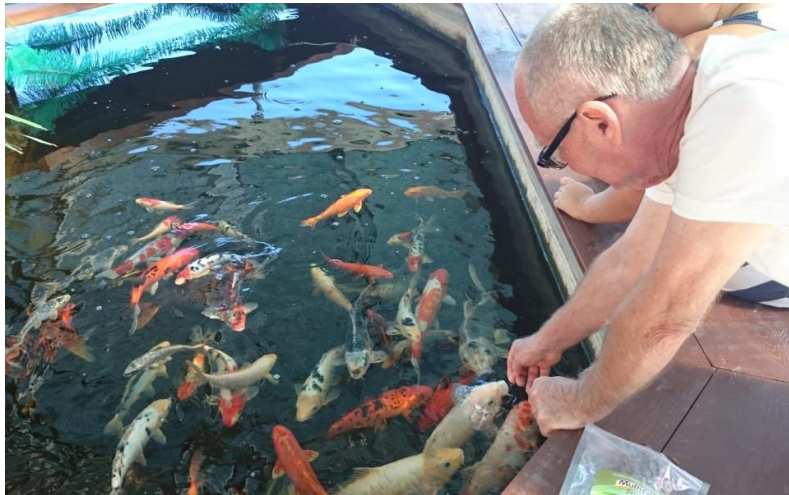
Slika 11. Koi šarani u akvaponskom uzgoju

piljevina, ali oni mogu značajno promijeniti sastav vode i stoga se ne preporučuju u suvremenoj akvaponici. Rasad sa formiranim korijenom se blago ukopava u supstrat, koji je konstantno vlažan od vode iz tankova, samim tim korjenovom sustavu su dostupne sve hranjive tvari. Biljke veoma brzo napreduju jer su im dostupne sve hranjive tvari iz vode.