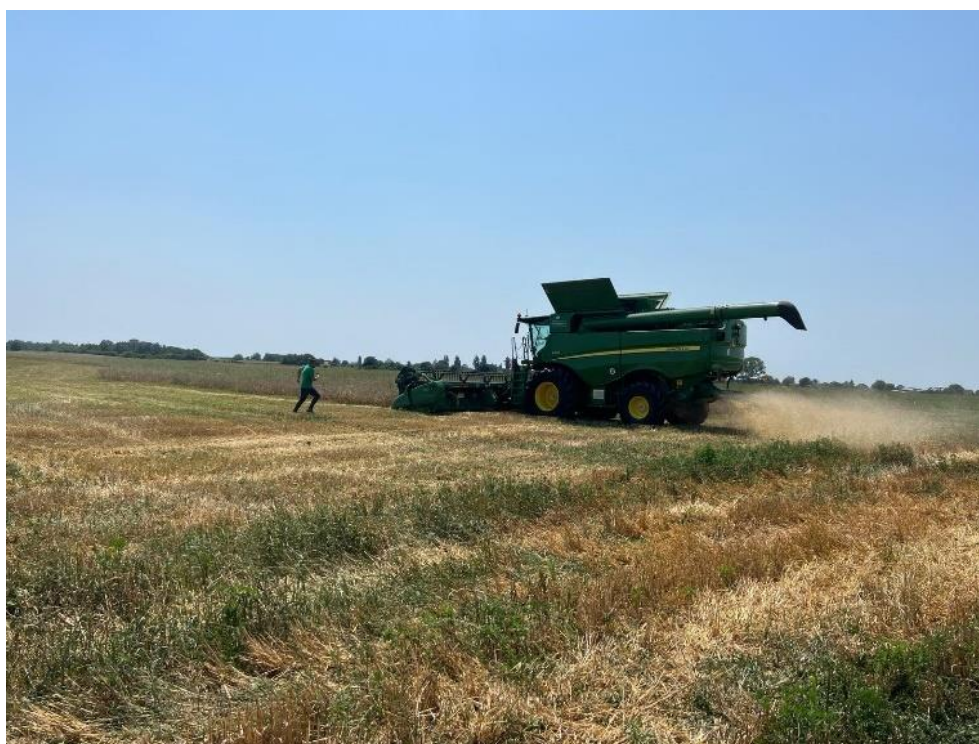
Slika 14. Žetva

Pregled parcela na kojima se pratila pojava bolesti obavlja se redovito svakih mjesec dana detaljnim pregledom usjeva. Svakim pregledom se utvrđuje pojava i intenzitet bolesti te pojava štetnika i pojava korova. Vegetacijska sezona 2022./2023. godine bila je kišovita. Velika količina oborina i jak vjetar početkom lipnja imali su za posljedicu polijeganje biljaka na dijelovima parcele pa se žetva (Slika 14.) na parceli na kojoj se nalazi Osječki Barun odradila vrlo rano u odnosu na prethodne godine.