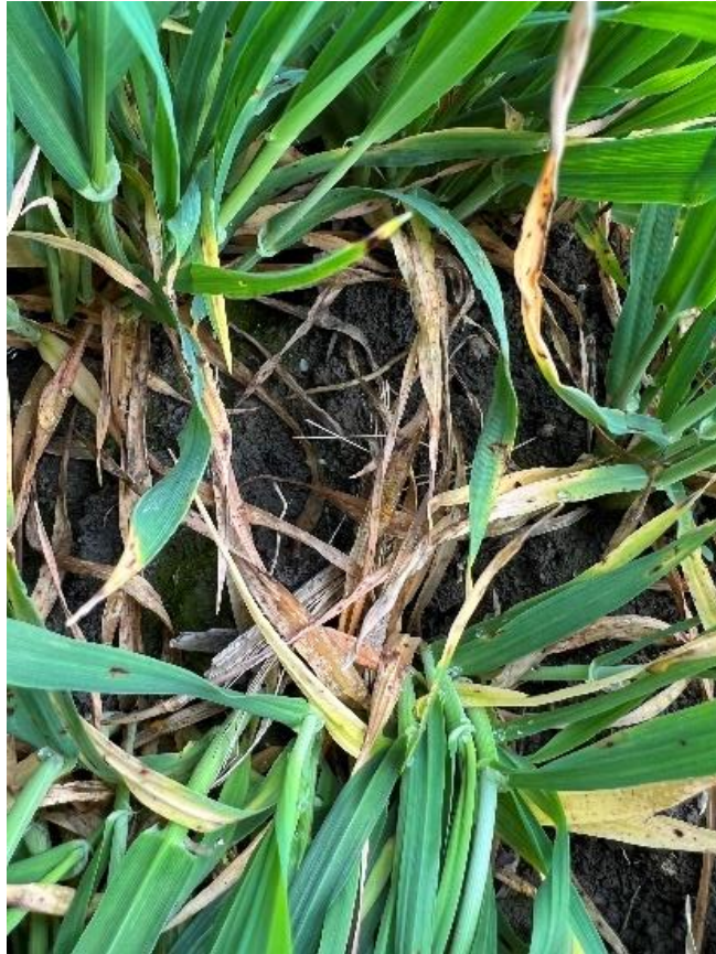
Slika 23. Propadanje listova od P. teres