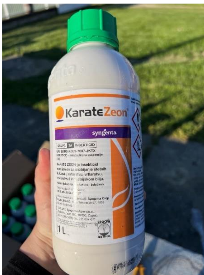
Slika 11. Karate Zeon

Karate Zeon, insekticid s kontaktnim djelovanjem korišten je za suzbijanje štetnih kukaca u ječmu. Insekticid (Slika 11.) je sredstvo koje je registrirano do 07. veljače 2029. godine i sadrži aktivnu tvar lambda-cihalotrin. Ova aktivna tvar u tijelu kukca ometa prijenos živčanih impulsa, a ulazi kroz kutikulu. Karate Zeon namijenjen je za suzbijanje Aphididae (lisne uši) i Oulema melanops (crveni žitni balac). Insekticid se koristi kada se primijeti pojava štetnika i to u dozi 1,5 ml na 100 m 2 . Primjena insekticida dozvoljena je dva puta u vegetaciji u razmaku od 14 dana. Karenca za ovaj insekticid je 30 dana.