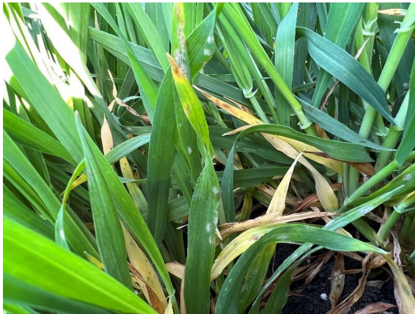
Slika 1. Blumeria graminis

Jedna od najznačajnijih mjera suzbijanja pepelnice su agrotehničke mjere. Odabir sorte, gnojidba, sklop sjetve mogu utjecati na razvoj bolesti. Sjetva otpornih sorata, smatra se jednim od najučinkovitijih mjera kojima se suzbija razvoj bolesti. Na velikim površinama i ukoliko ima potrebe koristi se kemijsko suzbijanje bolesti fungicidima. Bolest se ne može suzbiti preventivno, ali treba suzbijati kada se uoči zaraza 10 % zasijane površine (Cvjetković, 2003.).