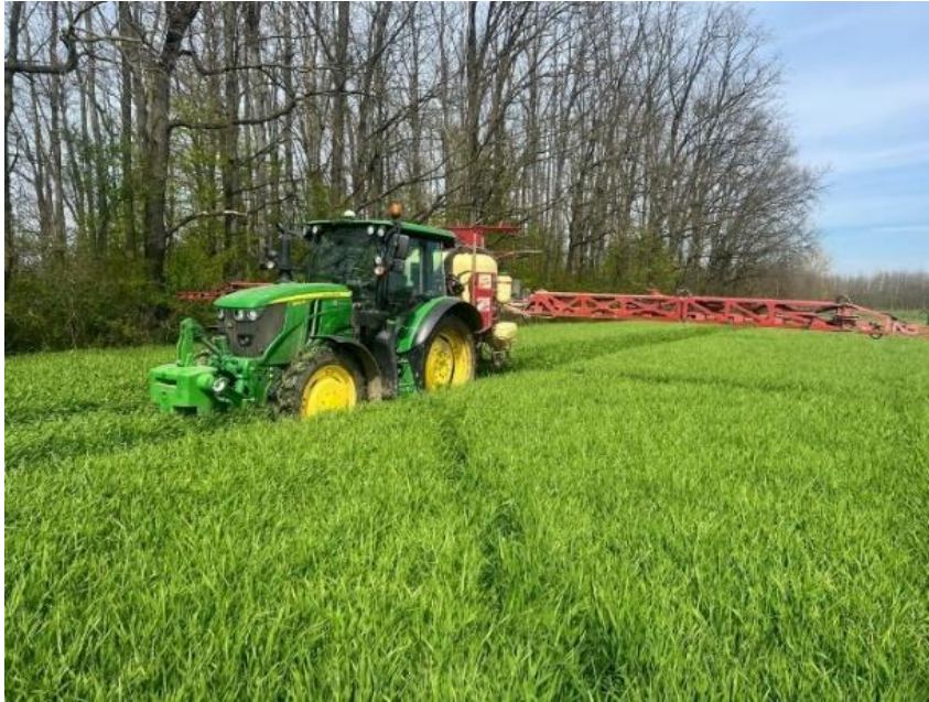
Slika 9. Zaštita