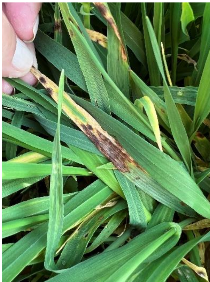
Slika 22. Pyrenophora teres

Simptomi P. teres na Osječkom Barunu su uočeni u vidu tamo smeđih pjega na listovima (Slika 22.), a uspoređujući sa sortom HYVIDO Doobilin P. teres se razvila na više biljaka na ovoj sorti. Također su simptomi kod Osječkog Baruna lakše uočeni jer su donji listovi kod biljaka poprimili posve žutu boju (Slika 23.).