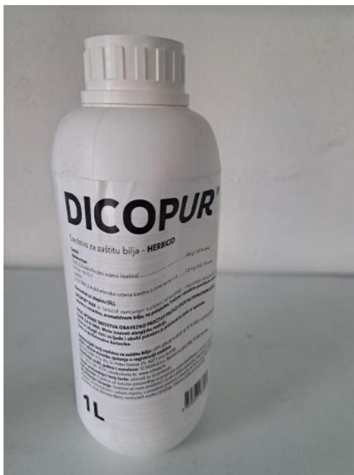
Slika 13. Dicopur Max

Za suzbijanje višegodišnjih širokolisnih korova koristi se Dicopur Max (Slika 13.). Herbicid je namijenjen za primjenu u ratarstvu, voćarstvu, poljoprivredi, za aromatično bilje, za livade i pašnjake. Sredstvo sadrži aktivnu tvar 2,4-D, a registrirano je do 31. prosinca 2031. godine. Sredstvo se primjenjuje od kraja busanja do razvoja drugog koljenca. Dozvoljena je jedna primjena u vegetacijskoj sezoni u količini 125 ml na 1000 m 2 uz utrošak vode 200 l/ha. Karenca je osigurana vremenom primjene.