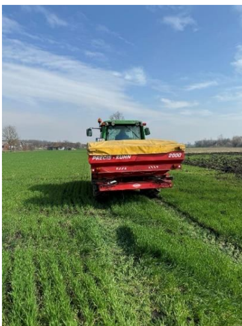
Slika 8. Prihrana

Na obje sorte obavljena je prihrana KAN-om 27 %. KAN je dušično gnojivo koje se koristi za prihranu u poljoprivrednoj proizvodnji. Sadrži dušik u amonijskom i nitratnom obliku, djeluje brzo i produženo. Prihrane su obavljene rasipačem Khun (Slika 8.), a prva prihrana obavljena je nakon zime 27. veljače 2023. godine. Temperature su nekoliko dana bile više od 10 °C, a biljka je bila u fazi busanja. Za prvu prihranu koristio se KAN 27 % u količini 100 kg/ha. Druga prihrana obavljena je 7. travnja 2023. godine, a biljka je tada prešla u fazu vlatanja. Treća prihrana nije obavljena. U procesu gnojidbe bitno je da biljka ravnomjerno iskorištava hraniva tijekom cijele vegetacije, a najveći učinak u gnojidbi ima dušik, a najmanji učinak daje kalij (Todorčić i sur., 1989.).