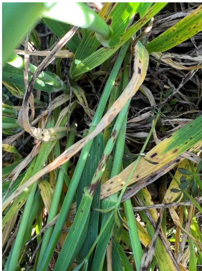
Slika 20. Pyrenophora teres na vlati