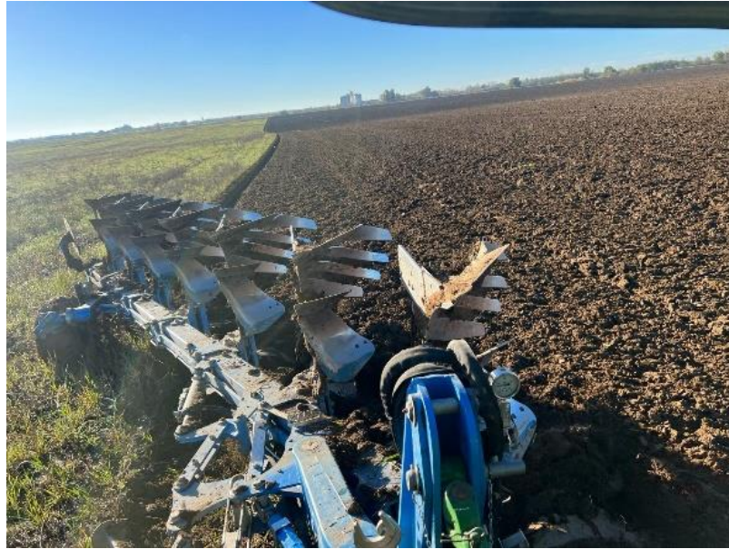
Slika 4. Oranje

Nakon oranja na dubini od 30 cm plugom Lemken, napravljena je dopunska obrada tla tanjuračem. Nakon kratke tanjurače, napravljen je prohod podrivačem kao što prikazuje Slika 5. i nakon podrivanja, ponovno tanjuranje kratkom tanjuračem (Slika 6.).