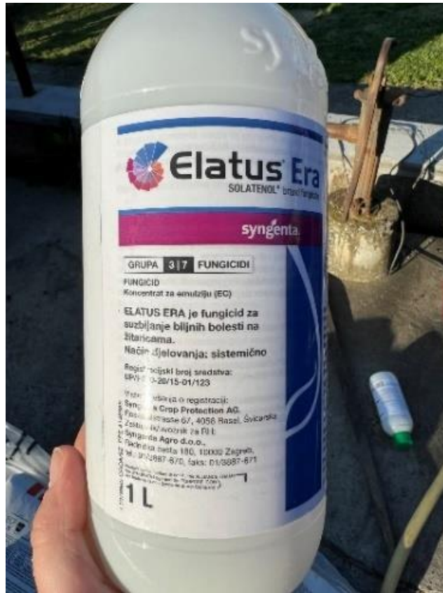
Slika 10. Elatus Era