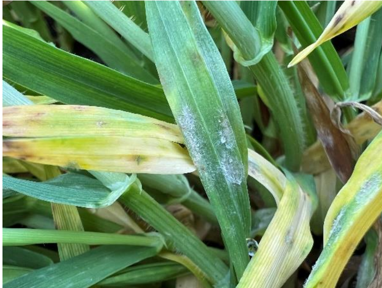
Slika 24. Blumeria graminis