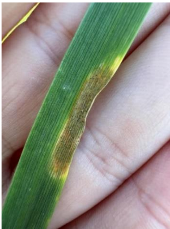
Slika 2. Pyrenophora teres