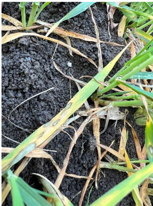
Slika 25. Rhynchosporium secalis

U sporadičnom do slabom intenzitetu, krajem veljače uočeni su simptomi Rhynchosporium secalis . Simptomi ove bolesti su svijetle pjege tamnog ruba na listovima kao što prikazuje Slika 25.