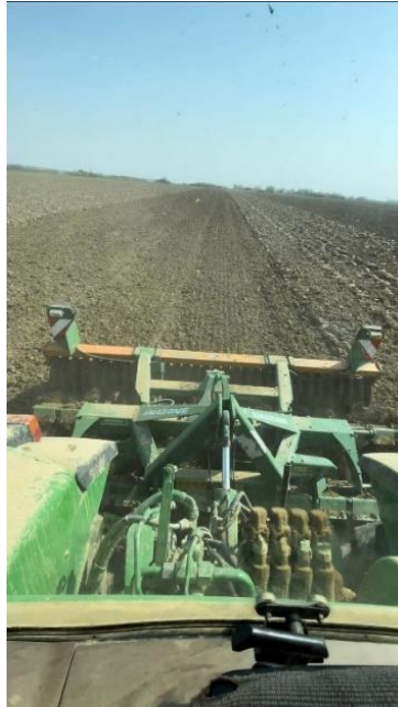
Slika 6. Kratka tanjurača

Sjetva obje sorte obavljena je u optimalnim rokovima za sjetvu ječma sijačicom Amazone (Slika 7.) na dubinu 5 cm i s razmakom redova 12,5 cm.