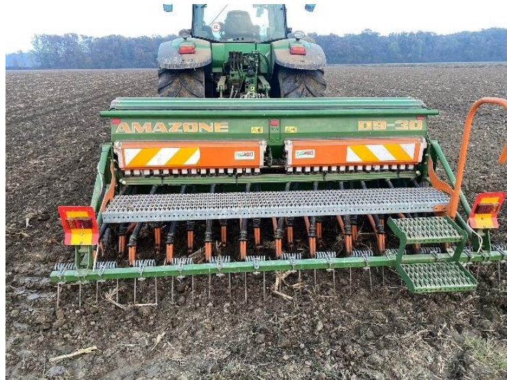
Slika 7. Sjetva

Sjetva obje sorte obavljena je u optimalnim rokovima za sjetvu ječma sijačicom Amazone (Slika 7.) na dubinu 5 cm i s razmakom redova 12,5 cm.