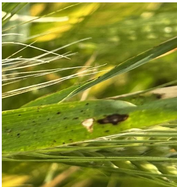
Slika 3. Rhynchosporium secalis