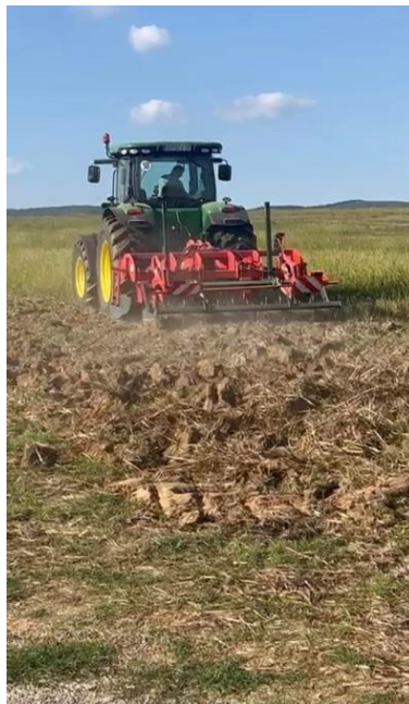
Slika 5. Podrivanje

Nakon oranja na dubini od 30 cm plugom Lemken, napravljena je dopunska obrada tla tanjuračem. Nakon kratke tanjurače, napravljen je prohod podrivačem kao što prikazuje Slika 5. i nakon podrivanja, ponovno tanjuranje kratkom tanjuračem (Slika 6.).