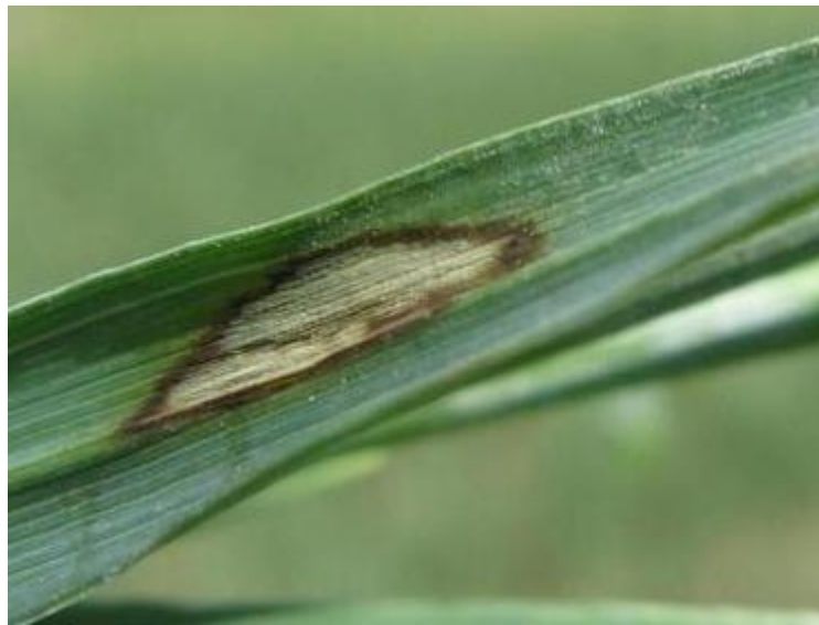
Slika 17. Rhynchosporium secalis

Na parceli gdje je zasijan HYVIDO Dooblin krajem veljače uočeni su simptomi sive pjegavosti. Simptomi bolesti prvo su se pojavili na listovima i rubovima pojedinih listova u obliku svijetlih mrlja. Bolest se nije javila u jakom intenzitetu, pojava je bila sporadična do slaba i njena pojava nije znatno utjecala na prinos. Na mjestima gdje je bio jak napad R. secalis došlo je do sušenja biljaka.