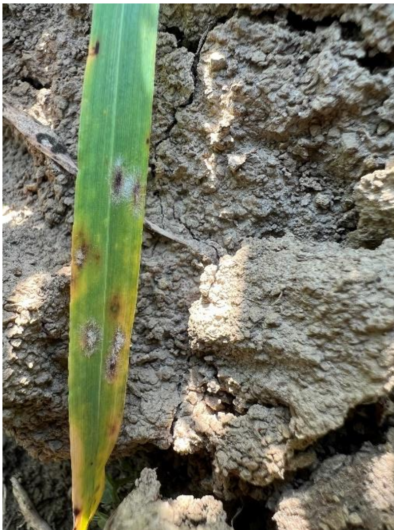
Slika 18. Blumeria graminis

U rano proljeće, krajem ožujka, na ječmu je uočena sporadična do slaba pojava pepelnice ( Blumeria graminis ). Visoka relativna vlaga zraka i temperature krajem ožujka pogodovale su razvoju bolesti. Simptomi pepelnice prvo su uočeni na donjim listovima u obliku brašnatih prevlaka (Slika 18.). Simptomi pepelnice su vrlo lako uočljivi, a zbog slabog intenziteta pojave nisu se odrazili na smanjenje prinosa.