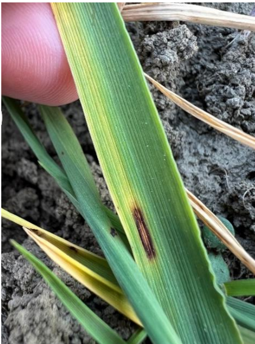
Slika 19. Pyrenophora teres

Blaga zima s visokom relativnom vlagom zraka pogodovala je razvoju gljive Pyrenophora teres . Početkom travnja prvi simptomi uočeni su na plojci listova (Slika 19.) u obliku izduženih i okruglih pjega tamno smeđe boje, nakon listova simptomi su uočeni i na vlati (Slika 20.). Razvoj bolesti je u sporadičnom do slabom intenzitetu.