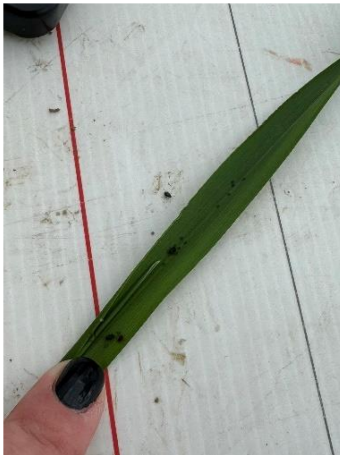
Slika 21. Aphididae i Oulema melanopus

tretman proveden je 15.ožujka 2023. godine, drugi tretman proveden je 01. travnja 2023. godine, a bio je potreban i treći tretman, pa je on obavljen 29. travnja 2023. godine.