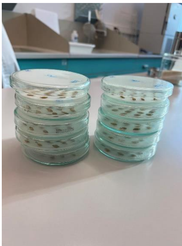
Slika 15. Uzorci u Petrijevim zdjelicama