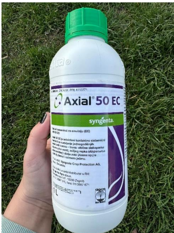
Slika 12. Axial 50 EC

Sistemični herbicid Axial 50 EC (Slika 12.), korišten je za suzbijanje jednogodišnjih uskolisnih korova. Herbicid je registriran do 31.12.2028. godine i sadrži aktivnu tvar pinoksadem. Herbicid se koristi za suzbijanje najzastupljenijih korovnih vrsta na našim područjima, kao što su Apera spica-venuti (obična slakoperka), Avena sp. (divlja zob) i Alopecurus myosuroides (mišji repak). Kada se biljka nalazi u fazi dva lista pa do pojave zastavice herbicid se primjenjuje u količini 0,6 do 0,8 ml/ha. Karenca je osigurana vremenom primjene.