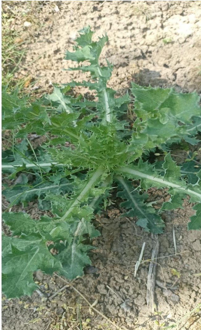
Slika 5. Poljski osjak ( C. arvense )

Poljski osjak ( C. arvense ) pripada rodu Cirsium i porodici glavočika. Višegodišnja je biljka, visine 30-150 cm (Slika 5.).