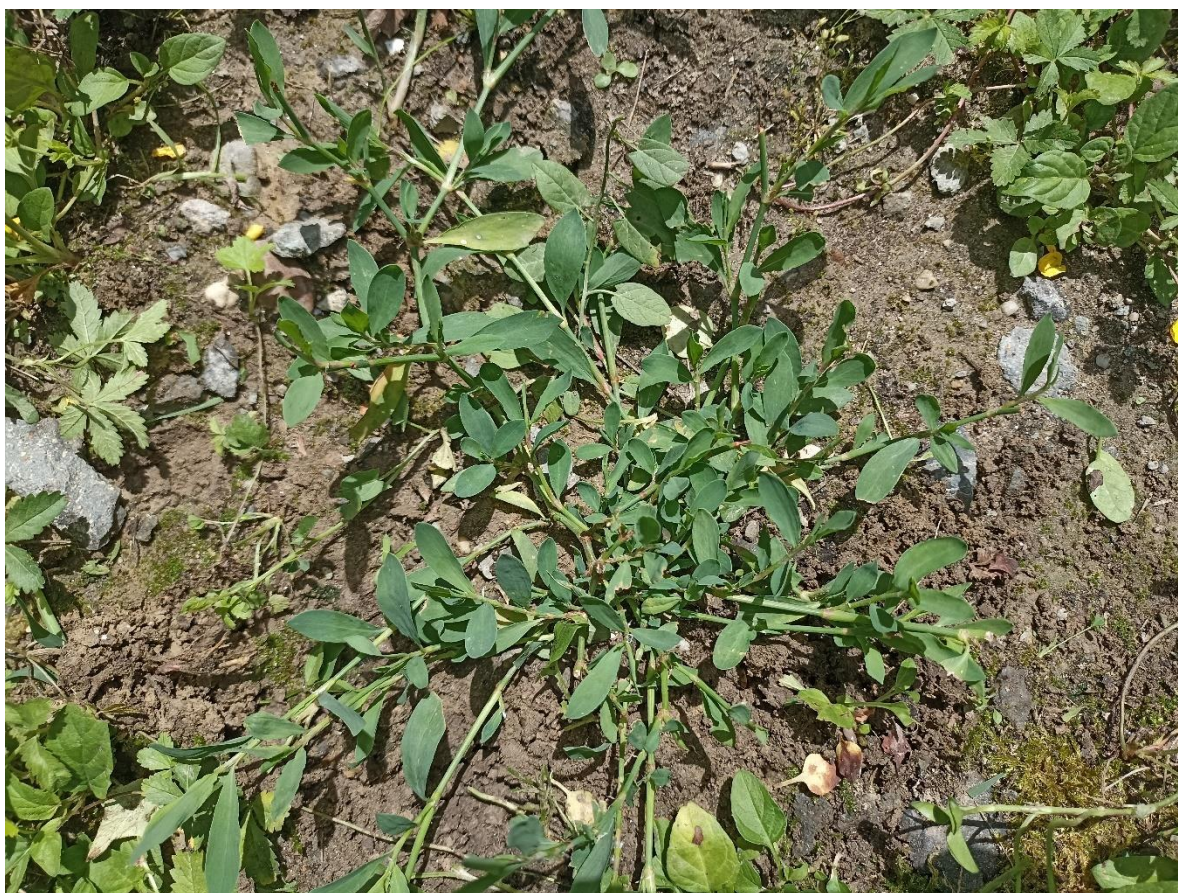
Slika 8. Ptičji dvornik ( P. aviculare )

Ptičji dvornik ( P. aviculare ) biljka iz roda Polygonum i porodice dvornici. Jednogodišnja biljna vrsta, visine 10-50 cm (Slika 8.).