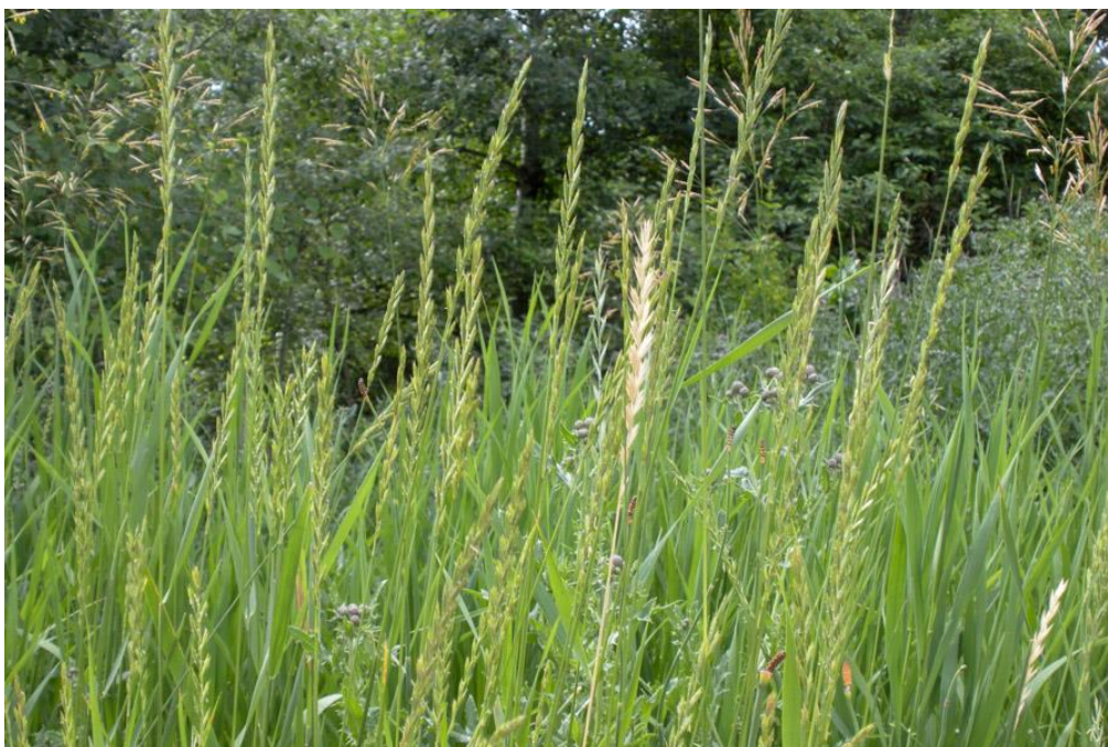
Slika 13. Puzava pirika ( E. repens )