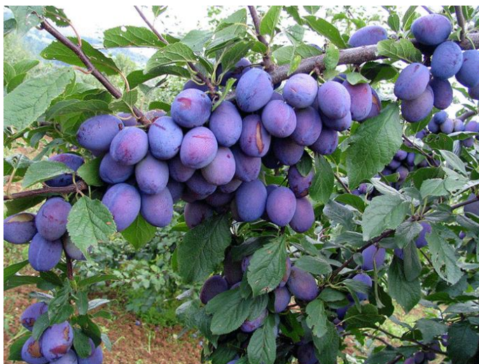
Slika 1. Šljiva sorte „Čačanka rodna“

Istraživanje je provedeno na proizvodnim površinama „Poljoprivrednog obrta Balić“ koji se nalazi u mjestu Ilača u Vukovarsko – srijemskoj županiji na području Republike Hrvatske. Obrt se bavi ratarskom proizvodnjom te u sklopu površina posjeduje i višegodišnje voćne nasade. Za analizu korovne zajednice određen je nasad šljive sorte „Čačanka rodna“ (Slika 1.) starosti osam godina.