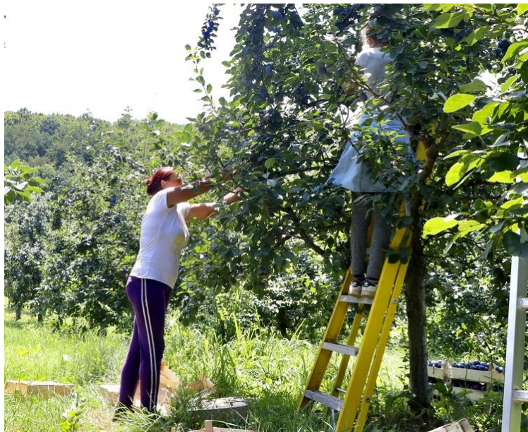
Slika 2. Berba šljiva

Berba šljiva za konzumaciju u svježem stanju obavlja se nešto prije potpune zrelosti i bere se ručno, s peteljkom, s tim da na kožici ostane neobrisana voštana prevlaka. Berba plodova (Slika 2.) za preradu obavlja se mehanizirano kada su plodovi u punoj zrelosti.