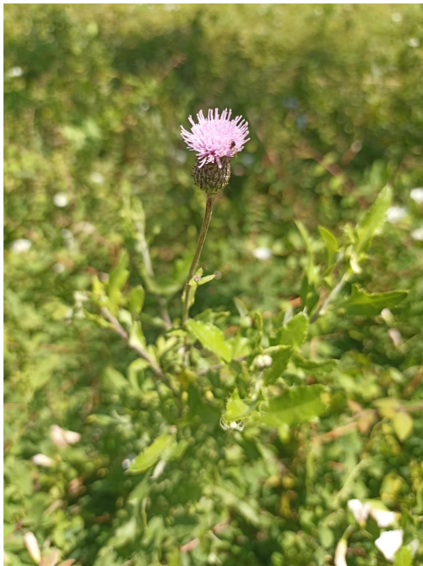
Slika 6. Poljski osjak u cvatu ( C. arvense )

Poljski osjak je korov u svim usjevima i višegodišnjim nasadima, livadama kao i na ruderalnim staništima. Rasprostranjen je u Europi i Aziji, a unesen je i u Sjevernu Ameriku. Stoka rado jede mlade biljke a ostarjele izbjegava zbog grubih i oštih bodlja. Ljekovita i medonosna biljka.