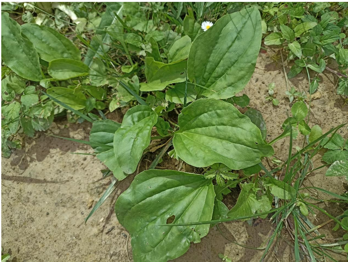
Slika 7. Trputac ( P. major )

Loša je krma i stoka ga nerado jede zbog kožastih listova. Sjemenke su dobra hrana za ptice. Sasvim mladi listovi mogu se koristiti kao povrće, sjemenke mogu biti izvor jestivog ulja. Medonsona i ljekovita svojstva su potvrđena kod biljke trputca (Knežević, 2006.).