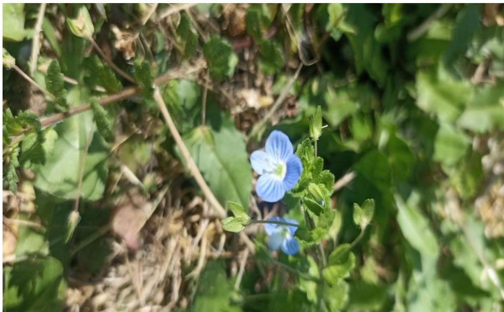
Slika 10. Perzijska čestoslavica ( V. persica )

Perzijska čestoslavica ( V. persica ) biljka je iz roda Veronica i porodice zijevalice. Jednogodišnja do dvogodišnja vrsta, visine od 15 – 40 cm (Slika 10.).