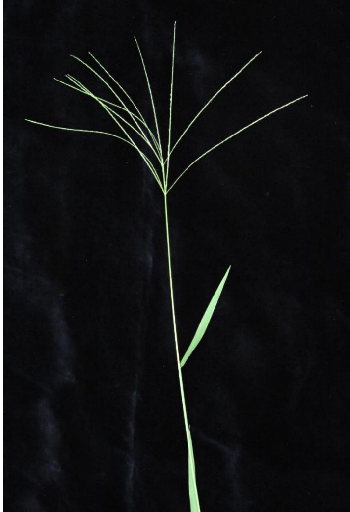
Slika 12. Cvat ljubičaste svračice ( D. sanguinalis )