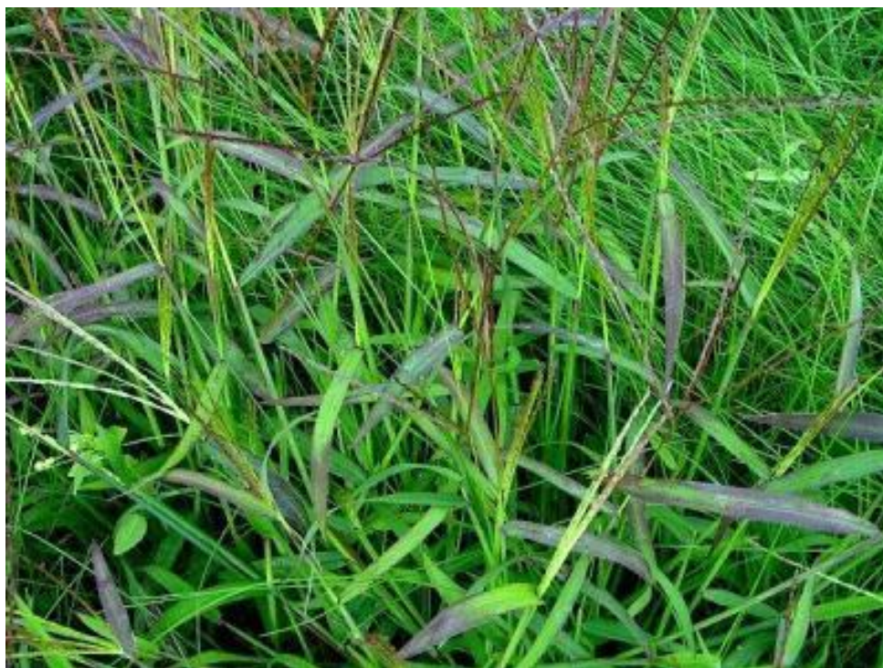
Slika 11. Cijela biljka ljubičaste svračice ( D. sanguinalis )

Predstavlja osrednju do lošu krmu. Antierozivna je biljka na pijescima.