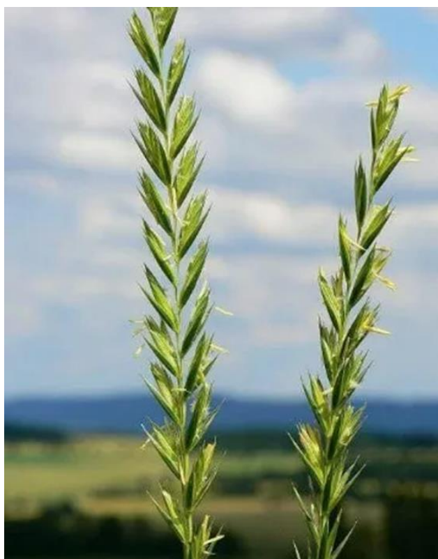
Slika 14. Klasić puzave pirike ( E. repens )