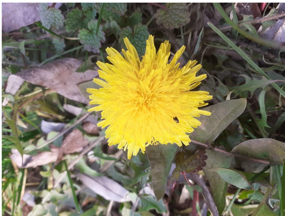
Slika 9. Ljekoviti maslačak (cvijet)

Ljekoviti maslačak ( T. officinale ) biljka koja pripada rodu Taraxacum i porodici glavočika. Višegodišnja biljna vrsta koja naraste 15 – 25 cm. Korijen je vretenast i skraćuje se na kraju vegetacijske sezone. Batvo je uspravno, šuplje i s bijelim mliječnim sokom. Listovi su prizemni, u rozeti, duguljasti, nazubljeni ili duboko perasto urezani. Glavice su široke 3-5 cm, pojedinačne s brojnim, žutim, jezičastim cvjetovima (Slika 9.). Ovoj je zelenkast ili crvenkast. Roška je malena, svijetla sa svilenkastom, bijelom kunadrom. Sjemenke su dugovječne. Biljka proizvede 3000-8000 roški.