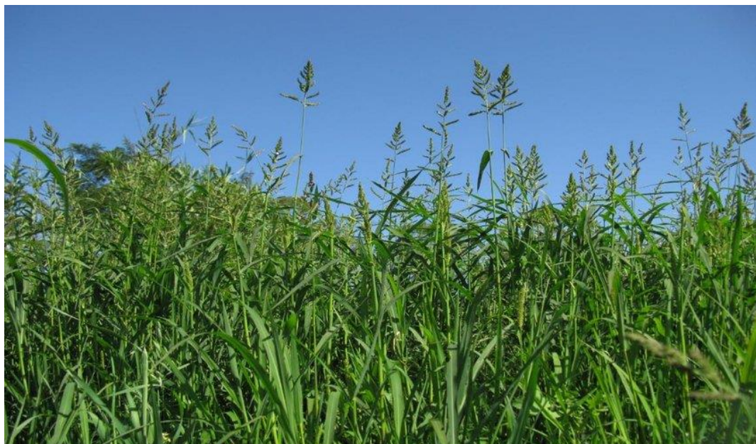
Slika 12. Obični koštan ( E. crus-galli )

Stoka rado jede mlade biljke koje su u svježem stanju dobra krma. Sjemenke su omiljena ptičja hrana (Knežević, 2006.)