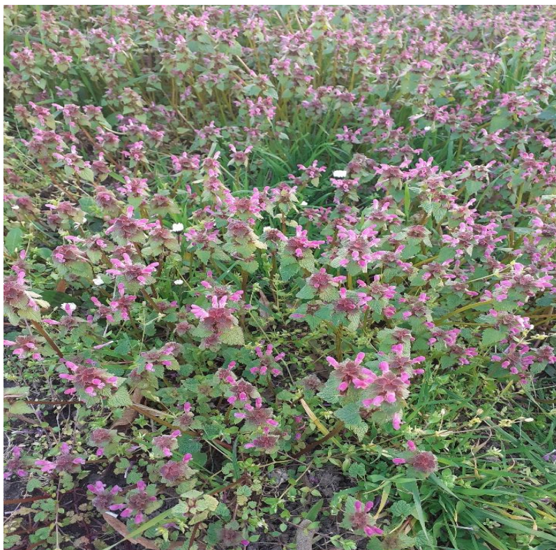
Slika 4. Grimizna mrtva kopriva ( L. purpureum )

Grimizna mrtva kopriva ( L. purpureum ) pripada rodu Lamium i porodici usnača (Slika 4.)