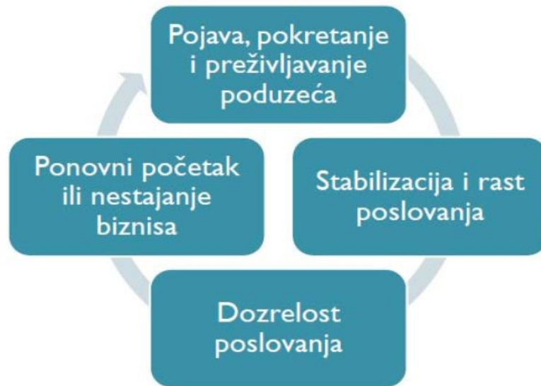
Slika 3. Shematski prikaz ciklusa generacijskog poduzetništva