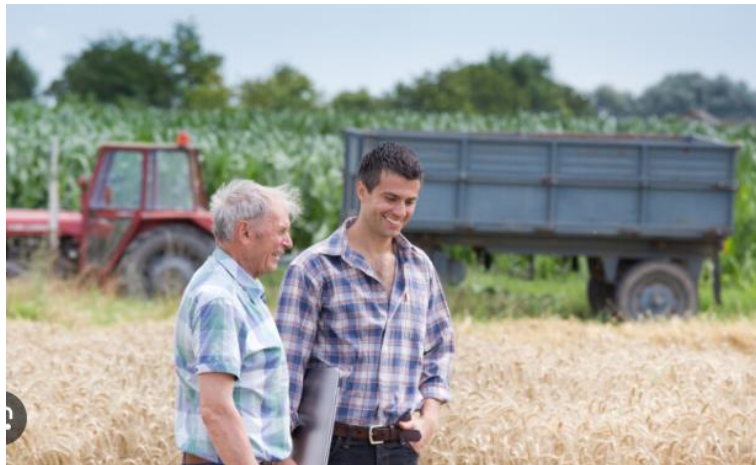
Slika 12. Primjer mentorstva “rame uz rame”

Zadržavanje mladih u ruralnim područjima ključno je za održivost generacijskog poduzetništva. Ključne strategije uključuju poboljšanje kvalitete života kroz infrastrukturu i javne usluge, osiguranje pristupa obrazovanju i stručnom osposobljavanju, pružanje financijske podrške i pristupa tržištima, te promicanje poduzetništva i inovacija (Van der Ploeg, 2000.). Diversifikacija aktivnosti, kao što je ruralni turizam, također može potaknuti mlade na ostanak u ruralnim sredinama (Sočo, 2018).