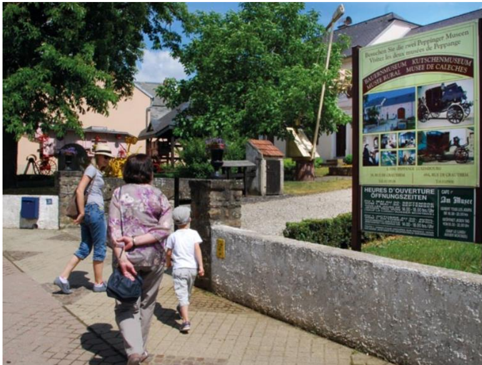
Slika 6. Primjer očuvanja tradicije i kulturne baštine