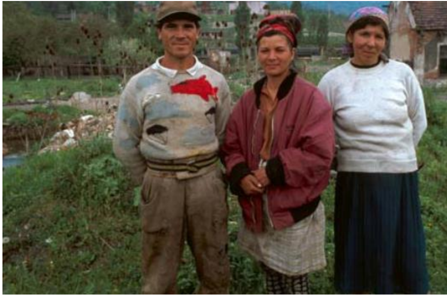
Slika 9. Nedostatak financija