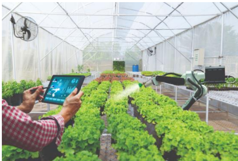
Slika 13. Primjena novih inovacija u poljoprivredi