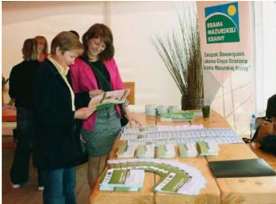
Slika 8. Prijenos znanja i edukacija