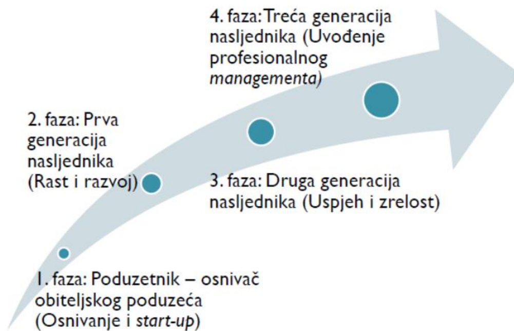
Slika 4. Ciklus generacijskog poduzeća

traženje novih izvora financiranja, što može dovesti do promjene vlasničke strukture, ili angažiranje profesionalnog menadžmenta. U ovoj fazi često dolazi do gubitka karakteristika obiteljskog poduzeća i smanjenja obiteljske kontrole.