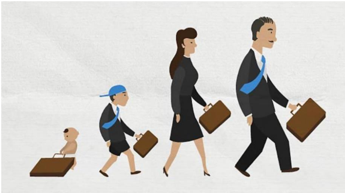
Slika 2. Obiteljsko poduzeće

olakšica i povoljnijih zajmova, jer svako novo obiteljsko poduzetništvo pozitivno utječe na zajednicu i pomaže u rješavanju ekonomskih problema. Zajedništvo obitelji i razvoj pojedinačnih osobina članova, poput odgovornosti i radnih navika, također su značajne prednosti. Psihološko zadovoljstvo postignućima i samozadovoljstvo koje dolazi iz osobne odlučnosti za postizanje zajedničkih ciljeva dodatno jačaju obiteljski posao (Kružić i Bulog, 2012.).