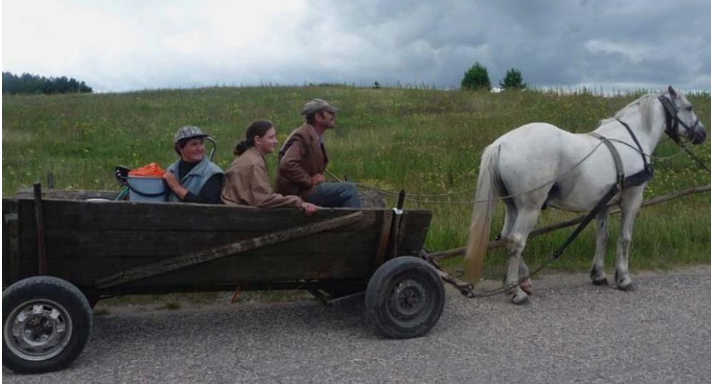
Slika 10. Nedostatak mlade snage