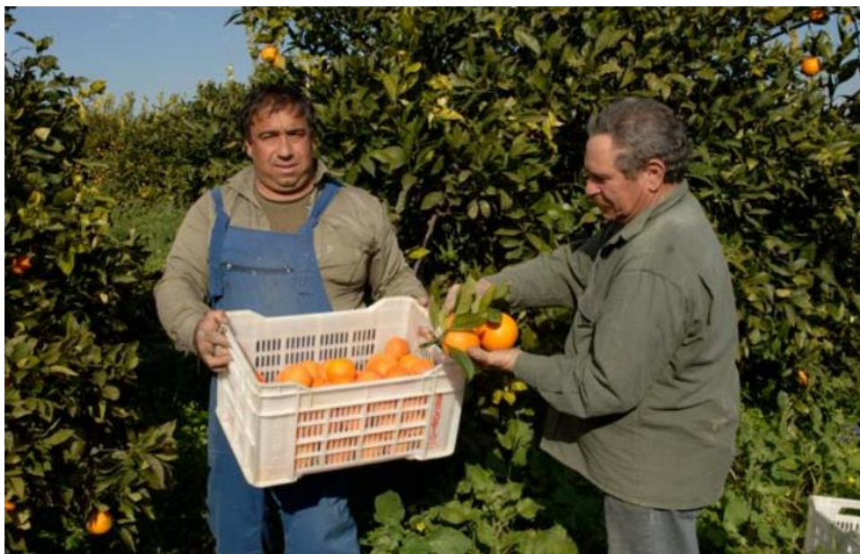
Slika 7. Održavanje socijalne kohezije i zajedništva