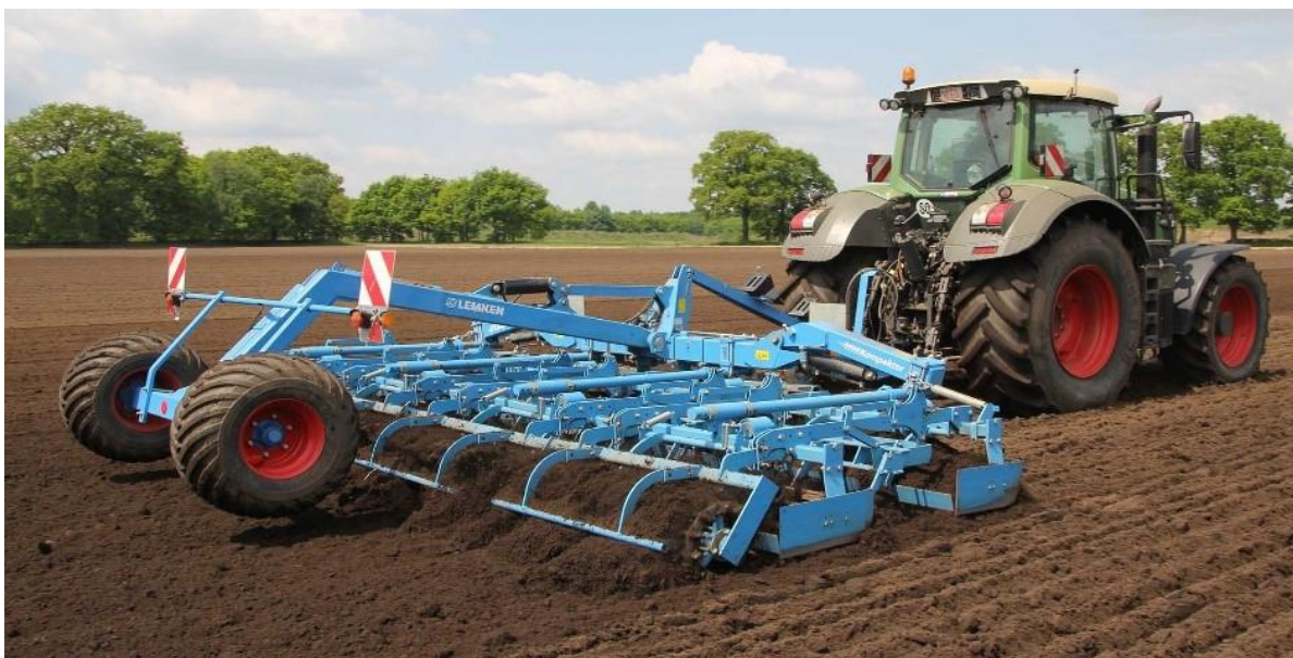
Slika 9. Predsjetvena priprema tla, stvaranje rastresitog sloja

Nakon prve predsjetvene obrade tla apliciralo se predsjetveno urea gnojivo u količini 100 kg/ha i NPK 2030 u količini 350 kg/ha.