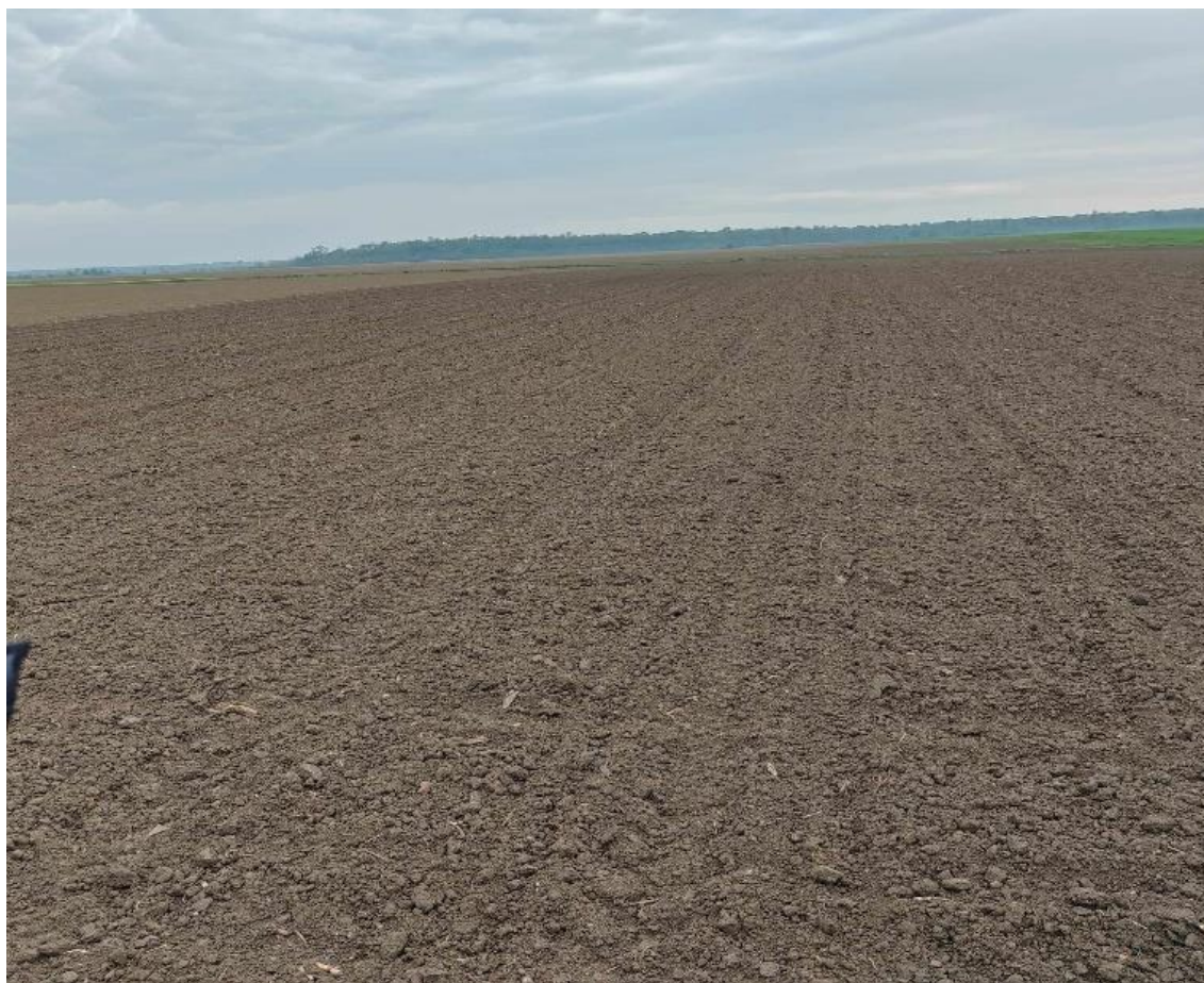
Slika 10. Oranica nakon sjetve

Nakon predsjetvene pripreme 22.04.2023 je bila sjetva (slika 10) suncokreta.