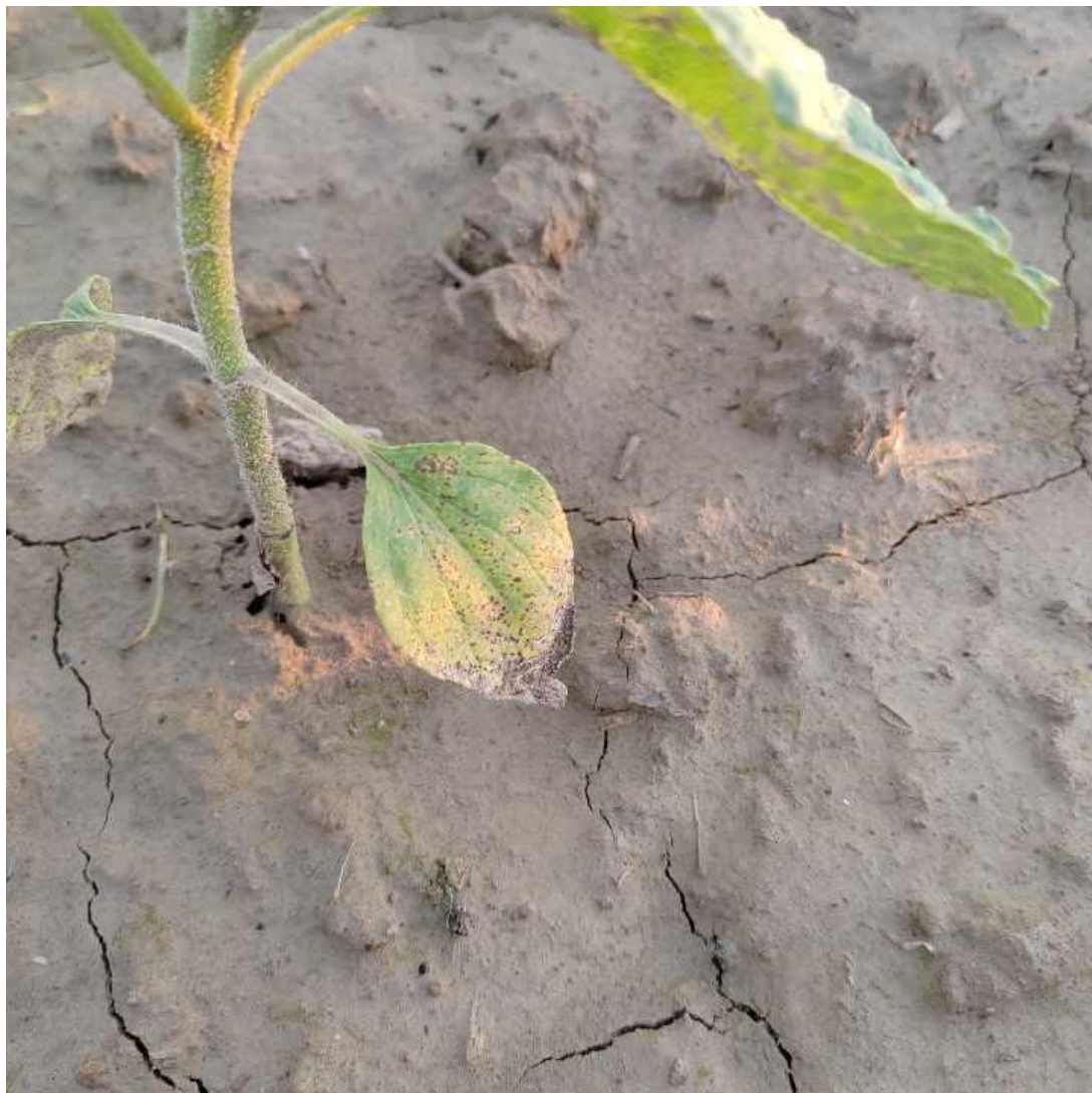
Slika 12. Pojava Septoria helianthi tijekom lipnja

bile 49,7 mm , tijekom srpnja 112.1 mm (tablica 1), a srednja mjesečna temperatura zraka 23,8 °C, no zbog nedostatka vode tijekom vegetacije one se nisu javile u jačem intenzitetu.