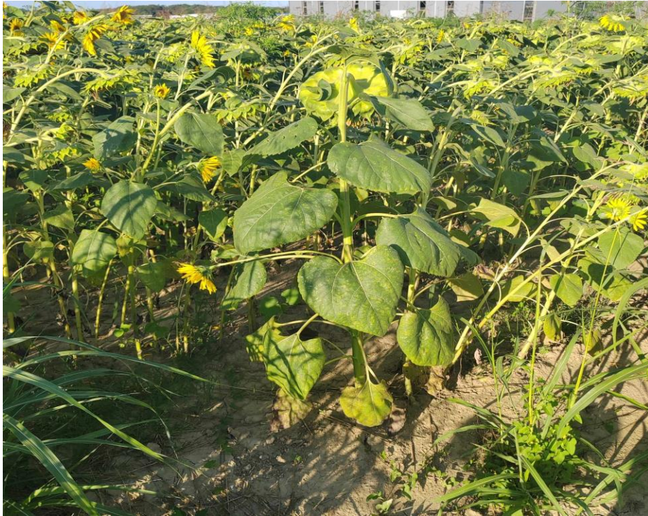
Slika 14. Zakorovljenost suncokreta