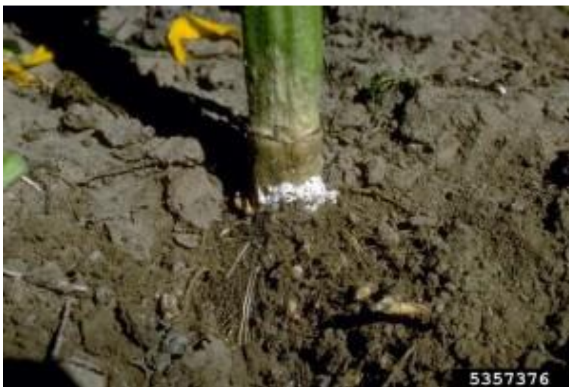
Slika 2. Bijela trulež

Postoje četiri tipa bolesti bijele truleži suncokreta a to su: truljenje sjemena i propadanje mladih biljčica, korijenski tip koji je prikazan na slici 2 i venjenje biljaka, truljenje srednjeg dijela stabljike i truljenje glave.