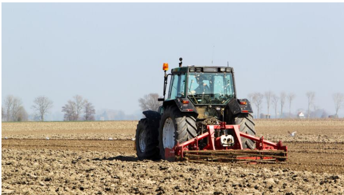
Slika 8. Zatvaranje zimske brazde