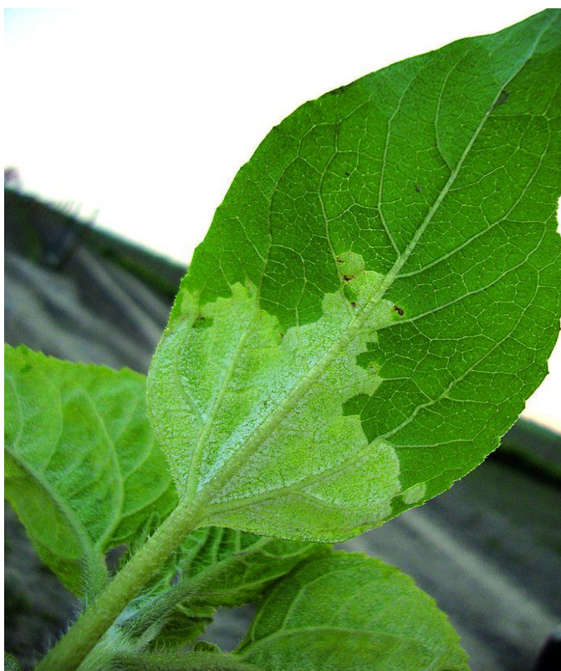
Slika 4. Plamenjača suncokreta

Biljna bolest koja u Hrvatskoj pričinjava manje štete, ali se bolest javlja kontinuirano iz godine u godinu. Više oborina tijekom proljeća ima za posljedicu pojačane zaraze. Najveće štete pričinjava sistemična zaraza biljke koja se manifestira u patuljastom rastu biljaka (zaražene biljke su visine 40-60 cm), zadebljanoj stabljici i biljkama koje ne daju sjeme ili je ono šturo. Karakteristični simptomi plamenjače su kao što je vidljivo na slici 4 guste bijele prevlake na naličju lista, s druge strane lista na licu, vidi se promjena boje, list postaje svijetlo zelen.