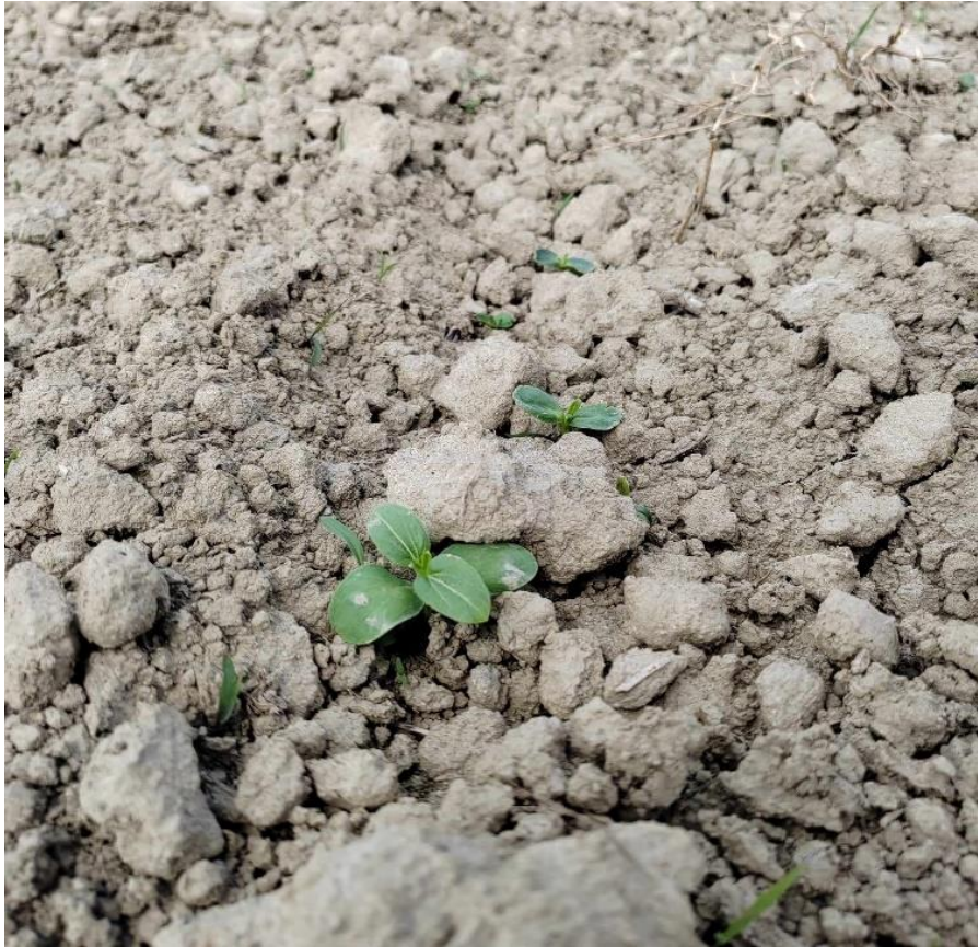
Slika 11. Nicanje korova odmah uz suncokret

Za hibrid suncokreta izabran je NK Neoma clearfield. Clearfield tehnologija proizvodnje suncokreta predstavlja kombinaciju visoko prinostnih hibrida tolerantnih na aktivnu tvar imazamoks (IMI tolerantni hibridi). Broj biljaka iznosi 60 000 biljaka/ha, razmak u redu prilikom sjetve je bio 25 cm, a između redova je 70cm.