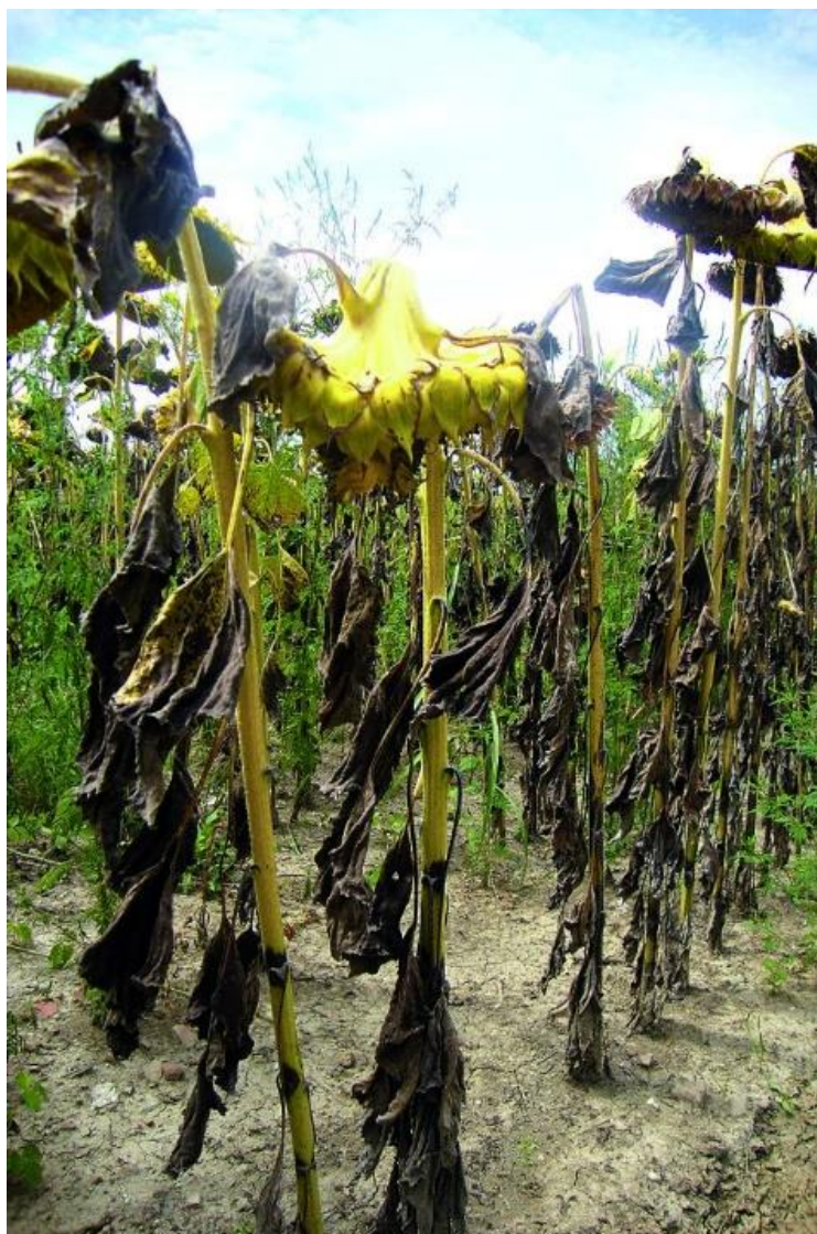
Slika 5. Listovi suncokreta osušeni od koncentrične pjegavosti