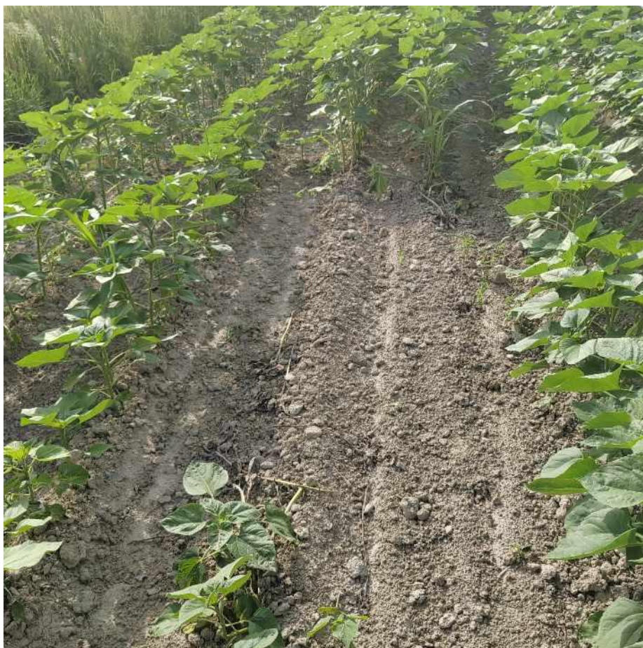
Slika 13. Nastale plješine radi neravnog terena i ležanja vode

Uz sve navedeno primijećen je neujednačen rast suncokreta pogotovo uz plješine i uz rubne dijelove oranice te jaka zakorovljenost (slika 14).