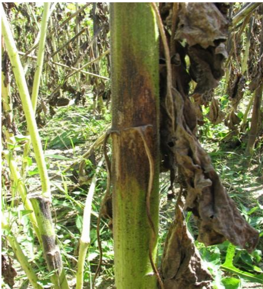
Slika 3. Siva pjegavost