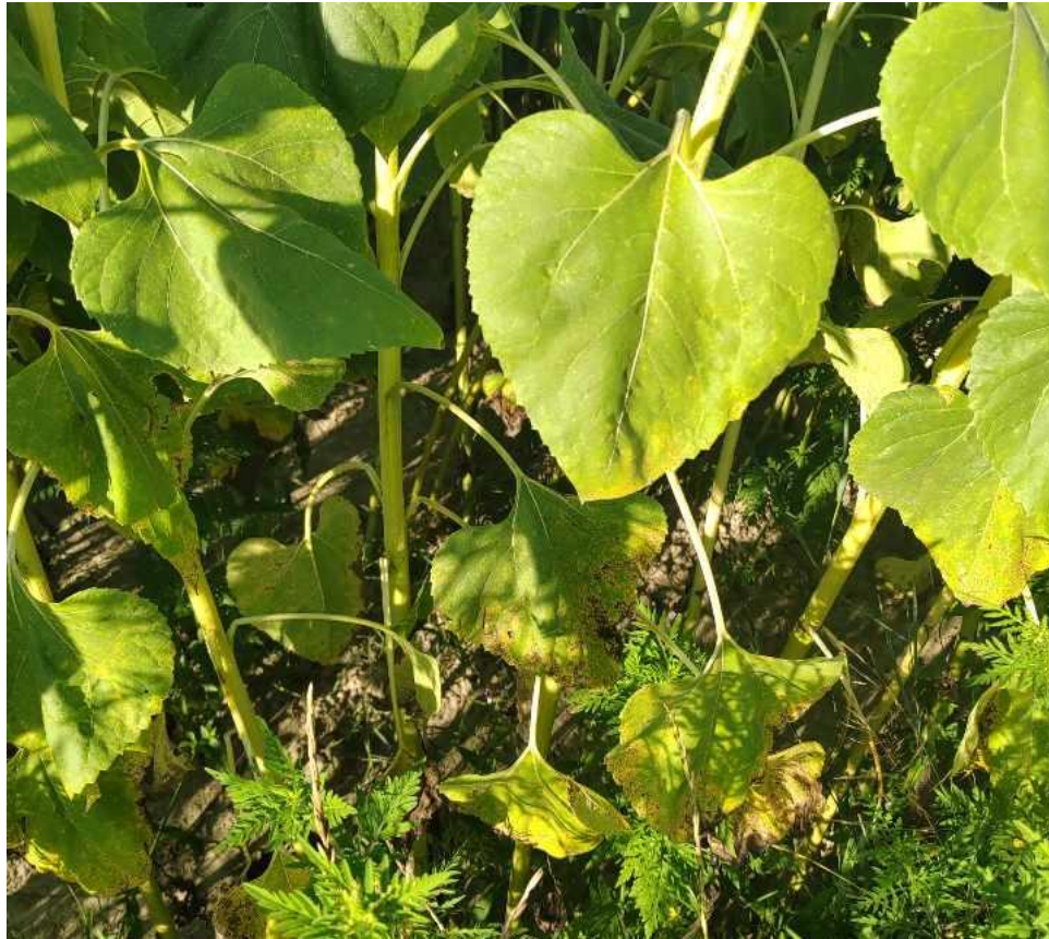
Slika 7. Pojava Septoria helianthi i Alternaria helianthi u slabom intenzitetu