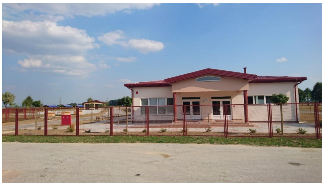
Slika 4. Poljoprivredno poduzetnički inkubator Drenovci

Poljoprivrednicima i prerađivačima poljoprivrednih proizvoda u Općini Drenovci, od 2016. godine potporu daje Poljoprivredno poduzetnički inkubator Drenovci. Inkubator nudi poduzetnicima najam proizvodnih kapaciteta za preradu voća i povrća i proizvodnju tijesta i kolača te različitu opremu po povoljnim cijenama te savjetodavne i edukacijske usluge (slika 4).