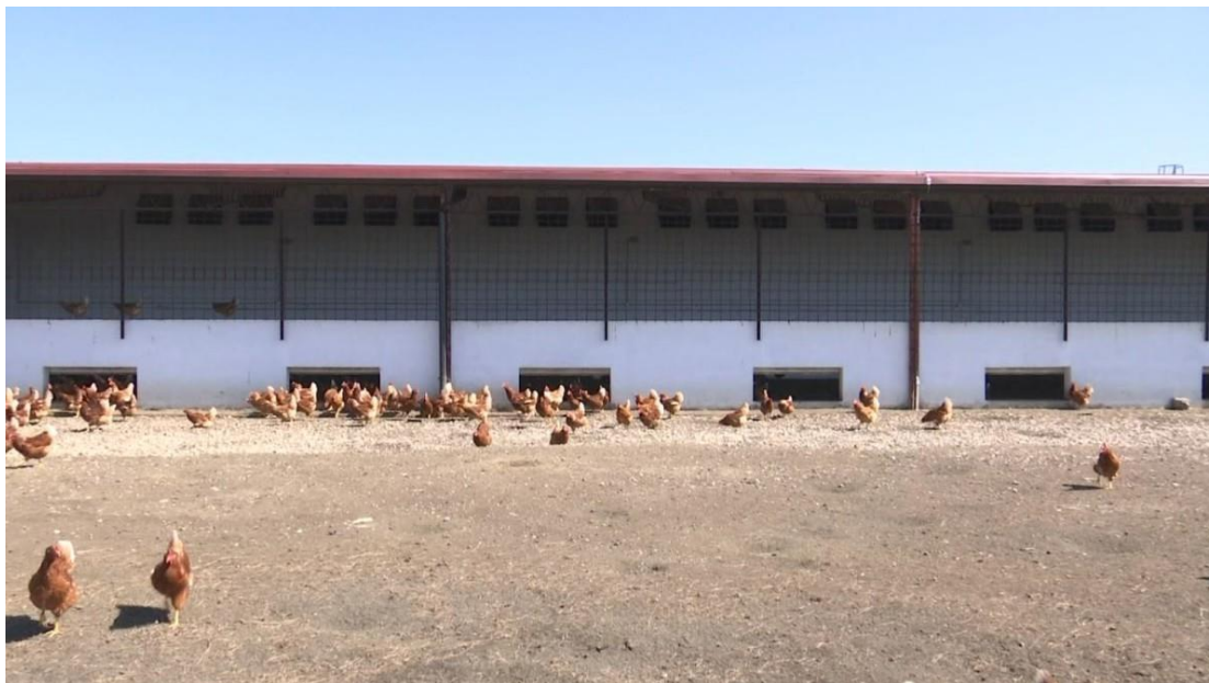
Slika 2. Farma koka nesilica u Soljanima

osnivači se navodi Vukovarsko-srijemska županija, Fakultet agrobiotehničkih znanosti Osijek, pet općina (Cerna, Vrbanja, Stari Jankovci, Lovas, Drenovci) i Poljoprivredna zadruga „Vinkovačka šparoga“. Cilj osnivanja usmjeren je na učinkovitije osnaživanje i poticanje cjelokupnog poljoprivredno-prehrambenog sektora Vukovarsko-srijemske županije, a posebno malih obiteljskih poljoprivrednih gospodarstava ( www.agro-klaster.hr ). Agroklaster je napuštenu zgradu u Soljanima prenamjenio u farmu za slobodni uzgoj nesilica gdje je zaposleno lokalno stanovništvo (slika 2).