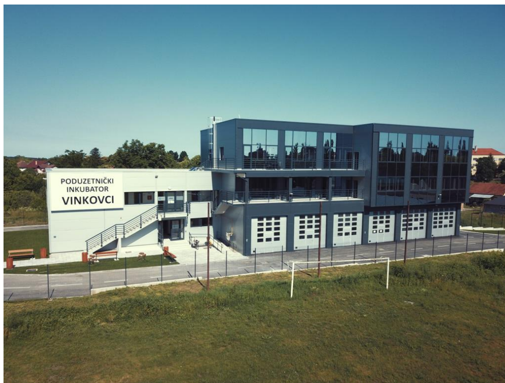
Slika 1. Poduzetnički inkubator Vinkovci

Tehnološki park Vinkovci provodi Eu projekte. Jedan od projekata koji se provodio 2020-2021. bio je „Poduzetničko informiranje i umrežavanje“. Ovim projektom omogućen je lakši pristup informacijama o znanjima, vještinama i visokokvalitetnim uslugama poduzetnicima u svim stupnjevima razvoja, što doprinosi jačanju poduzetničkih potpornih institucija koje imaju odgovornu ulogu u stvaranju povoljnog okruženja za rast i razvoj poduzetništva u Vukovarsko srijemskoj županiji. Ovim se projektom nastojalo potaknuti mala i srednja poduzeća s područja Grada Vinkovaca i županije da bolje koriste usluge Poduzetničkog inkubatora koje su važan čimbenik za povećanje poduzetničke aktivnosti, poput informiranja o mjerama, savjetovanja, mentoriranja, potpore za pristup financijama, pristupa poduzetničkoj infrastrukturi i drugo (tp-vk.hr)