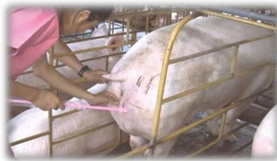
Slika 6. Umjetno osjemenjivanje

Za osjemenjivanje plotkinja potrebno je 100 ml sperme s jednom do tri milijarde aktivnih spermija. Ejakulat se aplicira intrauterino, uz pomoć katetera i aplikatora. Kateter se prethodno ovlaži razrjeđivačem ili vazelinom i pažljivo uvede preko vagine i cerviksa do tijela maternice pri čemu se aplicira sjeme (Senčić i sur., 2021.).