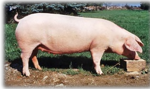
Slika 1. Njemački landras

9 do 11 prasadi po leglu, a tovljenici postižu 100 kg u dobi od 6 mjeseci. Koristi se većinom u daljnjem križanju s drugim pasminama, kako bi popravila mesnatost potomaka. Meso je visoke kvalitete iako se učestalo pojavljuje BMV, odnosno blijedo, mekano, vodnjikavo meso. Postoje dva tipa ove pasmine; duži tip koji ima veću plodnost i izražene šunke, te kraći tip koji ima nešto manju plodnosti, ali vrlo razvijene šunke i plećke. Jedna je od najčešćih pasmina u svinjogojskoj proizvodnji republike Hrvatske.