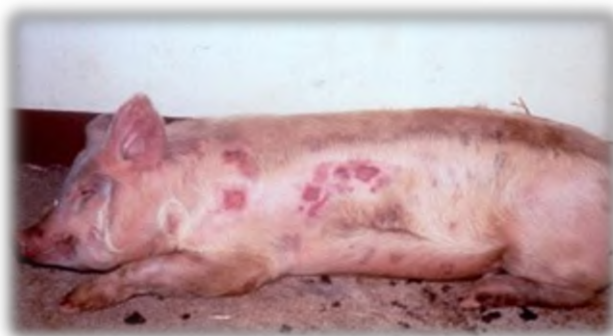
Slika 10. Vrbanac

Vrbanac još poznat kao crveni vjetar je zarazna bolest koja se može prenijeti i na čovjeka (Slika 10). Bolest se odlikuje pojavljivanjem crvenih mrlja na ušima i dijelovima tijela popraćenim visokom temperaturom.