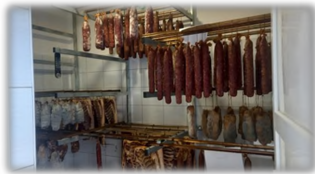
Slika 9. Zriona na OPG-u Pilaš

Napravljeni proizvodi se prvo stavljaju u pušnicu na mjesec dana gdje se meso dimi 4 puta radi postizanja arome, ali i konzervacije ovitka. Nakon dimljenja meso odlazi na sušenje u zrionu gdje će ostati 5 mjeseci (Slika 9.). U zrioni paze na vrlo bitne uvjete za pravilno sušenje, vlaga zraka je 60 – 75% i temperatura iznosi 12°C, pa i prozračnost koja se ostvaruje svakodnevnom ventilacijom. Gotovi trajni proizvodi se nakon sušenja vakumiraju i skladište u hladnjači, potom se koriste za vlastite potrebe ili za prodaju na kućnom pragu.