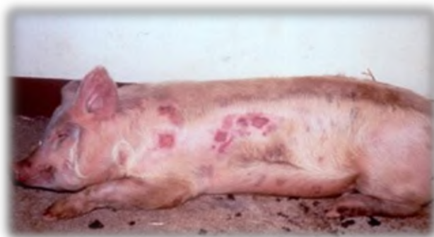
Slika 10. Vrbanac

Vrbanac još poznat kao crveni vjetar je zarazna bolest koja se može prenijeti i na čovjeka (Slika 10). Bolest se odlikuje pojavljivanjem crvenih mrlja na ušima i dijelovima tijela popraćenim visokom temperaturom.