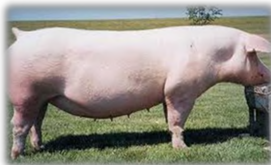
Slika 2. Svinja pasmine švedski landras

Švedski landras je pasmina koja je rezultat križanja domaće švedske svinje i Velikog jorkšir (slika 2). Plodnost je visoka, od 10 do 12 prasadi po leglu, a tovljenici 100 kg žive mjere postižu za oko 6 mjeseci.