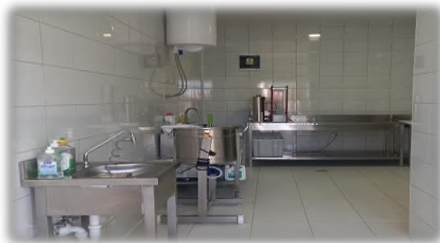
Slika 8. Prostorija za preradu mesa

Od ukupne količine svinja u uzgoju, u preradu mesa se stavlja 10 do 15%, dok se ostalih 85 do 90% svinja prodaje. Odabrane svinje se prema propisima odvoze u obližnju klaonicu na klanje i obradu u svinjske polovice, gdje se iste važu i stavljaju na hlađenje. Sama obrada mesa i pravljenje suhomesnatih proizvoda se obavlja na gospodarstvu (Slika 8).