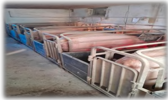
Slika 7. Prasilište

sur., 2007). Proces prasnja je vrlo osjetljiv i zahtjeva posebne uvjete. Na OPG Pilaš, nazimice i krmače koje su bređe 107 do 110 dana se premještaju u posebne boksove prasilišta (Slika 7). Prasilište mora imati zadovoljene uvjete za bređe nazimice i krmače kao i za novu prasad. Boksovi imaju pregrade koje sprječavaju velike kretnje plotkinja, ali u isto vrijeme prasad će imati slobodu kretanja u cijelom boksu. Boksova ima 8 koji su veličine 4 m 2 u sveukupnih 32 m 2 kolike je površine cijelo prasilište i u svakome je osigurana hrana i voda. Osnovni zahtjevi koji se postavljaju pri organizaciji proizvodnje svinja, uvjetovani su njihovim biološkim karakteristikama, a posljedično tome i osiguravanju određenih paragenetskih uvjeta za proizvodnju (Kralik i sur., 2007.). Prasilišta se na gospodarstvu temeljito peru i dezinficiraju prije nego se popune boksovi. Temperatura se unutar objekta kreće od 16 do 20°C (idealna za krmače), ali za prasad je potrebno osigurati značajno višu temperaturu (30 do 34°C), na način da se u boksove postavljaju grijalice na mjestu namijenjenom za prasad. Tek rođena prasad nema razvije termoregulacijski sustav pa dolazi do značajnog gubljenja tjelesne topline nakon prasnja. U trenutku prasnja, tjelesna temperatura prasadi iznosi 39,5°C, a zatim unutar 20 minuta poslije poroda naglo pada (za 2 pa čak i do 5°C). U nedovoljno zagrijanom objektu može doći do nepovoljnog učinka na zdravlje prasadi (Kralik i sur., 2007.)