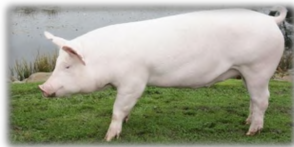
Slika 3. Svinja pasmine veliki jorkšir

Pasmina je nastala u Engleskoj grofoviji Yorkshire, gdje je poznatija kao Large White, odnosno velika bijela svinja (slika 3). Nastala je križanjem malog jorkšira i domaće engleske svinje, a prvi puta izložena 1851. godine u Engleskoj. Danas je ova pasmina selekcijom dovedena do jedne od najkvalitetnijih pasmina za proizvodnju mesa u intenzivnoj proizvodnji. Dobro je plodnosti, pa tako daje od 9 do 12 i više prasadi po leglu, također je vrlo otporna pasmina. Tovljenici 100 kg žive mjere postižu sa 6 do 7 mjeseci. Karakteristike ove pasmine su slijedeće: srednje velika glava utegnutog profila, njuška je kratka i široka, uši su dosta velike i stoje uspravno, vrat je dosta dug i širok, a trup je dug, širok i dubok. Izražene su plečke i butovi koje su većinom mišićno tkivo. Ranozrela je pasmina s visokom kvalitetom mesa i dobrim iskorištavanjem hrane (3-3,5 kg/kg prirasta). Zbog svojih karakteristika i genotipa ova pasmina je služila za križanje ili uzgoj u čistoj krvi kroz cijelu Englesku, a potom i u velikom dijelu svijeta gdje se koristila za oplemenjivanje domaćih pasmina svinja. Univerzalna je pasmina za proizvodnju prasadi i mesa, snažne je konstitucije te je pogodna za razne namjene u uzgojnom i proizvodnom smislu ( Senčić i sur., 2021.).