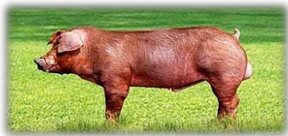
Slika 4. Nerast pasmine američki durok

stari tip je bio izrazito krupniji od onoga koji se trenutno uzgaja, noviji tip je srednje veličine s vrlo dobro razvijenim mesnatim dijelovima tijela (slika 4). Glava je teža, a uši male i polu oborene, čvrste je konstitucije s krupnim kostima. Dlaka je glatka, sjajna i ravna, a boja mu je crveno-smeđa (svjetlija i tamnija). Krmača oprasi 8-12 prasadi po leglu, a poznate su kao pasmina s dobrim majčinskim osobnostima. Tovljenici dobro iskorištavaju hranu i imaju vrlo dobar prirast.