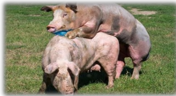
Slika 5. Prirodni pripust

ukoliko zbog velikog broja svinja to nije moguće, oplodnja se obavlja umjetnim osjemenjivanjem. Dobri ishodi osjemenjivanja mogu se dobiti samo pri optimalnom vremenu osjemenjivanja. Vremenski gledano, sami pripust traje vrlo kratko, prirodno osjemenjivanje (skokom nerasta) traje oko 10 minuta, a umjetno osjemenjivanje traje oko 5 minuta. U oba slučaja osjemenjivanja bi bilo dobro i poželjno od prvih znakova estrusa ponoviti proces nakon nekoliko sati, odnosno 12 sati nakon prvog pripusta, kako bi se osiguralo da je svinja zaista ostala bređa.