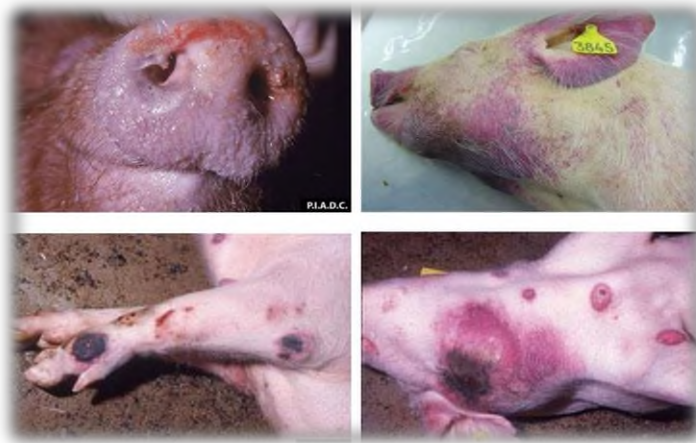
Slika 11. Afrička svinjska kuga

usmrčiti, zdrave svinje se također usmrćuju ako su bile u mogućem kontaktu, ali ne pokazuju znakove bolesti. Usmrćivanje zdravih svinja se provodi kako bi se bolest spriječila ili barem usporila u širenju. Svinje koje obole od ASK prolaze kroz iznimno jake bolove i patnju, pa se na taj način usmrćivanje životinja smatra kao skraćivanje muka. Svinje se eutanaziraju na gospodarstvima na kojima se pojavila bolest, ali i na onima koja nisu mogla zadovoljiti biosigurnosne mjere (iz preventivnih razloga), najčešće su to bila gospodarstva kategorije „1“ i „2“. Nakon eutanazije svinja na neregistriranim gospodarstvima, postoji zabrana držanja svinja u trajanju od najmanje 12 mjeseci. Gospodarstvo Pilaš je u jednu ruku imalo sreće jer se afrička svinjska kuga nije počela drastično širiti Požeško-slavonskom županijom, pa su tako svinje na OPG-u ostale sigurne, a proizvodnja je tekla uspješno.