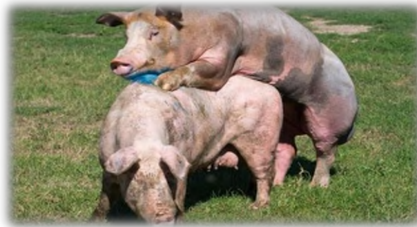
Slika 5. Prirodni pripust

ukoliko zbog velikog broja svinja to nije moguće, oplodnja se obavlja umjetnim osjemenjivanjem. Dobri ishodi osjemenjivanja mogu se dobiti samo pri optimalnom vremenu osjemenjivanja. Vremenski gledano, sami pripust traje vrlo kratko, prirodno osjemenjivanje (skokom nerasta) traje oko 10 minuta, a umjetno osjemenjivanje traje oko 5 minuta. U oba slučaja osjemenjivanja bi bilo dobro i poželjno od prvih znakova estrusa ponoviti proces nakon nekoliko sati, odnosno 12 sati nakon prvog pripusta, kako bi se osiguralo da je svinja zaista ostala bređa.