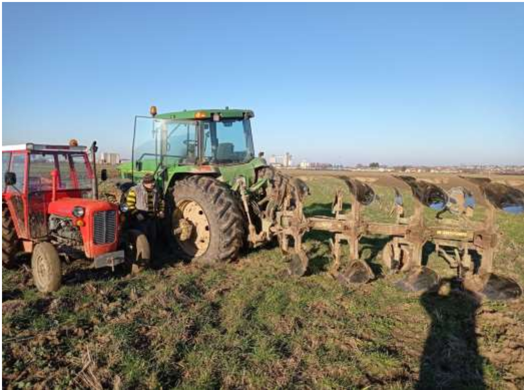
Slika 2. Priprema zemljišta